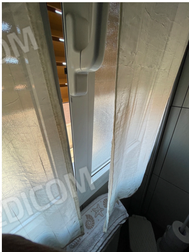
PARTICOLARE INFISSI ESTERNI