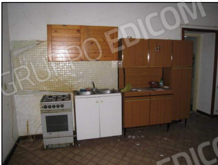
FOTO 11 PIANO TERRA PORZIONE DI ABITAZIONE U.I. MAPPALE 1458 SUB. 1 VISTA DEL SOFFITTO A VOLTA DEL LOCALE. SOGGIORNO/ANGOLO COTTURA.

FOTO 10 PIANO TERRA PORZIONE DI ABITAZIONE U.I. MAPPALE 1458 SUB. 1 ALTRA VISTA RIPRESA NEL LOCALE SOGGIORNO/ANGOLO COTTURA.