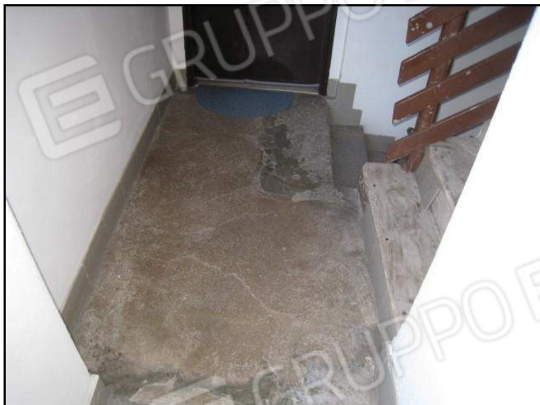
FOTO 30 PIANO PRIMO VISTA SCALA COMUNE DI COLLEGAMENTO CON IL PIANO SOTTOTETTO.

FOTO 29 VISTA RIPRESA VERSO PIANEROTTOLO SCALA COMUNE.