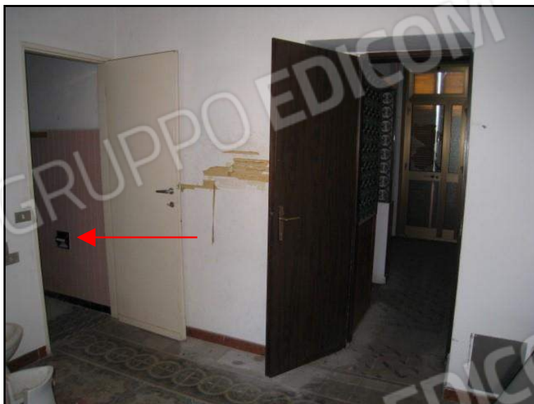
FOTO 23 PIANO PRIMO PORZIONE DI ABITAZIONE U.I. MAPPALE 1458 SUB. 1 VISTA RIPRESA NEL BAGNO.

Con la freccia rossa è indicato l'ingresso al bagno.