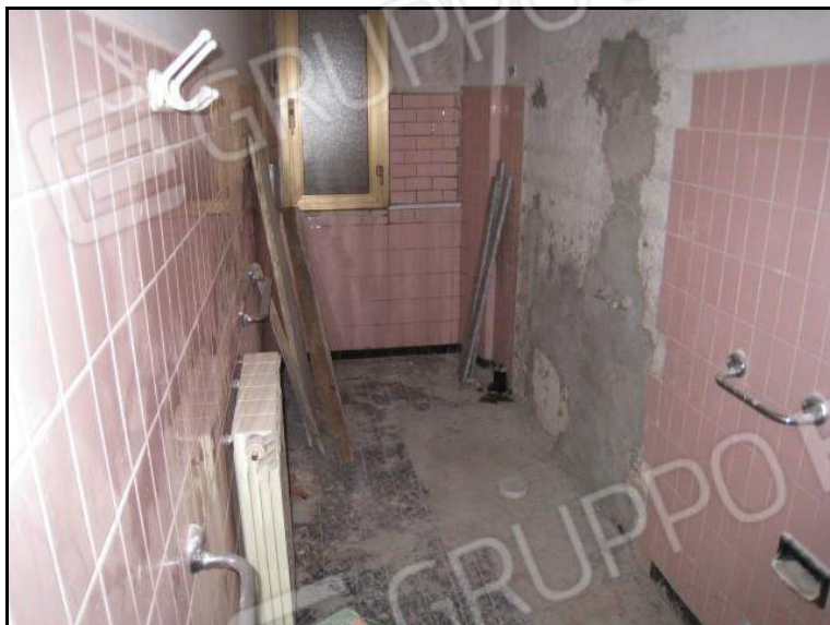
FOTO 24 PIANO PRIMO PORZIONE DI ABITAZIONE U.I. MAPPALE 1458 SUB. 1 ALTRA VISTA RIPRESA NEL BAGNO.

FOTO 23 PIANO PRIMO PORZIONE DI ABITAZIONE U.I. MAPPALE 1458 SUB. 1 VISTA RIPRESA NEL BAGNO.