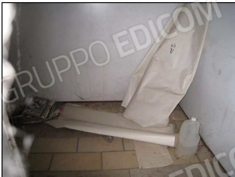
FOTO 29 VISTA RIPRESA VERSO PIANEROTTOLO SCALA COMUNE.

FOTO 28 VISTA RIPRESA ALL'INTERNO DEL RIPOSTIGLIO DI PERTINENZA DELLA PORZIONE DI ABITAZIONE U.I. MAPPALE 1458 SUB. 1 OGGETTO DI PROCEDURA.