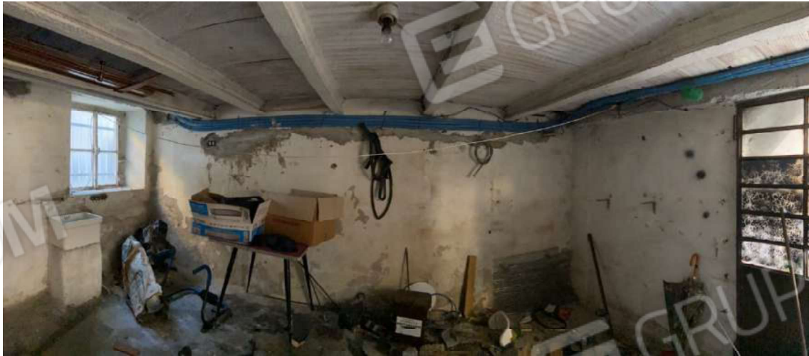
Rustico piano terra