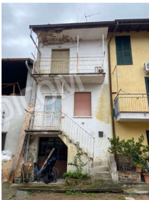
Unità immobiliare mapp.1129 sub.