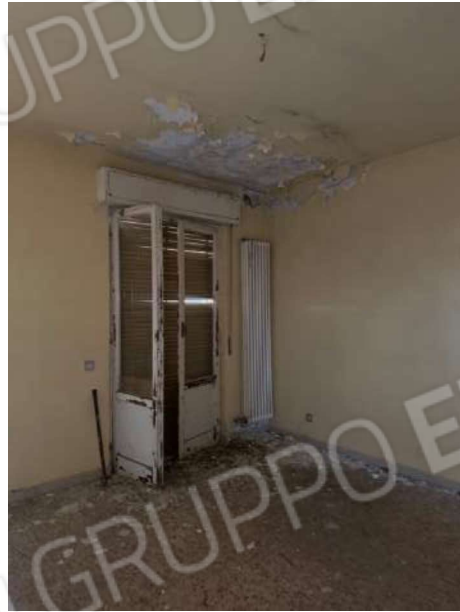
camera piano secondo