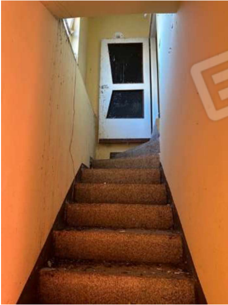
Scala interna da piano primo al piano secondo