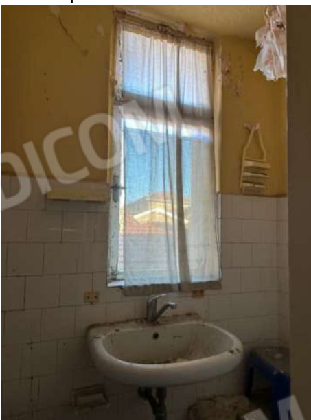
Servizio igienico piano secondo