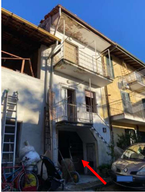
Accesso rustico piano terra