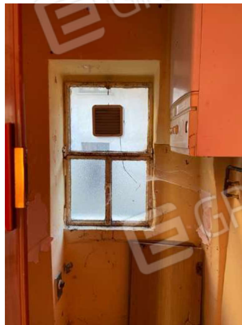
Wc piano primo caldaia