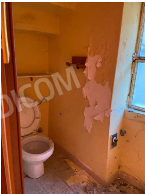
Wc piano primo