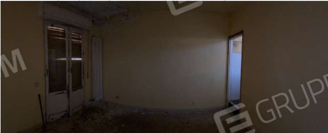
Camera piano secondo