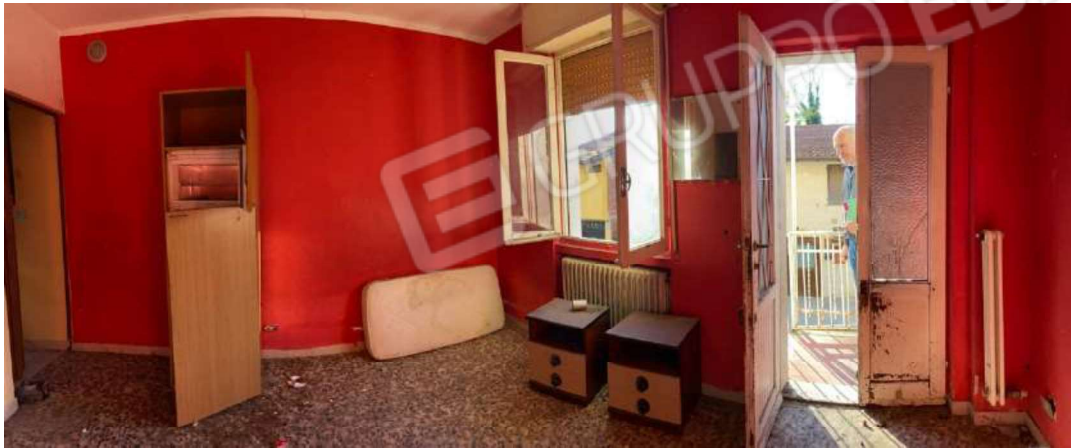
Piano primo cucina/soggiorno