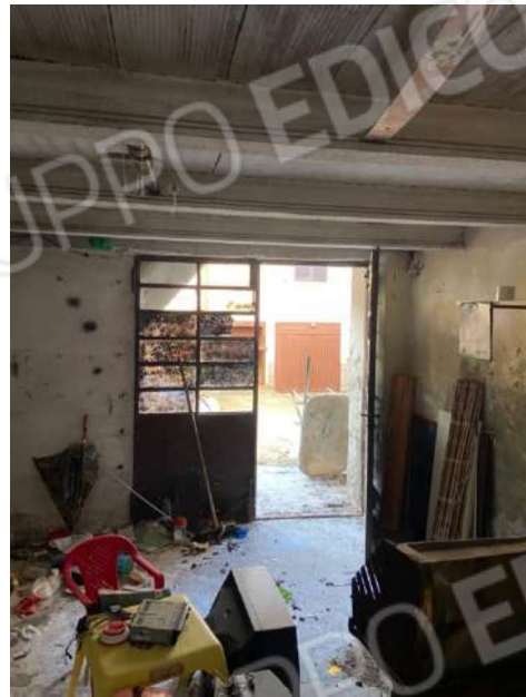
Accesso rustico piano terra