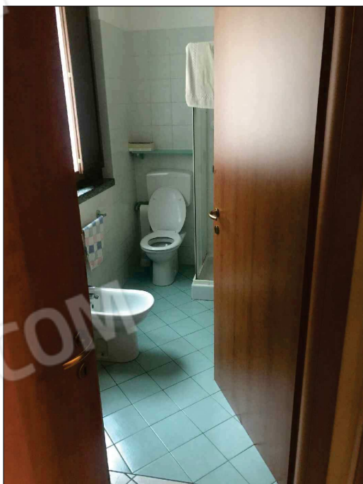
Foto 6 - BAGNO