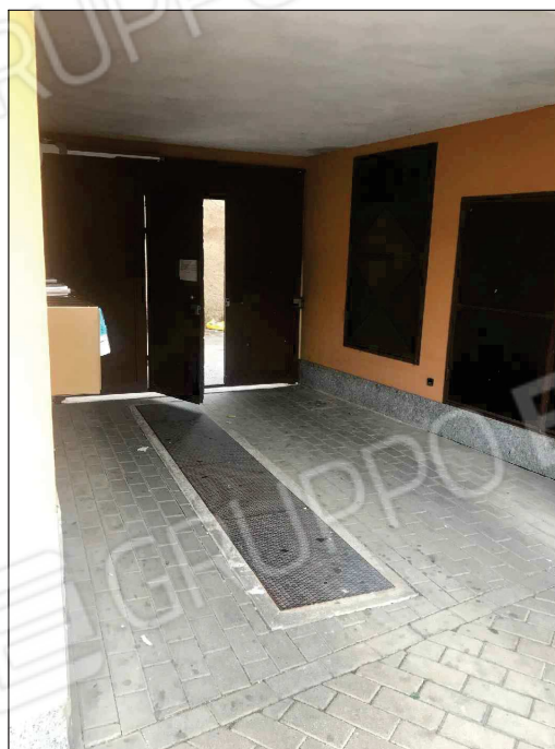
Foto 2 - VISTA IMMOBILE ANDRONE COMUNE