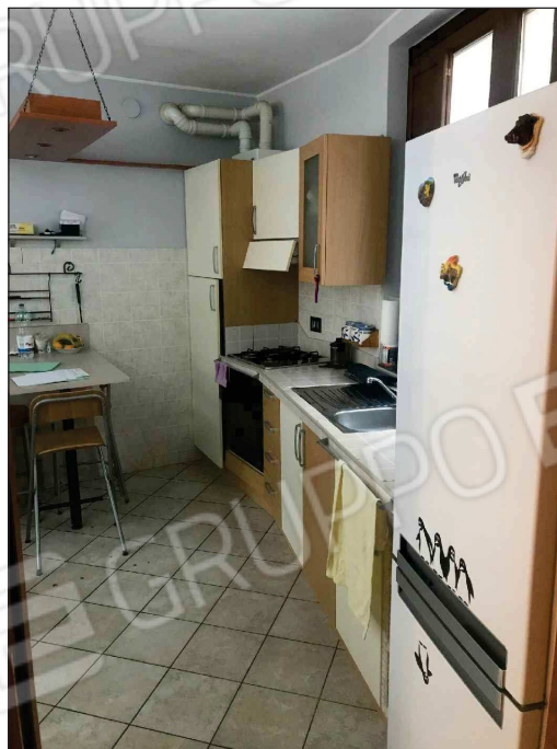
Foto 5 - ANGOLO COTTURA