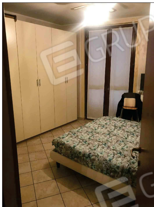
Foto 7 - CAMERA