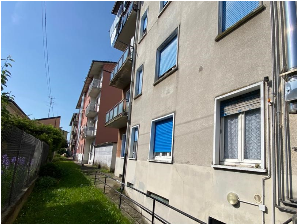
Affaccio appartamento sul retro