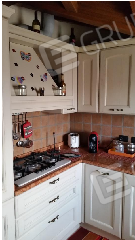
FOTO 4 - CUCINA