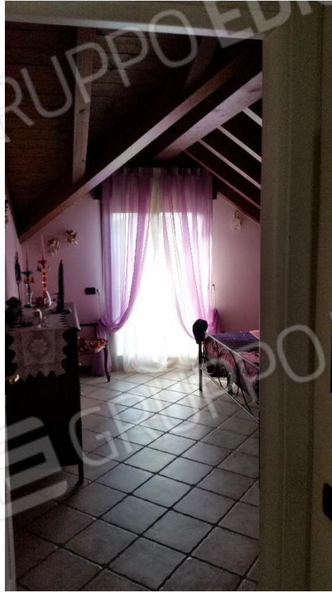
FOTO 2 - CAMERA