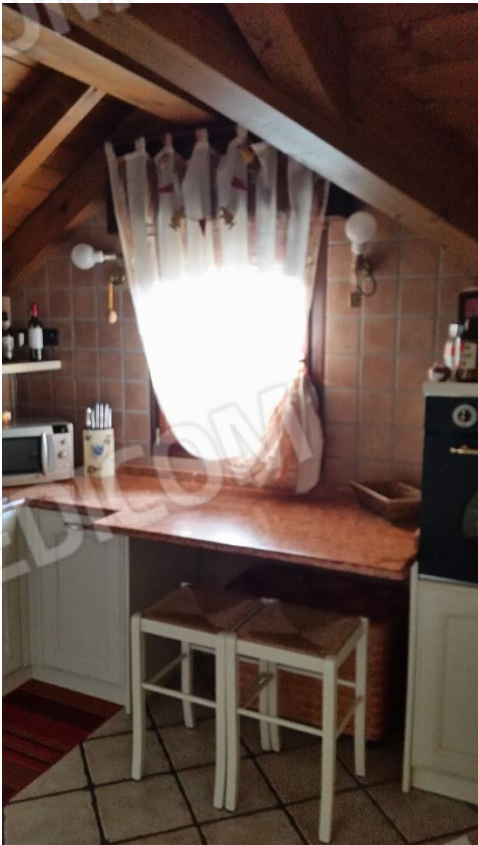
FOTO 3 - CUCINA