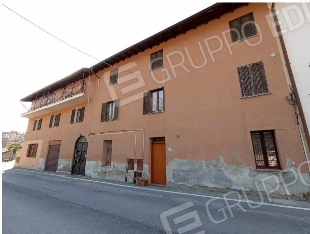
FOTO n.1-2 - Riprese dell'immobile da via Delle Motte