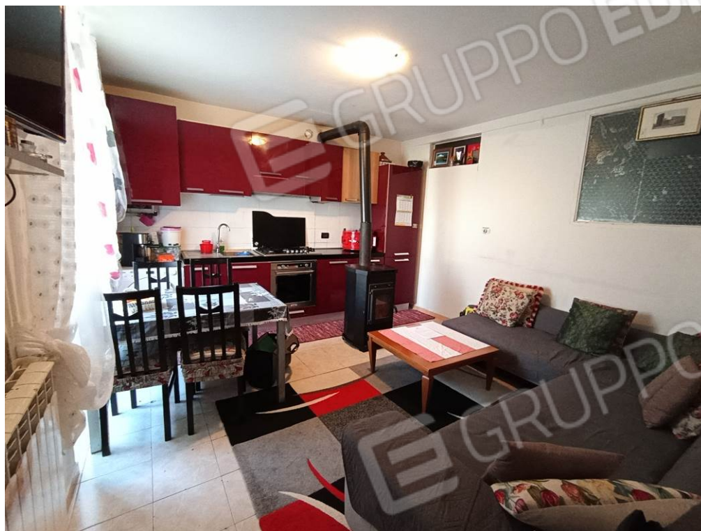
FOTO n. 3-4 - Riprese del vano cucina/soggiorno dell'immobile