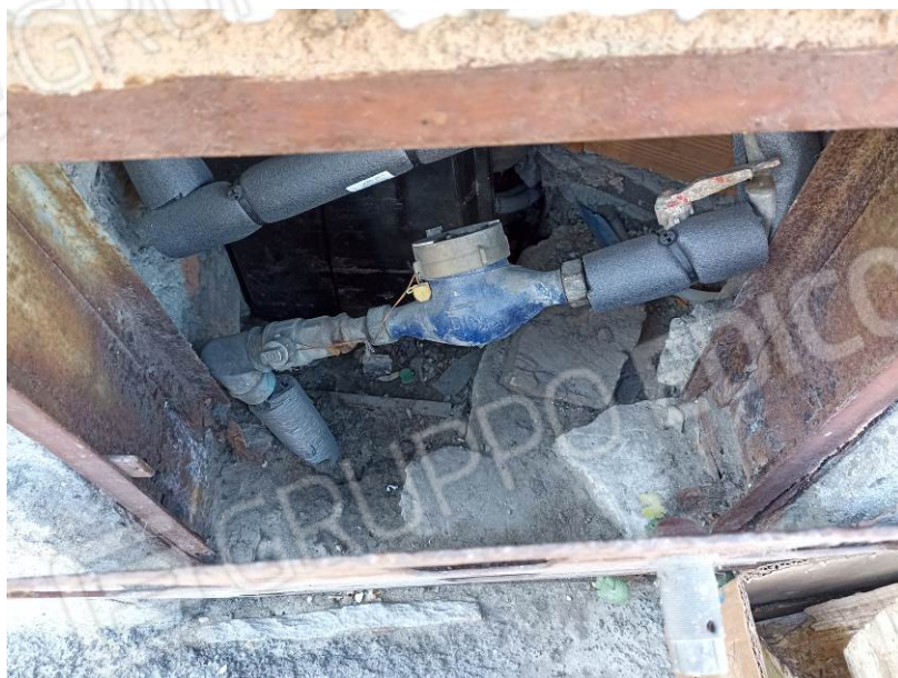
FOTO n.14-15-16 - Riprese dei contatori dell'immobile