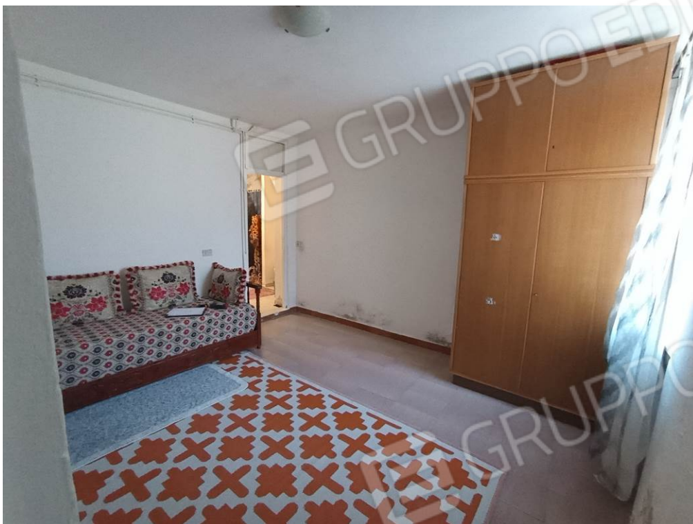
FOTO n. 5-6 - Riprese della camera