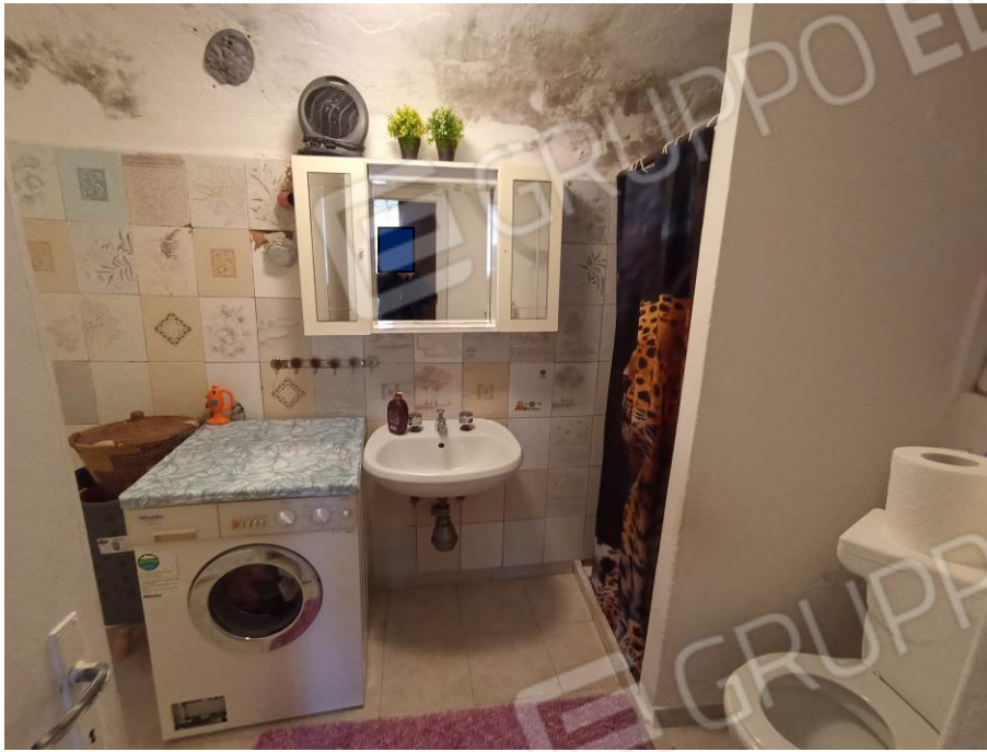
FOTO n. 11-12-13 - Riprese del bagno