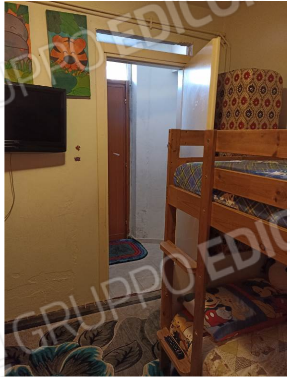
FOTO n. 7-8-9-10 - Riprese del vano ripostiglio utilizzato come camera e del disimpegno di ingresso