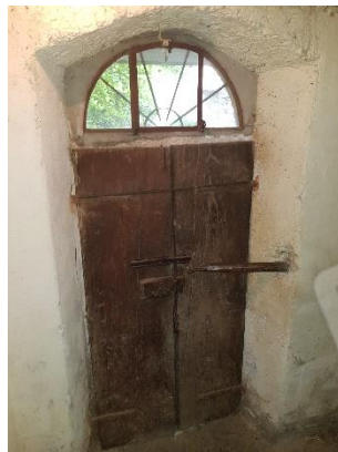
accesso da corte