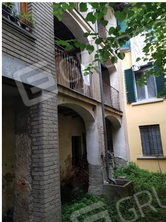
Esterna 5 lato corte