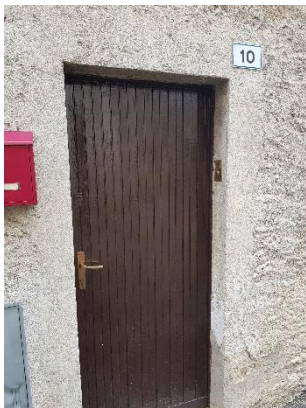
Ingresso Via Mazzini