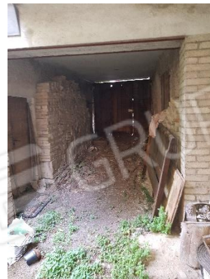
accesso alla corte Da Via Mazzini