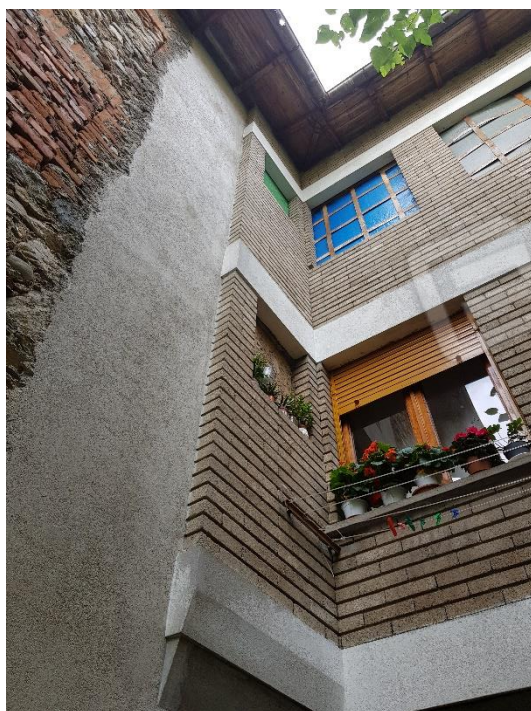
Esterna 6 lato corte