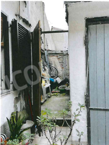
Locale esterno in comune