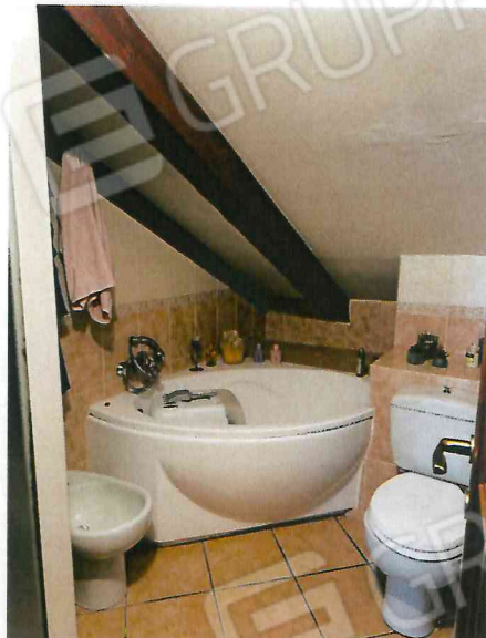
servizio igienico nel disimpegno