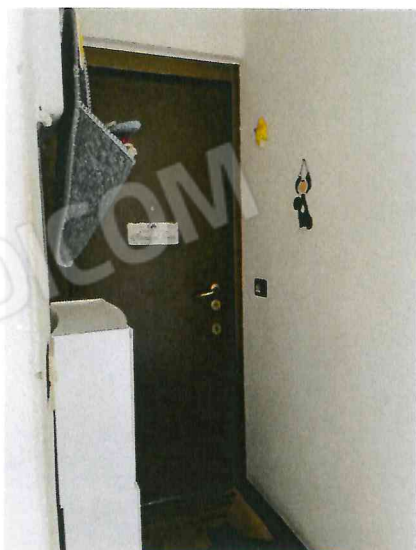
Ingresso appartamento piano terzo