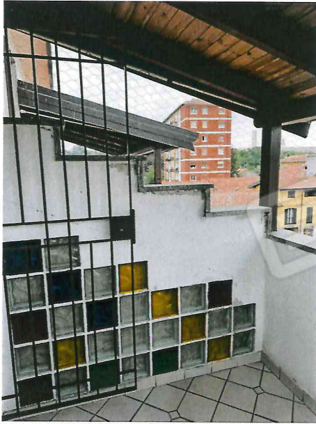
Balcone camera matrimoniale