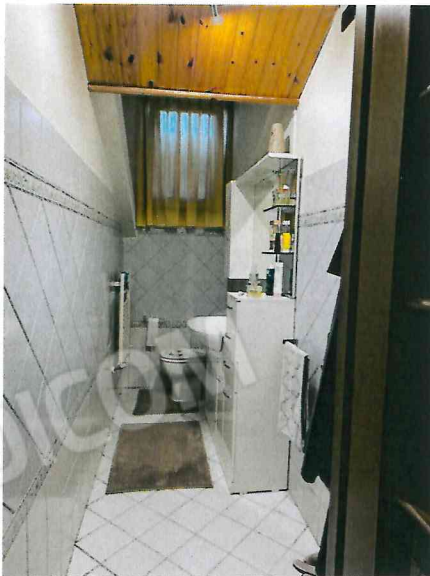
Servizio igienico con accesso dalla camera singola