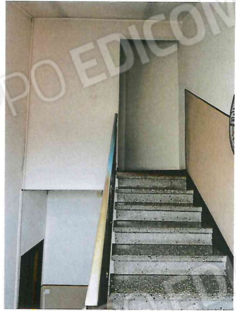
scala piano terzo