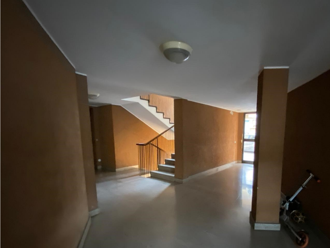
Atrio di ingresso