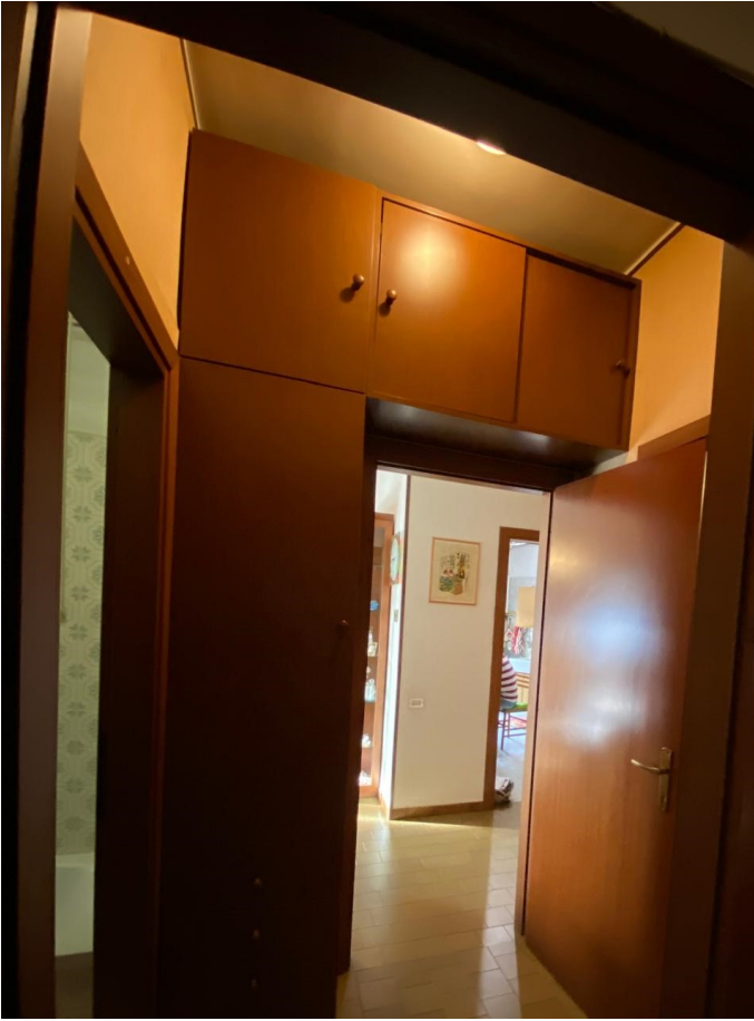
Corridoi di ingresso