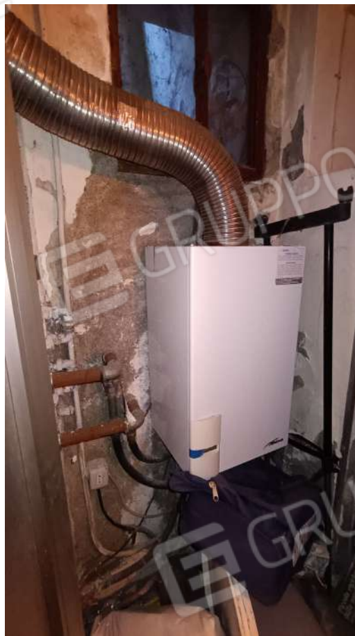
Scala collegamento sub. 6 a sub. 4