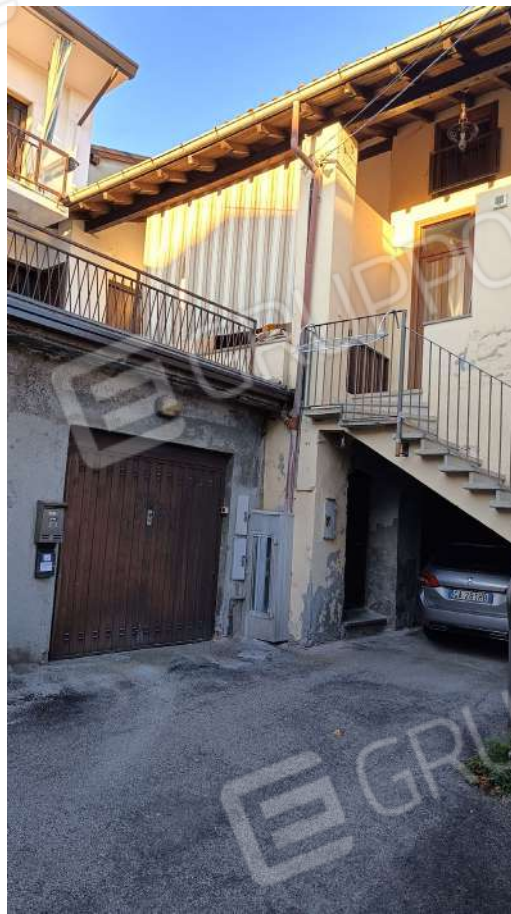
Entrata sub. 6