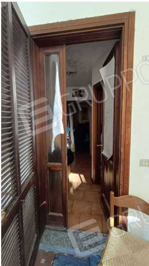
Porta di ingresso Sub. 4