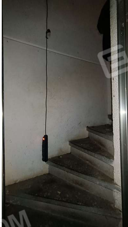
Scala collegamento sub. 6 a sub. 4