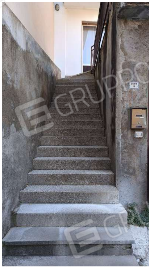
Scala di accesso al Sub. 4