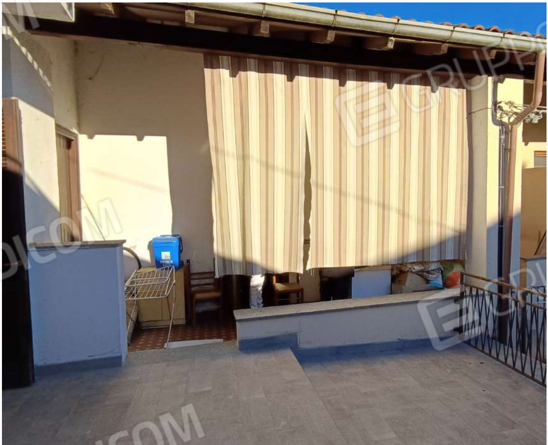
Terrazzo davanti al sub. 4