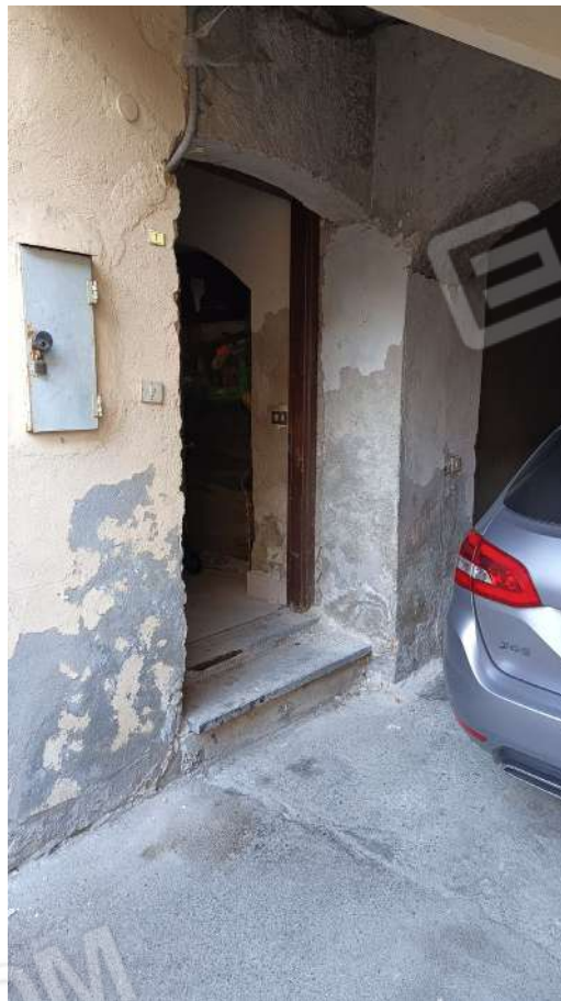
Entrata sub. 6