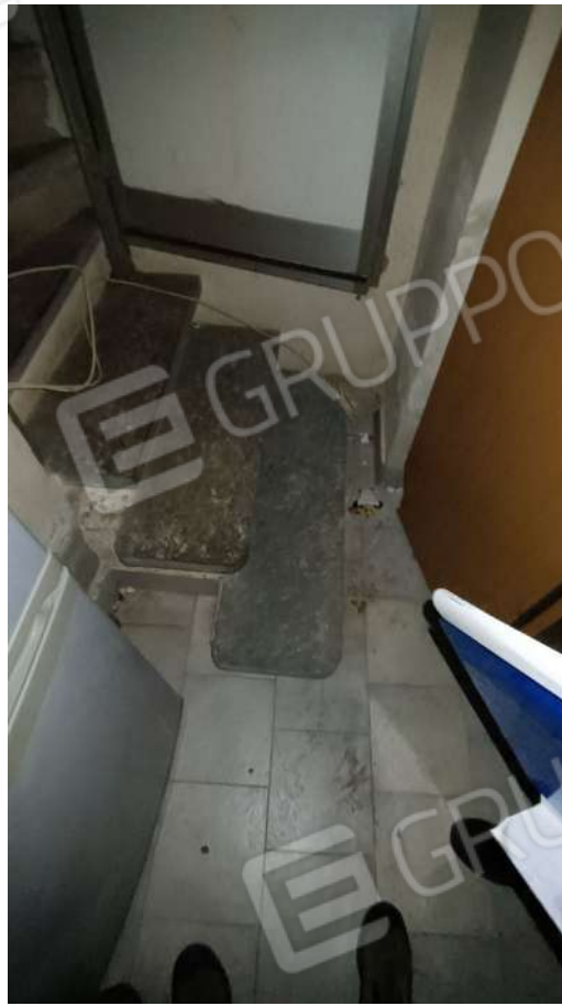
Scala collegamento sub. 6 a sub. 4