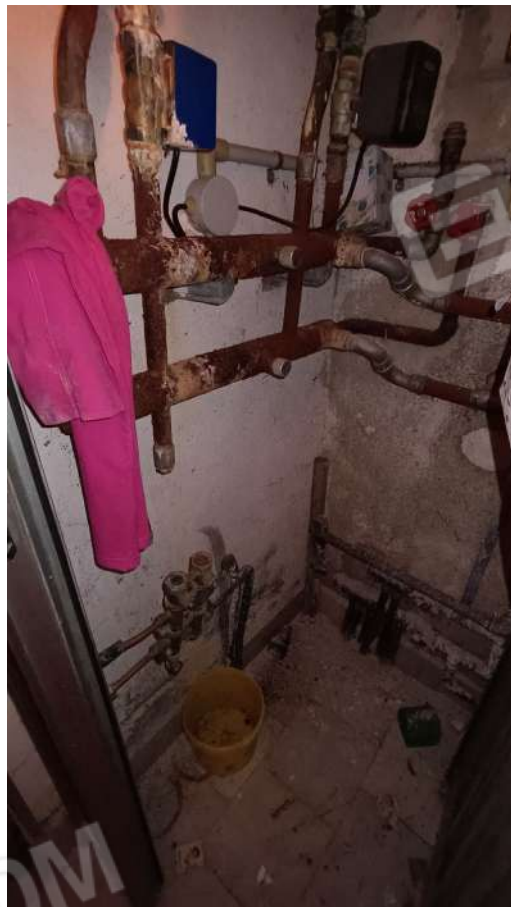
Scala collegamento sub. 6 a sub. 4