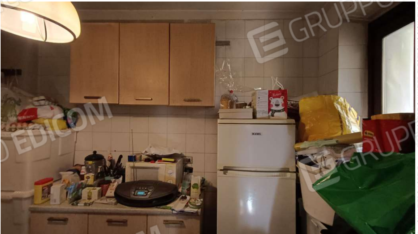
Scala collegamento sub. 6 a sub. 4