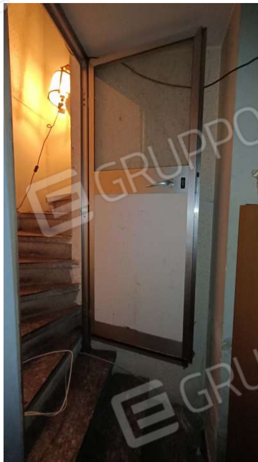
Scala collegamento sub. 6 a sub. 4