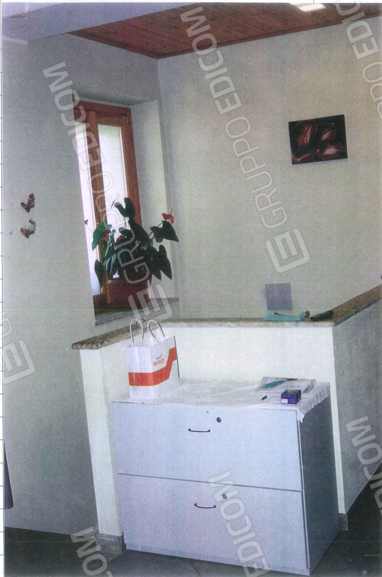
FOTO N. 19 – Locale soggiorno con invito alla scala della taverna.