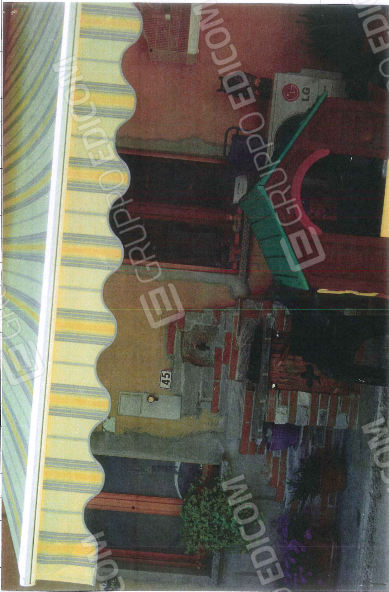
FOTO N. 2 – Sistemazione in fase di abbellimento dell'unità abitativa.