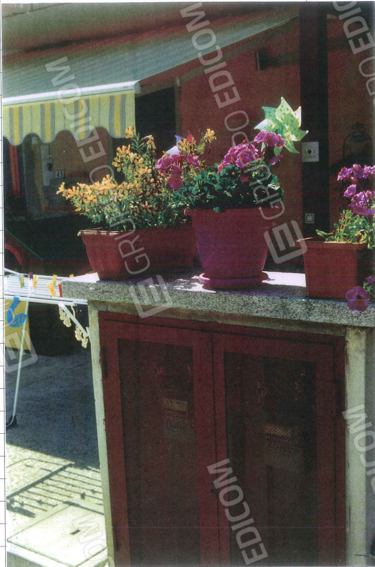
FOTO N. 3 – Sistemazione in fase di abbellimento dell'unità abitativa.