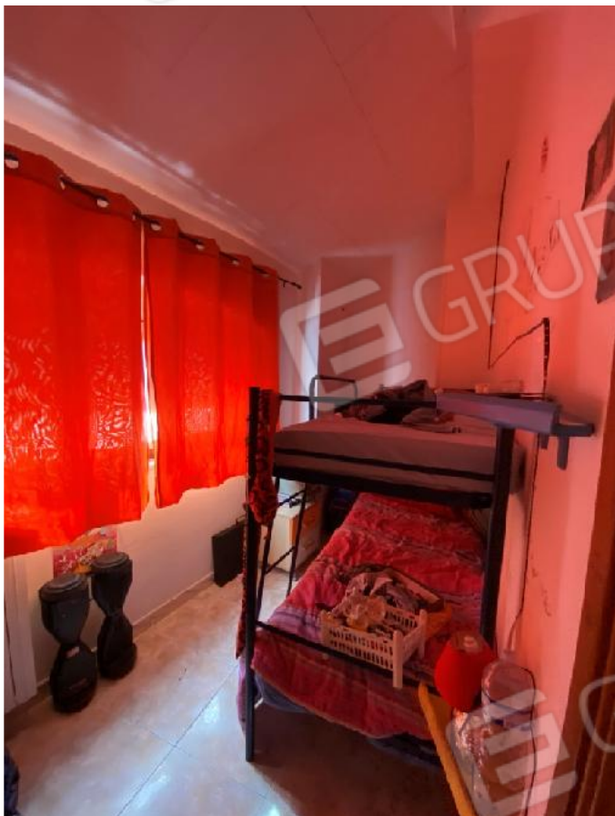
Ripostiglio 2° piano