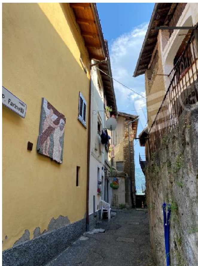
Vista da via Farinelli