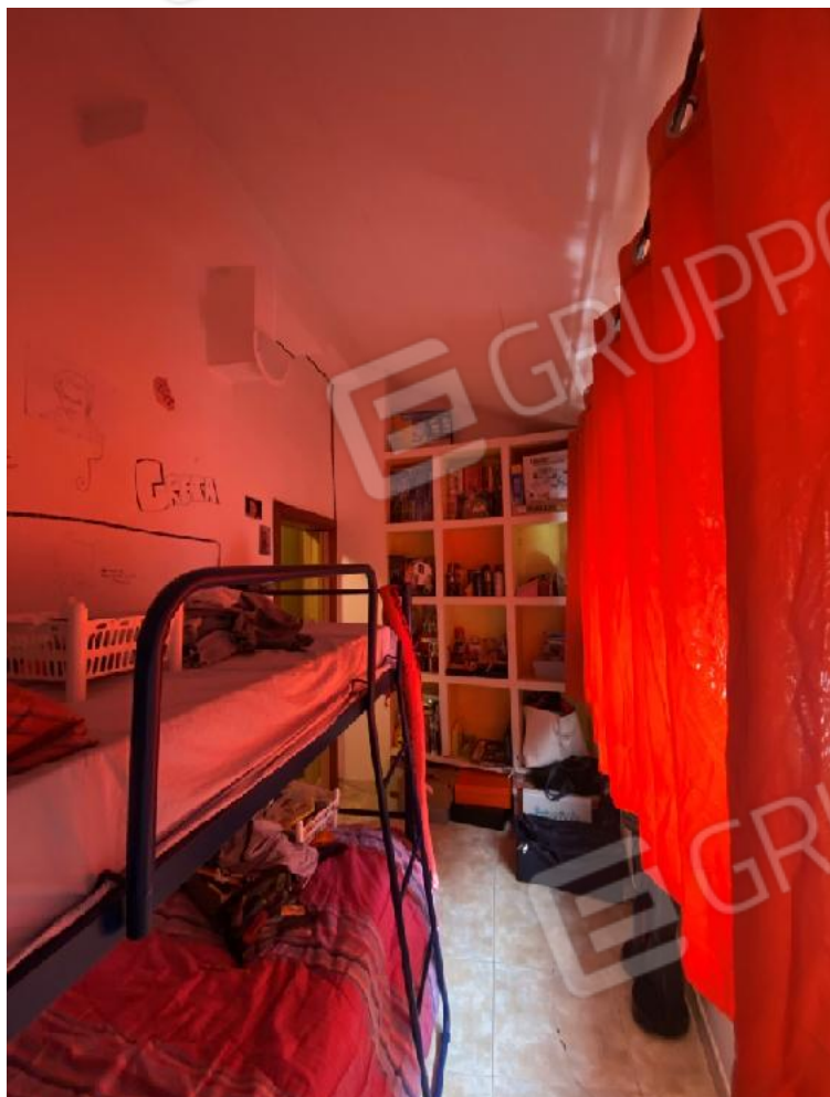
Ripostiglio 2° piano