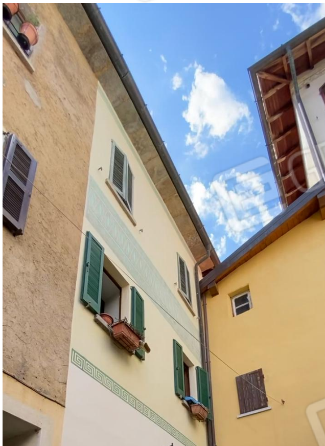
Vista da vicolo della Chiesa