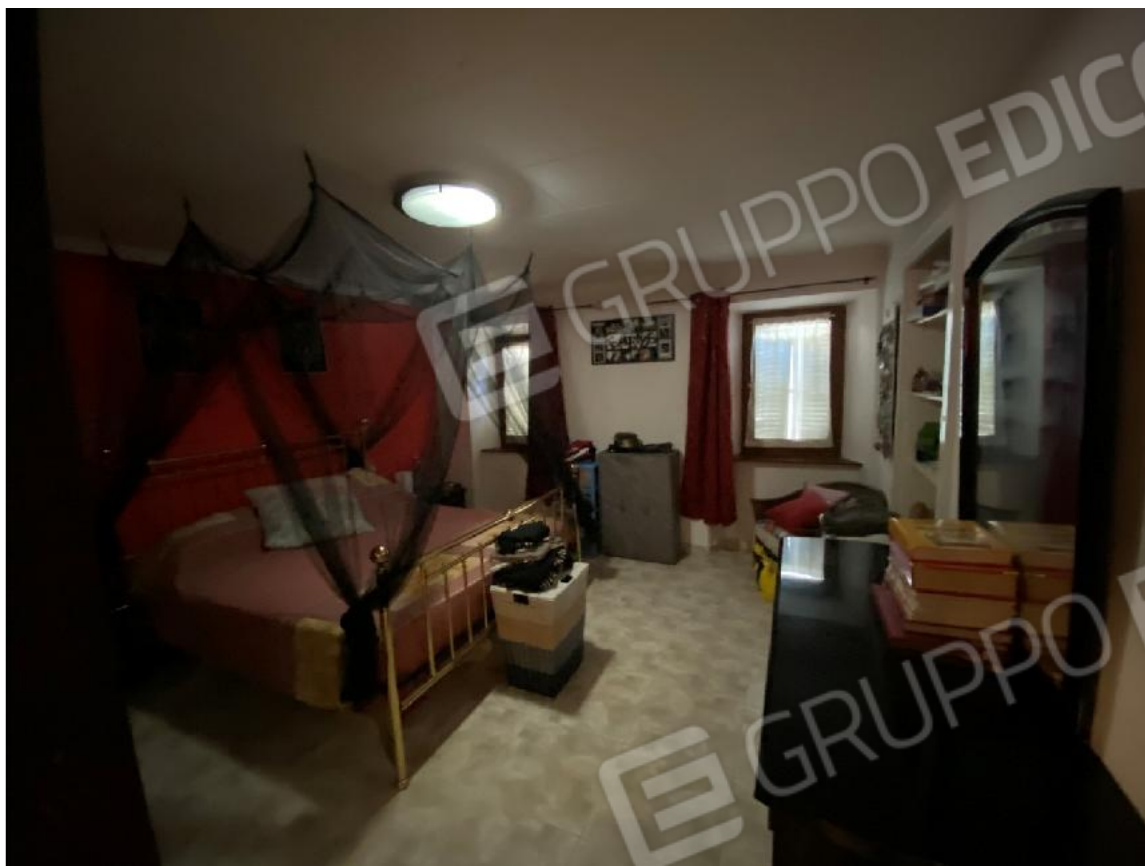
Camera 2° Piano