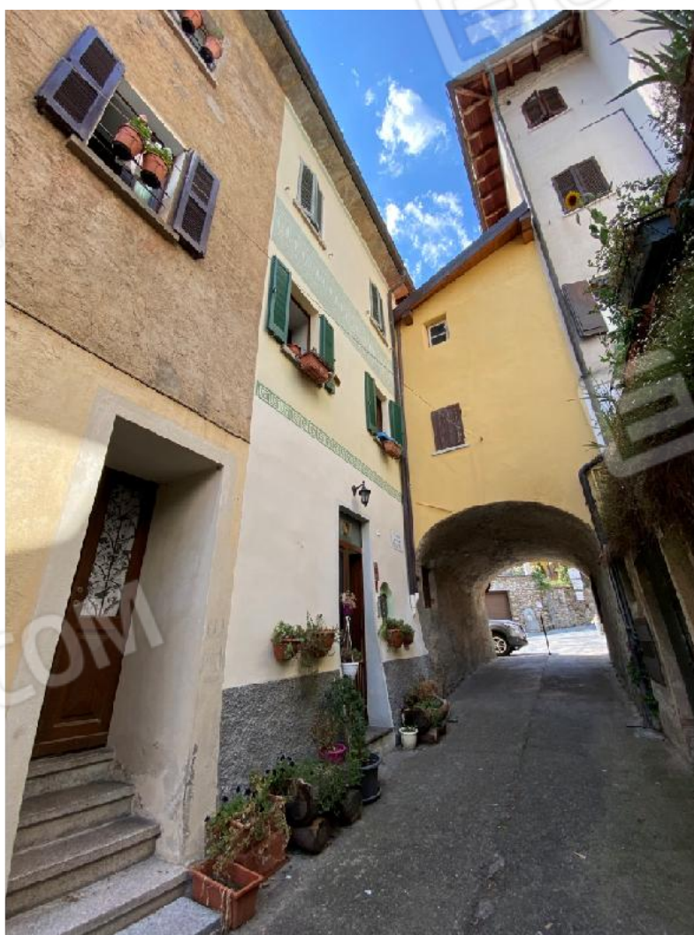
Vista da vicolo della Chiesa