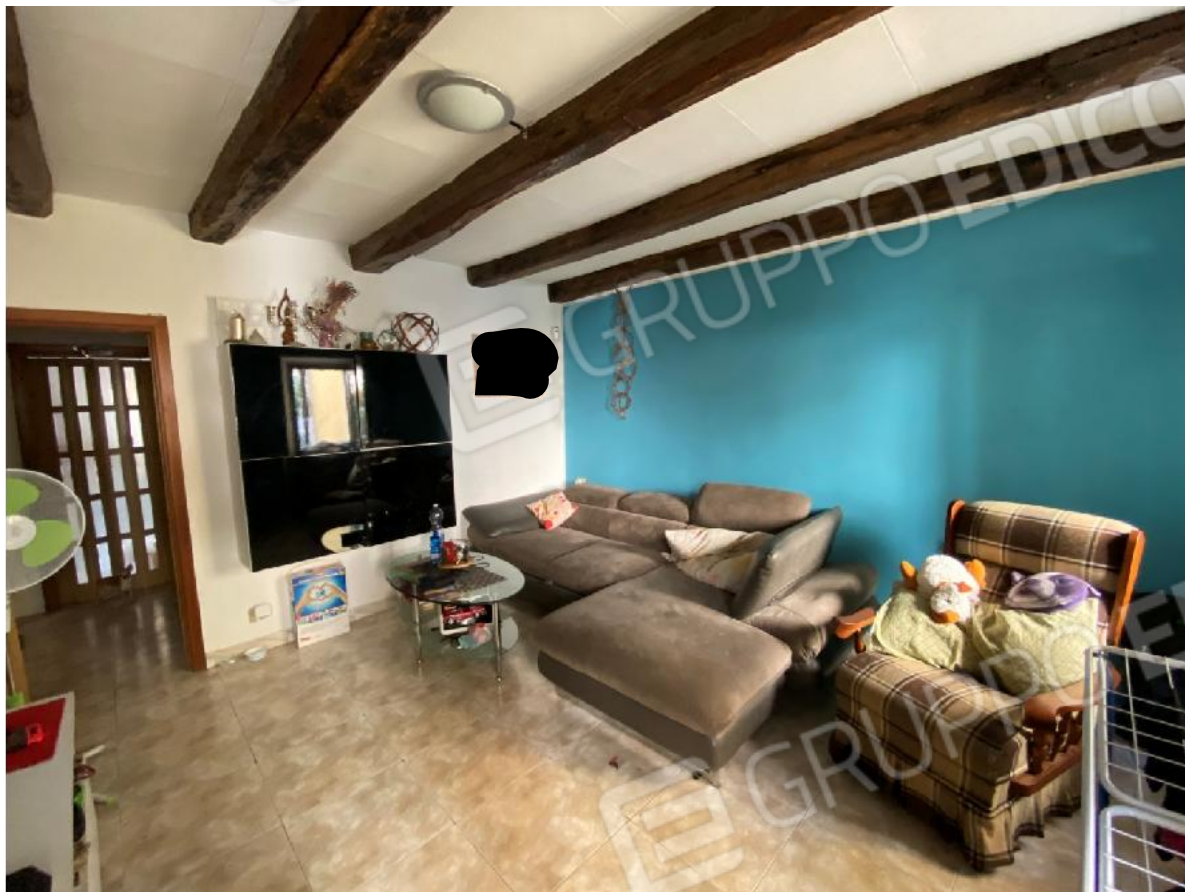
Camera 1° Piano