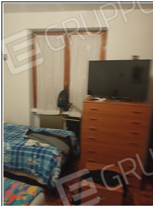
vista stufa riscaldamento