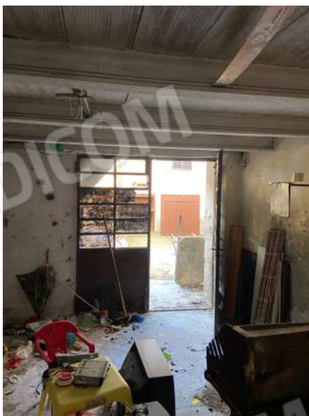
Rustico piano terra