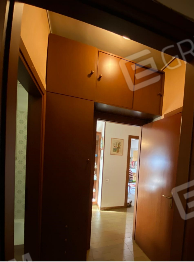
Corridoi di ingresso