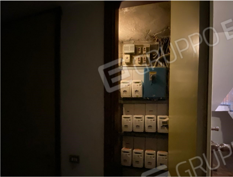
Aree comuni al piano interrato