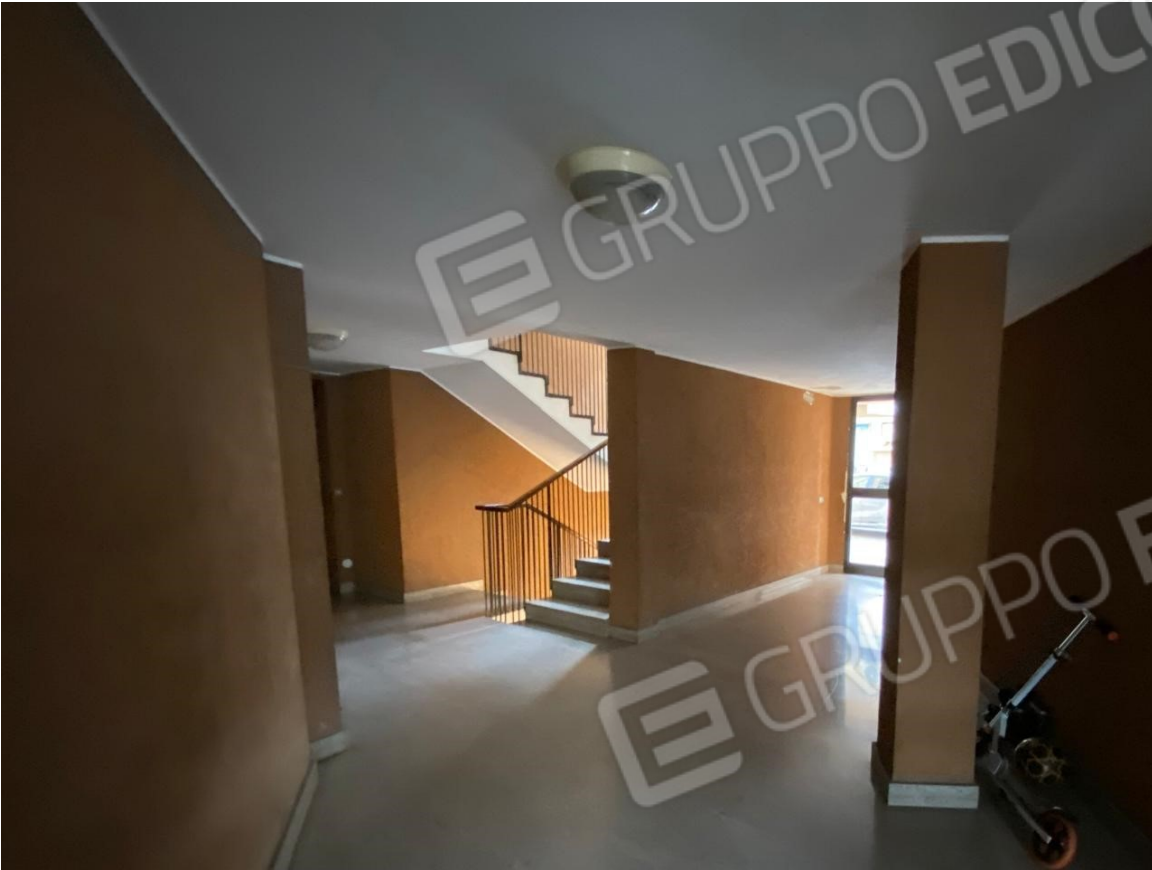
Atrio di ingresso