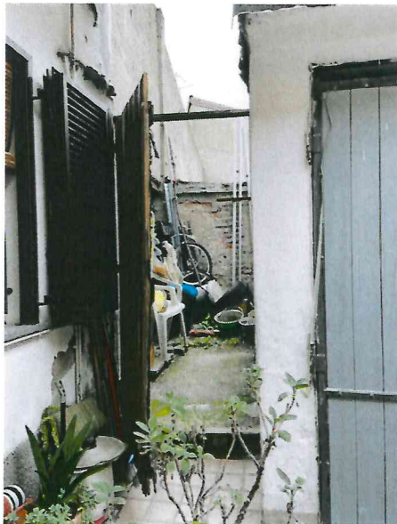
Locale esterno in comune