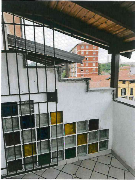
Balcone camera matrimoniale