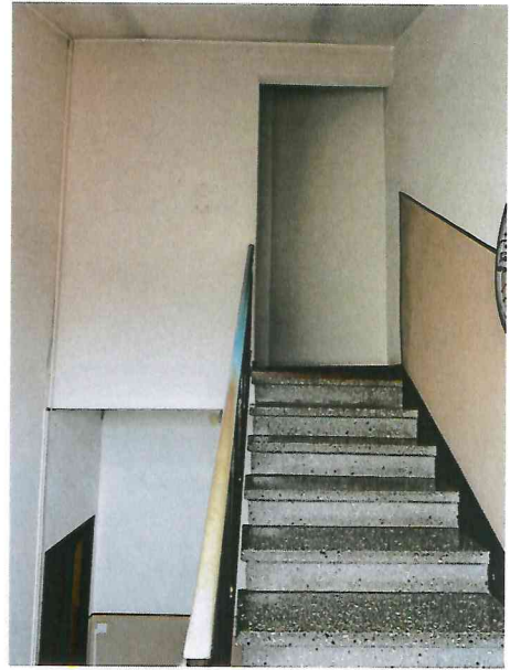
scala piano terzo