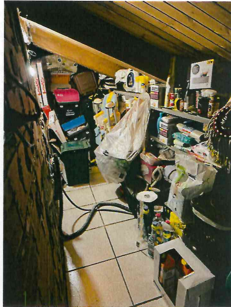
ripostiglio con accesso dalla cucina