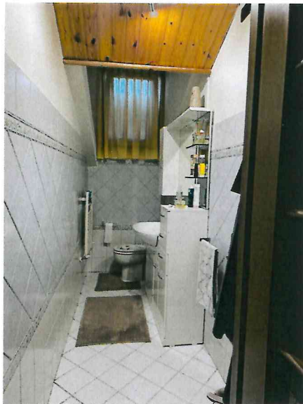
Servizio igienico con accesso dalla camera singola