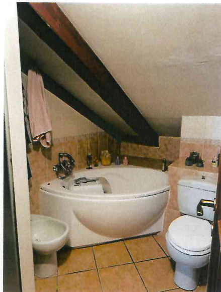
servizio igienico nel disimpegno