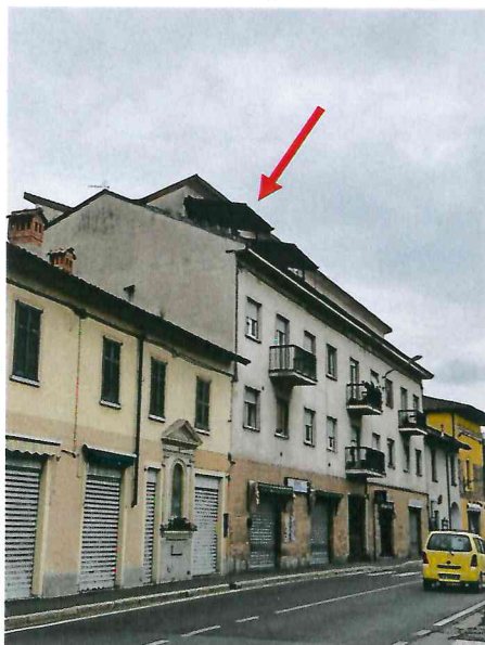
Lato edificio verso via Mauceri