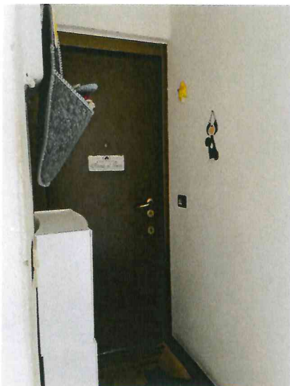
Ingresso appartamento piano terzo