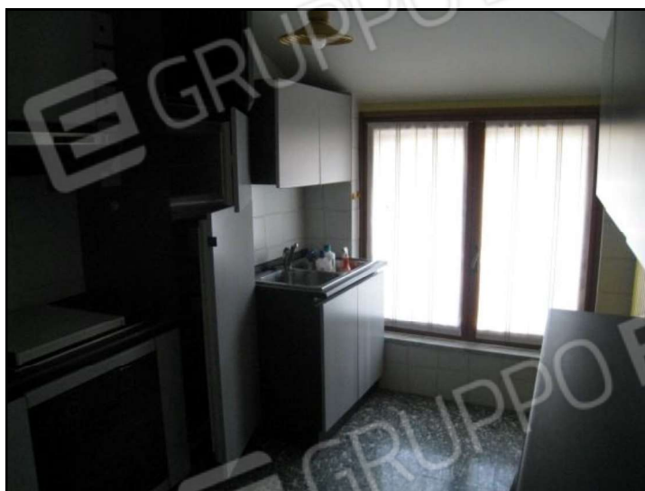
FOTO 18 U.I. MAPPALE 17429 SUB. 20 VISTA INTERNA DELL'U.I. OGGETTO DI PROCEDURA ESECUTIVA. ALTRA FOTO RIPRESA NELLA CUCINA

FOTO 17 U.I. MAPPALE 17429 SUB. 20 VISTA INTERNA DELL'U.I. OGGETTO DI PROCEDURA ESECUTIVA. LA FOTO RIPRENDE LA CUCINA