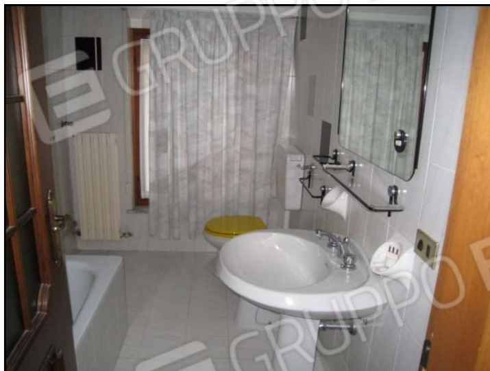
FOTO 21 U.I. MAPPALE 17429 SUB. 20 VISTA INTERNA DELL'U.I. OGGETTO DI PROCEDURA ESECUTIVA. ALTRA FOTO RIPRESA NEL BAGNO.

FOTO 20 U.I. MAPPALE 17429 SUB. 20 VISTA INTERNA DELL'U.I. OGGETTO DI PROCEDURA ESECUTIVA. LA FOTO È RIPRESA NEL BAGNO.