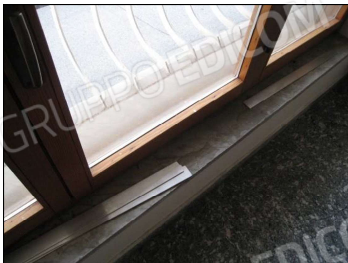
FOTO 17 U.I. MAPPALE 17429 SUB. 20 VISTA INTERNA DELL'U.I. OGGETTO DI PROCEDURA ESECUTIVA. LA FOTO RIPRENDE LA CUCINA

FOTO 16 U.I. MAPPALE 17429 SUB. 20 VISTA INTERNA DELL'U.I. OGGETTO DI PROCEDURA ESECUTIVA. FOTO PARTICOLARE DEL SERRAMENTO DEL SOGGIORNO.