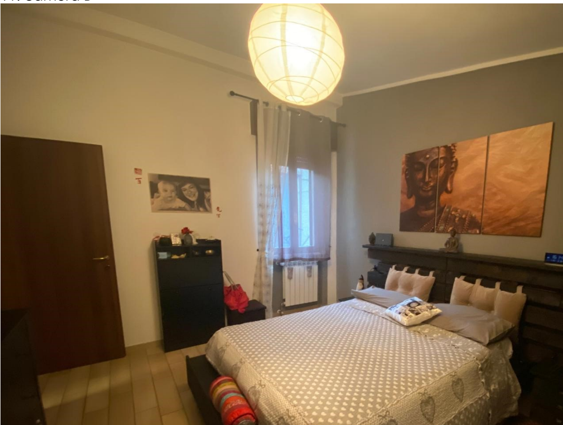
12. camera B