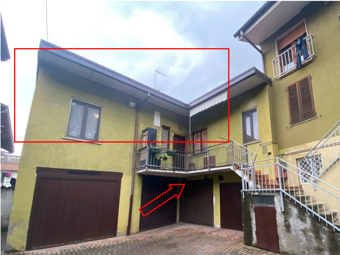
5. appartamento e box