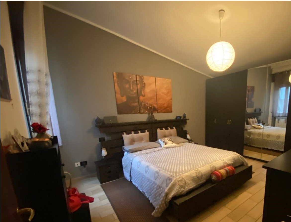
11. camera B