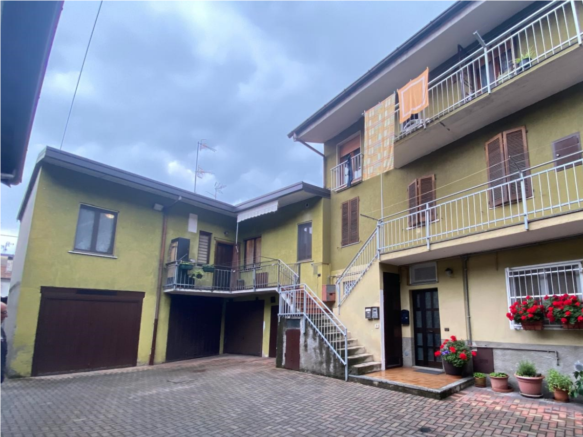
3. la corte