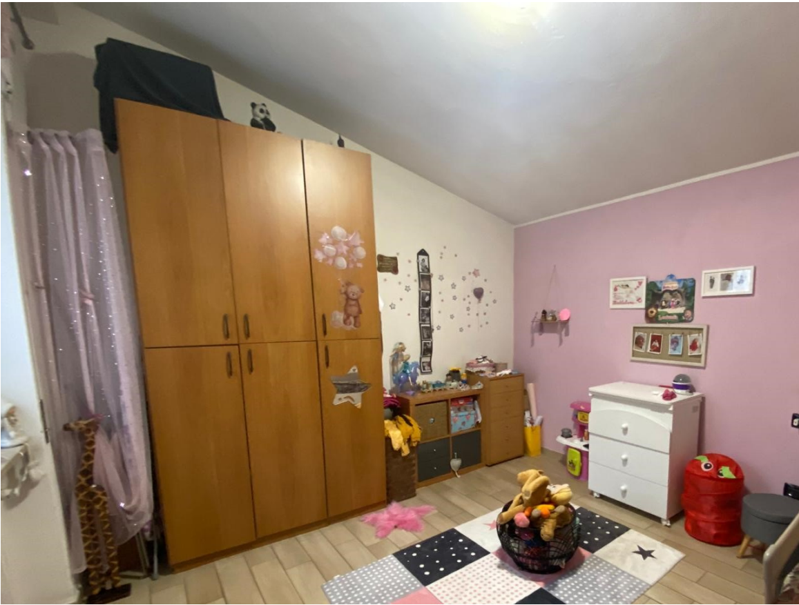
9. camera A