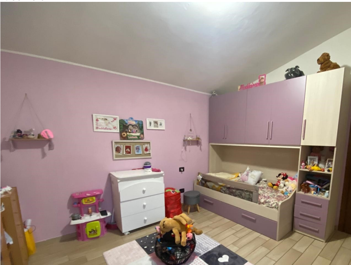
10. camera A