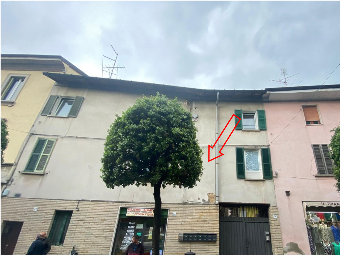
2. drone su strada