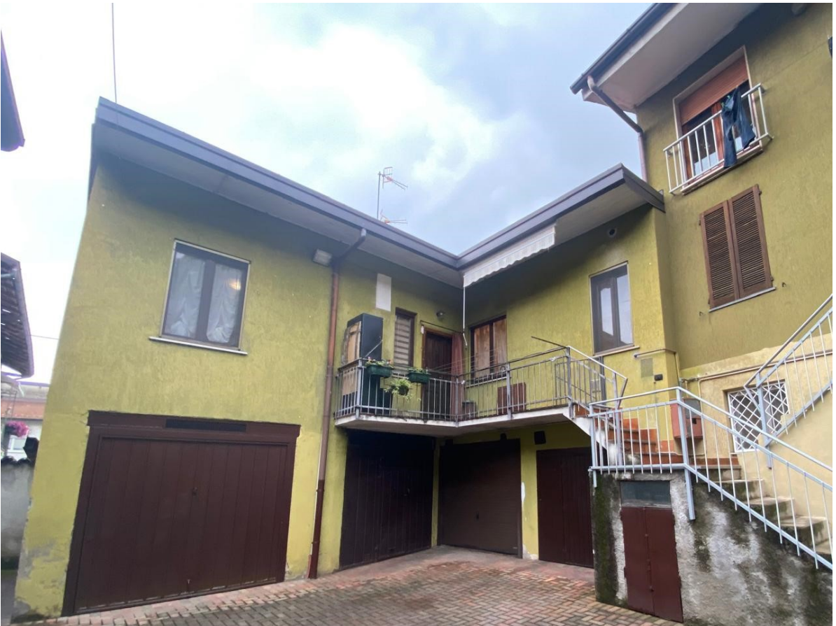
4. la corte