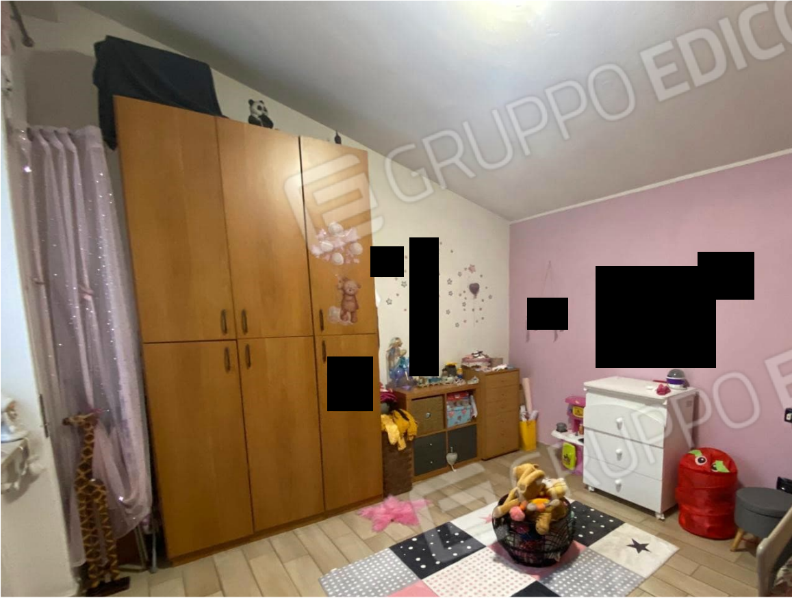
9. camera A