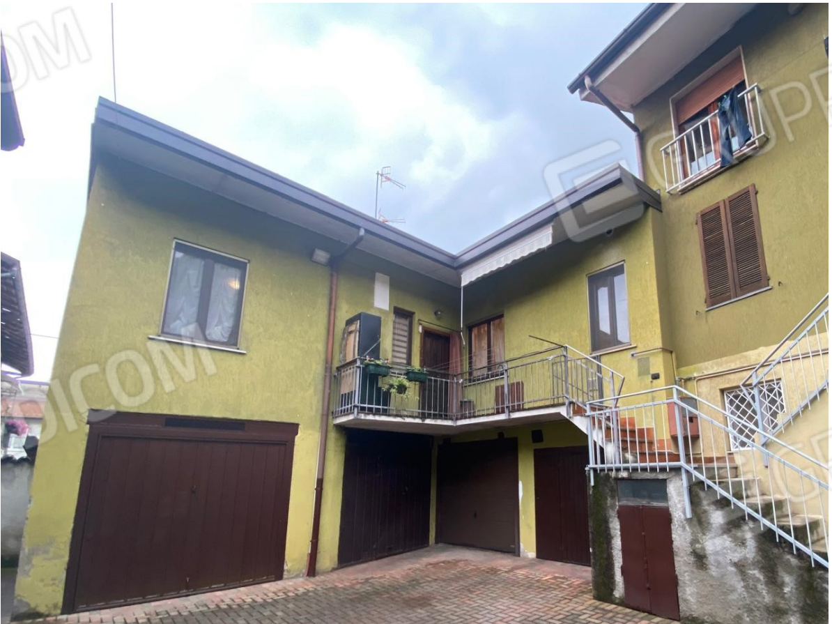
4. la corte