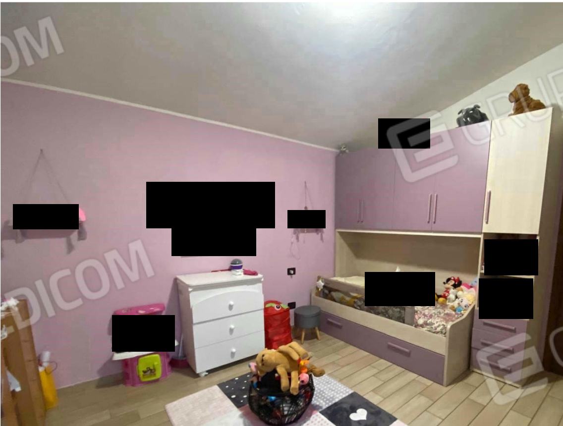
10. camera A