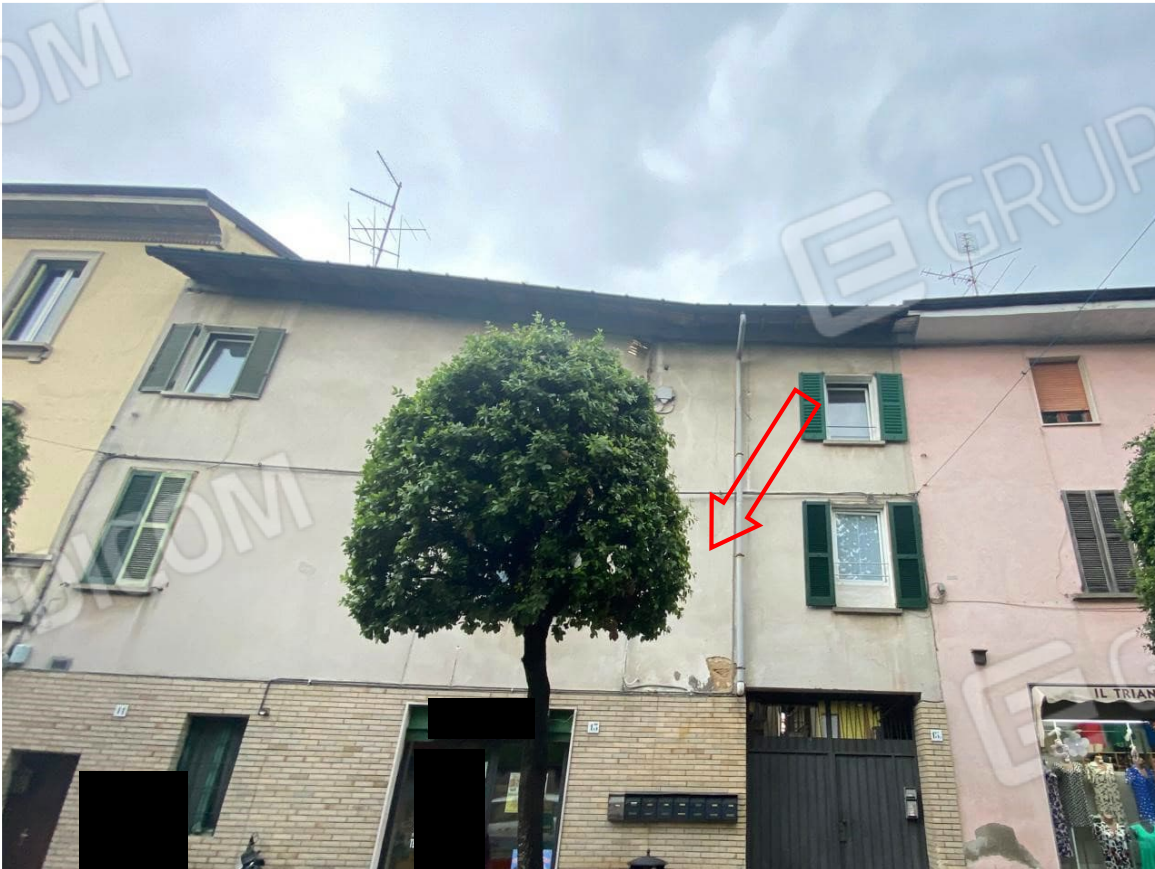
2. drone su strada