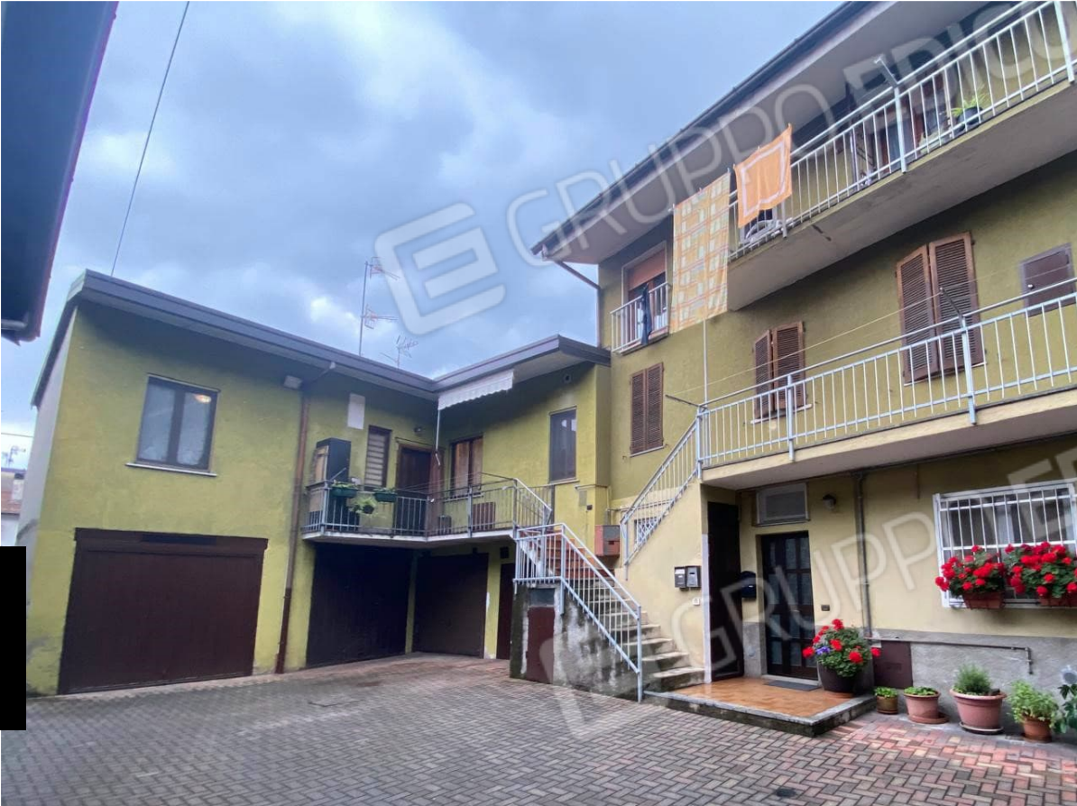
3. la corte