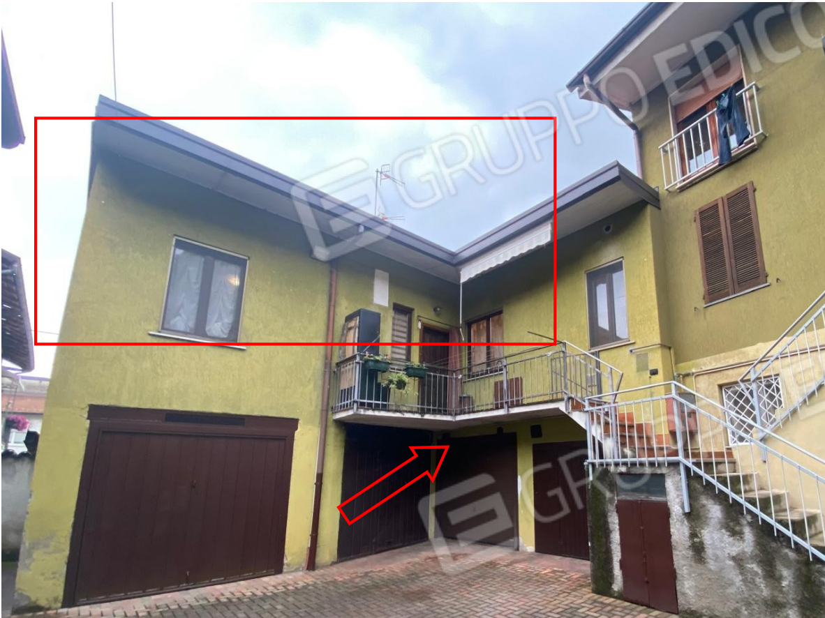
5. appartamento e box