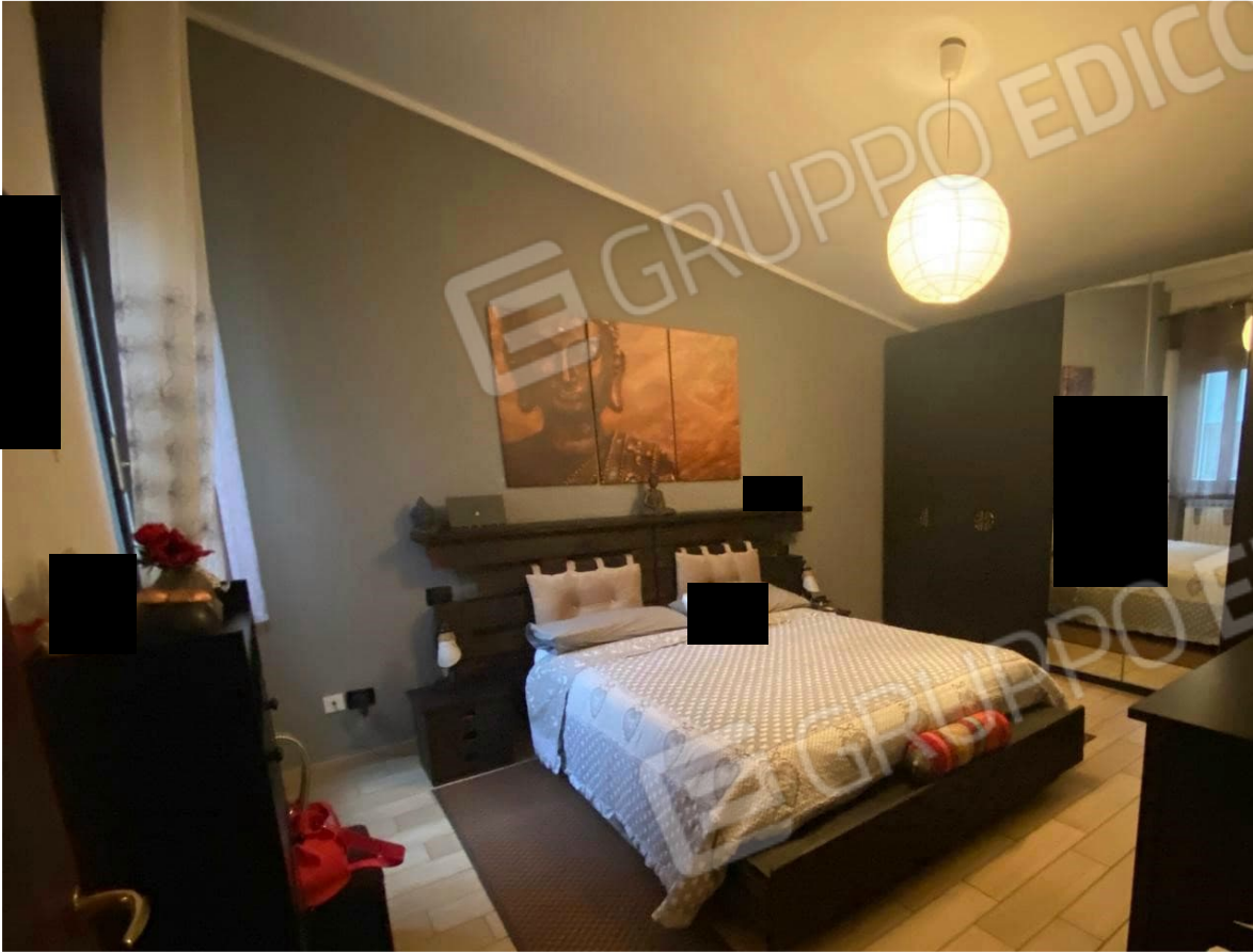
11. camera B