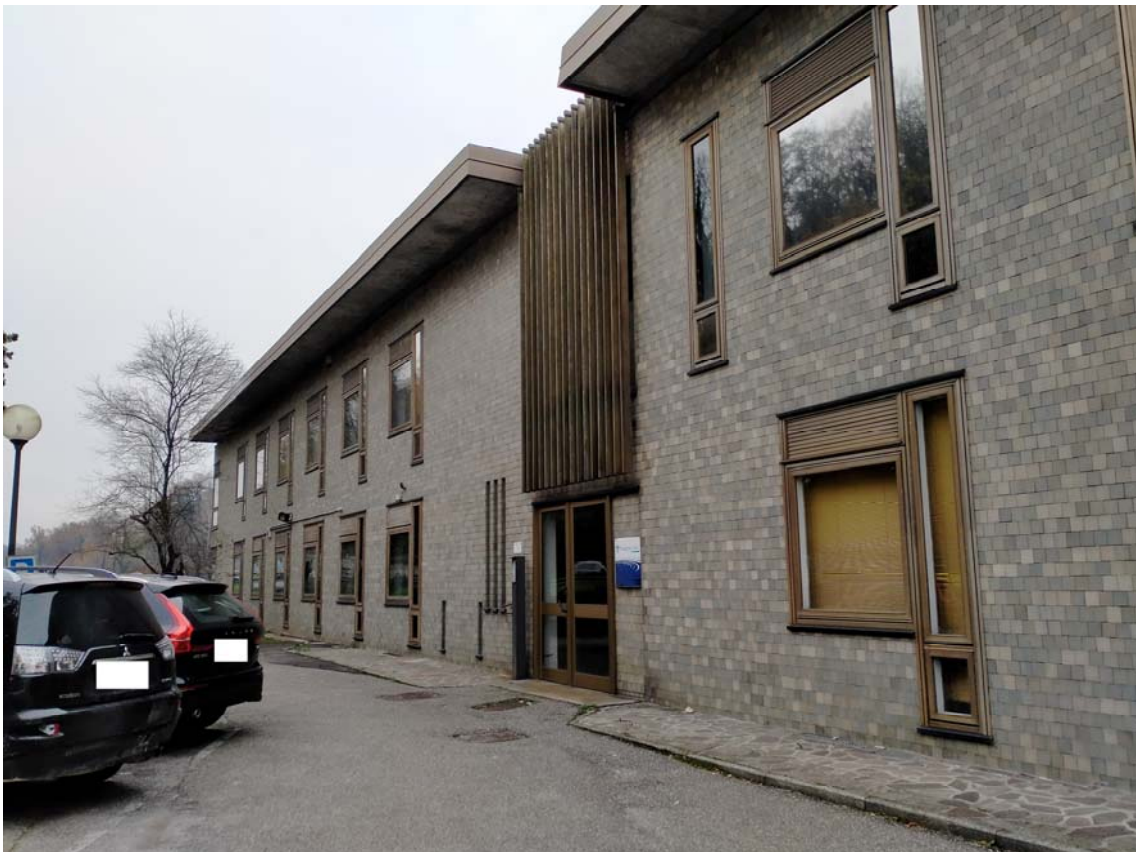
PROSPETTO EST PALAZZINA UFFICI