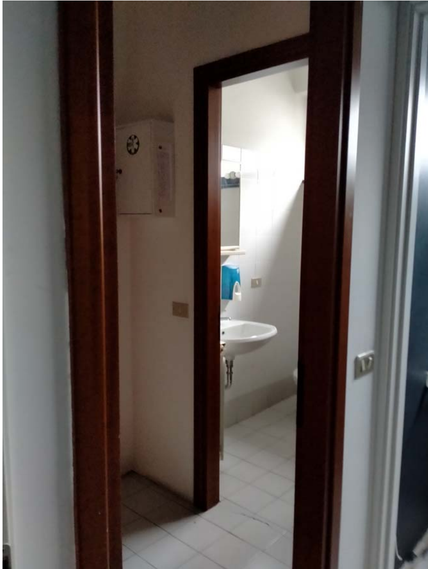
VISTA SERVIZI IGIENICI