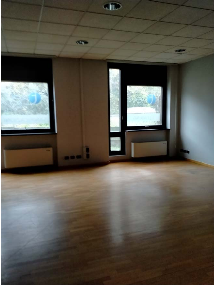
VISTA INTERNA UFFICI