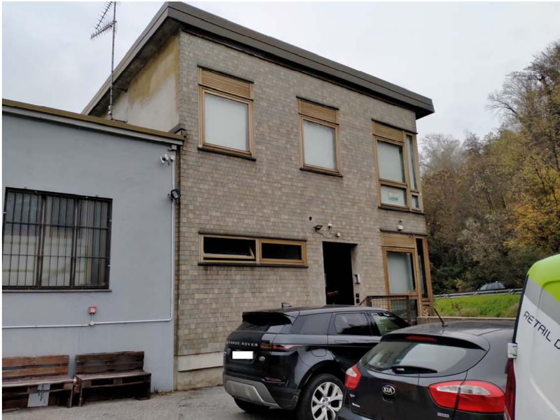
PROSPETTO SUD e PARCHEGGIO (mappale 34169)