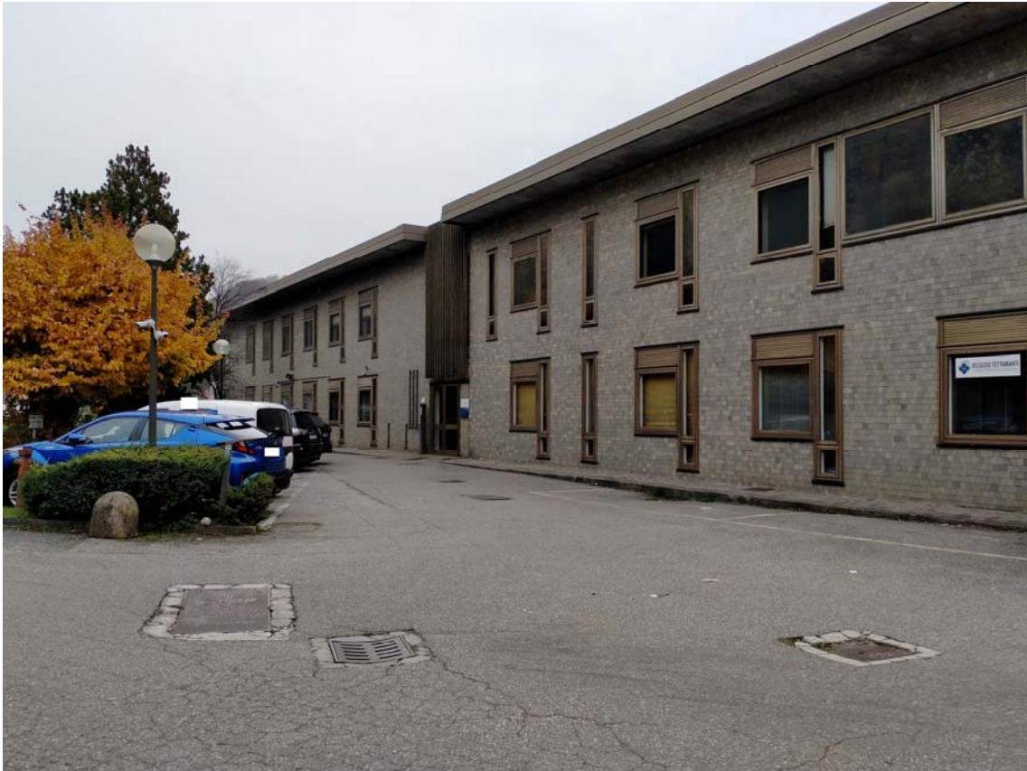
PROSPETTO EST PALAZZINA UFFICI