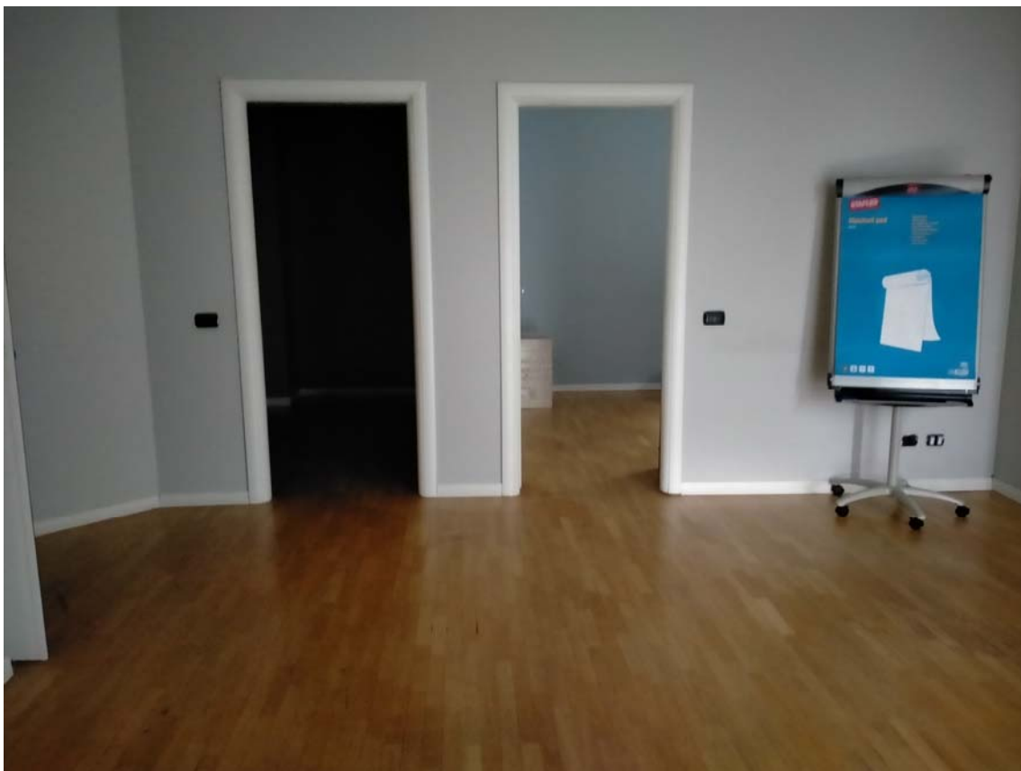
VISTA INTERNA UFFICI