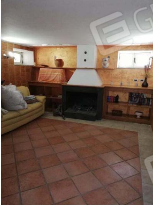
TAVERNA 1 PIANO S1