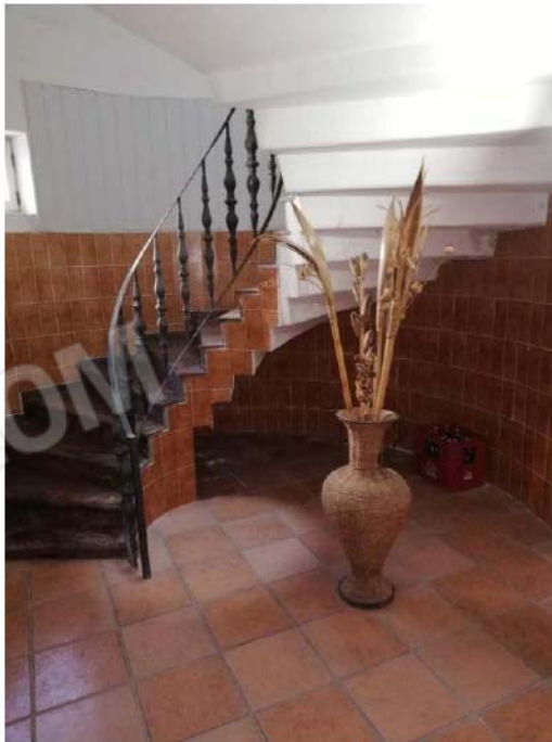
SCALA PIANO S1