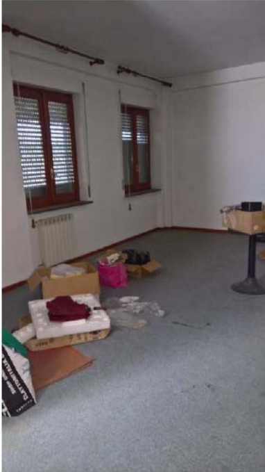
UFFICIO 1 – PIANO 1