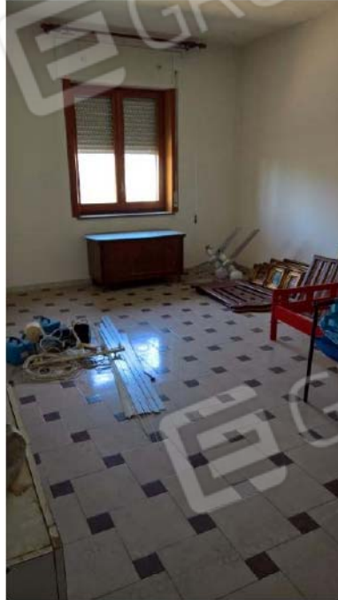
UFFICIO 2 – PIANO 1