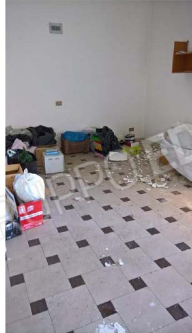
UFFICIO 3 – PIANO 1