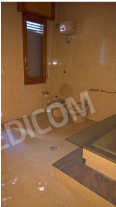
BAGNO – PIANO 1