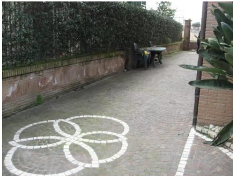
Figura 8 cortile comune sub 1 del fabbricato