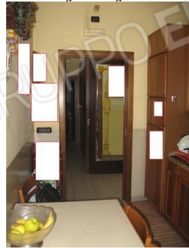
Figura 15 cucina