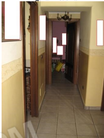
Figura 16 disimpegno 1