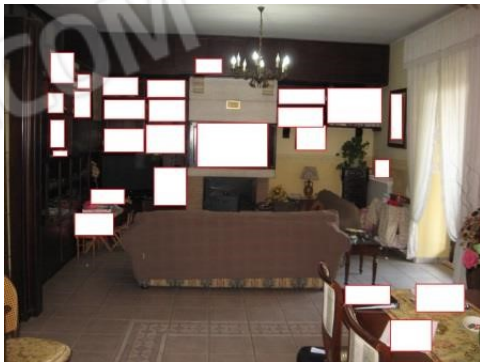
Figura 10 salone