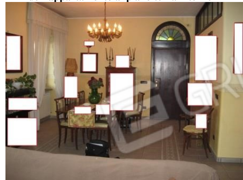
Figura 11 salone