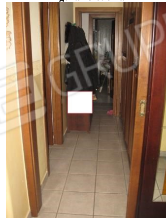
Figura 17 disimpegno 2