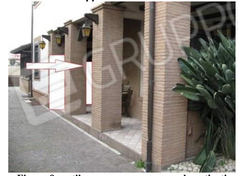
Figura 9 cortile comune con accesso ai porticati dell'appartamento al piano terra interno 1