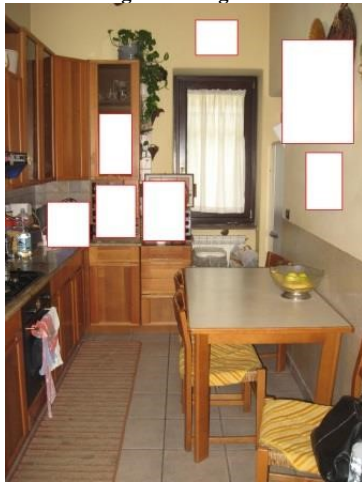
Figura 14 cucina