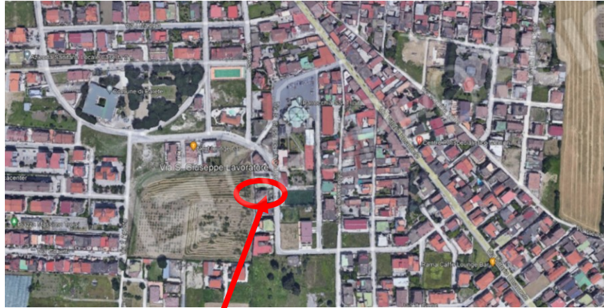
Figura 1 Foto satellitare del bene pignorato