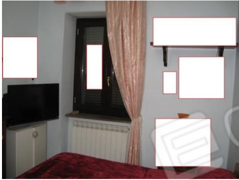
Figura 20 camera da letto 2