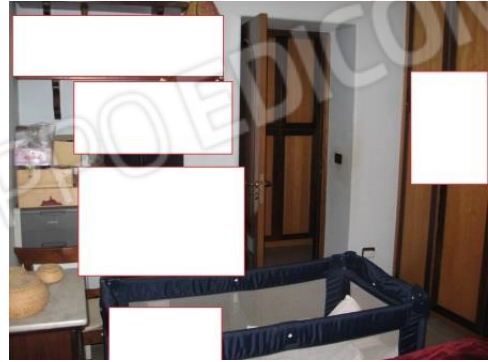
Figura 21 camera da letto 2