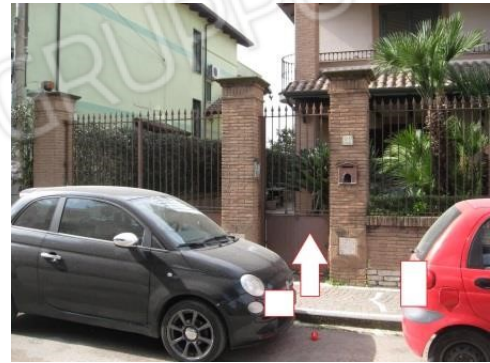
Figura 7 accesso all'immobile pignorato al piano terra alla via San Giuseppe Lavoratore n.47 in Parete