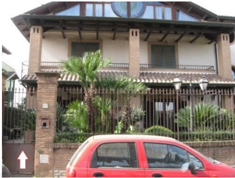
Figura 6 facciata est del fabbricato alla via San Giuseppe Lavoratore n.47 in Parete