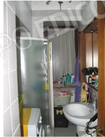
Figura 13 bagno 2