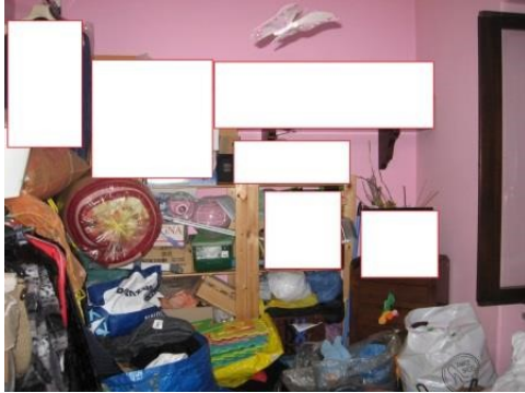
Figura 22 camera da letto 3