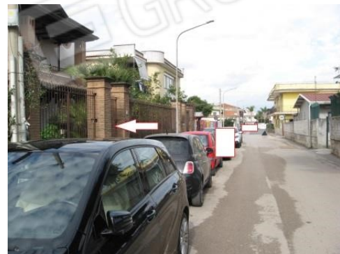
Figura 4 Accesso all'immobile da via San Giuseppe Lavoratore n.47 – Parete