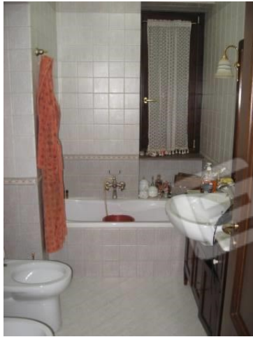
Figura 12 bagno 1