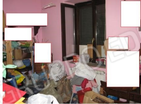
Figura 23 camera da letto 3