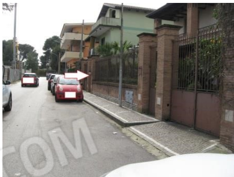
Figura 3 Accesso all'immobile da via San Giuseppe Lavoratore n.47 – Parete