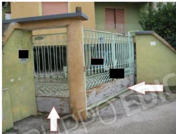
Figura 4 Facciata Nord su via Colonne n.133 – Giugliano in Campania