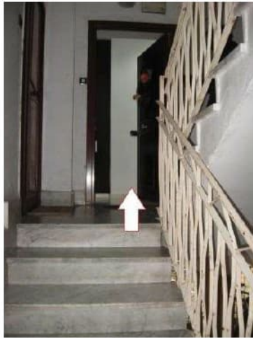
Figura 10 accesso all'appartamento pignorato