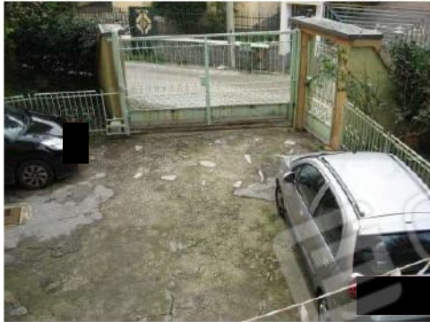
Figura 8 cortile comune sub 6 del Condominio Barbato