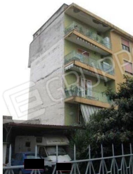
Figura 7 facciata nord/est del Condominio Barbato alla via degli Abeti n.8 in Aversa