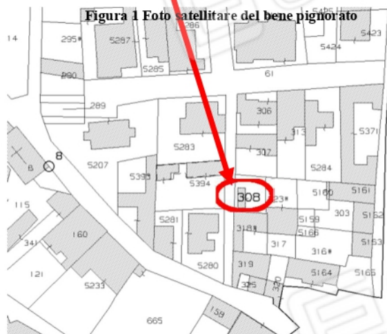
Figura 2 Mappa catastale - foglio 3 Comune di Aversa