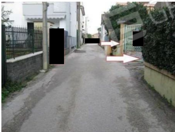
Figura 3 Facciata Nord ed accesso al Parco Guarino da via Colonne n.133 – Giugliano in Campania