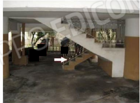
Figura 9 cortile e scala comune sub 6 del Condominio Barbato