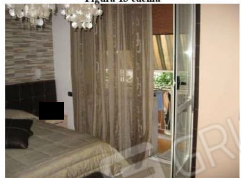
Figura 15 camera da letto 1