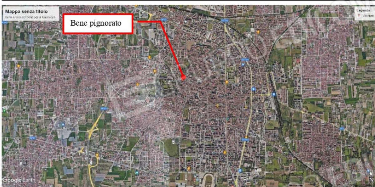
Figura 5 Collocazione del bene pignorato nel contesto urbano del Comune di Aversa