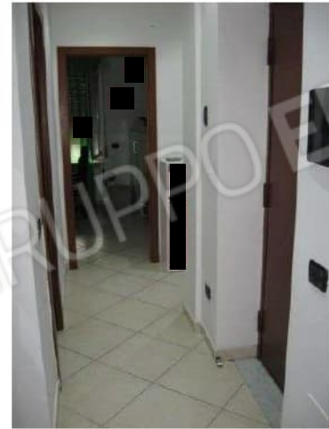
Figura 11 disimpegno