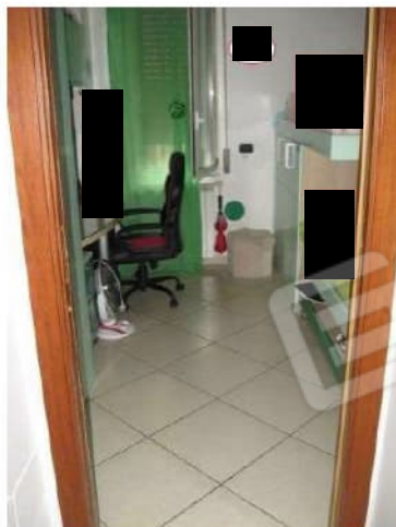
Figura 16 camera da letto 2