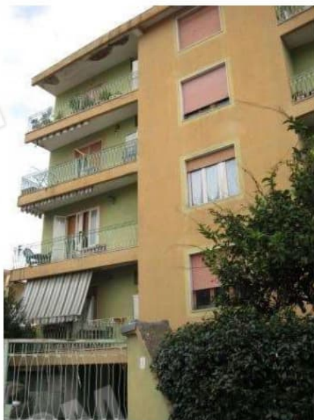
Figura 6 facciata est del Condominio Barbato alla via degli Abeti n.8 in Aversa