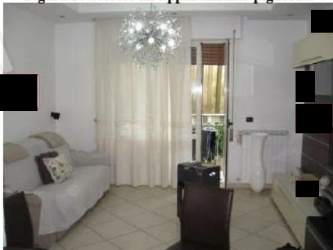
Figura 12 salone