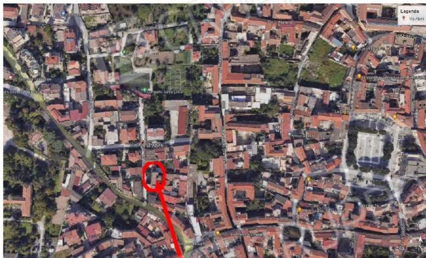
Figura 1 Foto satellitare del bene pignorato