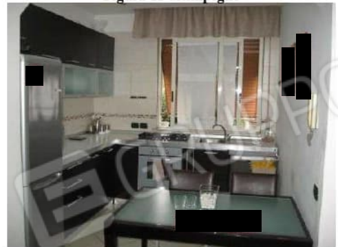
Figura 13 cucina