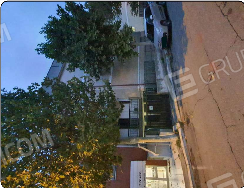
Foto 14: Ingresso alla rampa a servizio dei box auto in via Enrico Toti civ. 26, Cassano delle Murge, Bari