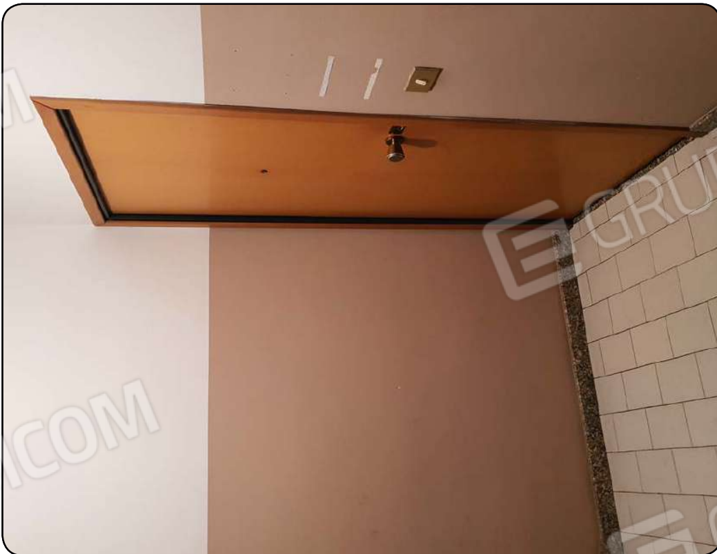
Foto 4: Ingresso all'abitazione posta al piano rialzato della scala A del complesso condominiale

Firmato Da: Quagliariello Matteo Emesso Da: ArubaPEC S.p.A. NG CA 3 Serial#: 66af5b2aubbba4374cf6126ecc865c5