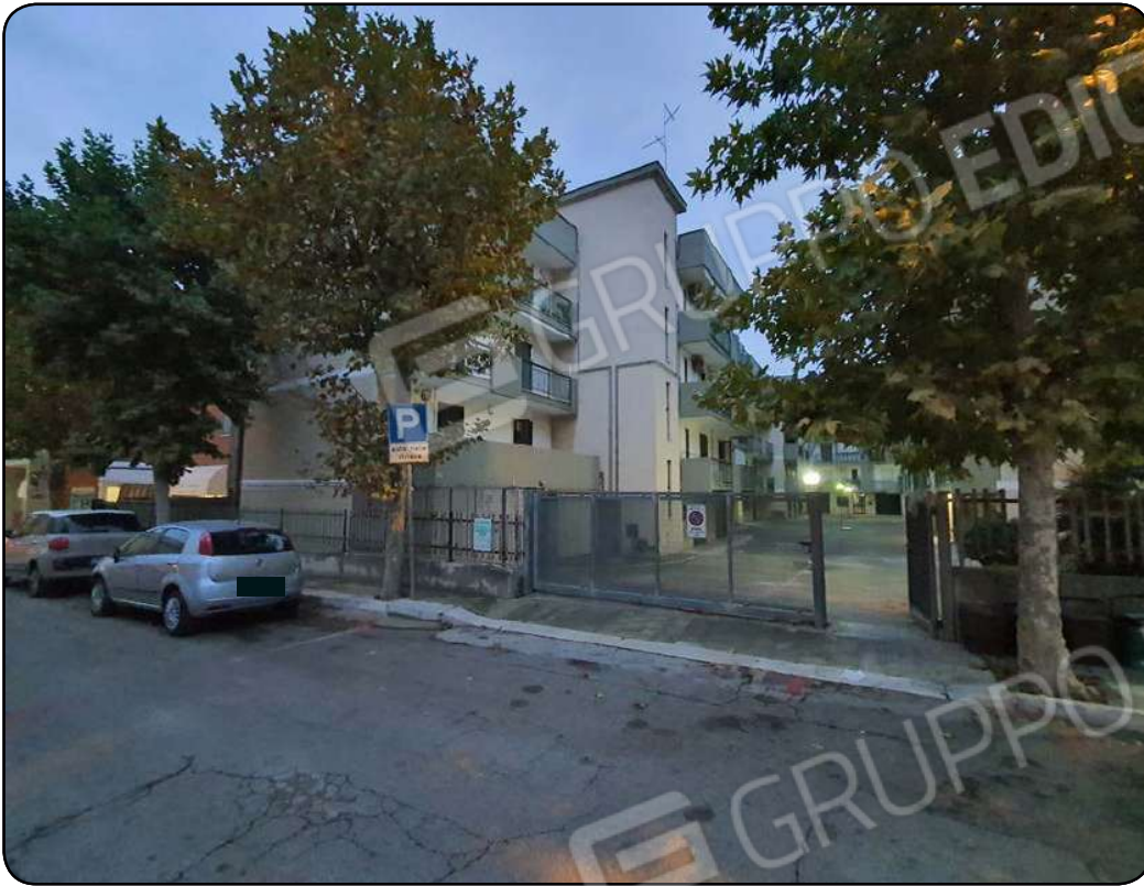
Foto 1: Ingresso principale al complesso condominiale in via Enrico Toti civ. 26, Cassano delle Murge, Bari