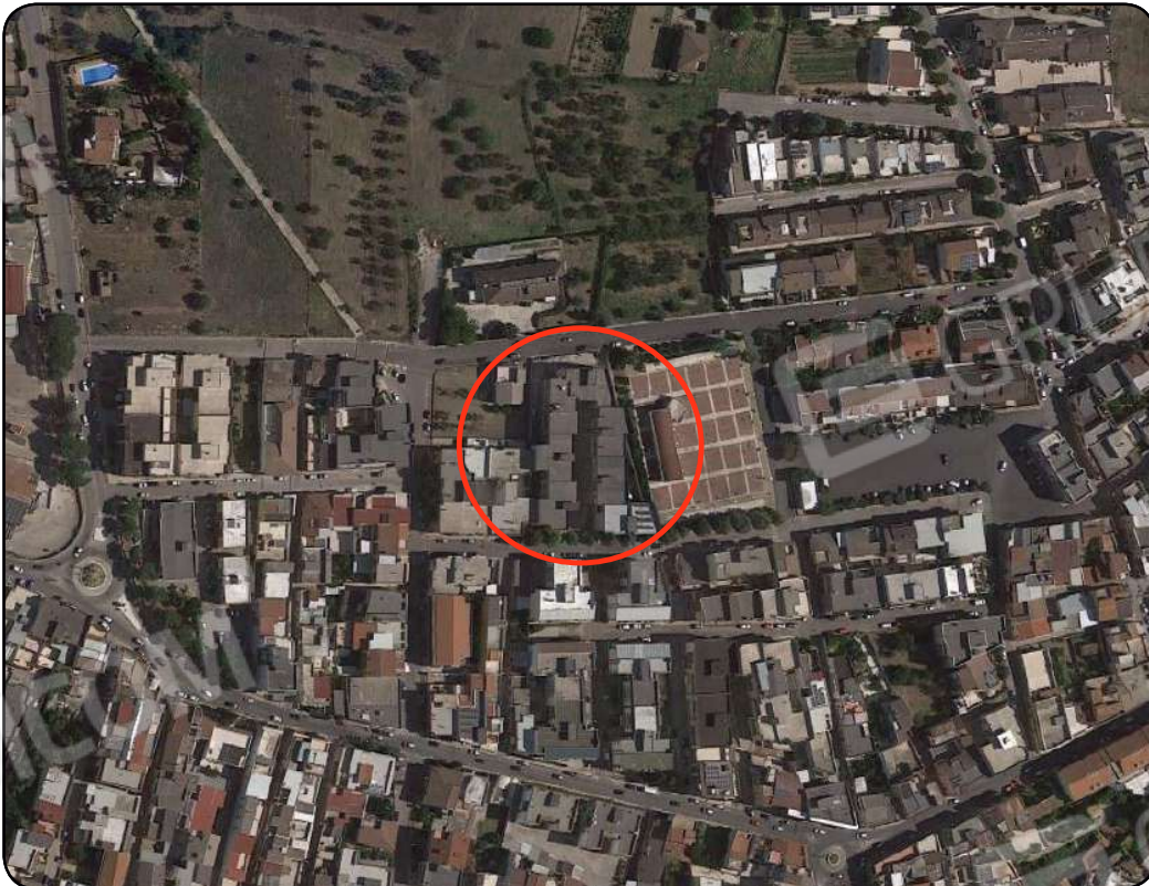
Immagine 2: Ortofoto estratta da Google Earth con indicazione del complesso condominiale nell'ambito dell'isolato urbano di appartenenza

Firmato Da: Quagliariello Matteo Emesso Da: ArubaPEC S.p.A. NG CA. 3 Serial#: 66af5b2aubbba4374cf6126ecc865c5