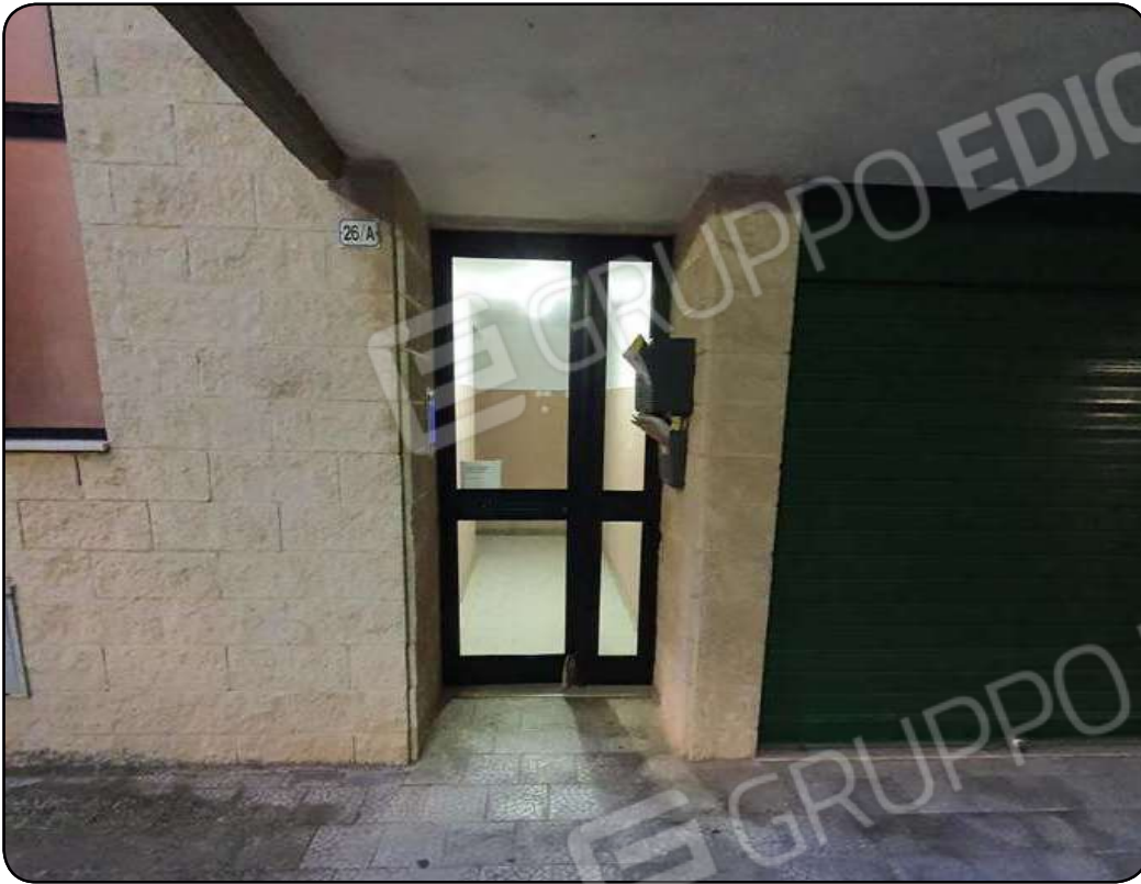
Foto 3: Portone d'ingresso della scala A a servizio dell'abitazione in stima

Esperto Incaricato: Dr. Ing. Matteo QUAGLIARIELLO