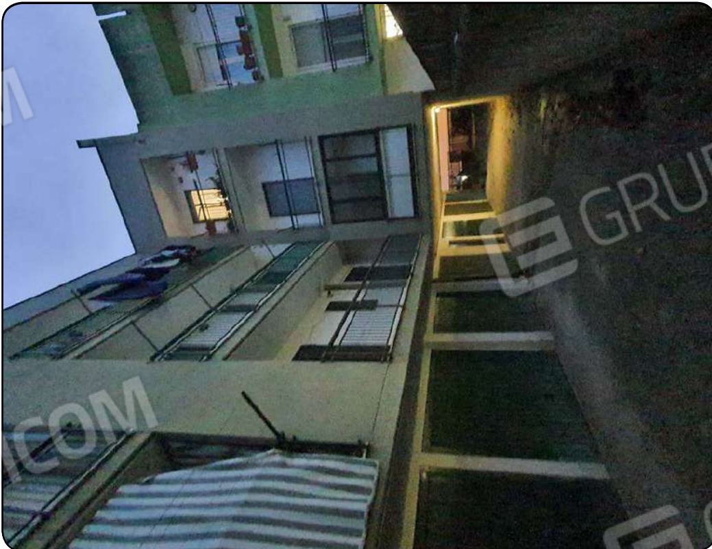
Foto 16: Corsia di manovra prospiciente i box auto al piano seminterrato

Firmato Da: Quagliariello Matteo Emesso Da: ArubaPEC S.p.A. NG CA. 3 Serial#: 66af5b2aubdba4374cf6126ecc865c5