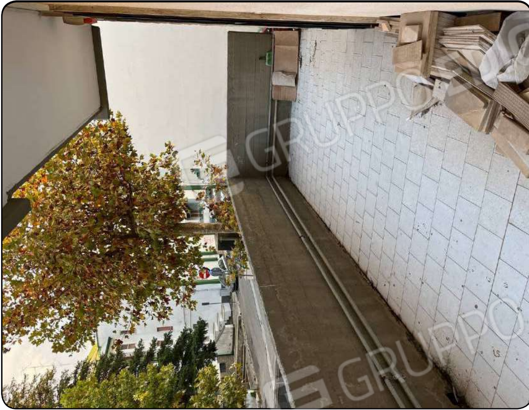
Foto 11: Balcone n. 1 prospiciente il cortile interno del complesso condominiale

Esperto Incaricato: Dr. Ing. Matteo QUAGLIARIELLO