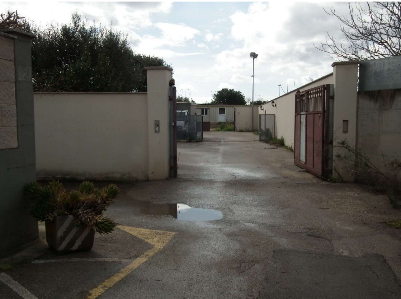
Foto 2: Cancello di accesso alla particella 999 e, tramite questa, alla particella 1001