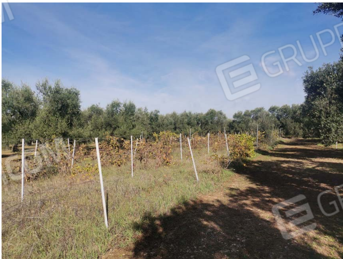
4. vista lato est