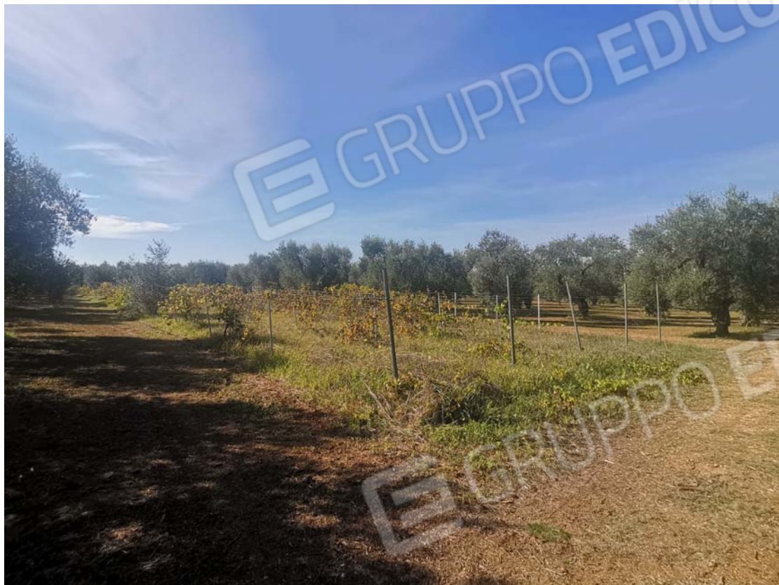
5. vista da nord est