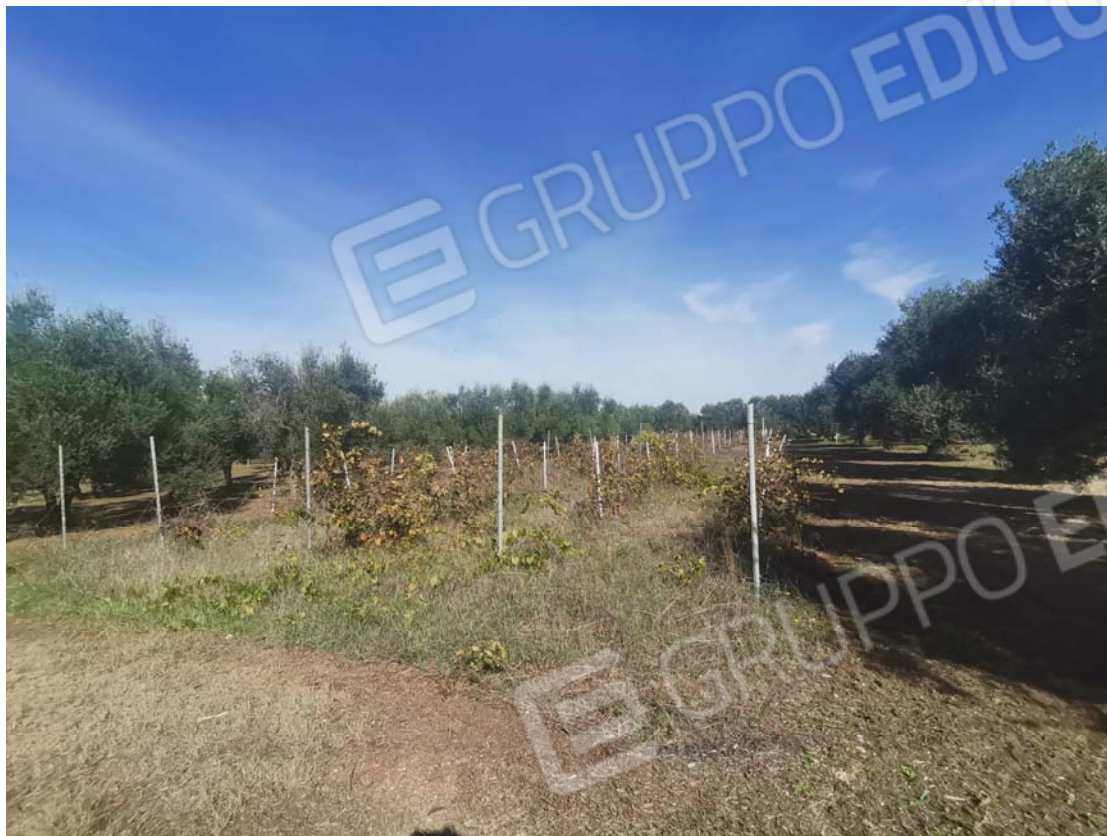
3. vista da sud