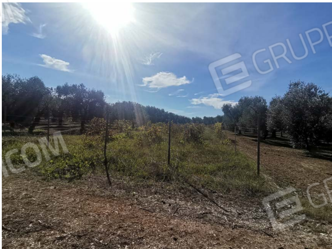
6. vista da nord