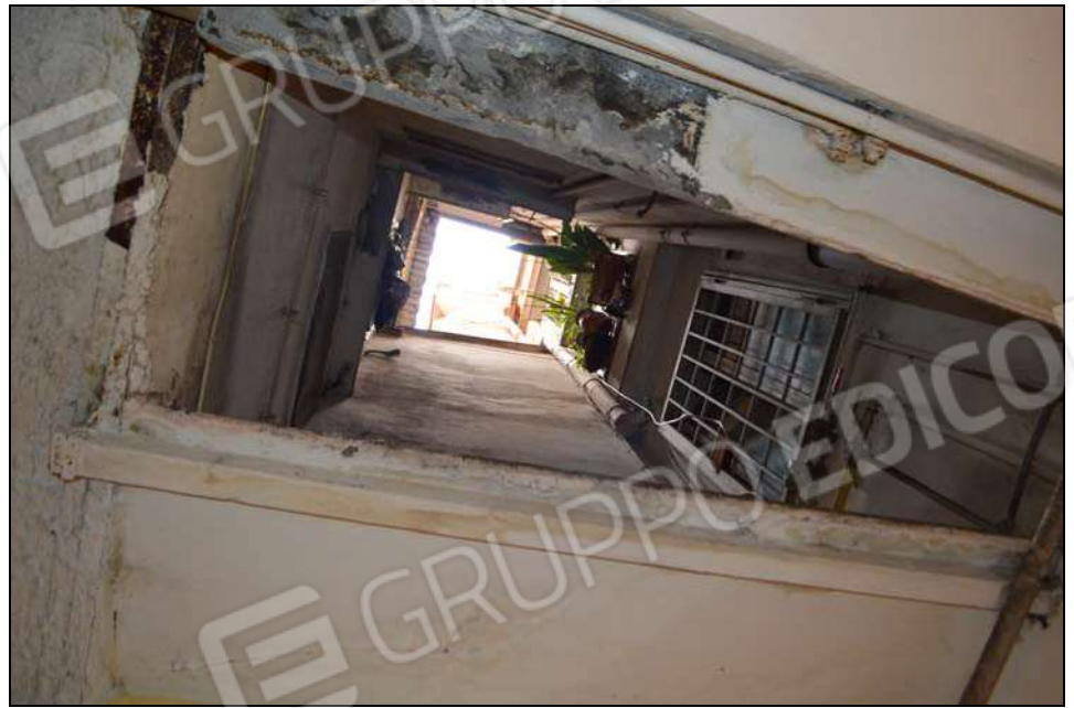
Foto n. 3, n. 4 - Androne di ingresso condominiale e chiostrina