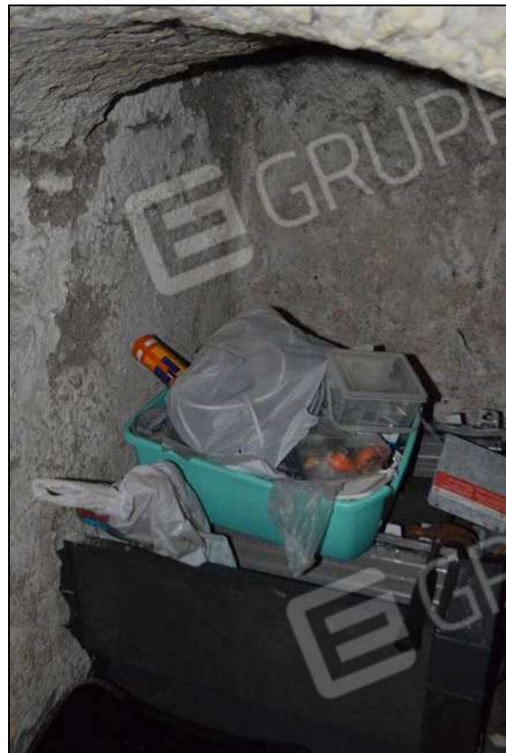
Foto n. 9, n. 10 - Nicchia sottoscala