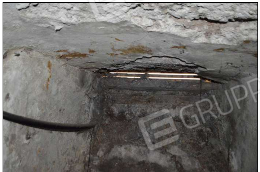
Foto n. 15, n. 16 – Particolare scale di accesso locale posteriore e bocca di lupo