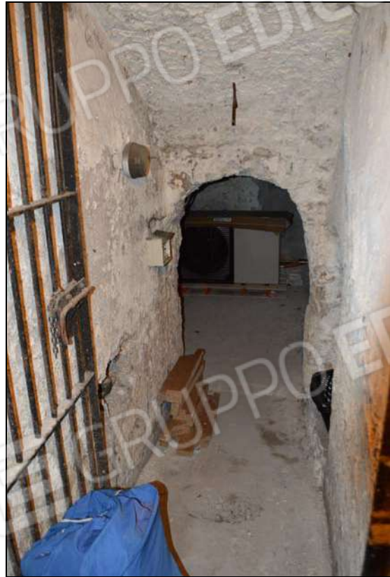
Foto n. 7, n. 8 - Ingresso locale deposito