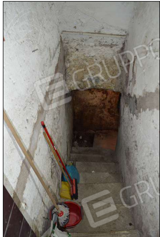
Foto n. 5, n. 6 - Ingresso condominiale al piano interrato