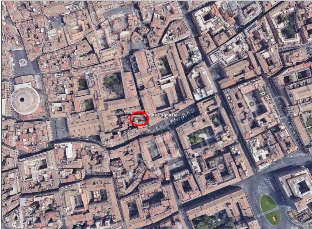
Inquadramento fabbricato Via di Sant' Ignazio 11 da foto aerea