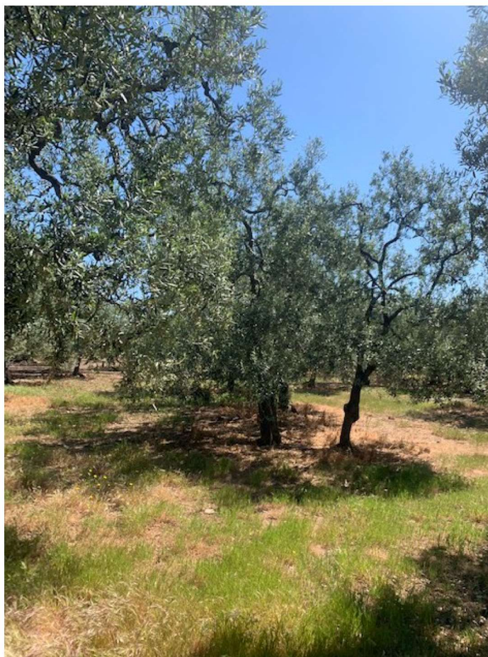
2. terreno con ulivi