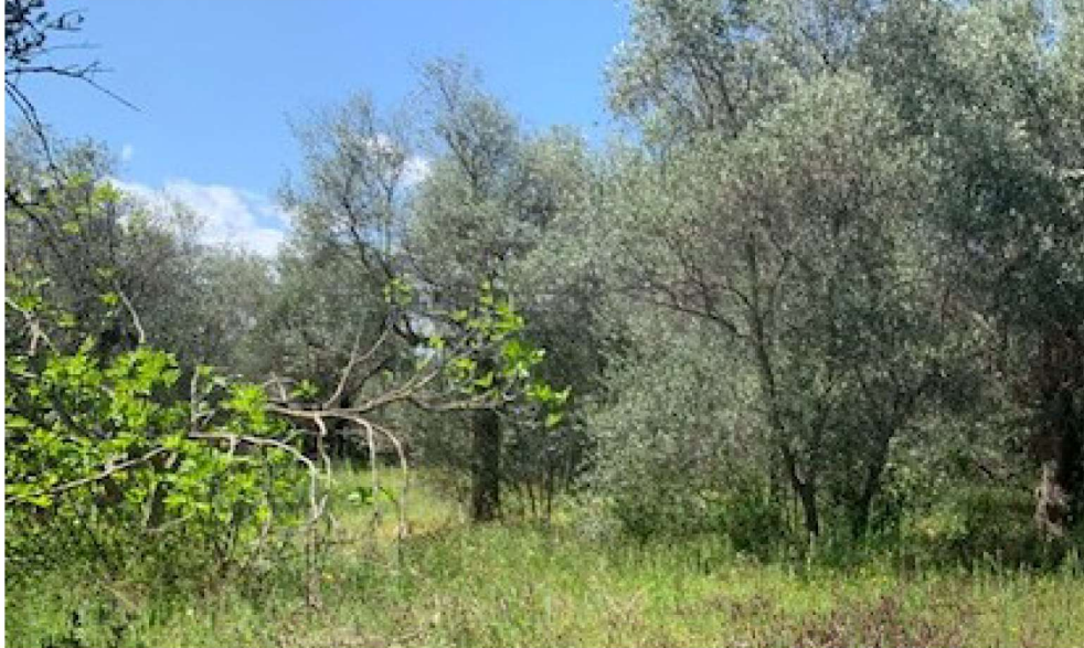
3. terreno incolto con ulivi

Al di là della strada è ubicata una cava ( lotto 1).