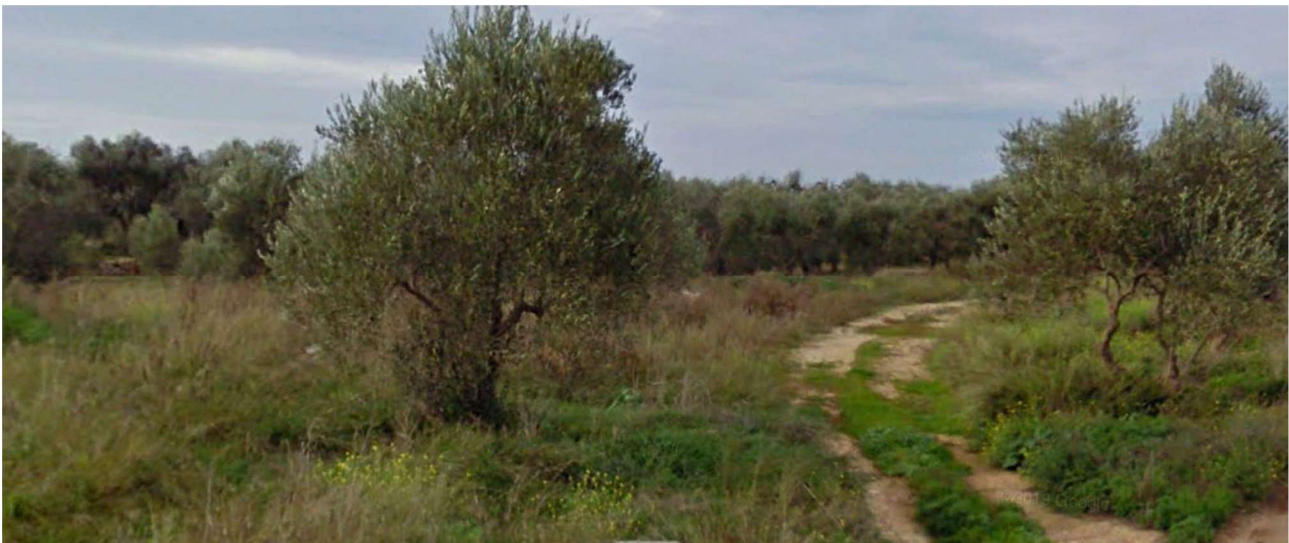
4. terreno incolto con ulivi