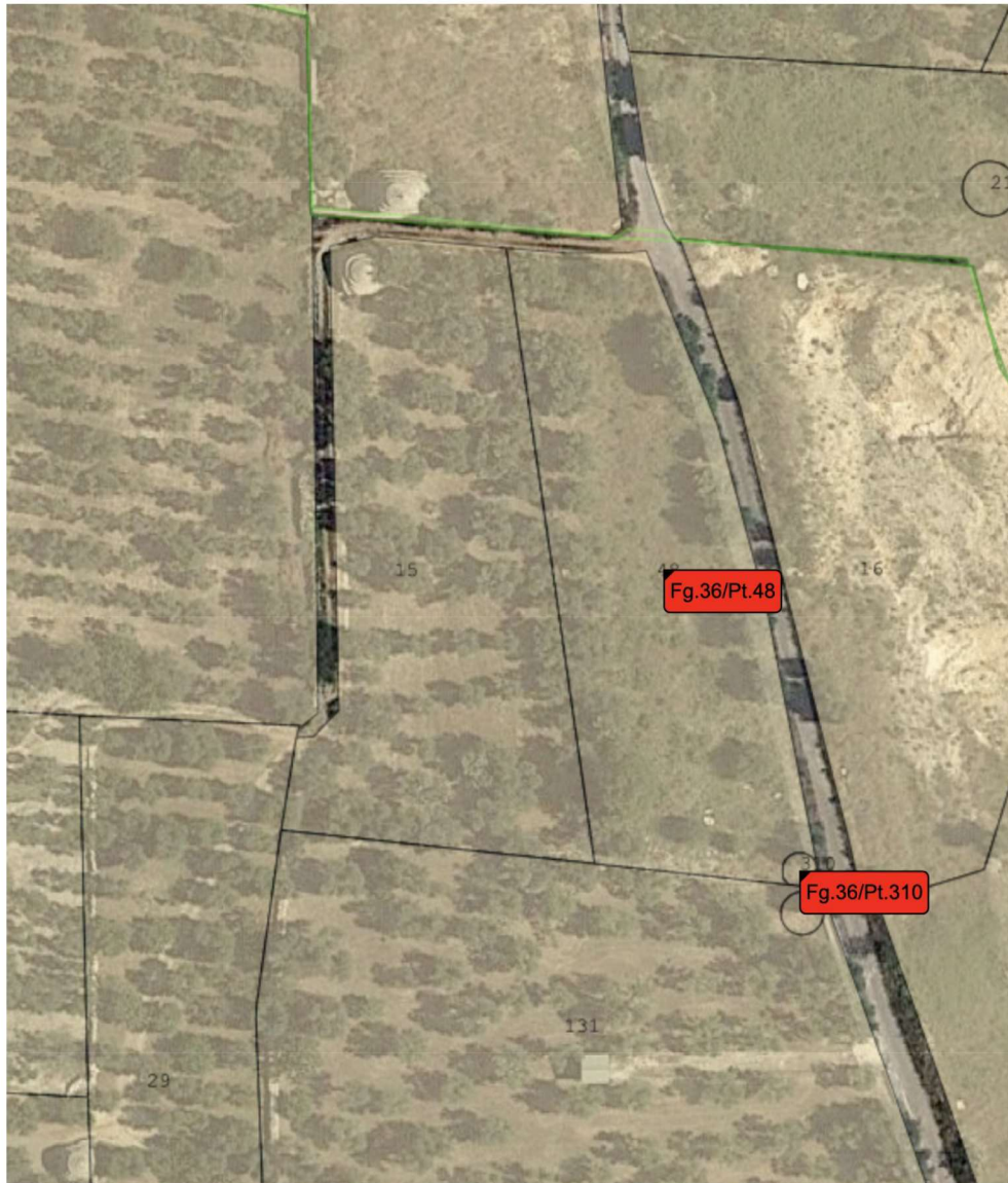
1. ORTOFOTO con indicazione confini particelle catastali

Il terreno ha l'accesso diretto dalla strada dai confini Nord ed Est .