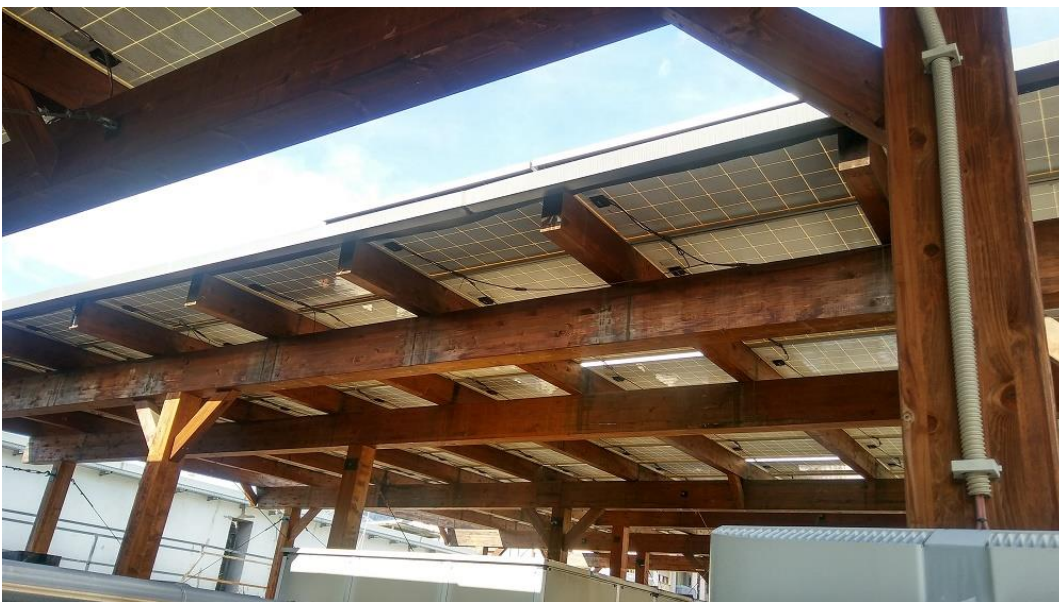
Figura 6: Porzione su tettoia