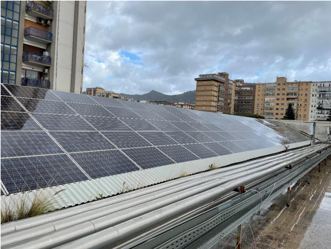
Figura 5: Particolare moduli