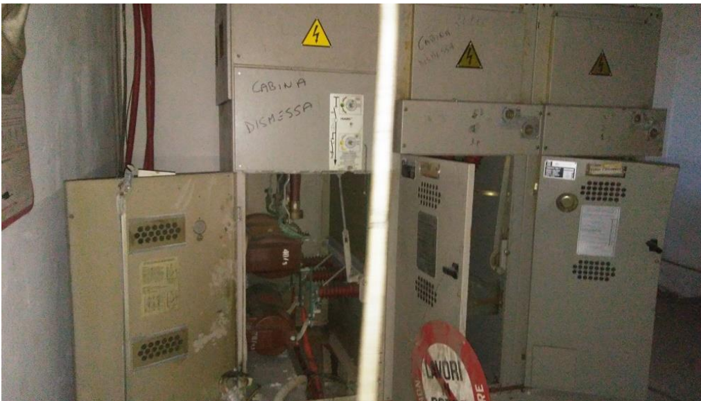
Figura 14: Alloggio cabina