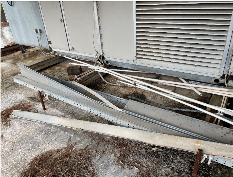
Figura 12: Canaline e tubazioni danneggiate