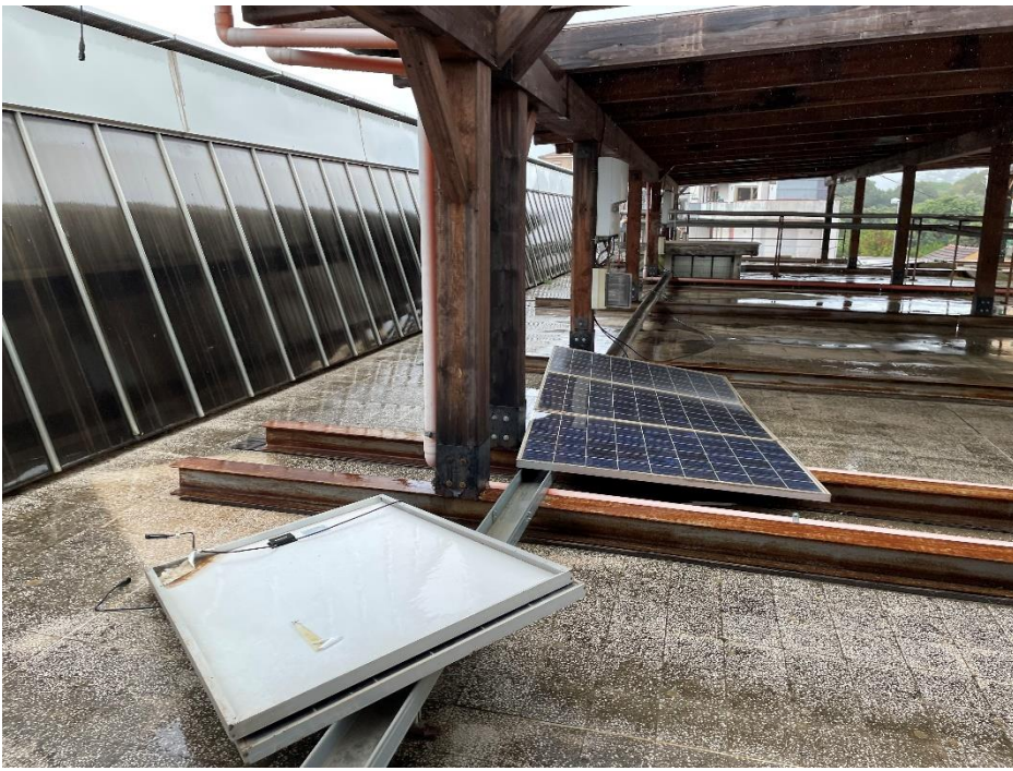
Figura 13: Moduli danneggiati