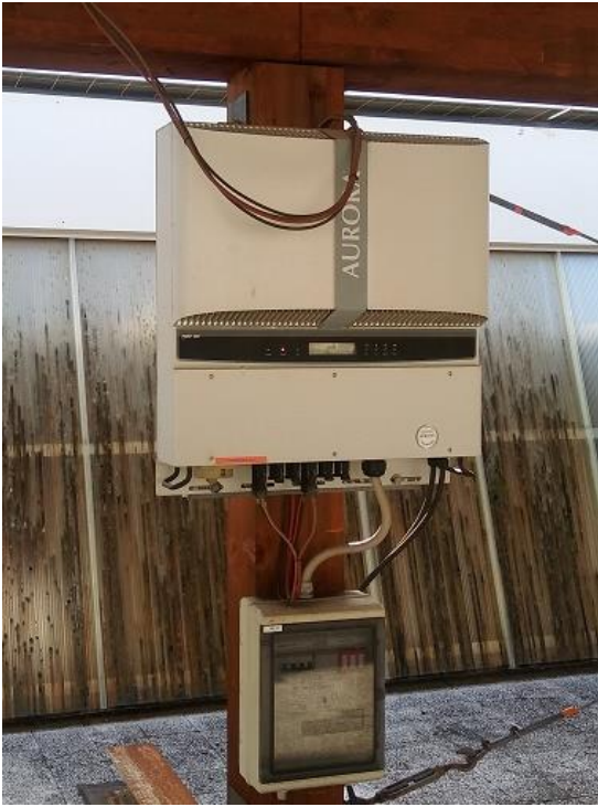
Figura 9: inverter