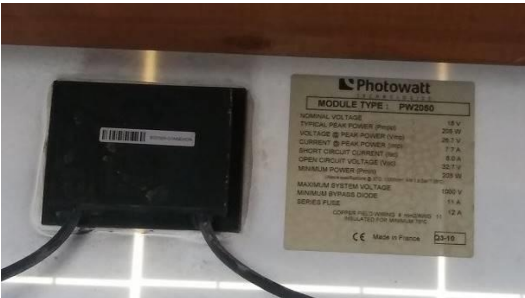
Figura 8: Etichetta moduli