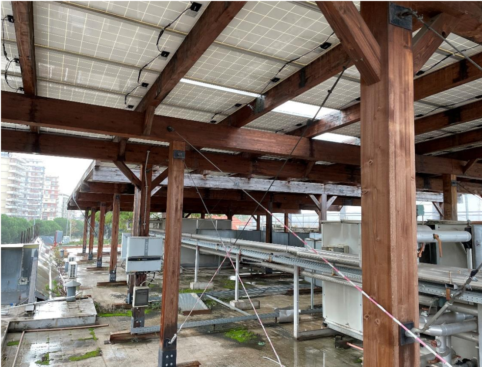
Figura 7: Porzione su tettoia