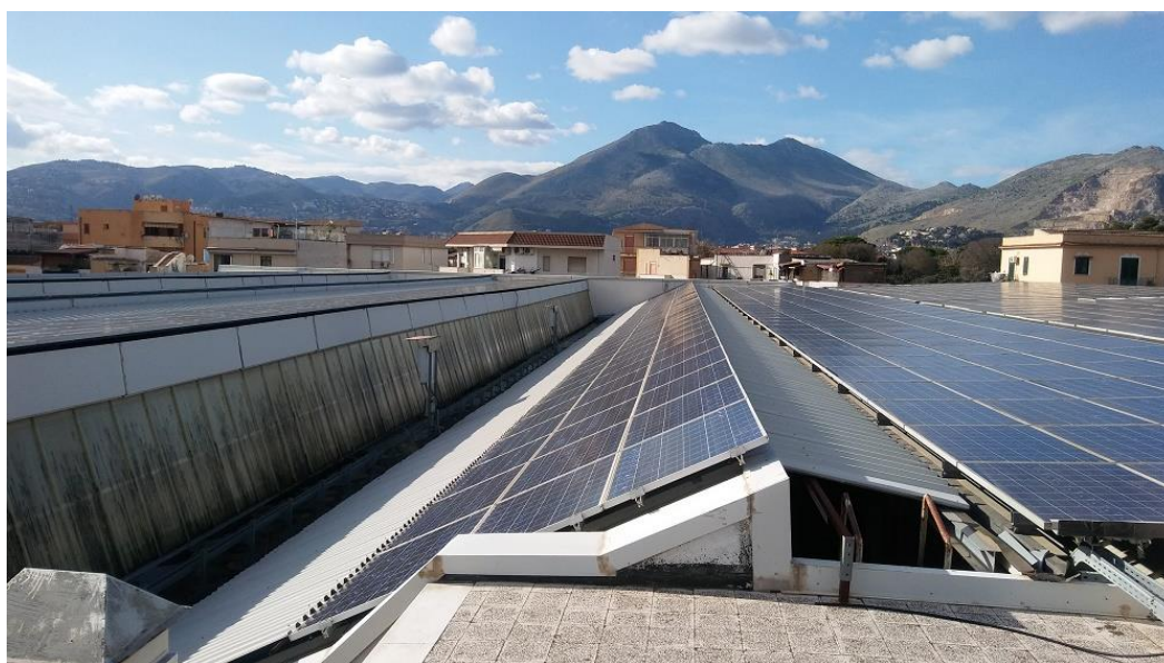
Figura 2: Globale impianto