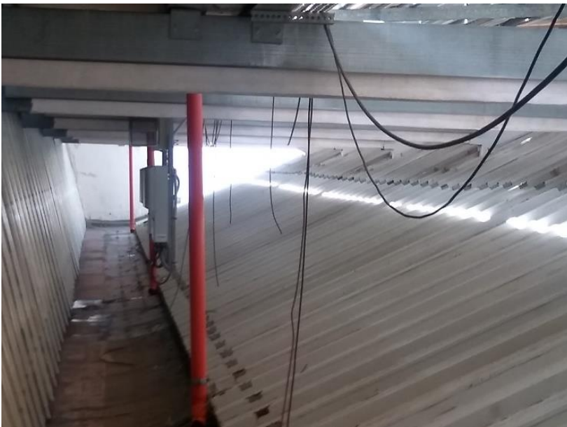
Figura 10: Cavi solari ai quadri stringa interrotti