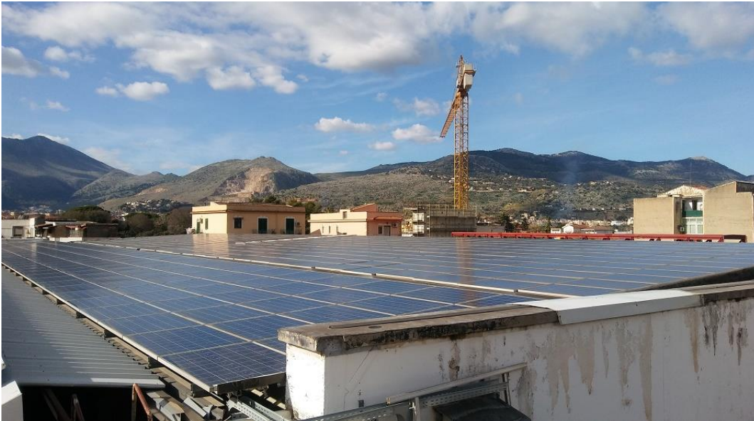
Figura 3: Globale impianto