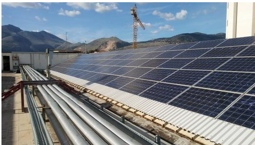
Figura 1: Globale impianto