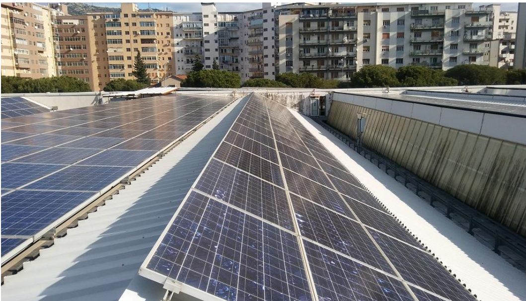
Figura 4: Particolare moduli