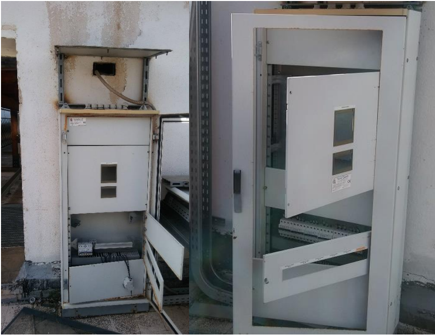
Figura 11: Quadro con interruttore e cavi asportati