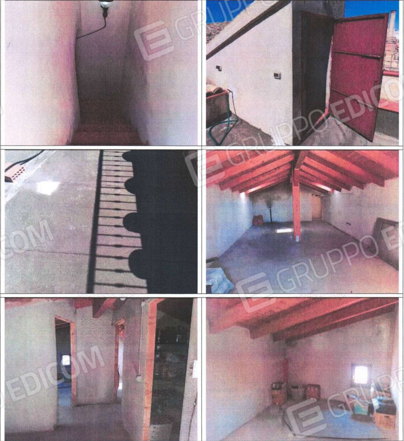
Unità immobiliare censita in catasto al foglio n° 42, particella n° 70, sub. 2 e particella n° 72, sub. 16