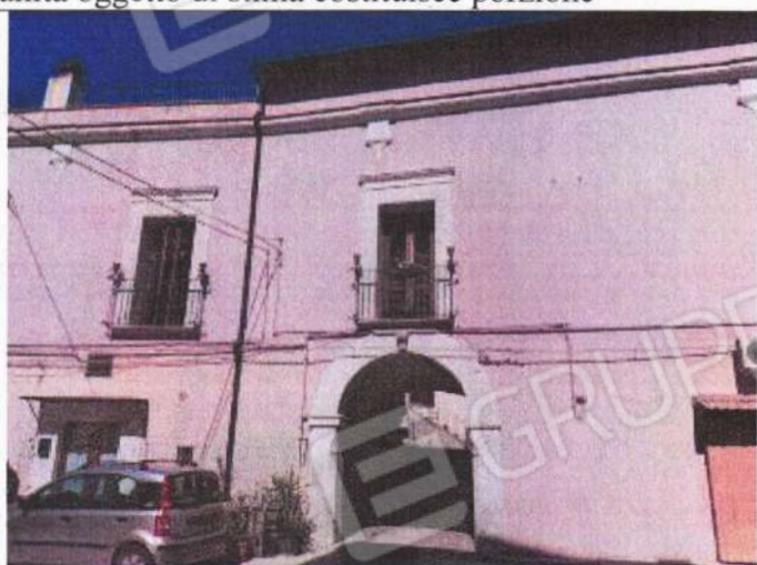
Vista esterna del complesso edilizio di cui l'unità oggetto di stima costituisce porzione