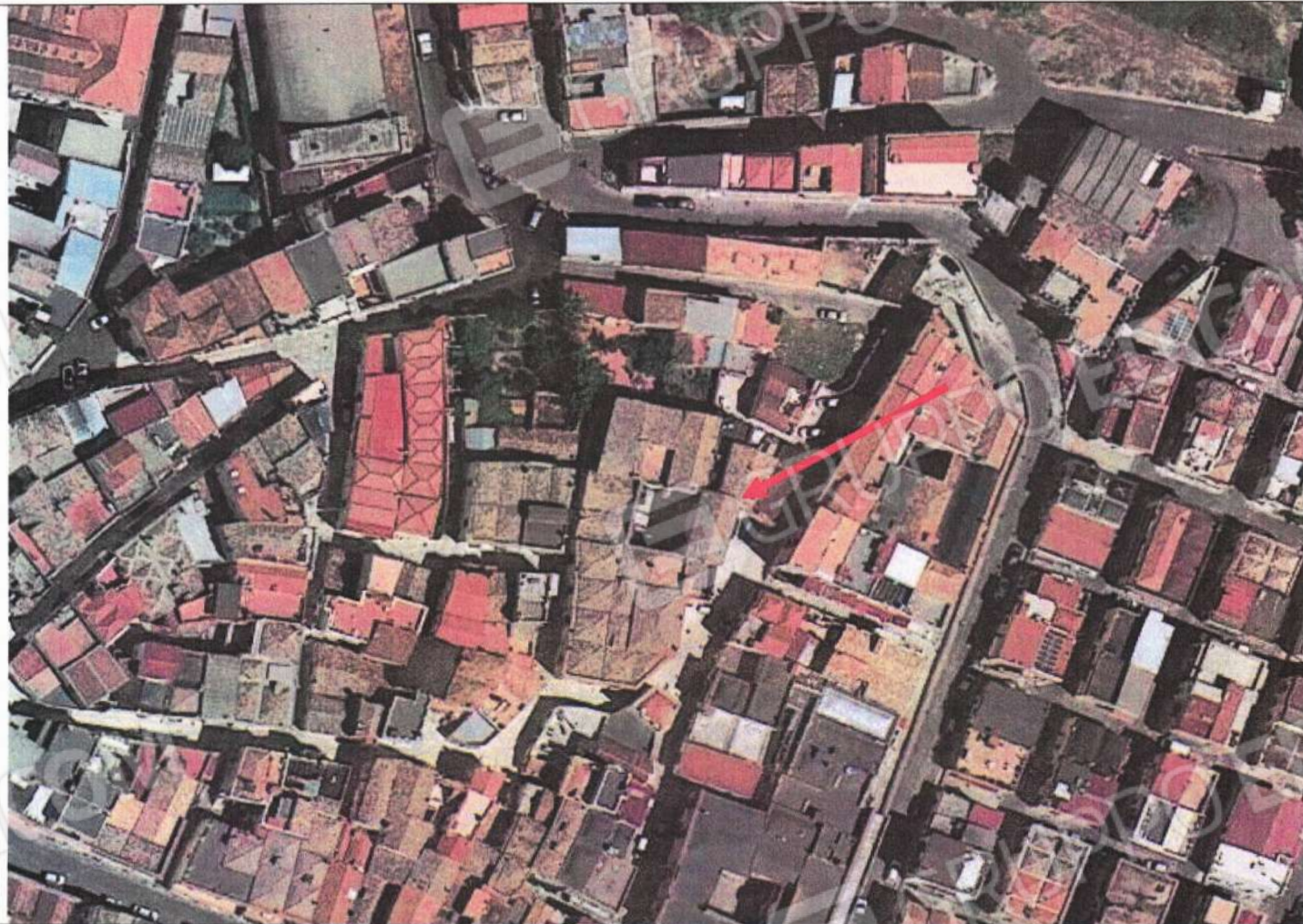
Veduta aerea del complesso edilizio di cui l'unità oggetto di stima costituisce porzione