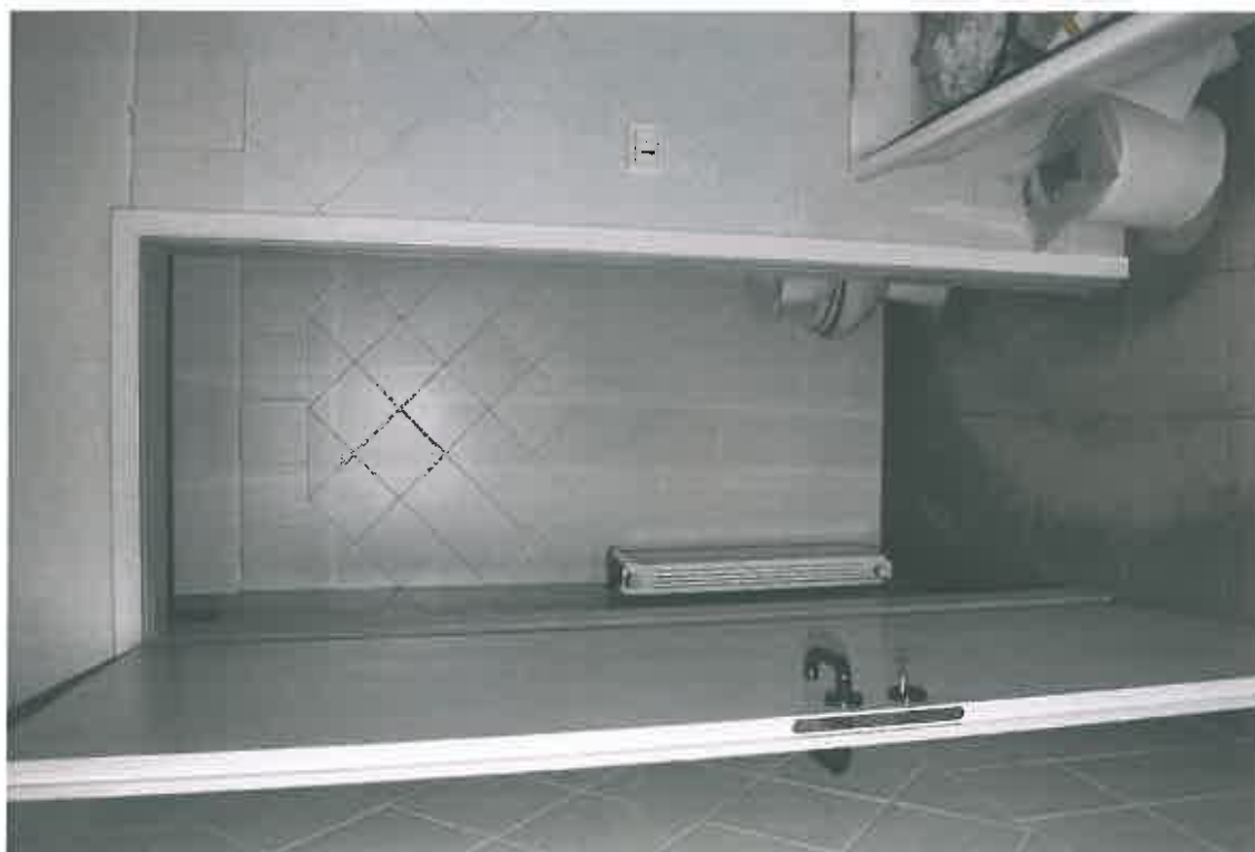
VISTA ZONA SERVIZI SUB 105