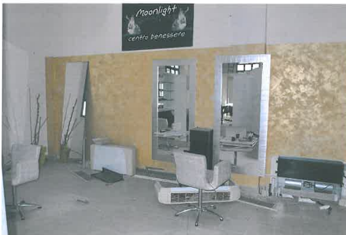
VISTA LOCALE ATTIVITA' ARTIGIANALE SUB 101