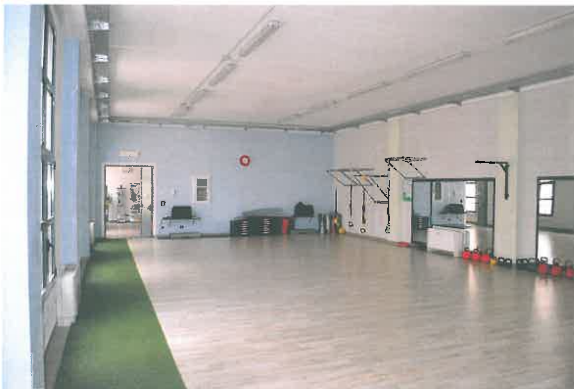
VISTA LOCALE ATTIVITA' ARTIGIANALE SUB 107