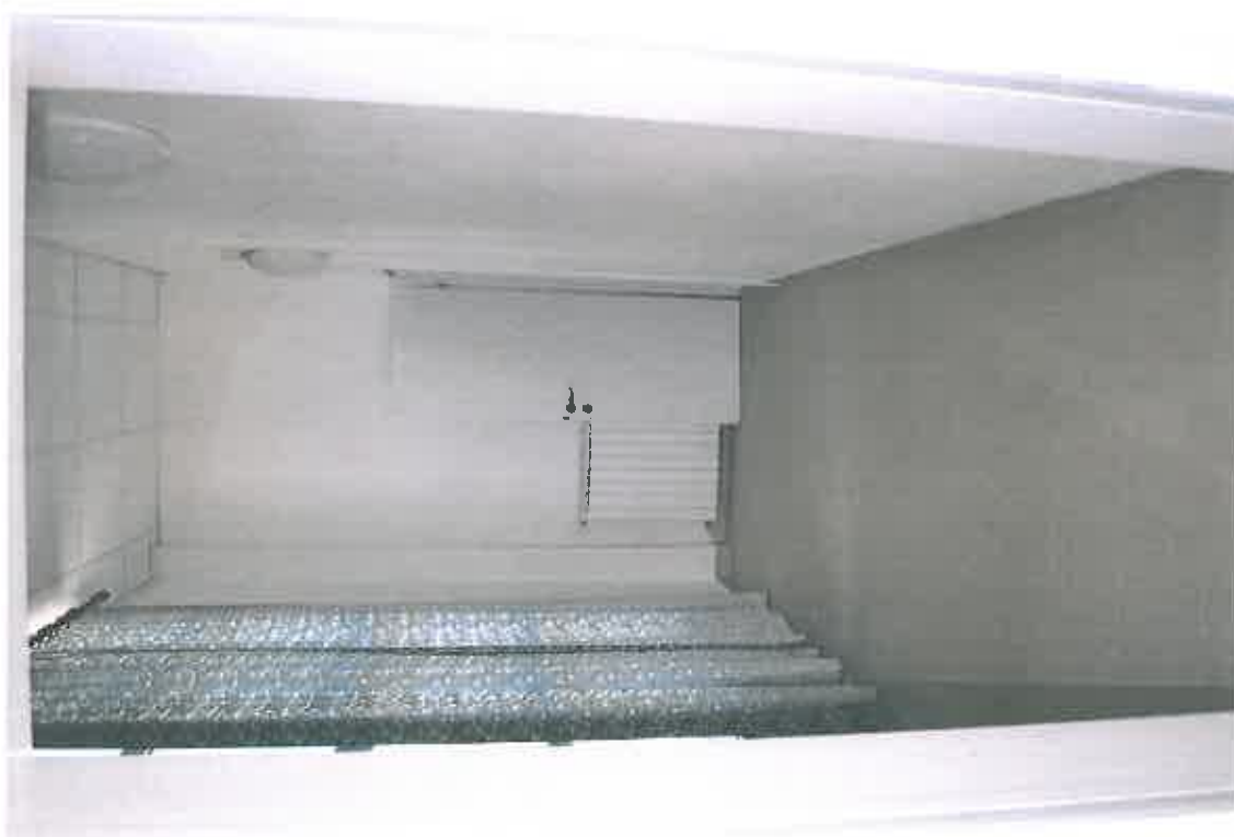
VISTA ZONA SERVIZI SUB 108