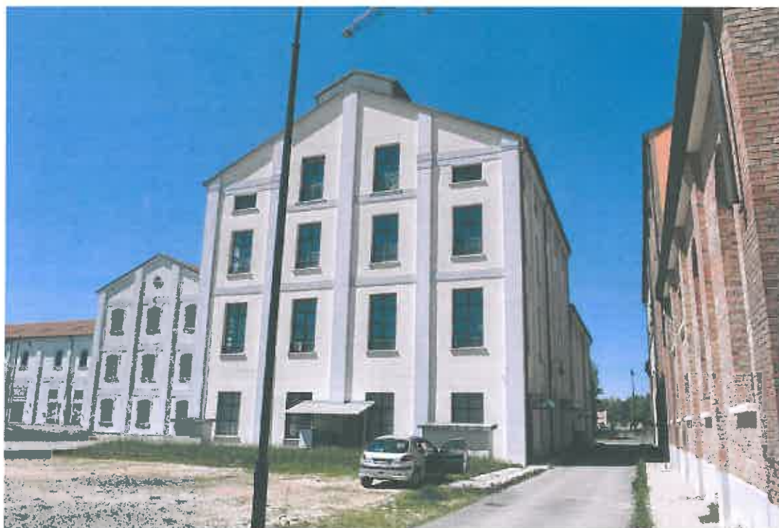
VISTA PROSPETTI NORD-EST