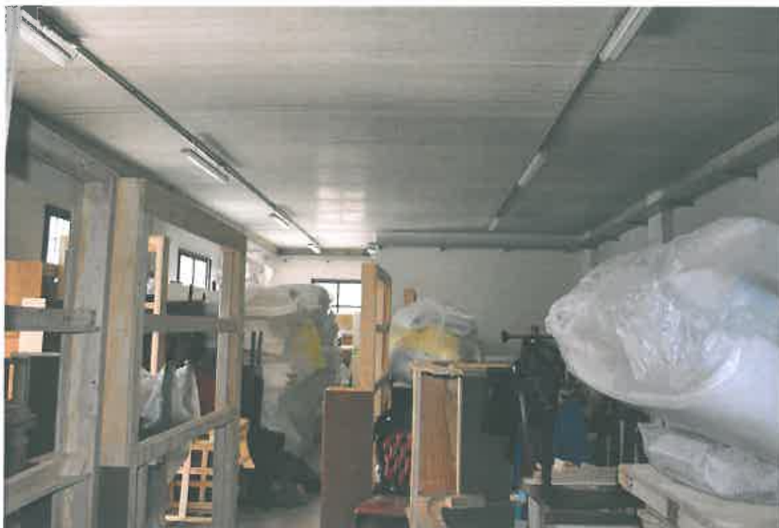
VISTA LOCALE ATTIVITA' ARTIGIANALE SUB 105