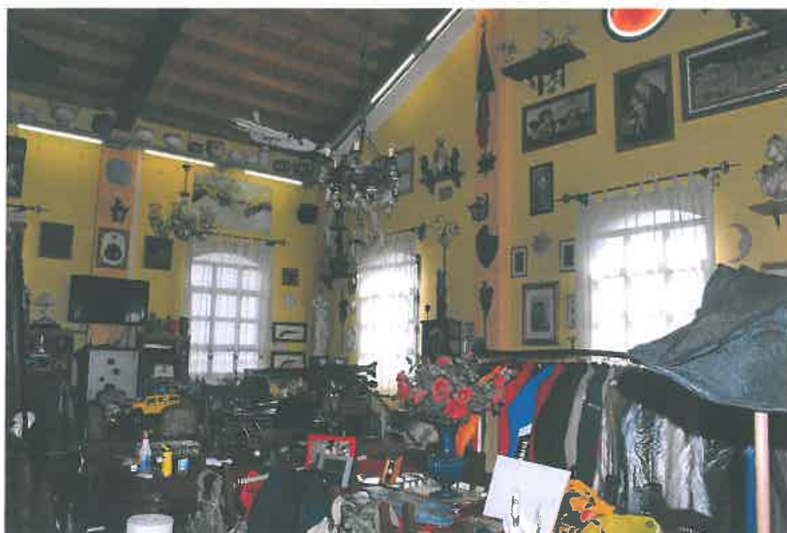
VISTA LOCALE ATTIVITA' ARTIGIANALE SUB 94