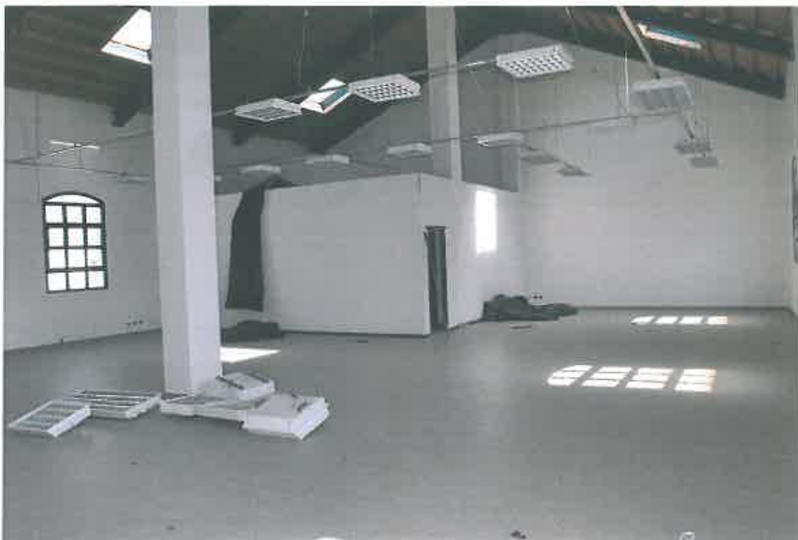
VISTA LOCALE ATTIVITA' DIREZIONALE SUB 100