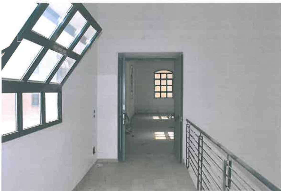
VISTA INGRESSO CONDOMINIALE PIANO PRIMO