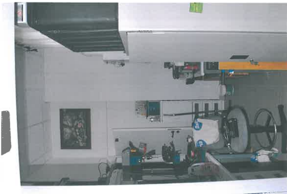
VISTA ZONA SERVIZI SUB 94