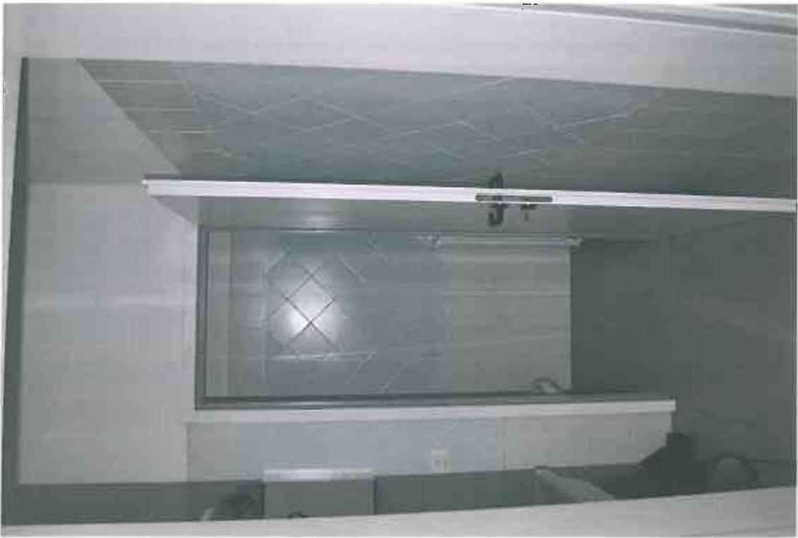
VISTA ZONA SERVIZI SUB 106