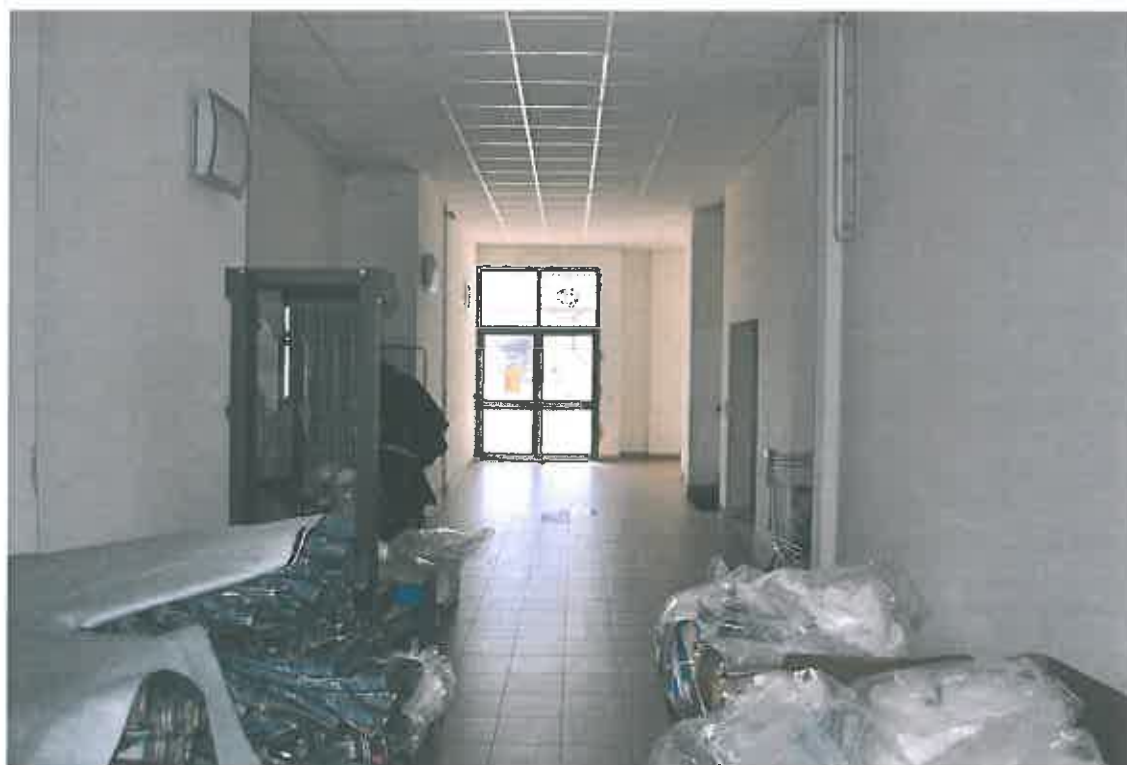
VISTA INGRESSO CONDOMINIALE PIANO TERRA