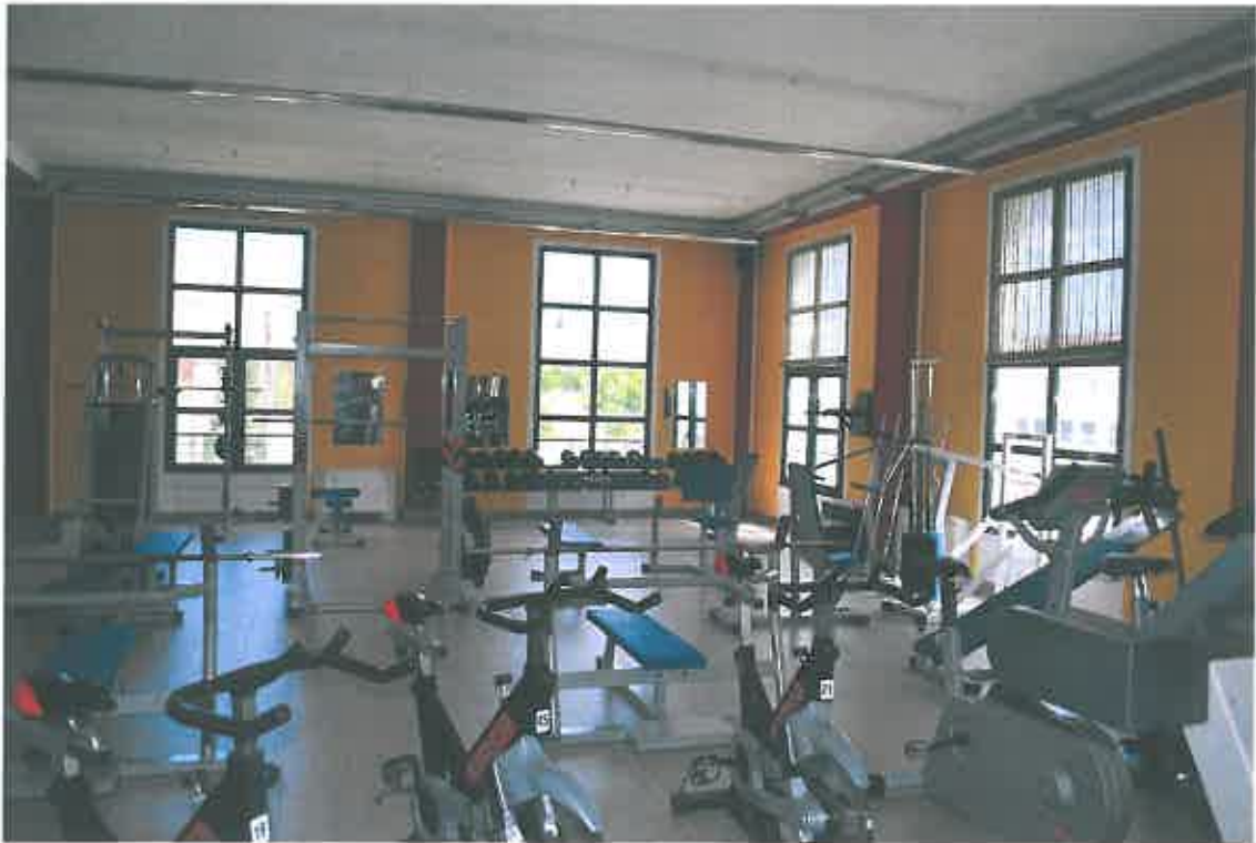
VISTA LOCALE ATTIVITA' ARTIGIANALE SUB 109