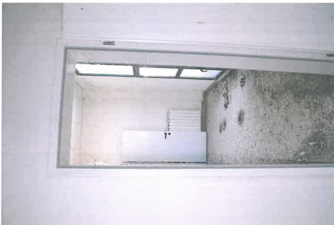
VISTA ZONA SERVIZI SUB 110