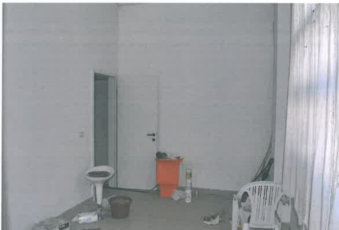
VISTA ZONA SERVIZI SUB 101