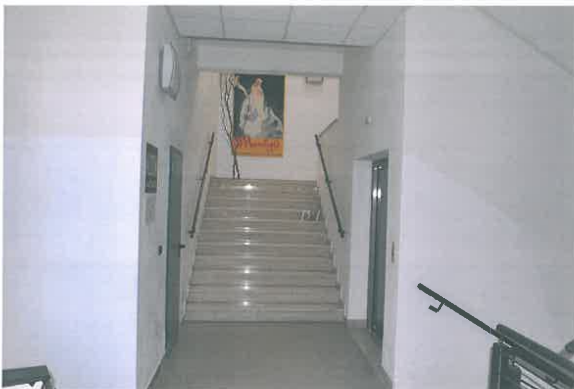
VISTA ZONA CONDOMINIALE PIANO PRIMO SUBB. 94-101-102