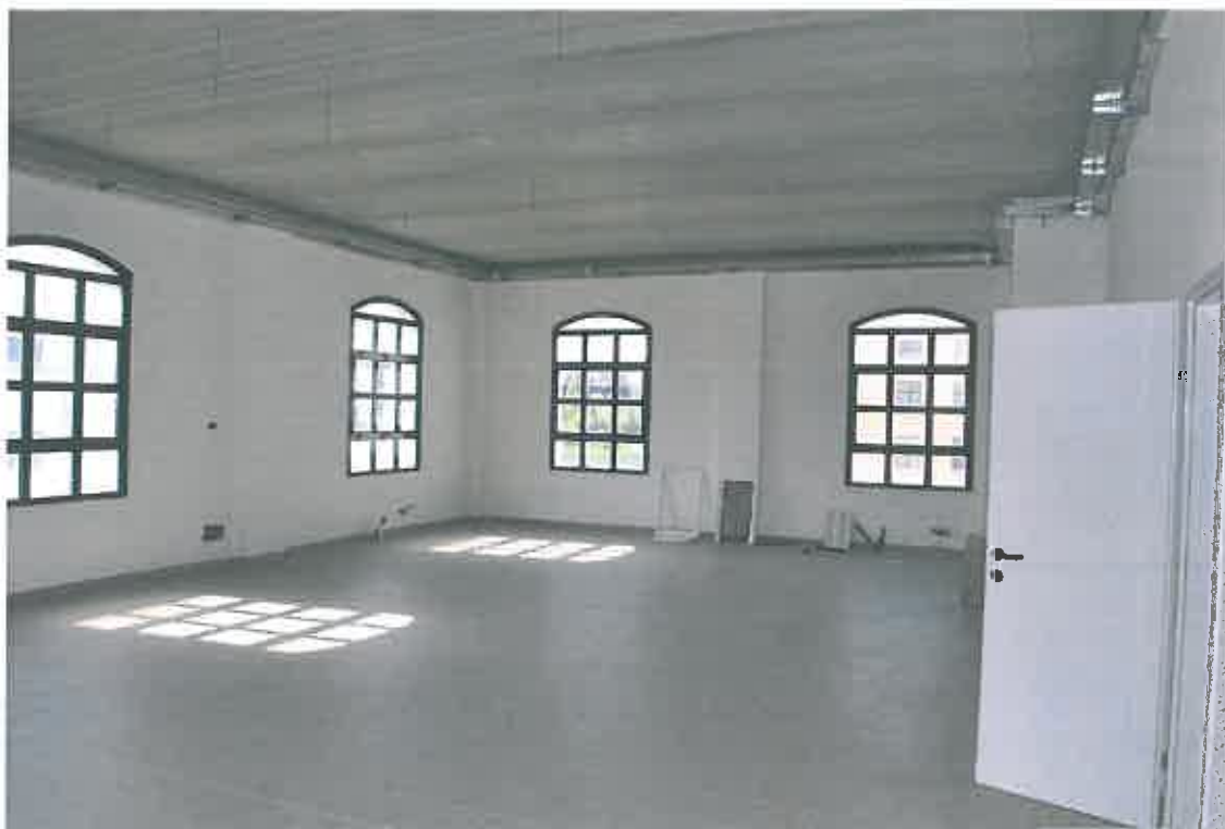
VISTA LOCALE ATTIVITA' ARTIGIANALE SUB 102