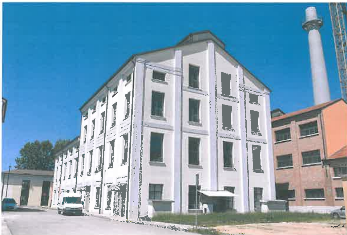
VISTA PROSPETTI SUD-EST