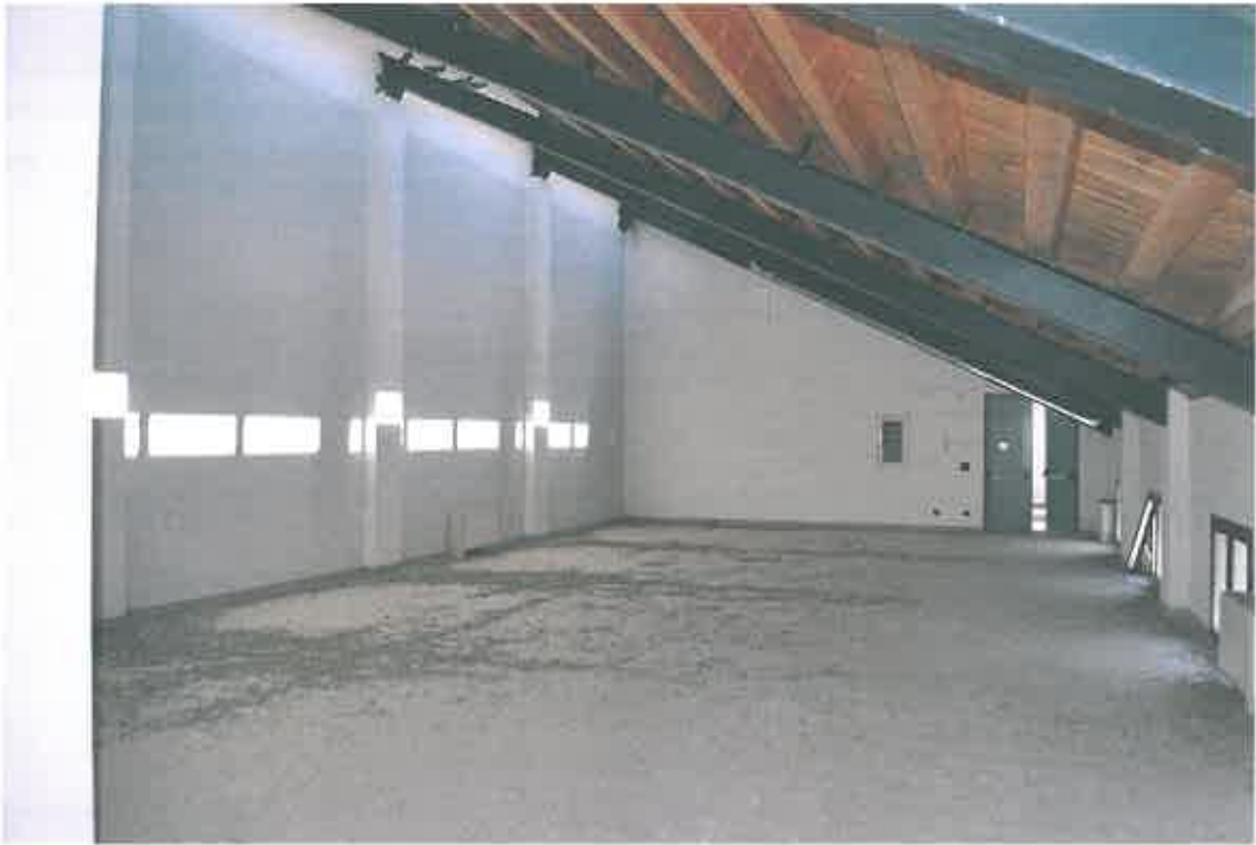
VISTA LOCALE ATTIVITA' ARTIGIANALE SUB 111