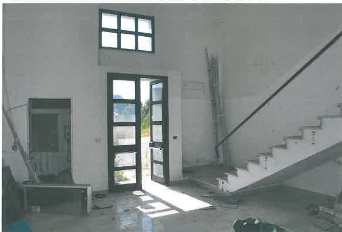
VISTA INGRESSO CONDOMINIALE SUBB. 99-100