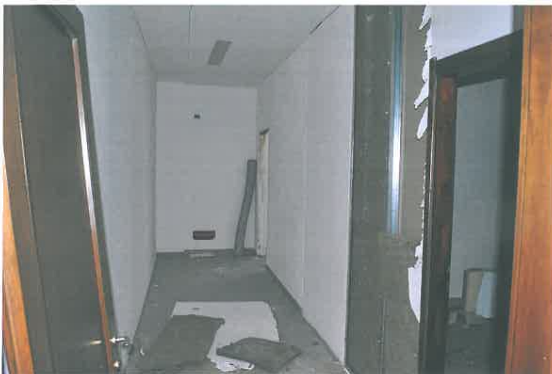
VISTA ZONA SERVIZI SUB 100