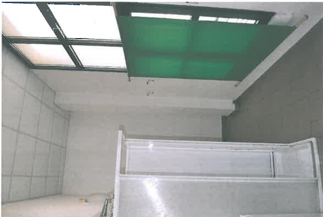
VISTA ZONA SERVIZI SUB 109