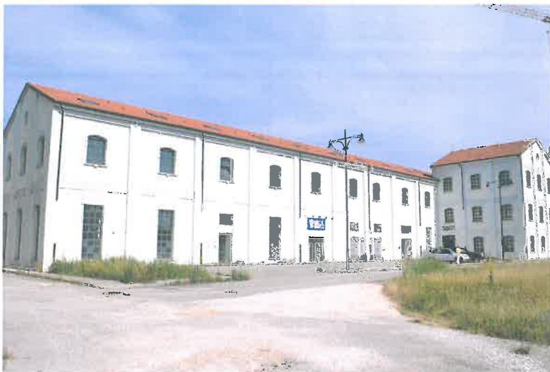
VISTA PROSPETTI SUD-EST