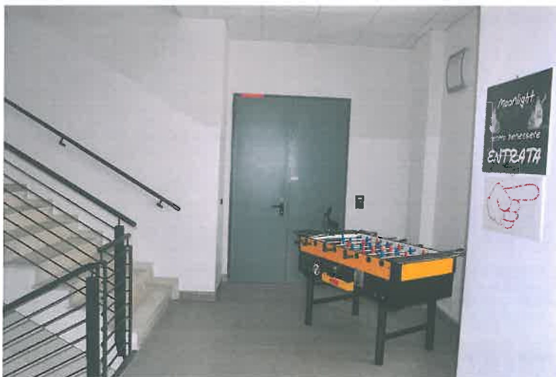
VISTA ZONA CONDOMINIALE PIANO PRIMO SUBB. 94-101-102