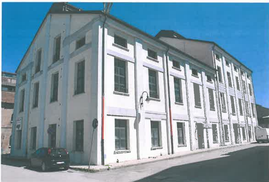
VISTA PROSPETTI SUD-OVEST