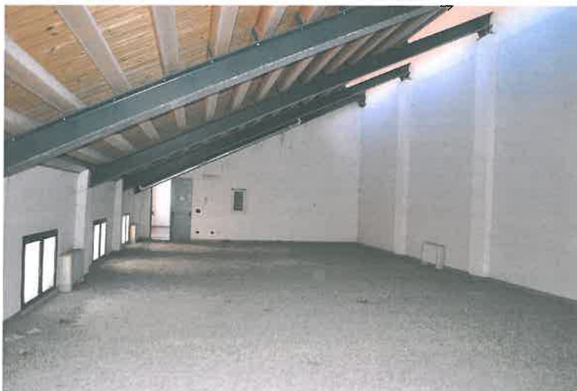
VISTA LOCALE ATTIVITA' ARTIGIANALE SUB 110