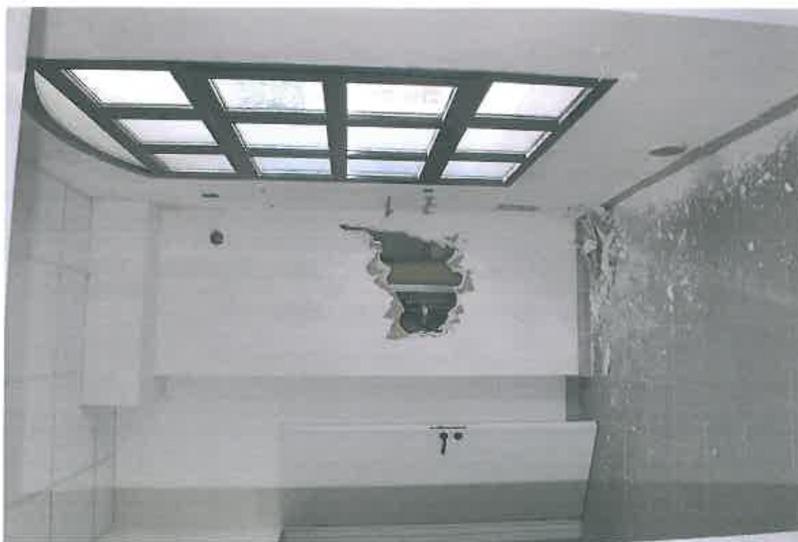
VISTA ZONA SERVIZI SUB 100