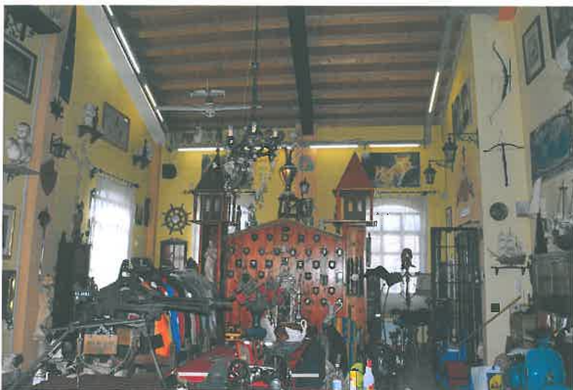
VISTA LOCALE ATTIVITA' ARTIGIANALE SUB 94