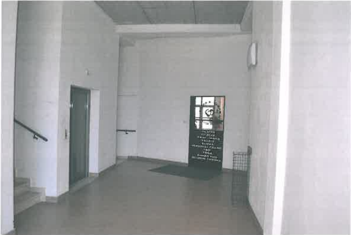
VISTA ZONA CONDOMINIALE PIANO PRIMO