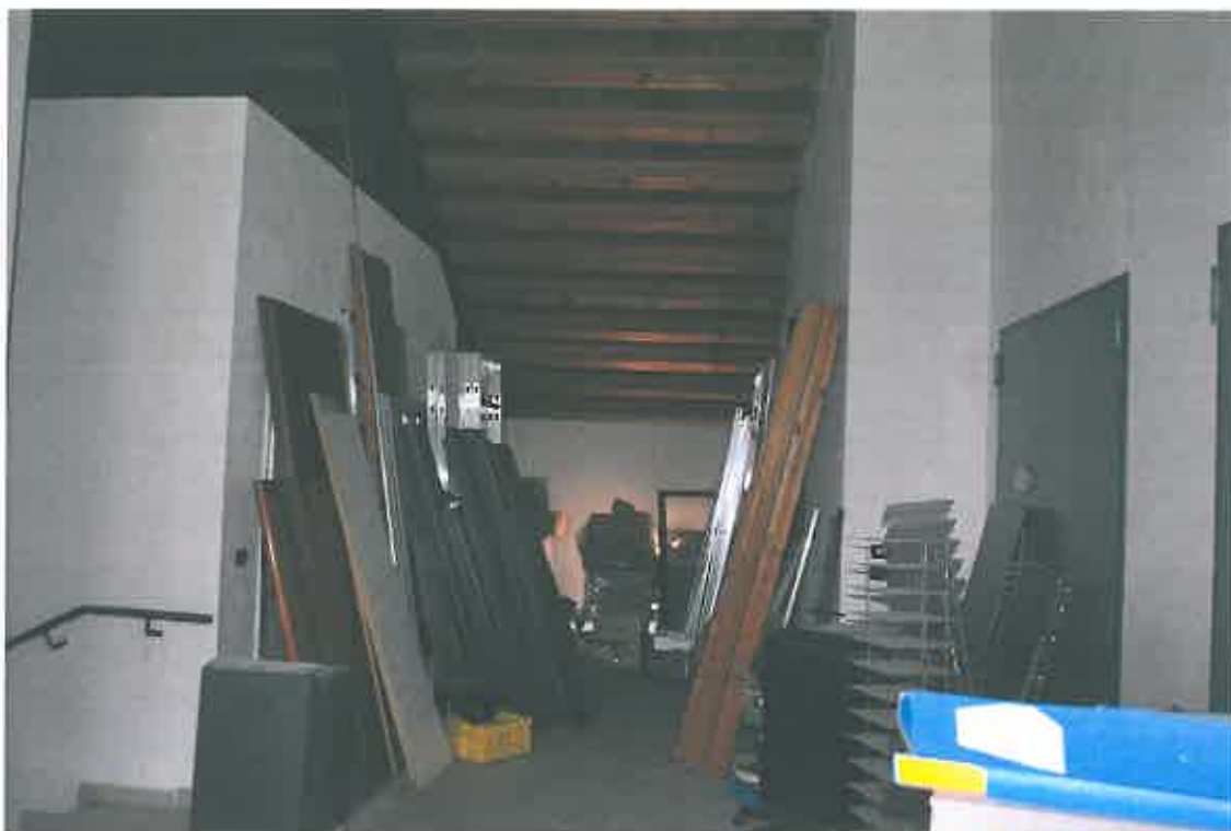
VISTA ZONA CONDOMINIALE PIANO TERZO