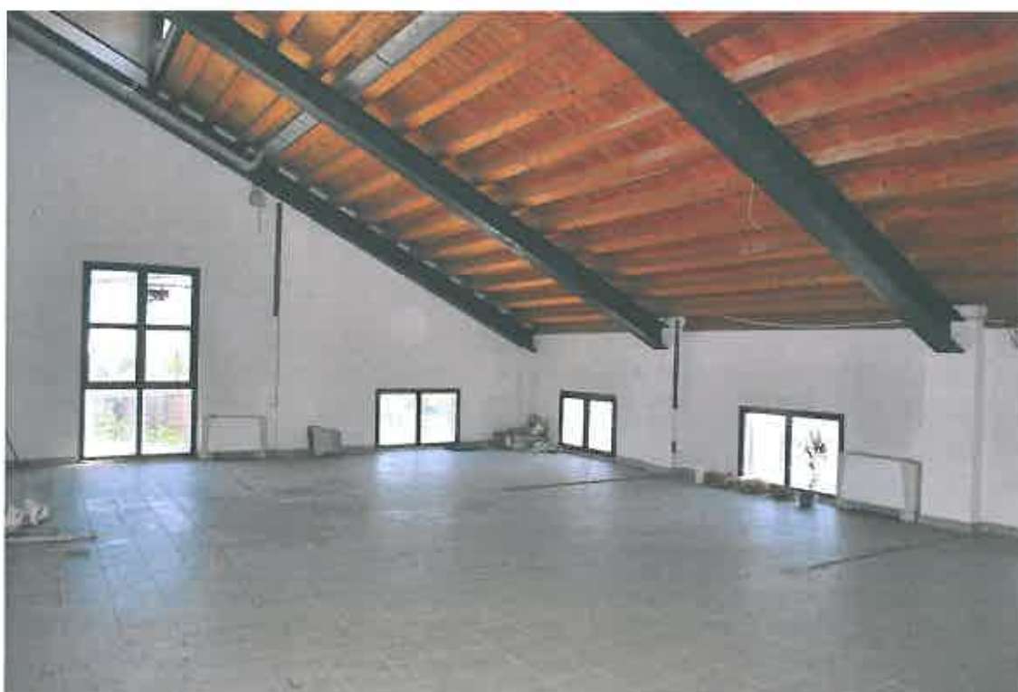
VISTA LOCALE ATTIVITA' ARTIGIANALE SUB 113