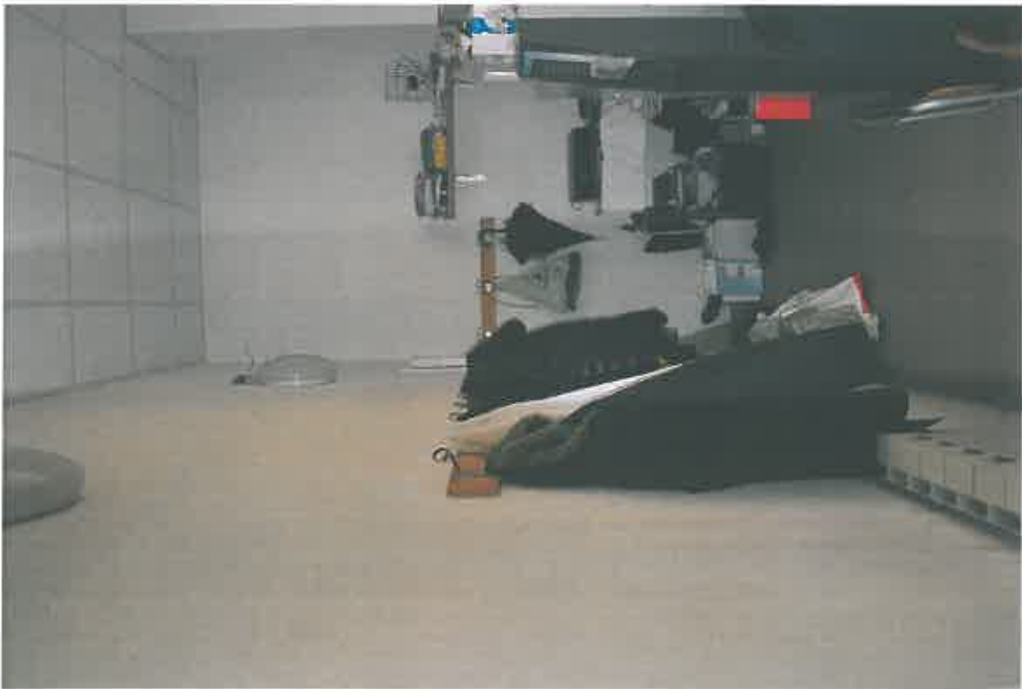
VISTA ZONA SERVIZI SUB 106