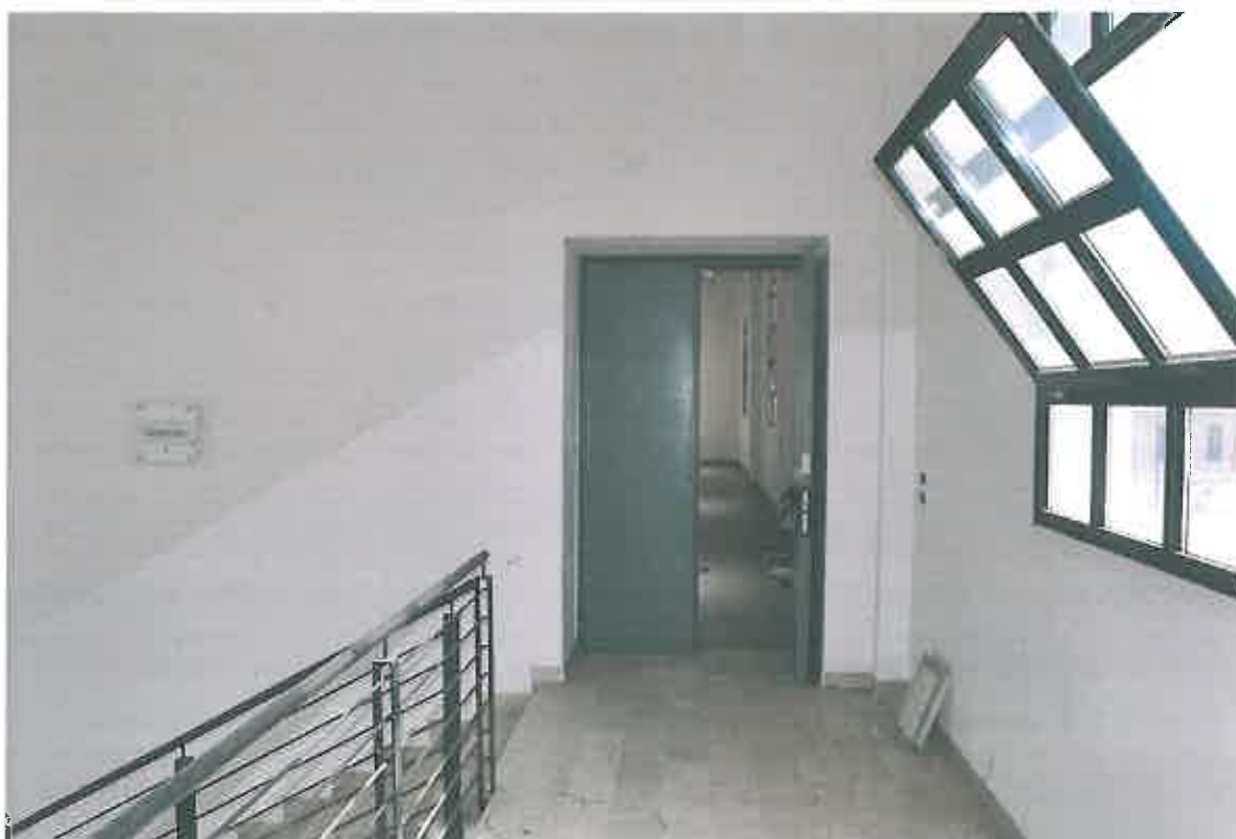
VISTA INGRESSO CONDOMINIALE PIANO PRIMO