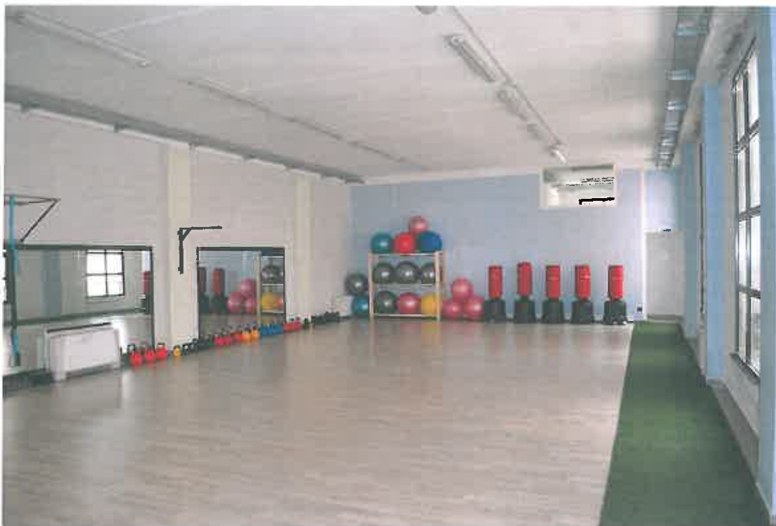
VISTA LOCALE ATTIVITA' ARTIGIANALE SUB 107