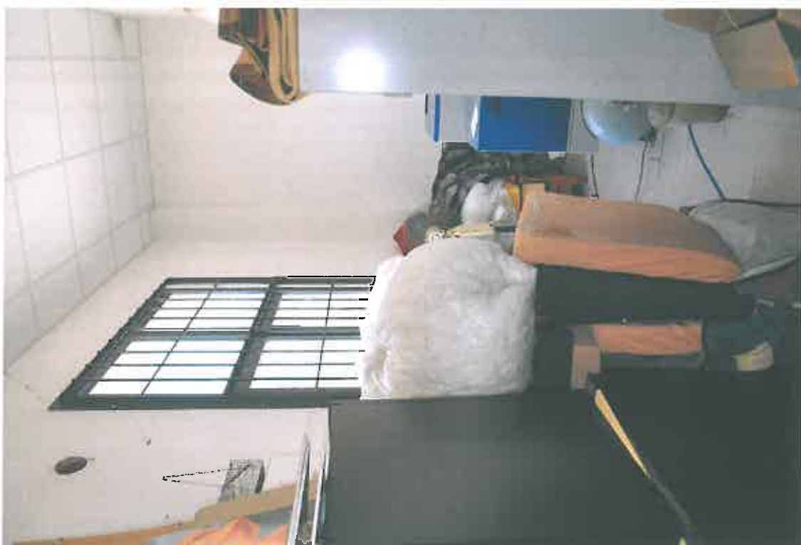
VISTA ZONA SERVIZI SUB 105