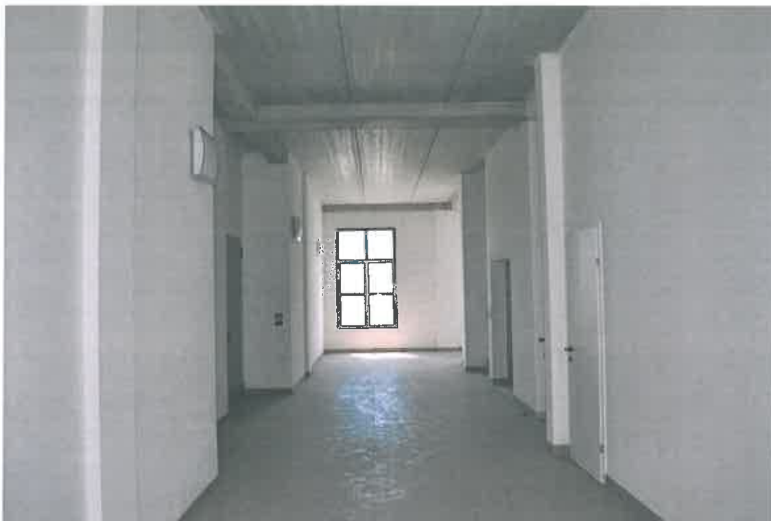
VISTA ZONA CONDOMINIALE PIANO SECONDO