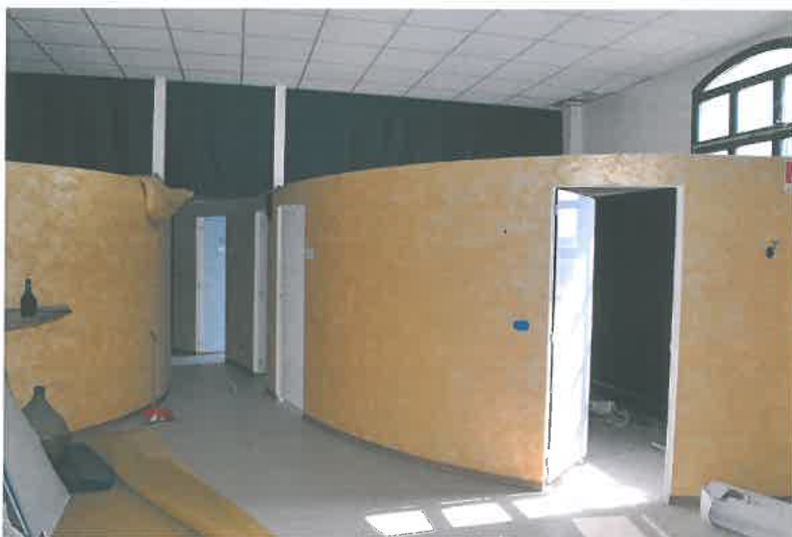
VISTA LOCALE ATTIVITA' ARTIGIANALE SUB 94