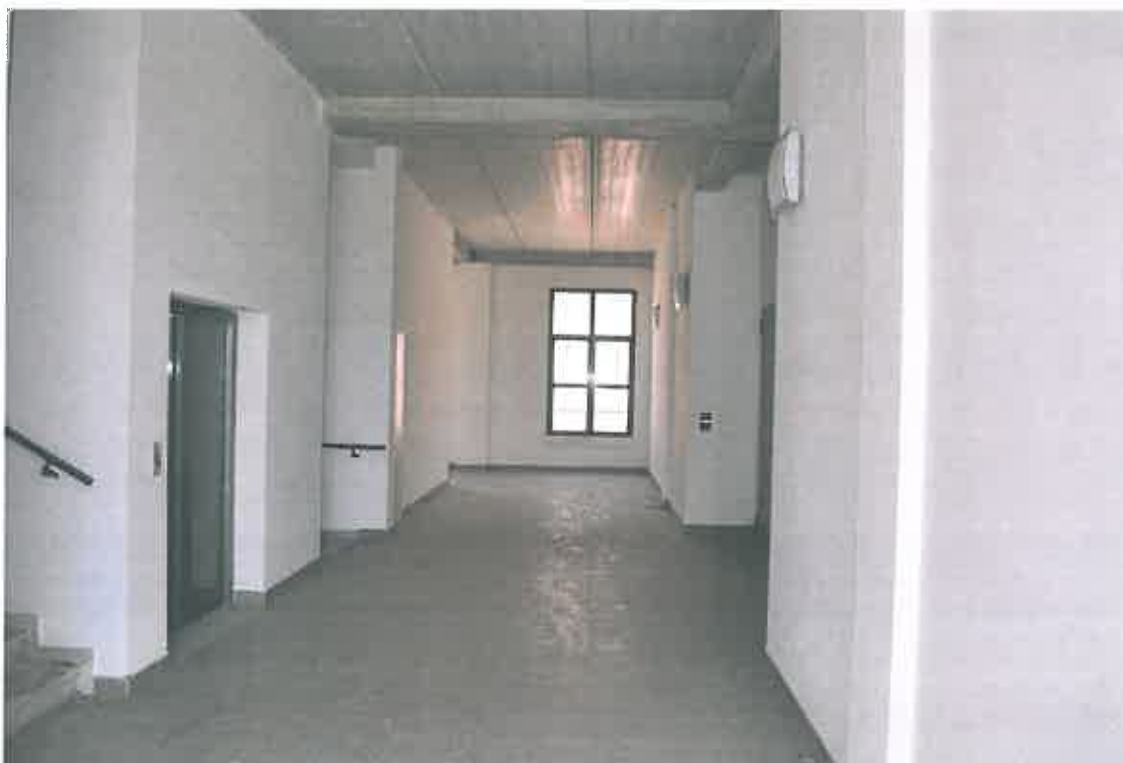
VISTA ZONA CONDOMINIALE PIANO SECONDO