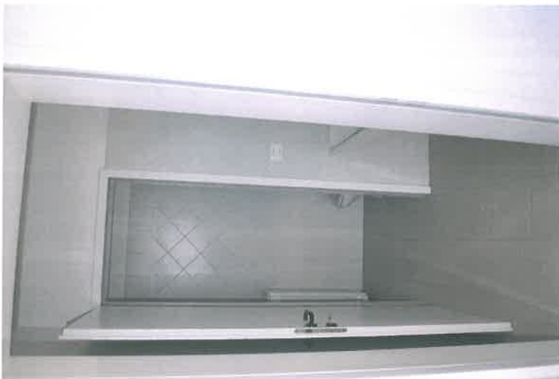
VISTA ZONA SERVIZI SUB 108