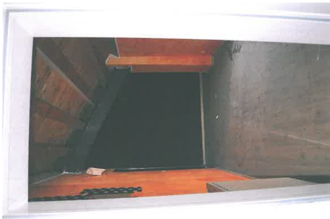
VISTA ZONA SERVIZI SUB 113