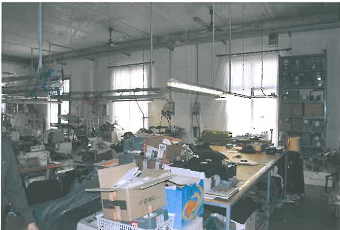
VISTA LOCALE ATTIVITA' ARTIGIANALE SUB 106