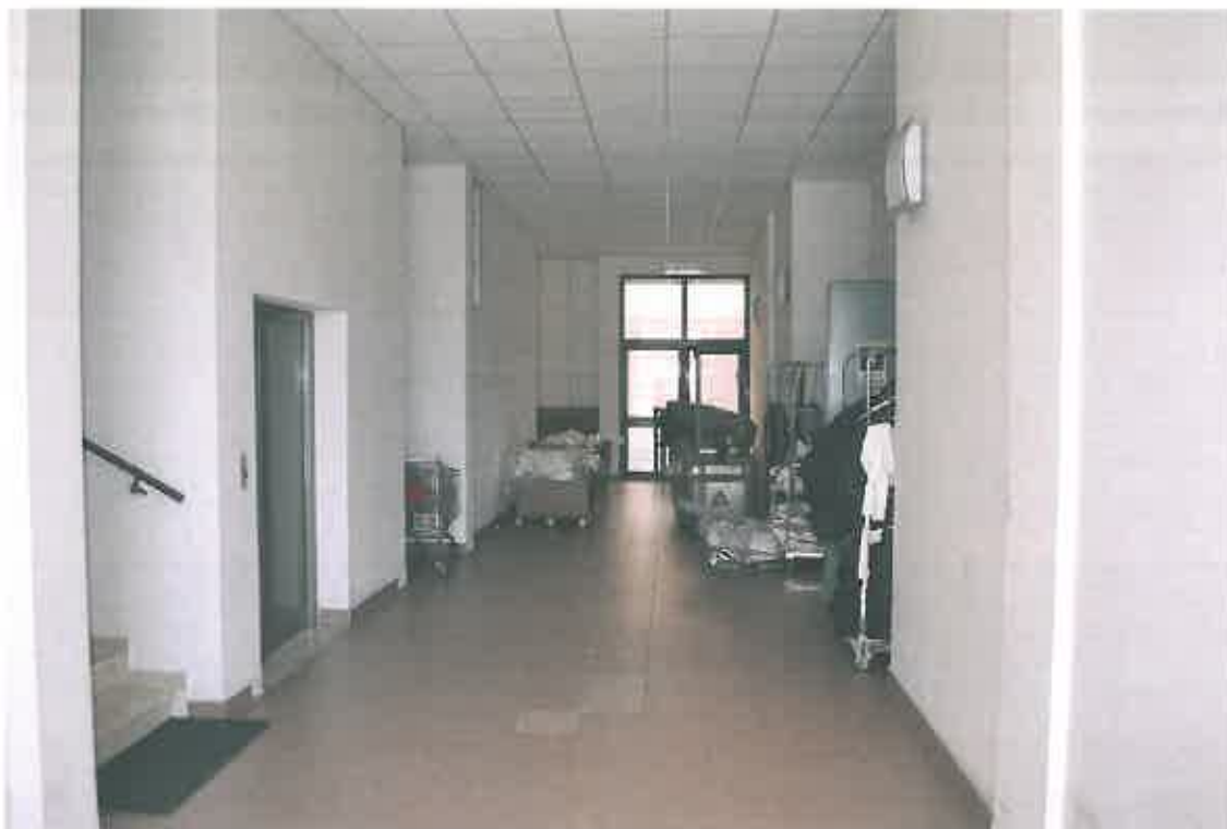
VISTA INGRESSO CONDOMINIALE PIANO TERRA