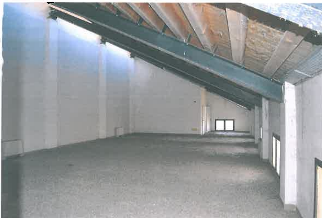
VISTA LOCALE ATTIVITA' ARTIGIANALE SUB 110