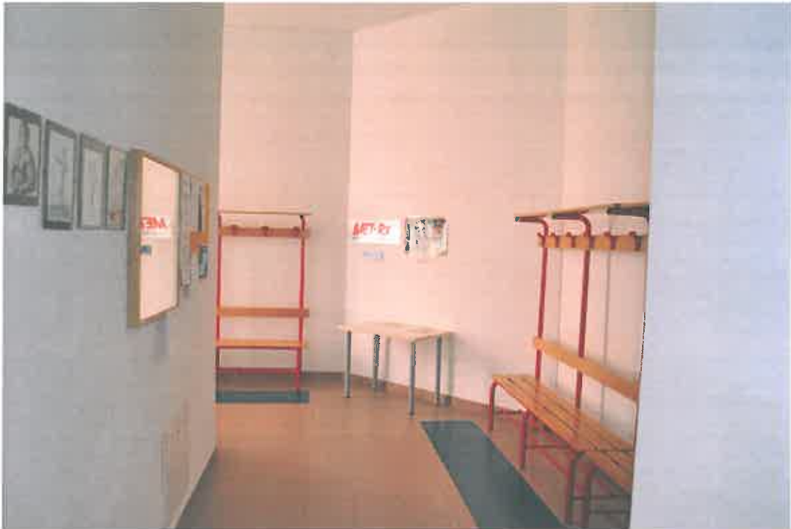
VISTA ZONA SERVIZI SUB 109