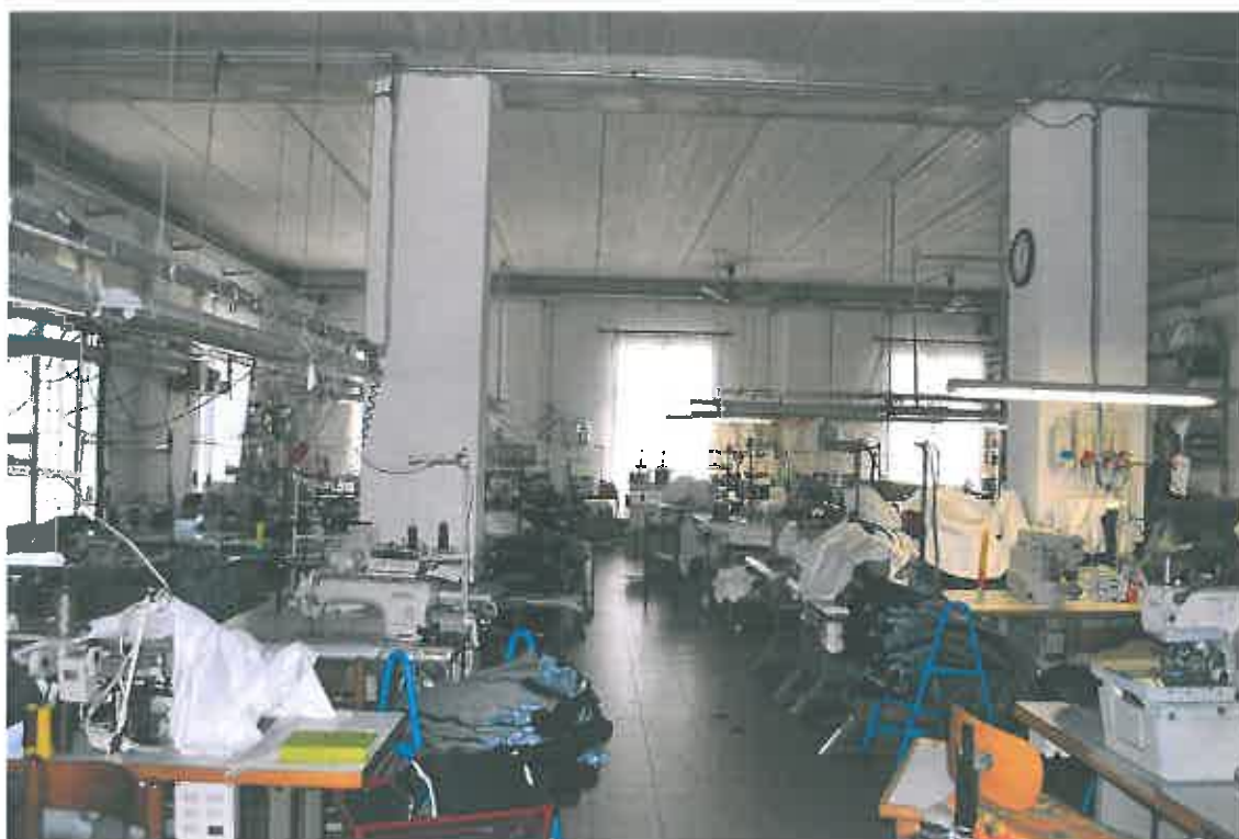
VISTA LOCALE ATTIVITA' ARTIGIANALE SUB 106