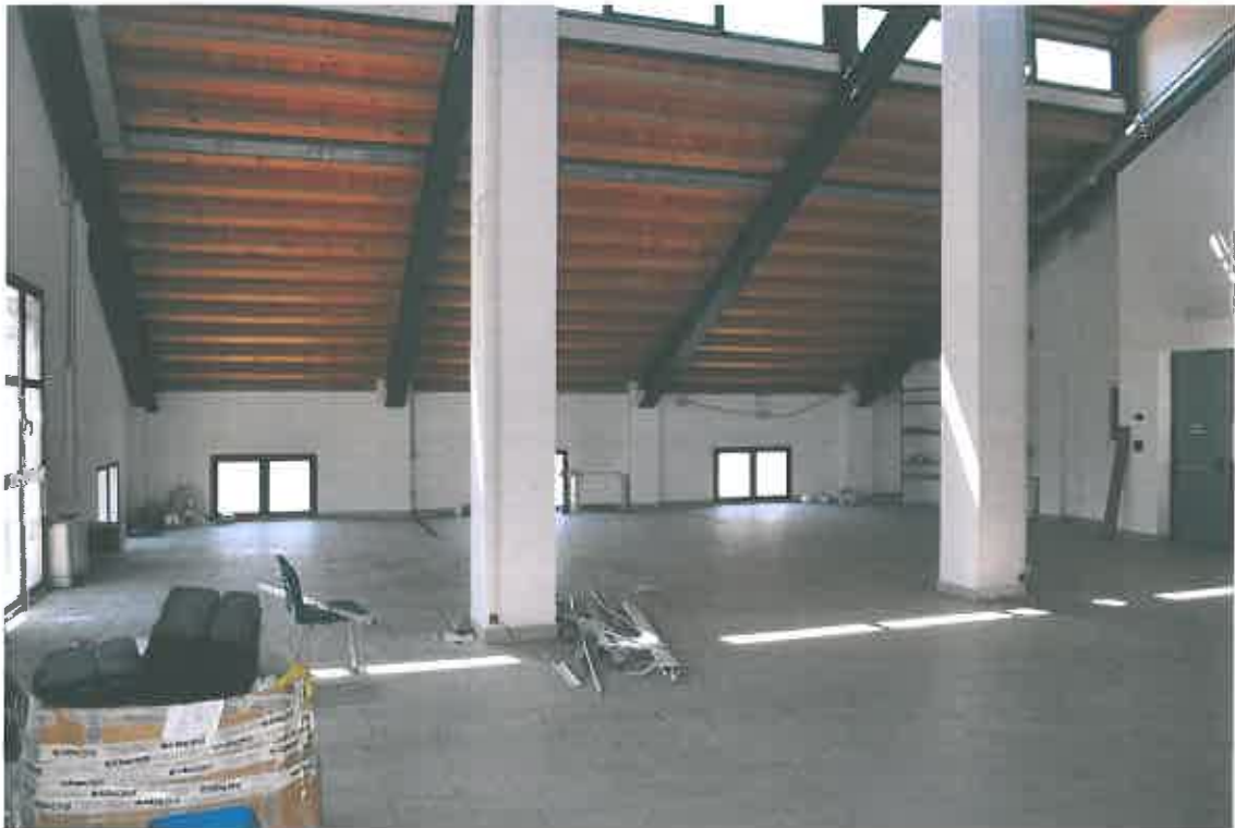
VISTA LOCALE ATTIVITA' ARTIGIANALE SUB 113