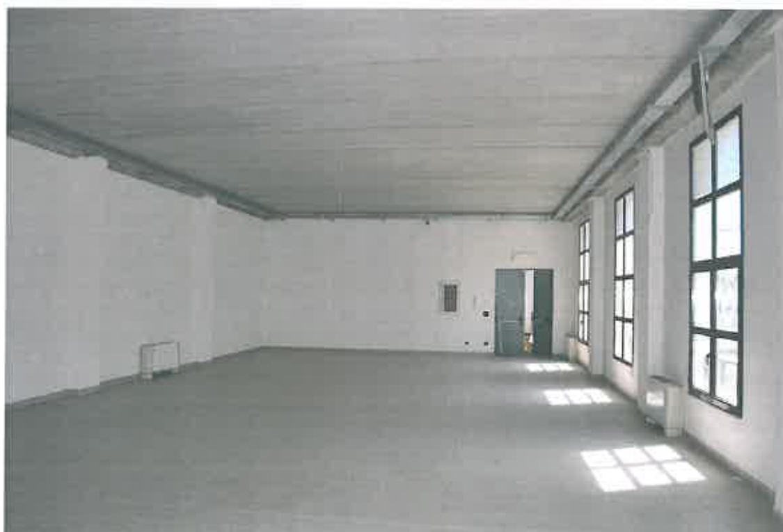
VISTA LOCALE ATTIVITA' ARTIGIANALE SUB 108