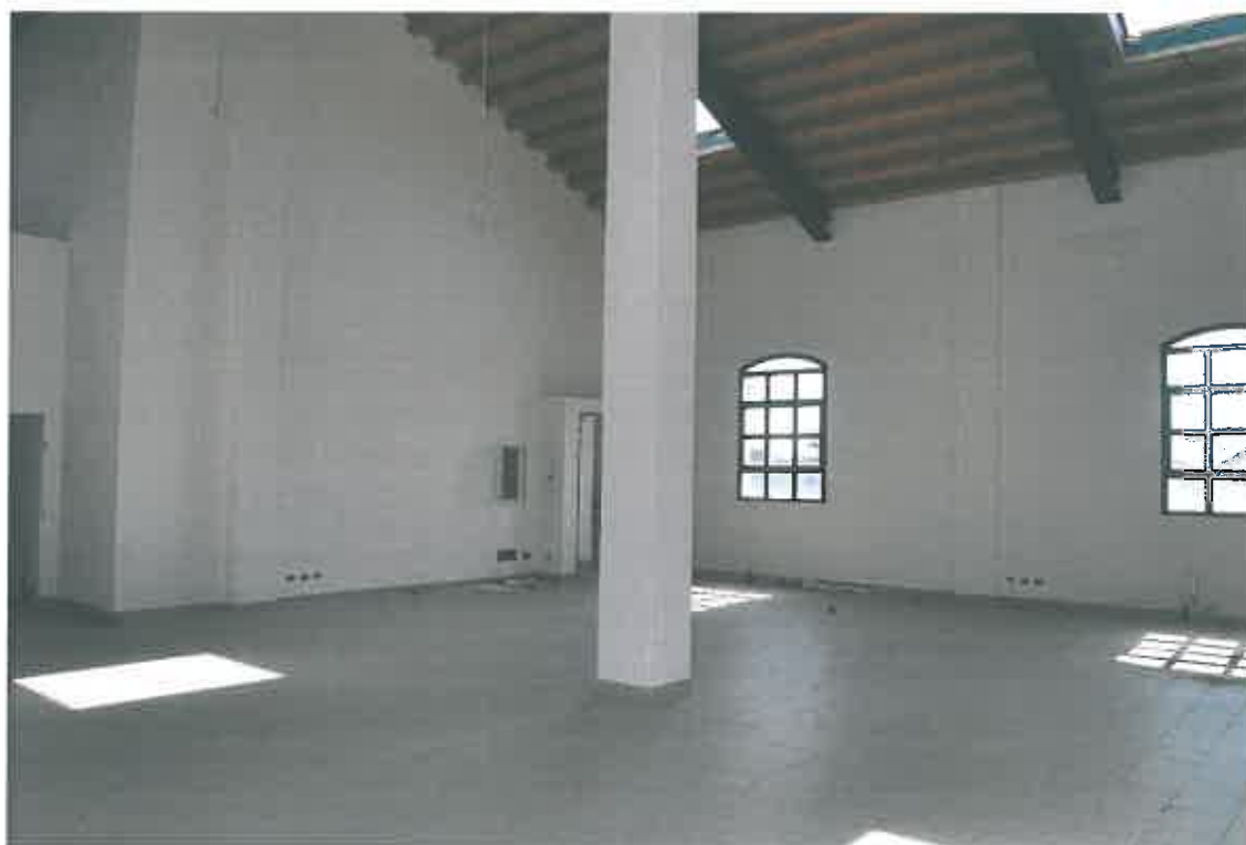
VISTA LOCALE ATTIVITA' DIREZIONALE SUB 99