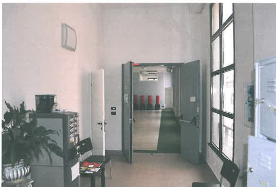
VISTA ZONA "ABUSIVAMENTE" INCORPORATA (parti comuni sub. 103)