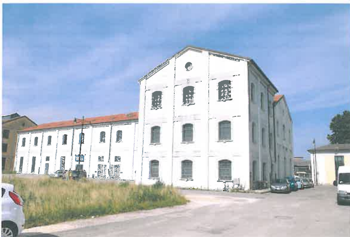
VISTA PROSPETTI NORD-EST