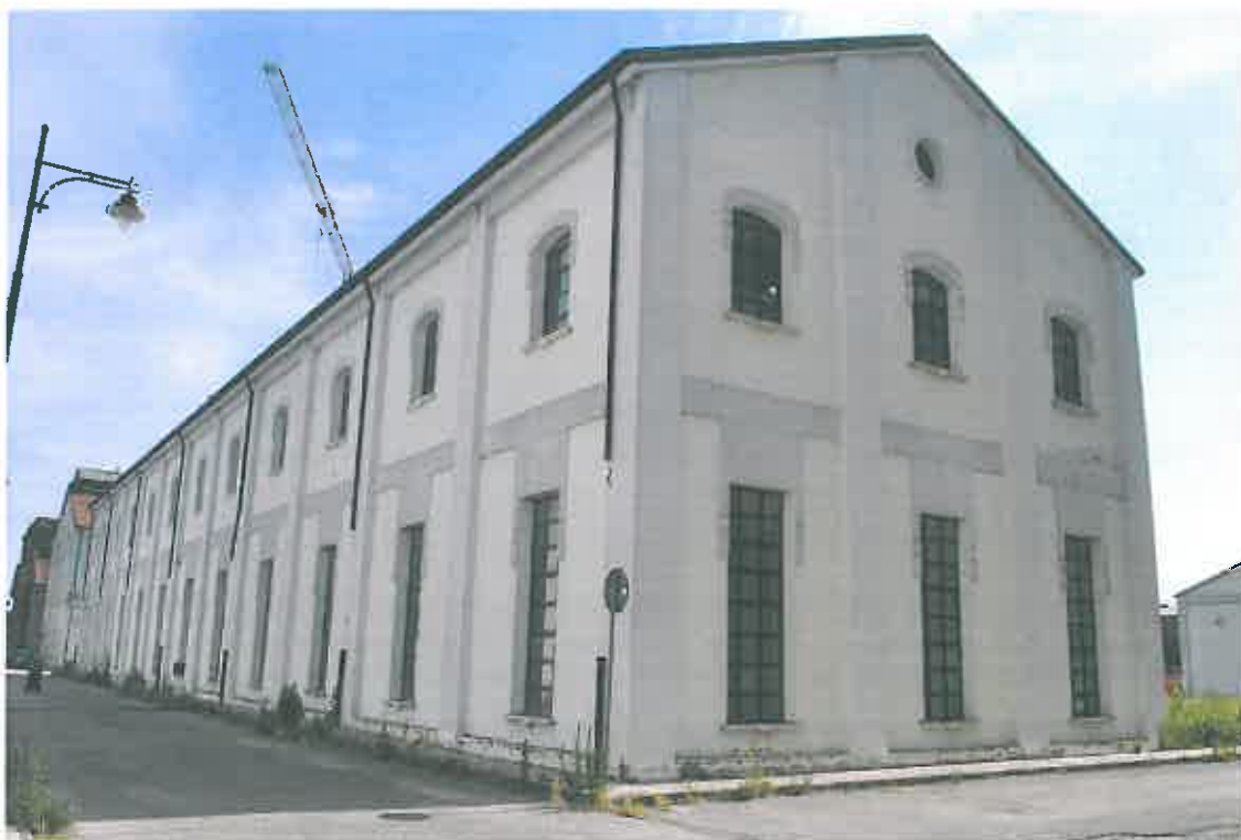
VISTA PROSPETTI SUD- OVEST