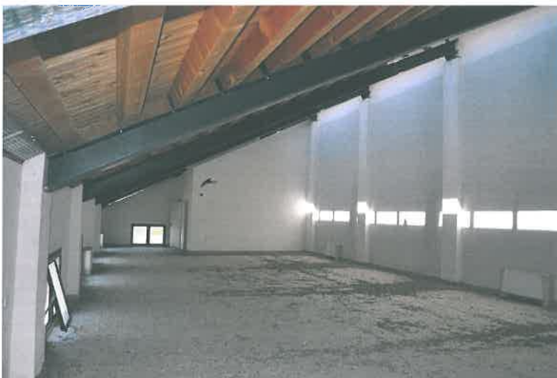
VISTA LOCALE ATTIVITA' ARTIGIANALE SUB 111