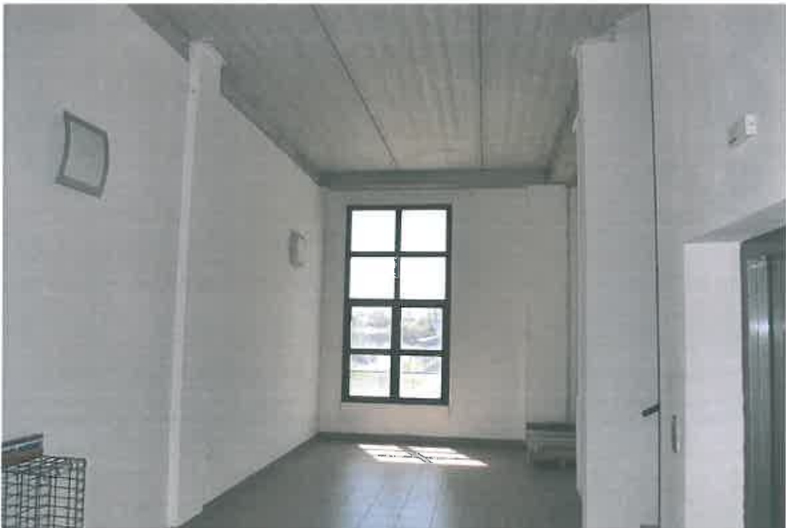
VISTA ZONA CONDOMINIALE PIANO PRIMO