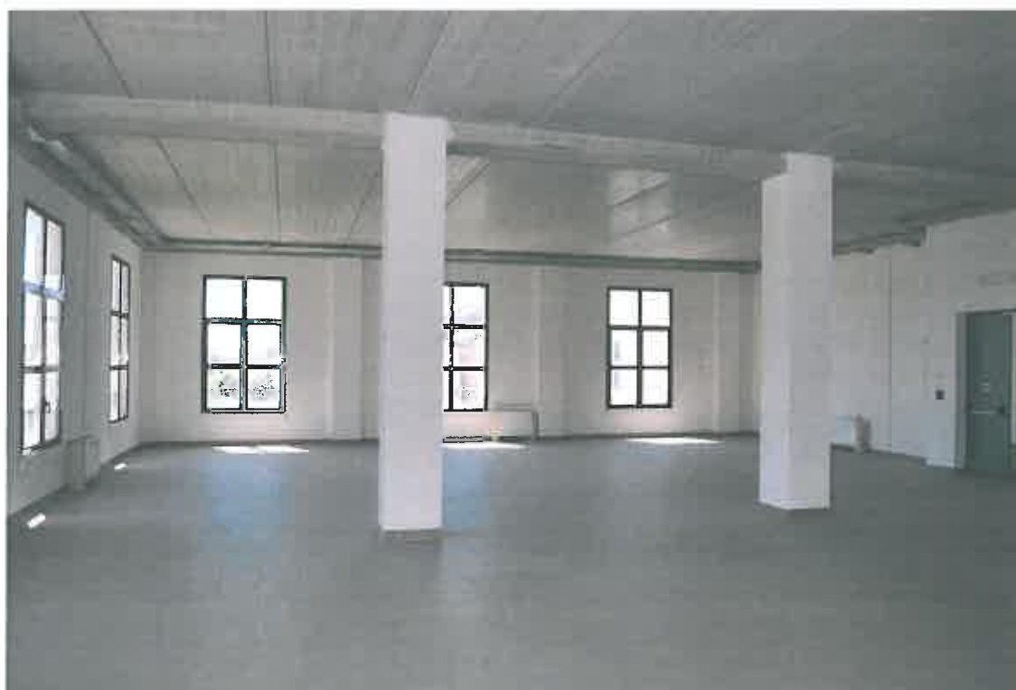
VISTA LOCALE ATTIVITA' ARTIGIANALE SUB 112