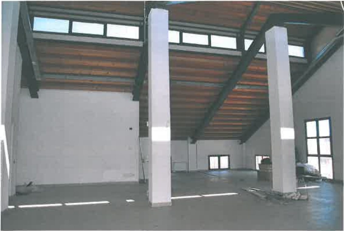
VISTA LOCALE ATTIVITA' ARTIGIANALE SUB 113