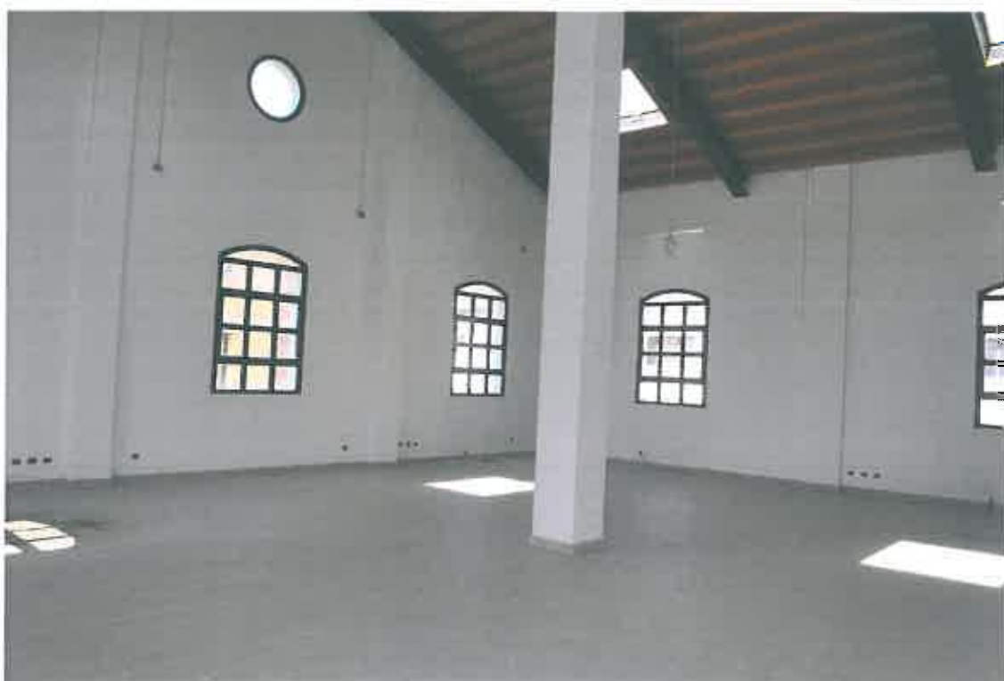
VISTA LOCALE ATTIVITA' DIREZIONALE SUB 99