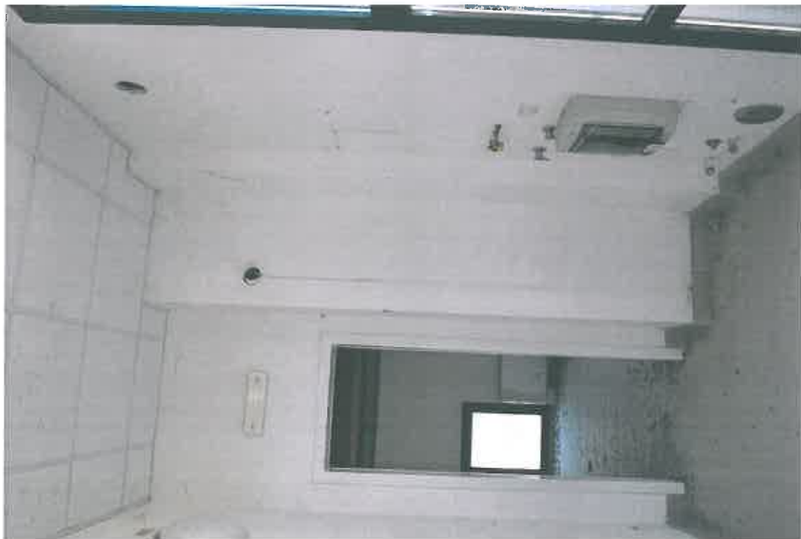
VISTA ZONA SERVIZI SUB 111