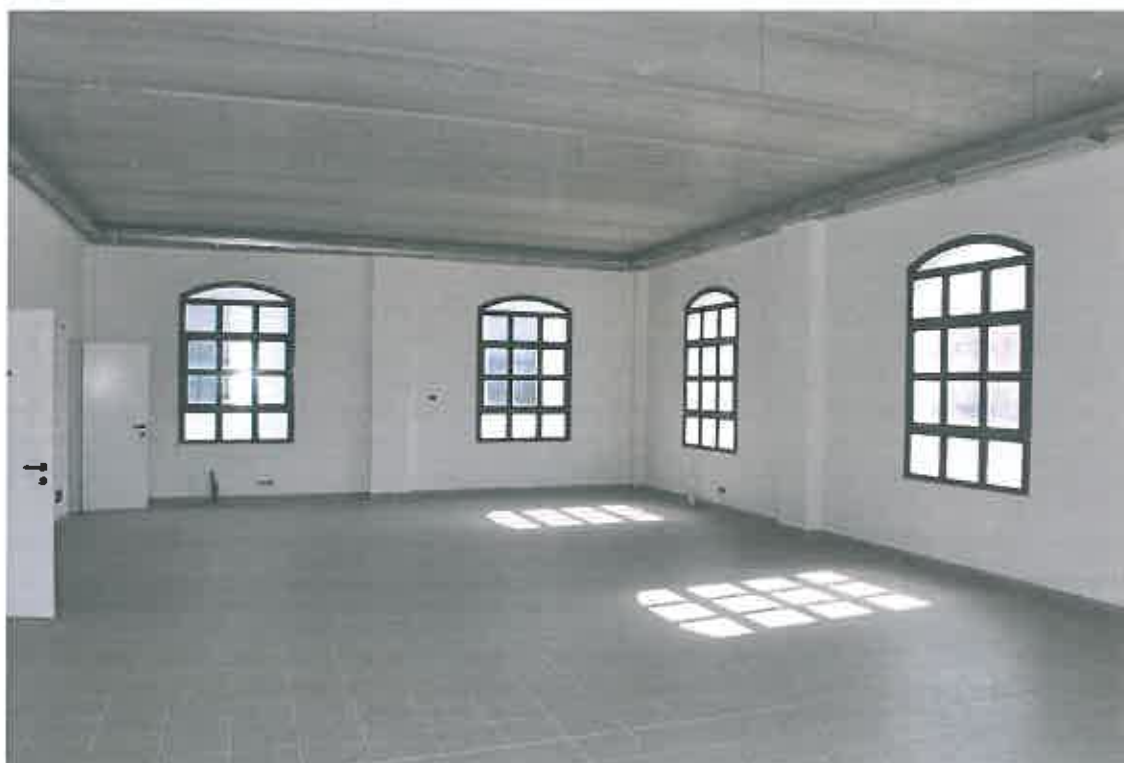
VISTA LOCALE ATTIVITA' ARTIGIANALE SUB 100