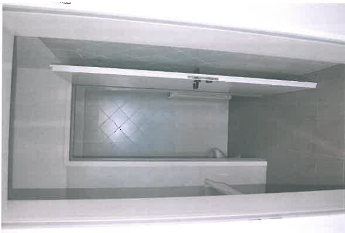
VISTA ZONA SERVIZI SUB 112