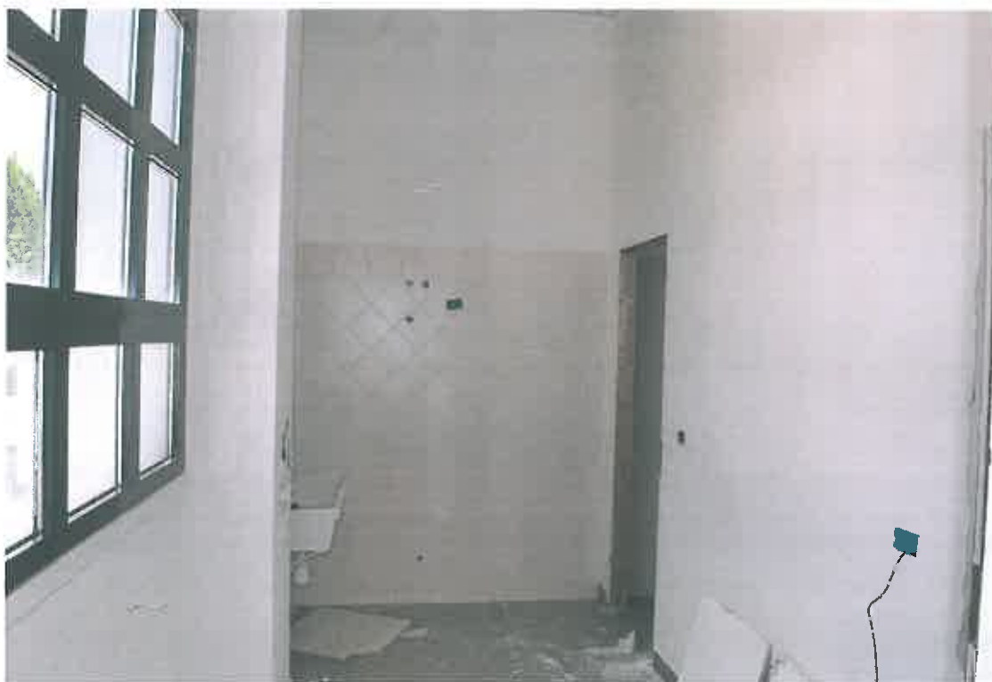
VISTA ZONA SERVIZI SUB 100