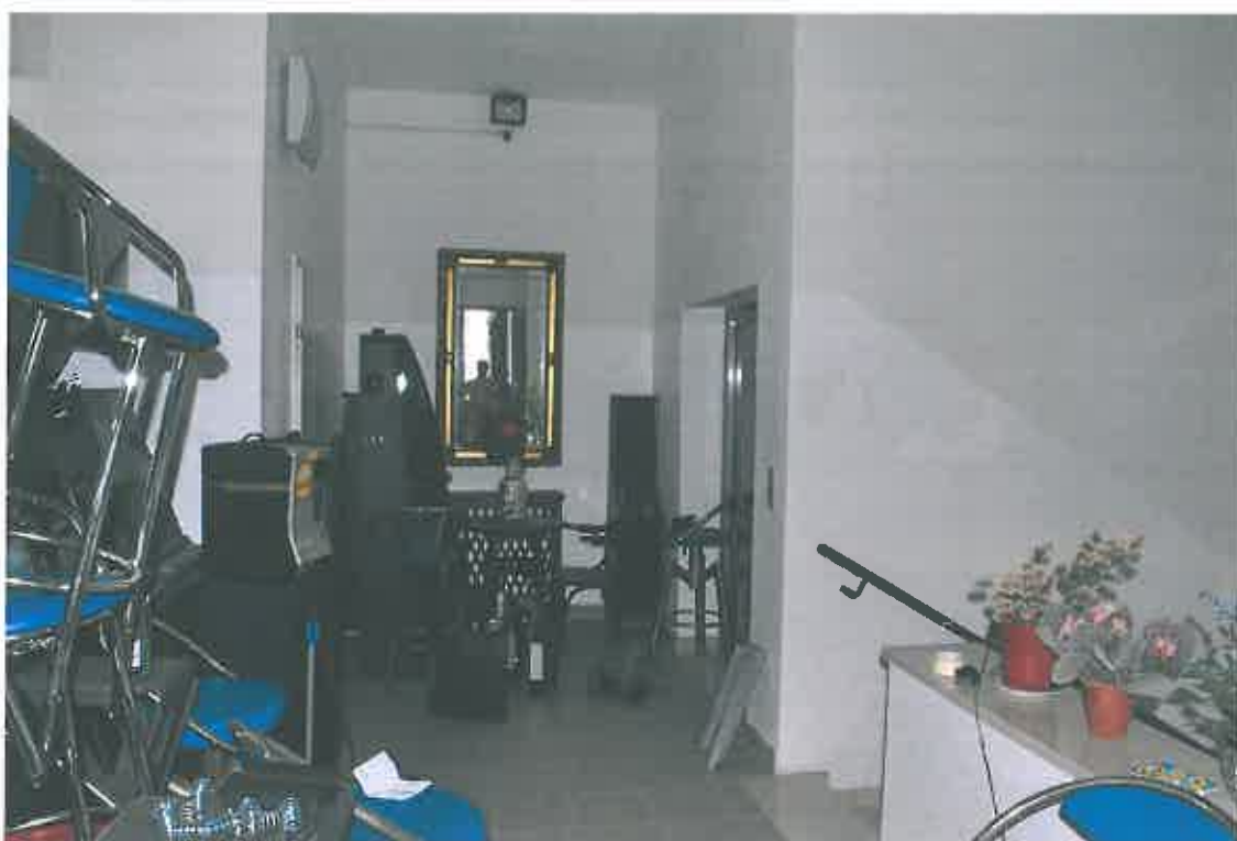
VISTA ZONA CONDOMINIALE PIANO SECONDO SUBB. 94-101-102