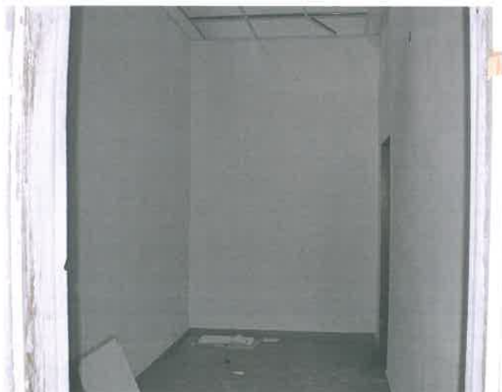
VISTA ZONA SERVIZI SUB 105