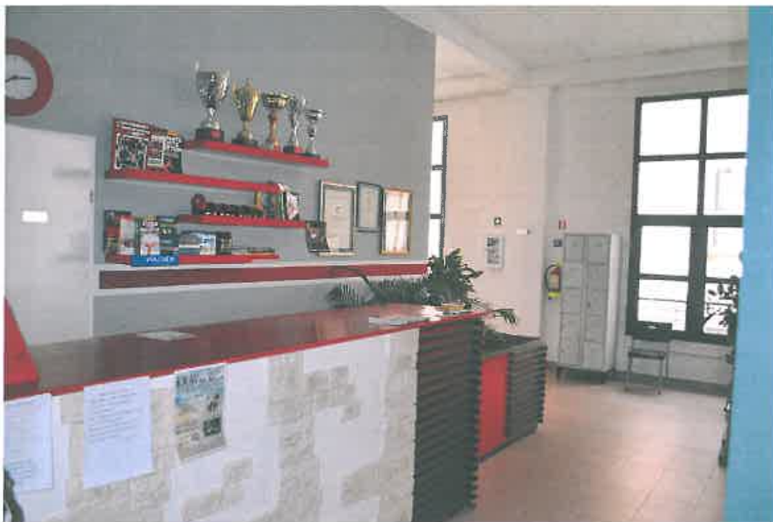
VISTA ZONA "ABUSIVAMENTE" INCORPORATA (parti comuni sub. 103)