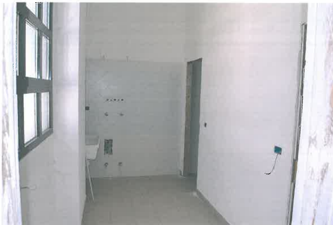
VISTA ZONA SERVIZI SUB 99