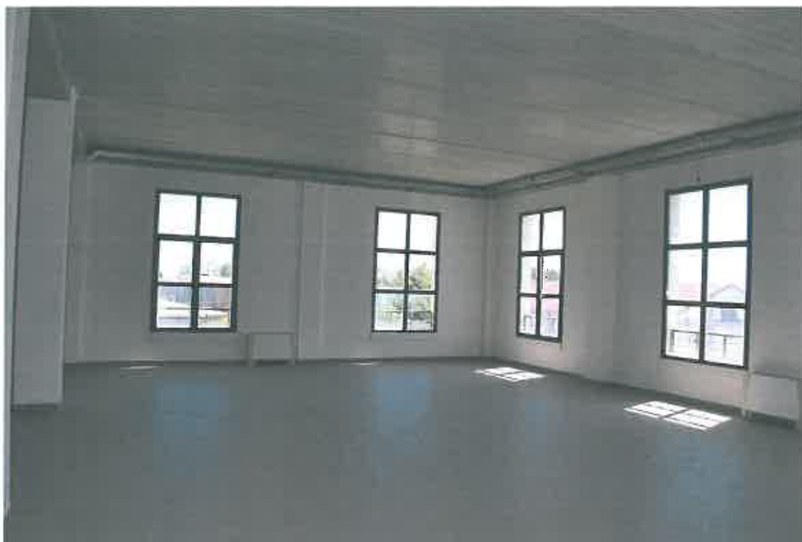
VISTA LOCALE ATTIVITA' ARTIGIANALE SUB 112