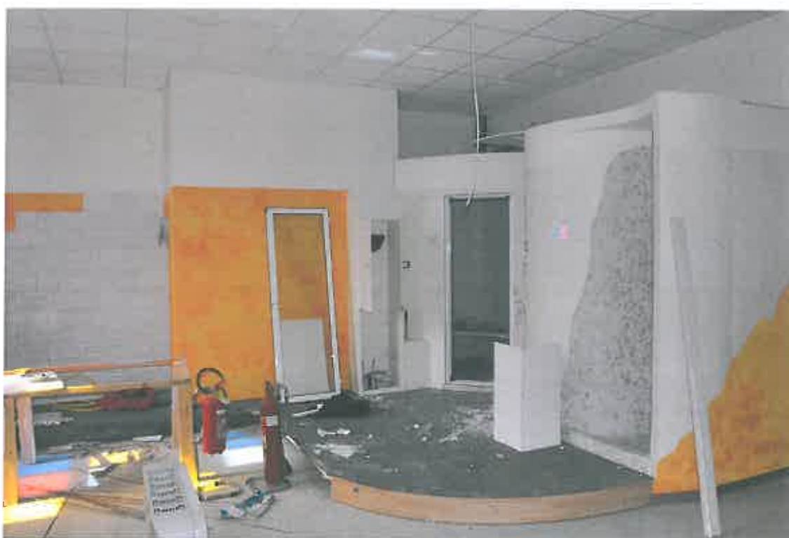
VISTA LOCALE ATTIVITA' ARTIGIANALE SUB 94