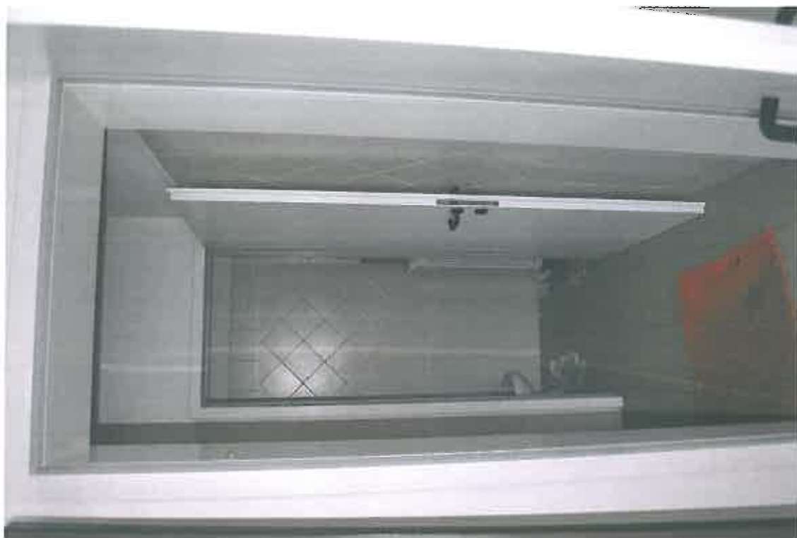
VISTA ZONA SERVIZI SUB 113