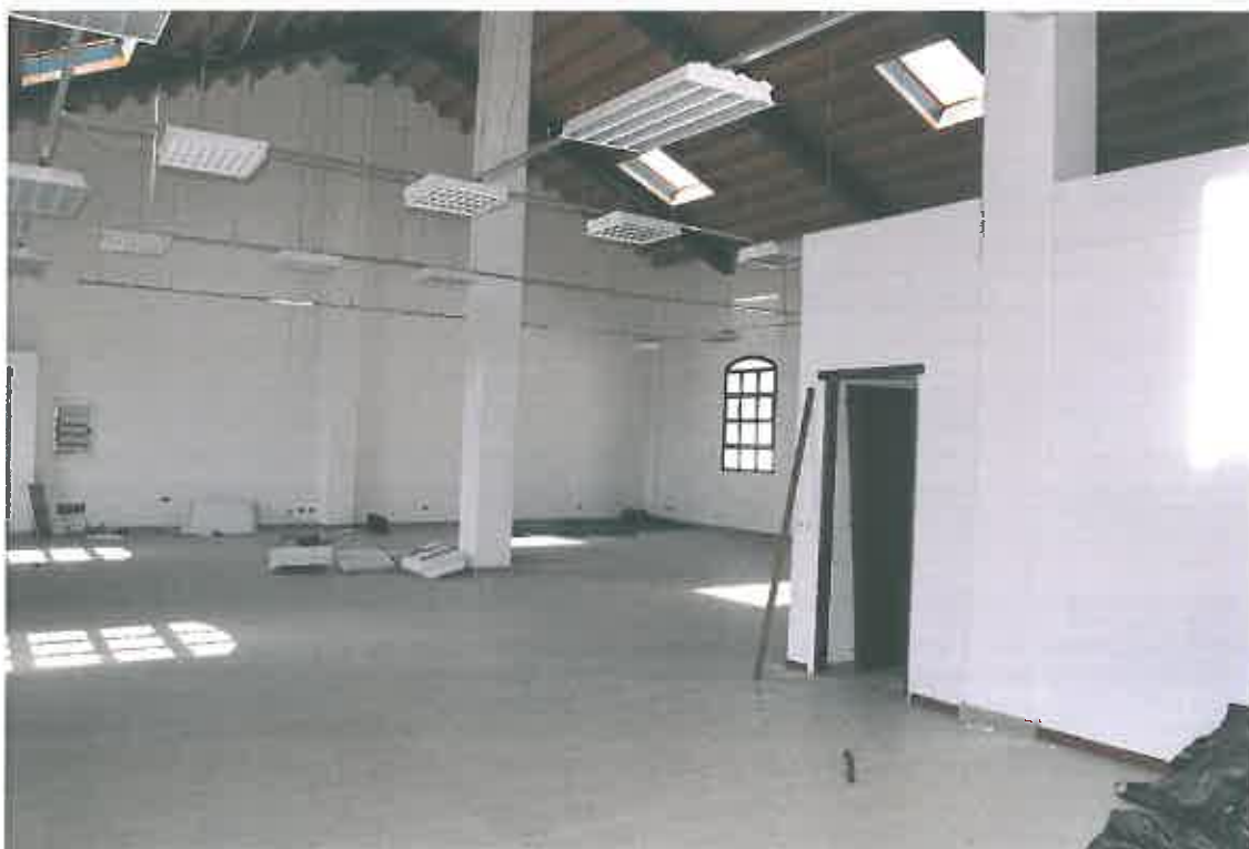
VISTA LOCALE ATTIVITA' DIREZIONALE SUB 100