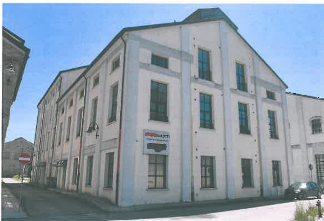
VISTA PROSPETTI NORD-OVEST