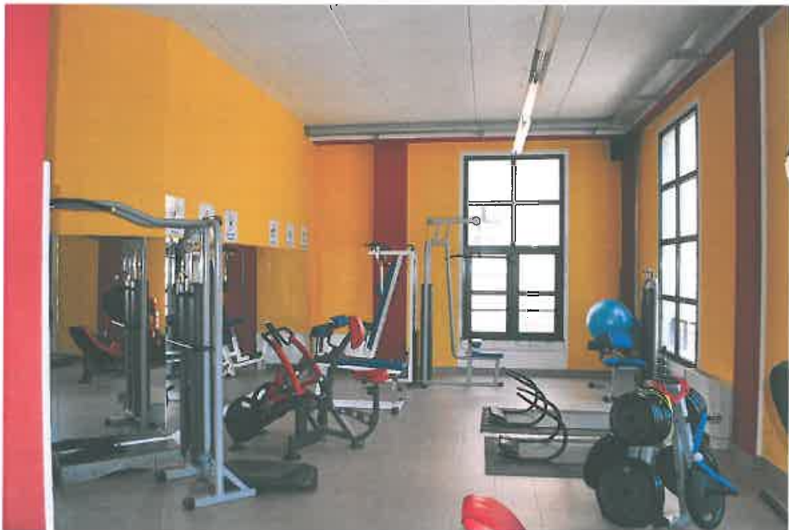
VISTA LOCALE ATTIVITA' ARTIGIANALE SUB 109