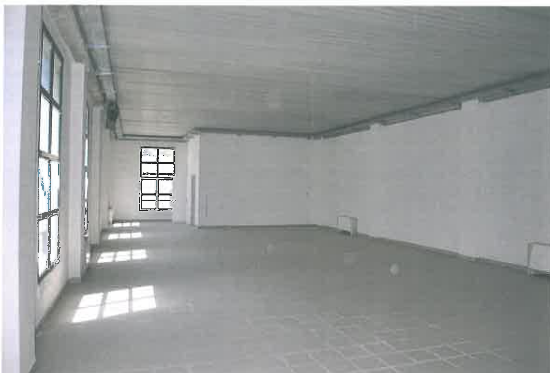
VISTA LOCALE ATTIVITA' ARTIGIANALE SUB 108