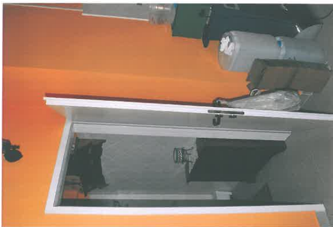
VISTA ZONA SERVIZI SUB 94