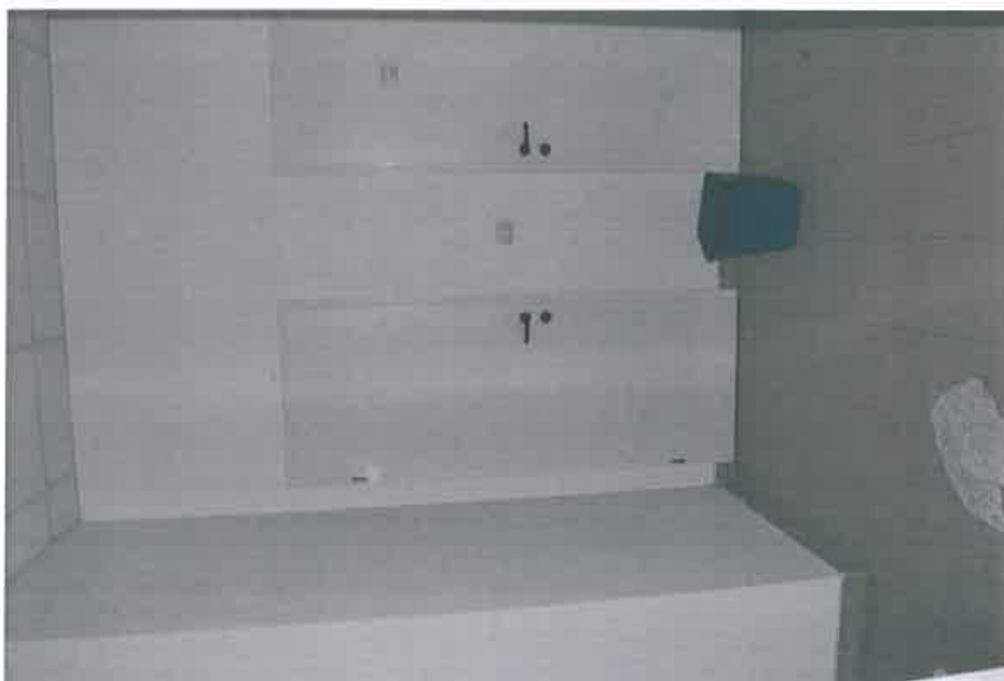
VISTA ZONA SERVIZI SUB 101