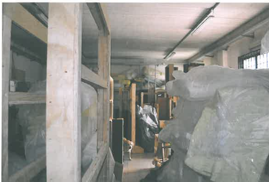
VISTA LOCALE ATTIVITA' ARTIGIANALE SUB 105