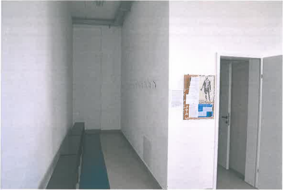
VISTA ZONA SERVIZI SUB 107