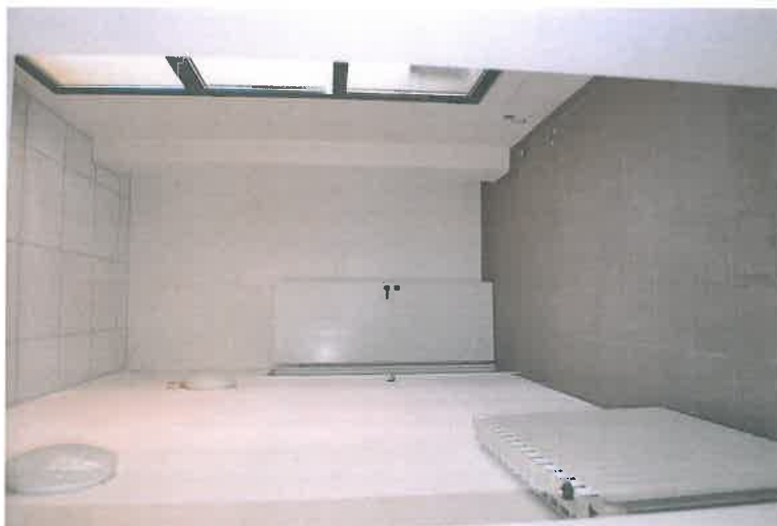
VISTA ZONA SERVIZI SUB 112