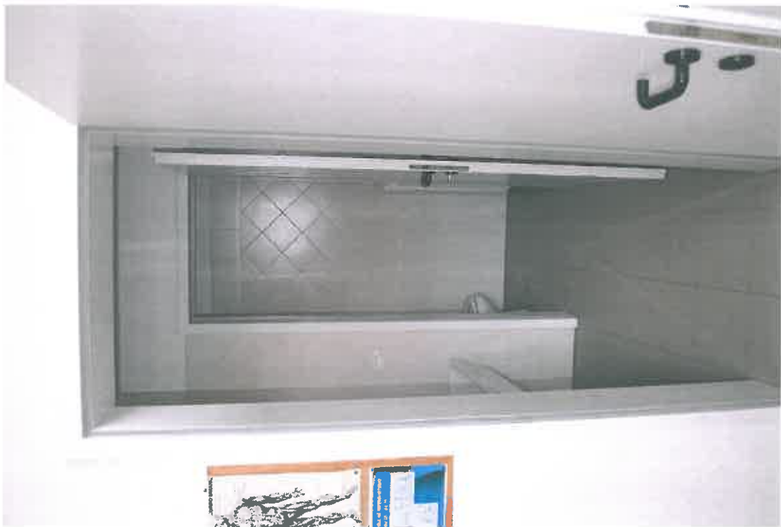
VISTA ZONA SERVIZI SUB 107