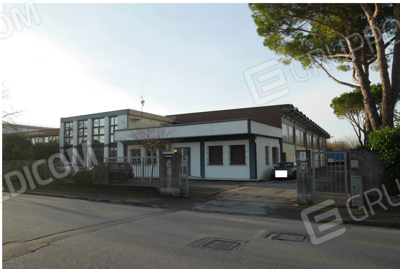
FOTO 10 - Il capannone industriale-laboratorio con relativi uffici di cui al mappale 432. L'accesso principale dalla Via 1° maggio.