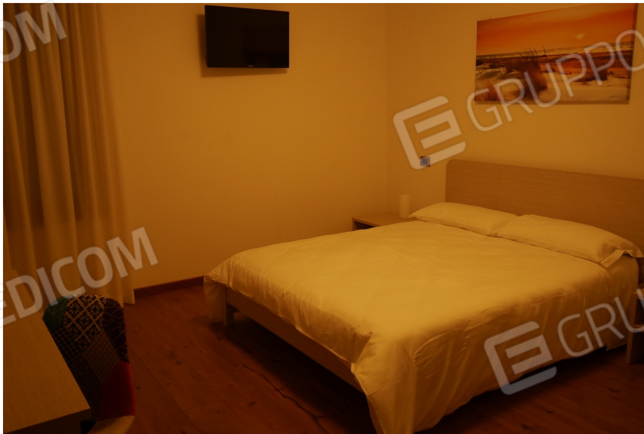
FOTO 8 - Edificio ad uso albergo. Piano primo. Una delle camere.