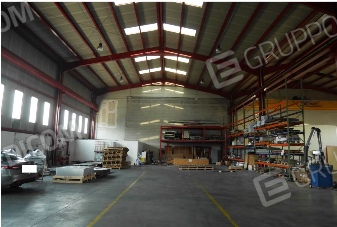
FOTO 14 - Porzione ad uso capannone industriale.