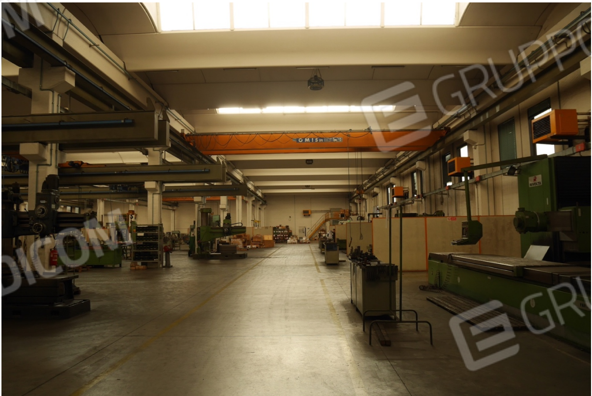
FOTO 4 - La porzione ad uso capannone.