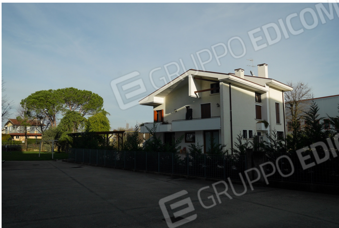
FOTO 7 - Edificio ad uso albergo.