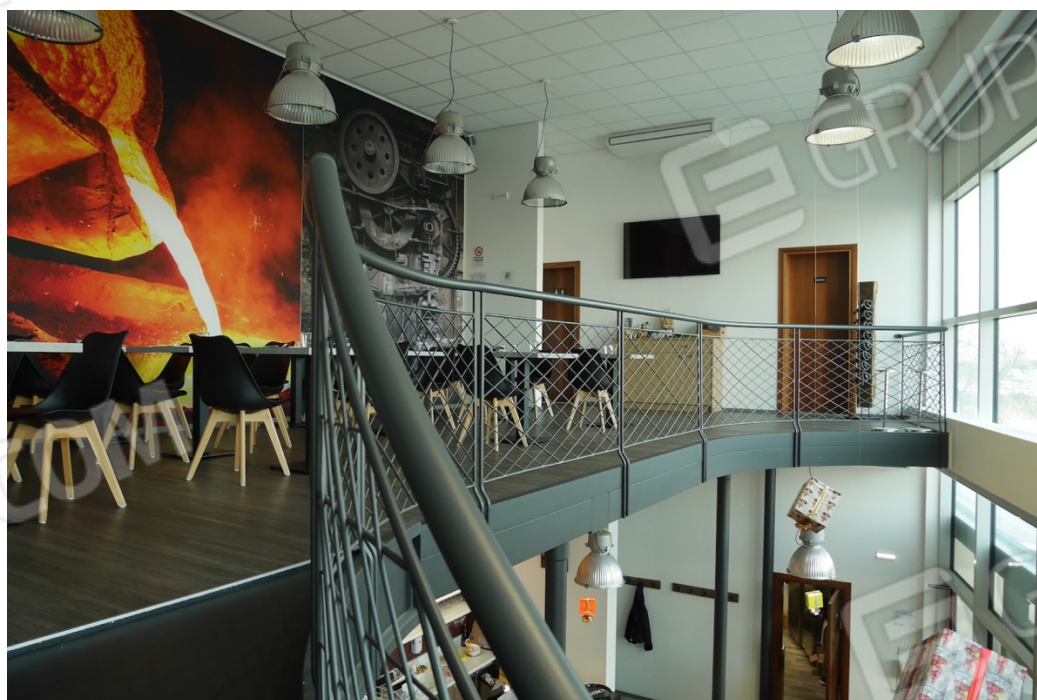
FOTO 16 - Porzione ad uso commerciale. Piano primo.