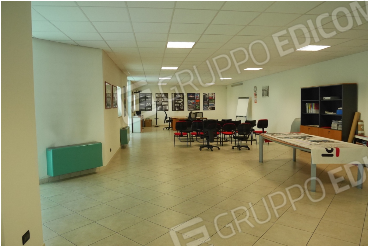
FOTO 3 - La porzione ad uso uffici. Piano primo. Sala riunioni.