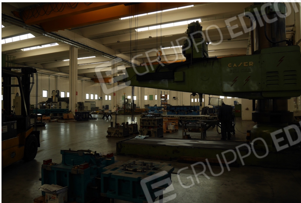
FOTO 5 - La porzione ad uso capannone.