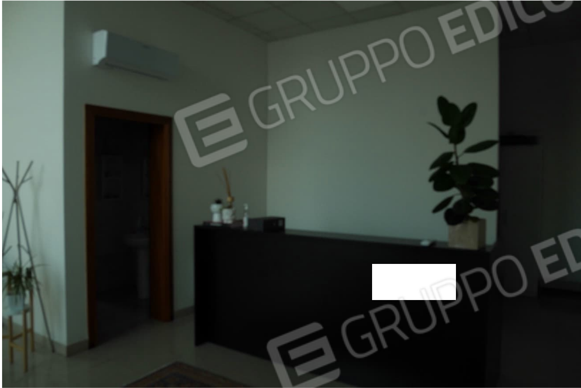
FOTO 17 - Porzione ad uso ufficio. Piano terra.