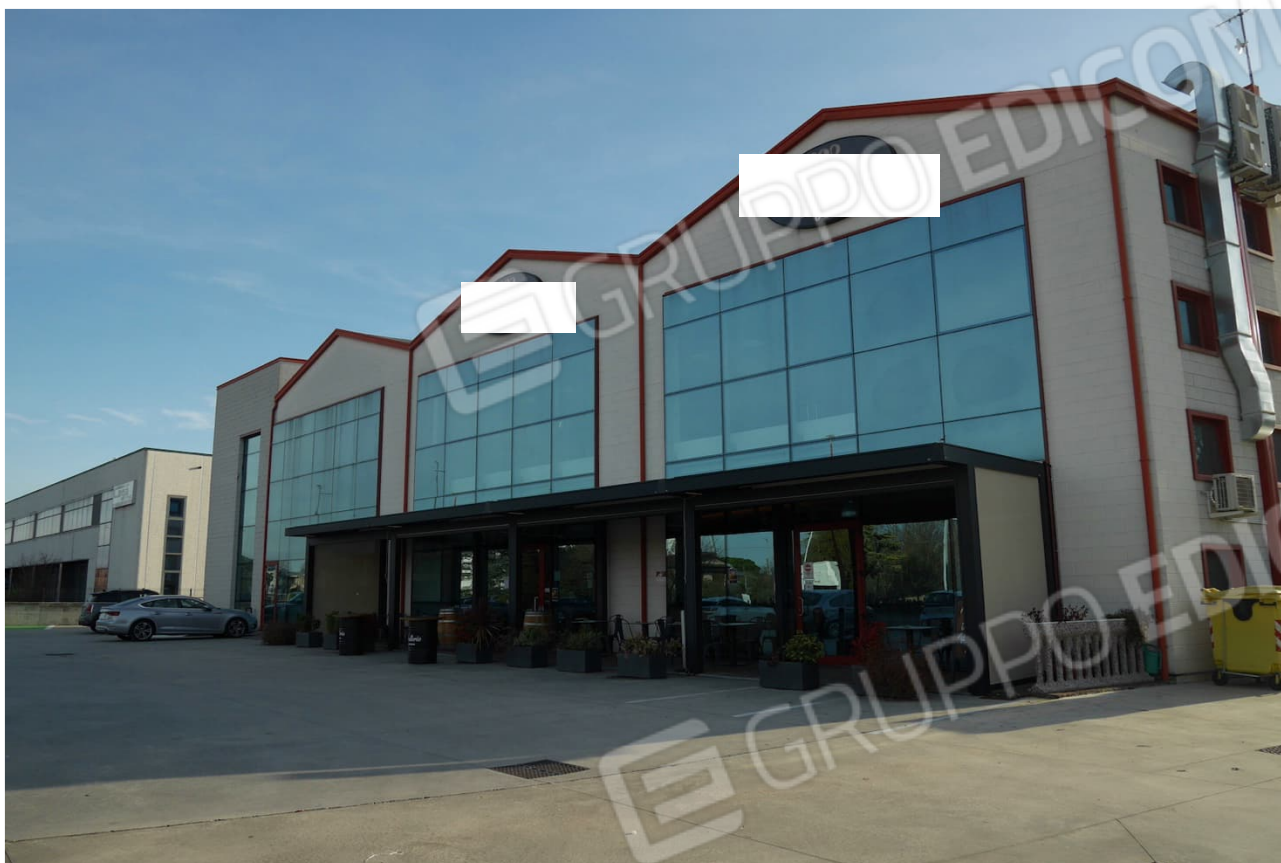
FOTO 13 - Il complesso costituito da porzione ad uso commerciale, uffici e capannone industriale di cui al mappale 833.