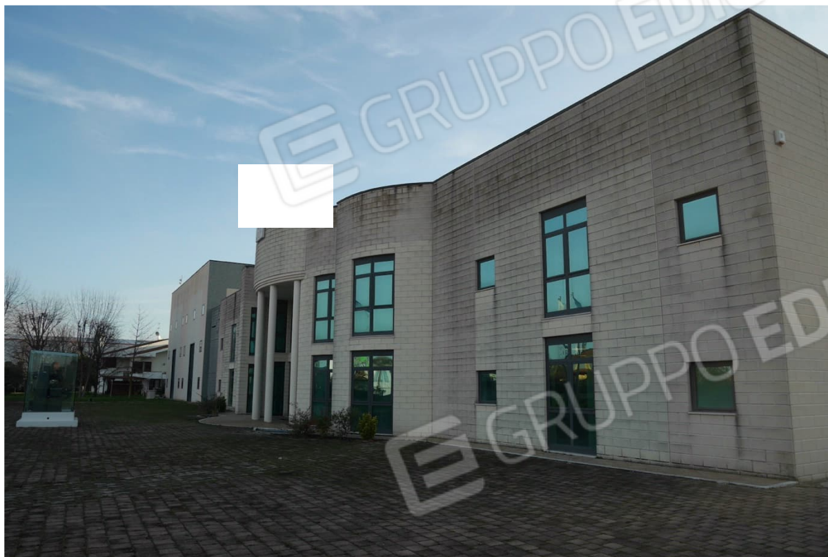
FOTO 1 - Il complesso di cui al mappale 792-883. La porzione ad uso uffici.