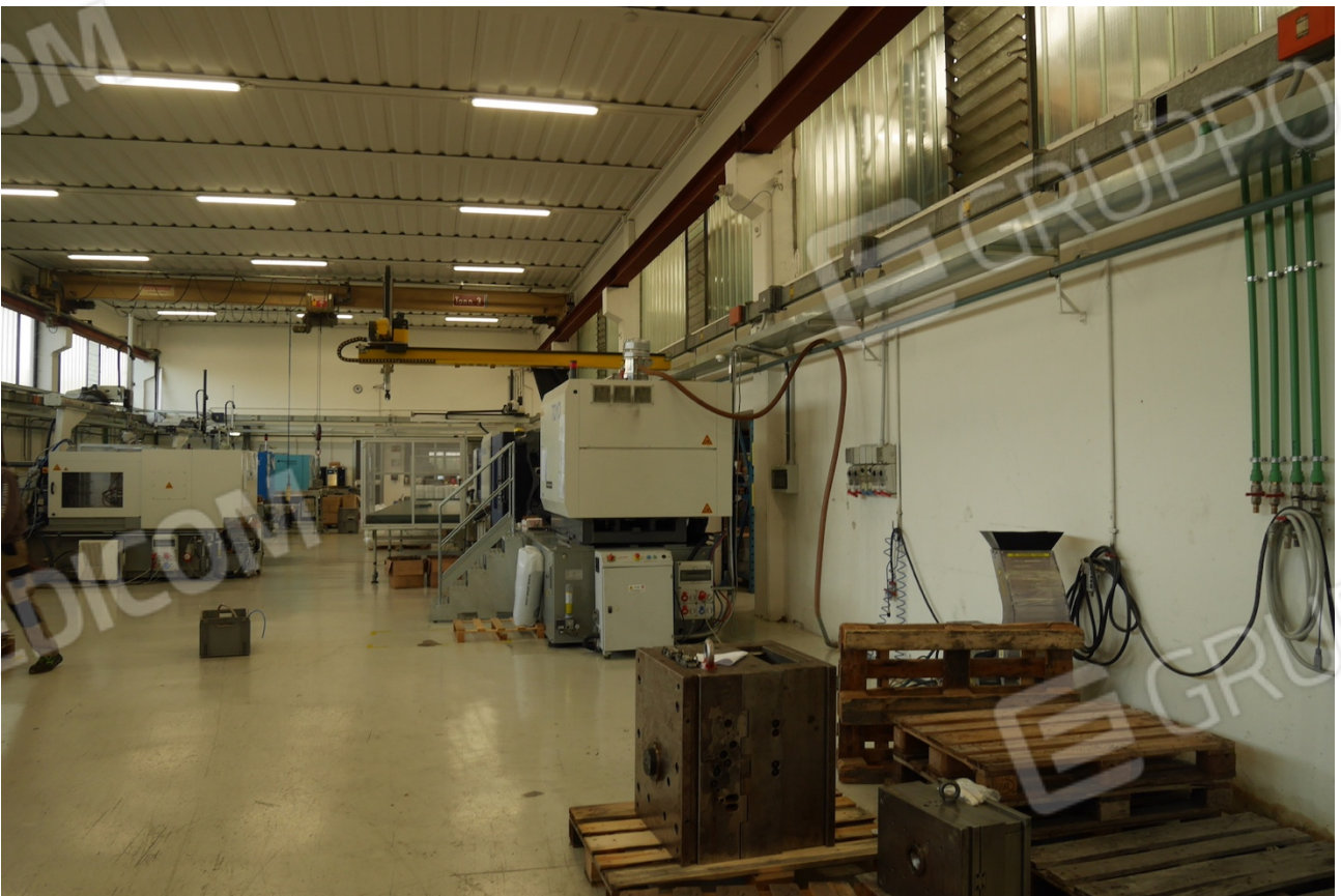
FOTO 12 - Il capannone-laboratorio.