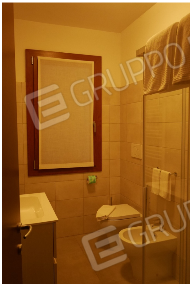
FOTO 9 - Edificio ad uso albergo. Piano primo. Uno dei bagni presenti nelle camere.