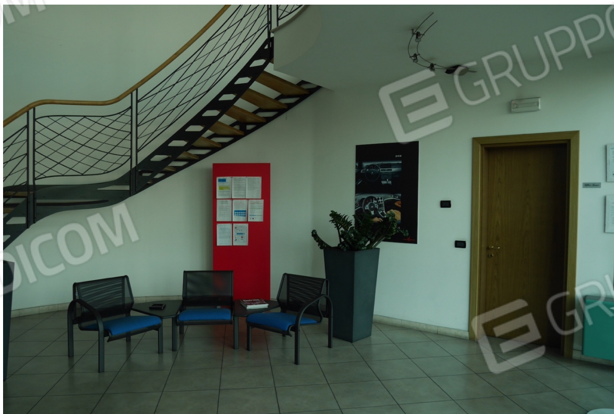
FOTO 2 - La porzione ad uso uffici. Piano terra. L'ingresso principale.