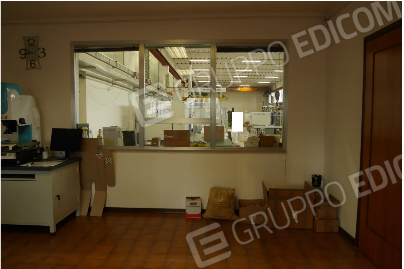
FOTO 11 - Piano terra. Locale ad uso ufficio.