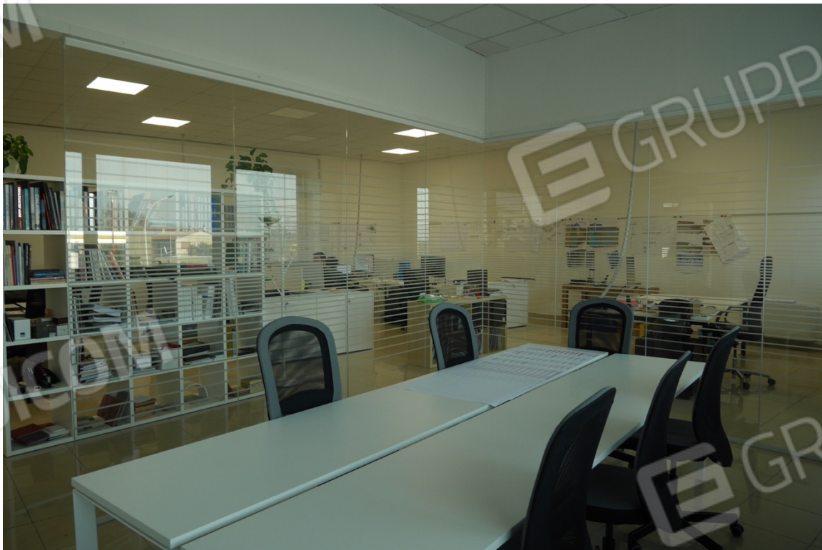
FOTO 18 - Porzione ad uso ufficio. Piano primo.