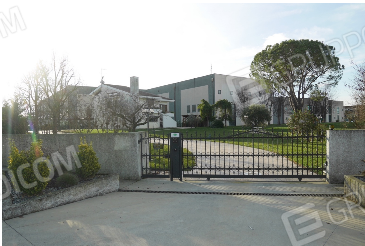
FOTO 6 - Edificio ad uso albergo di cui al mappale 655. L'accesso.