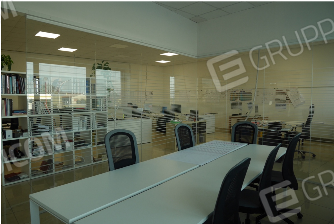
FOTO 18 - Porzione ad uso ufficio. Piano primo.