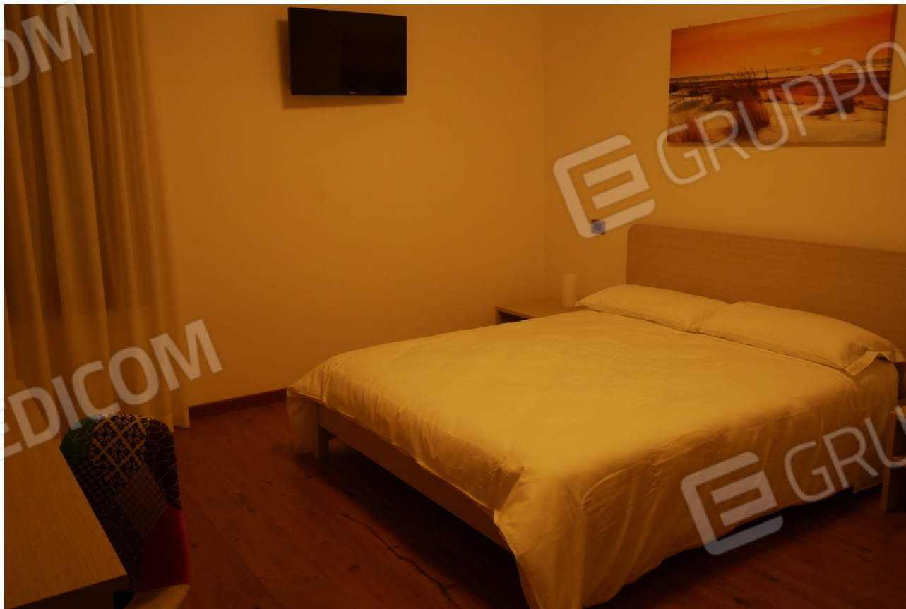
FOTO 8 - Edificio ad uso albergo. Piano primo. Una delle camere.