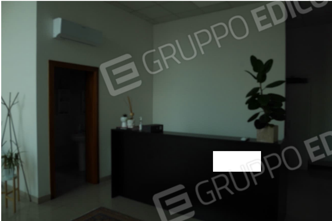
FOTO 17 - Porzione ad uso ufficio. Piano terra.