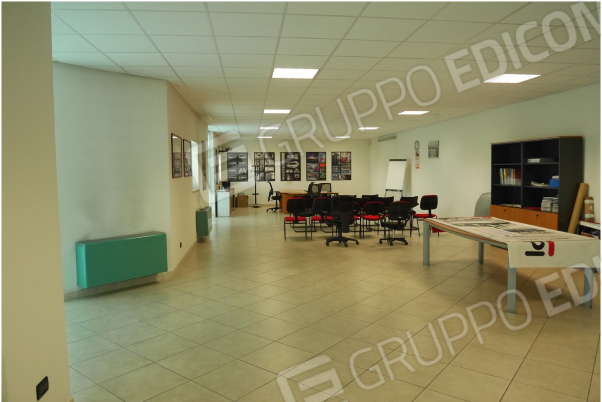
FOTO 3 - La porzione ad uso uffici. Piano primo. Sala riunioni.