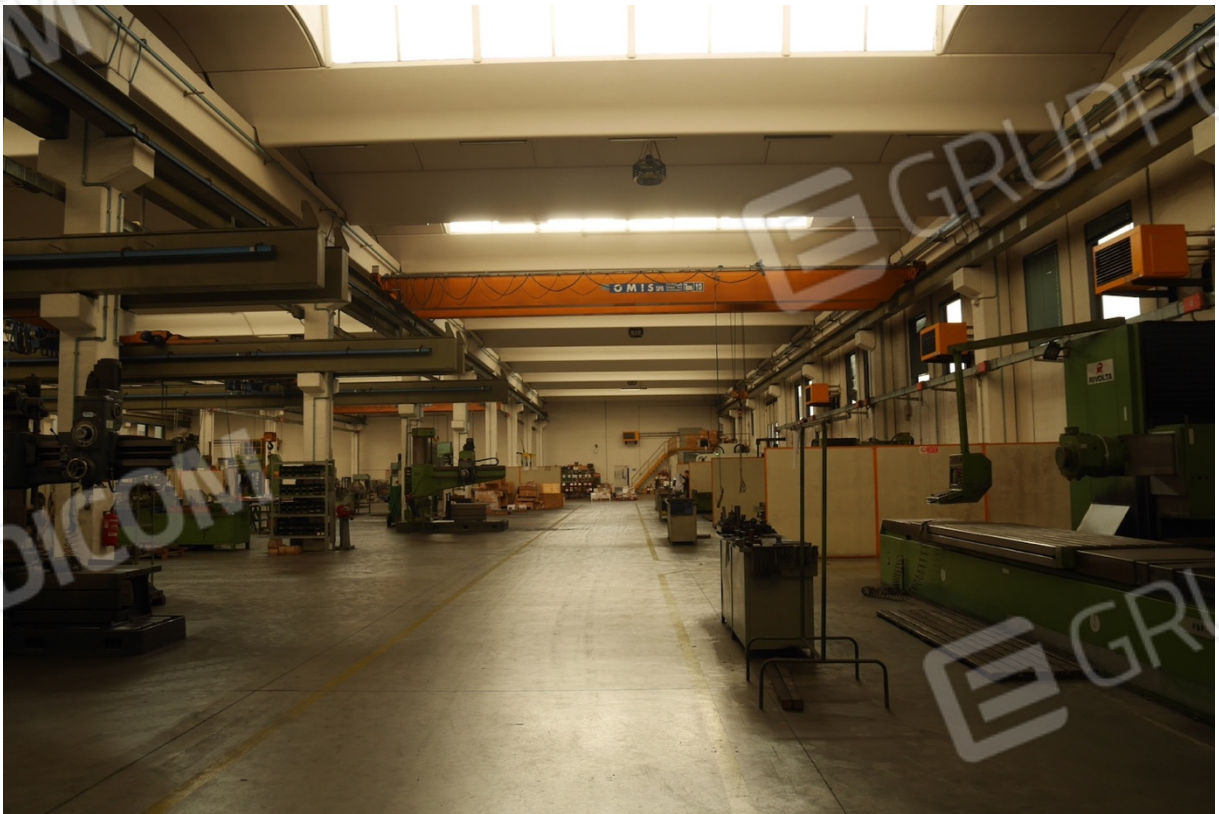
FOTO 4 - La porzione ad uso capannone.