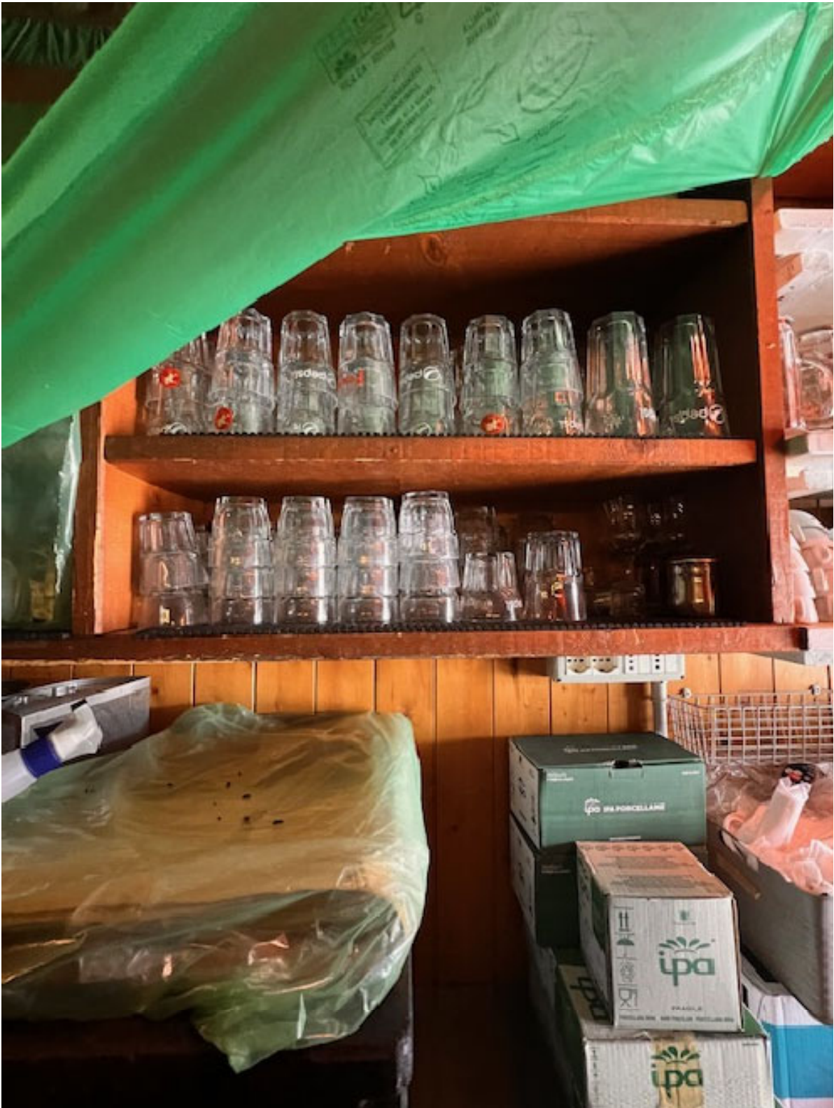
Figura 11 STOVIGLIE 1