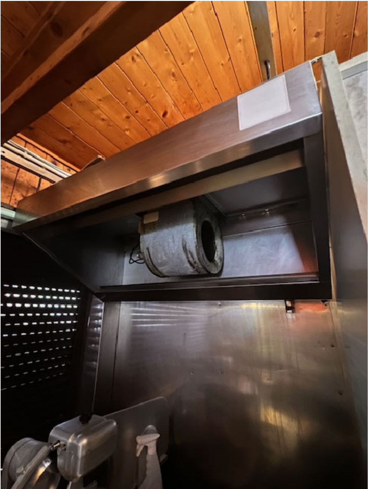
Figura 10 CAPP