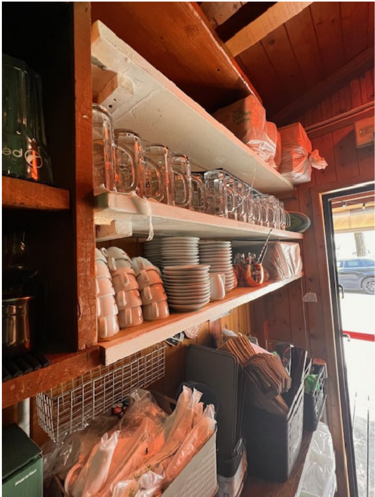
Figura 12 STOVIGLIE 2