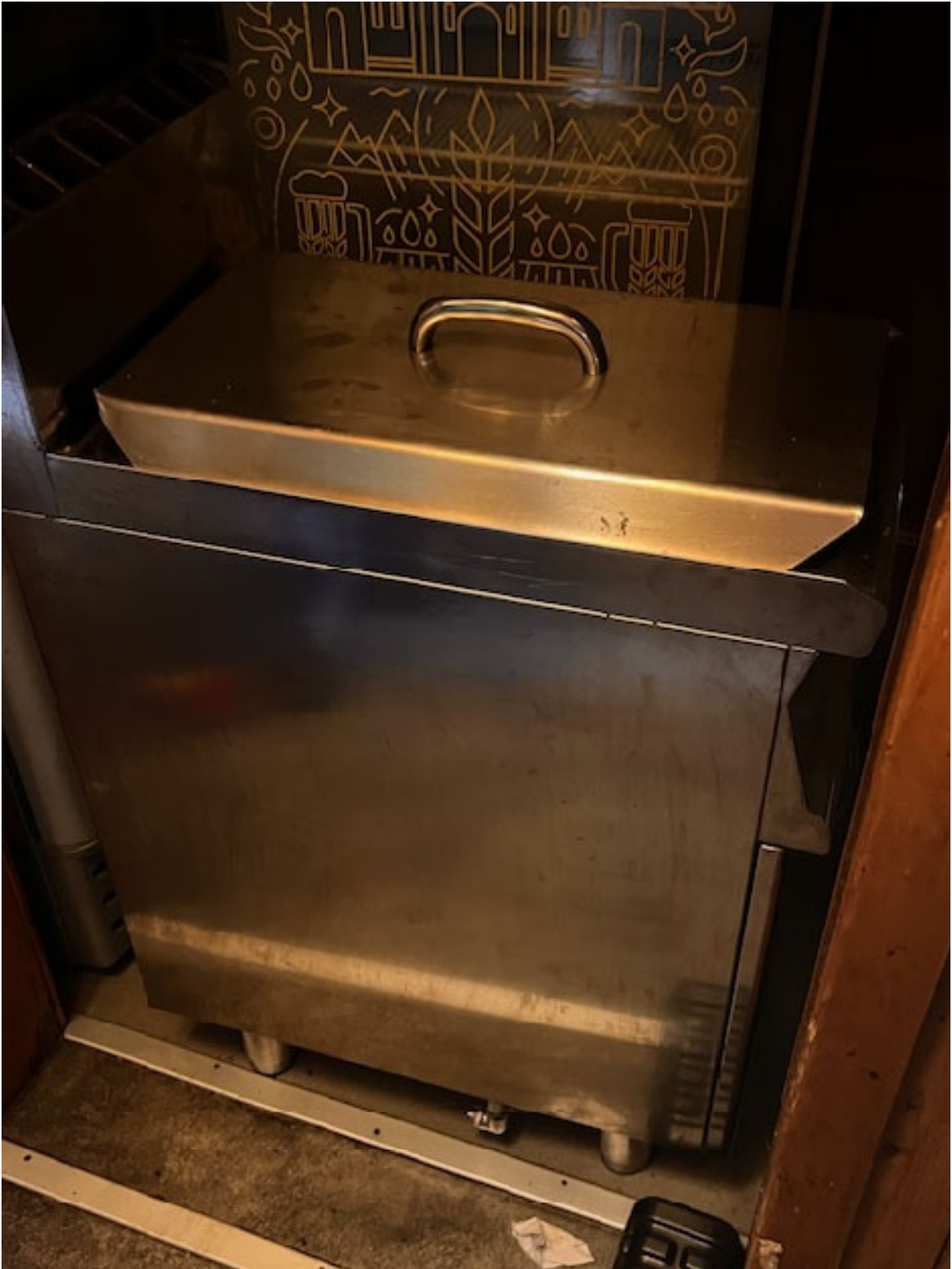
Figura 1 FRIGGITRICE