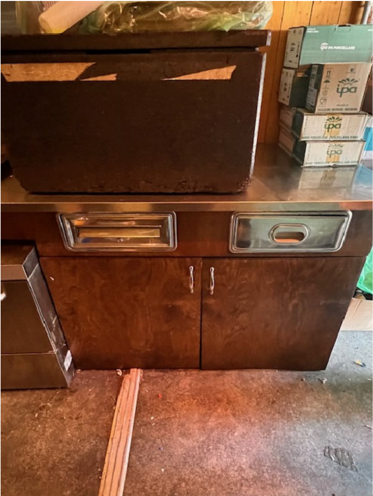
Figura 8 MOBILE ATTREZZATURA 1