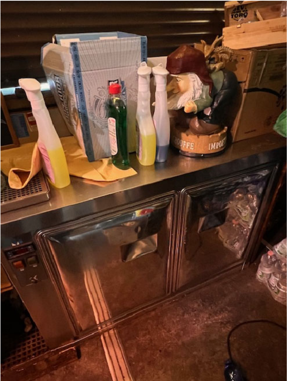
Figura 7 BANCO FRIGO 2