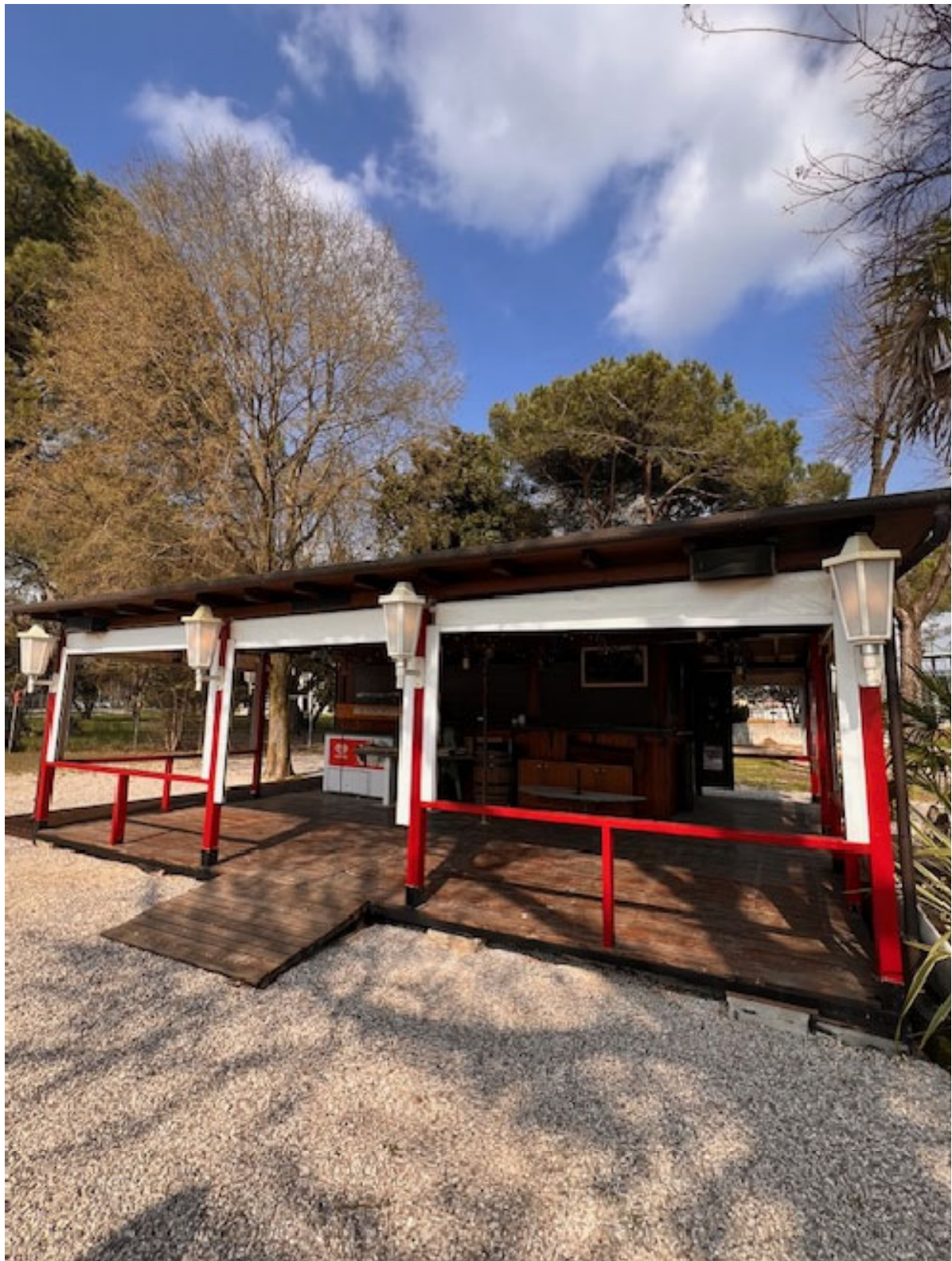
Figura 13 STRUTTURA ESTERNA 1