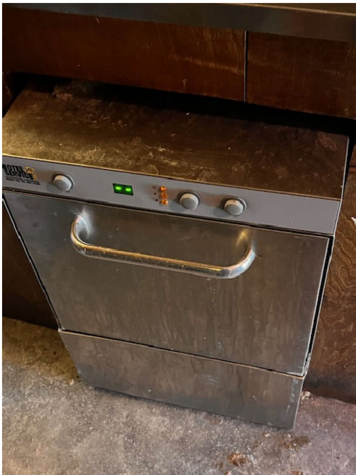
Figura 4 LAVABICCHIERI