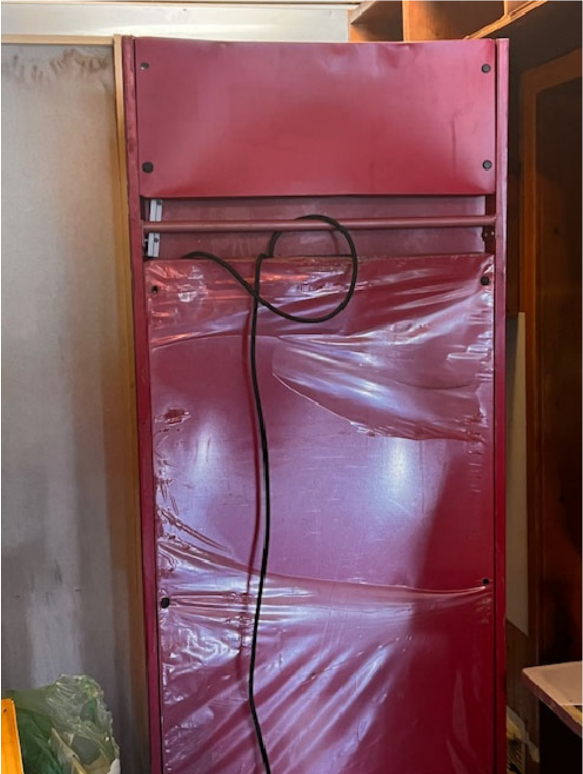
Figura 17 n. 1 FRIGO COLONNA EURODRINK