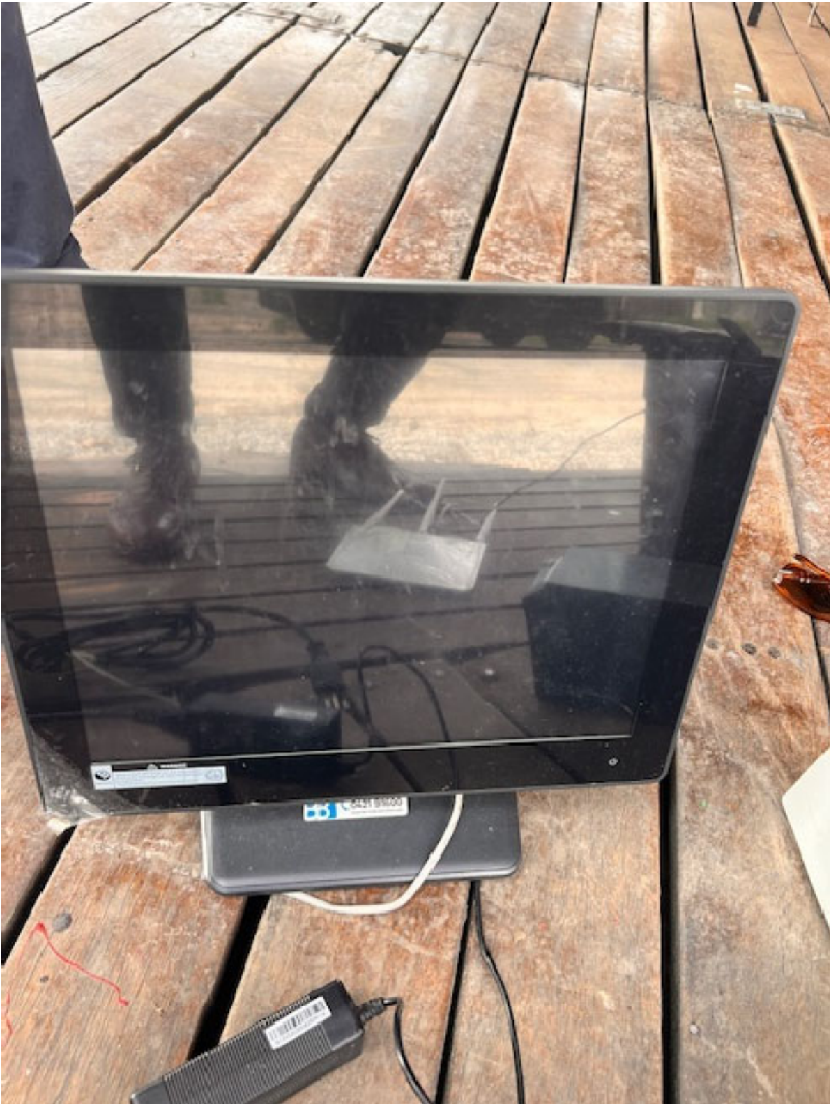
Figura 25 CPU COMPUTER E SCHERMO 15"