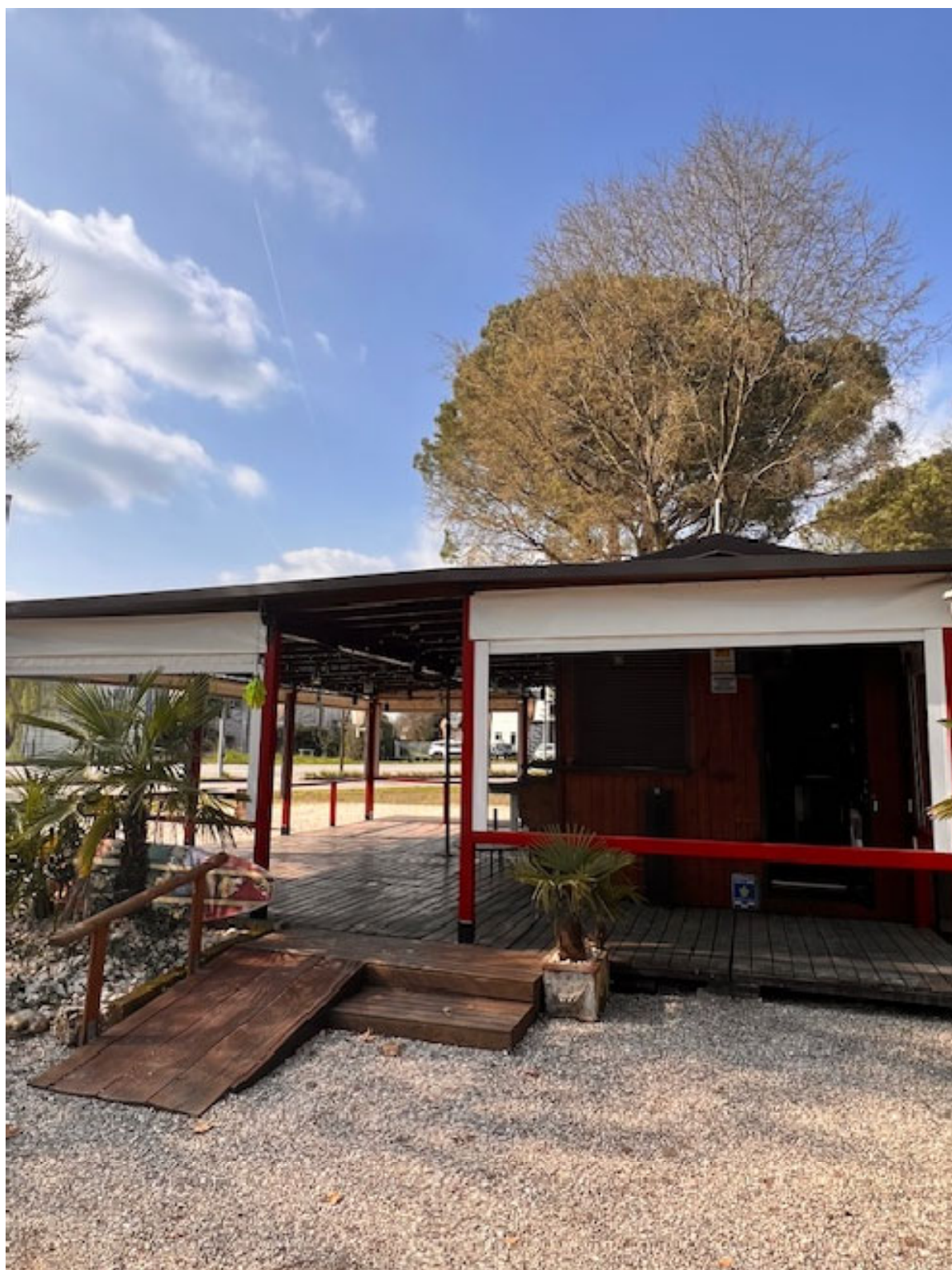
Figura 14 STRUTTURA ESTERNA 2