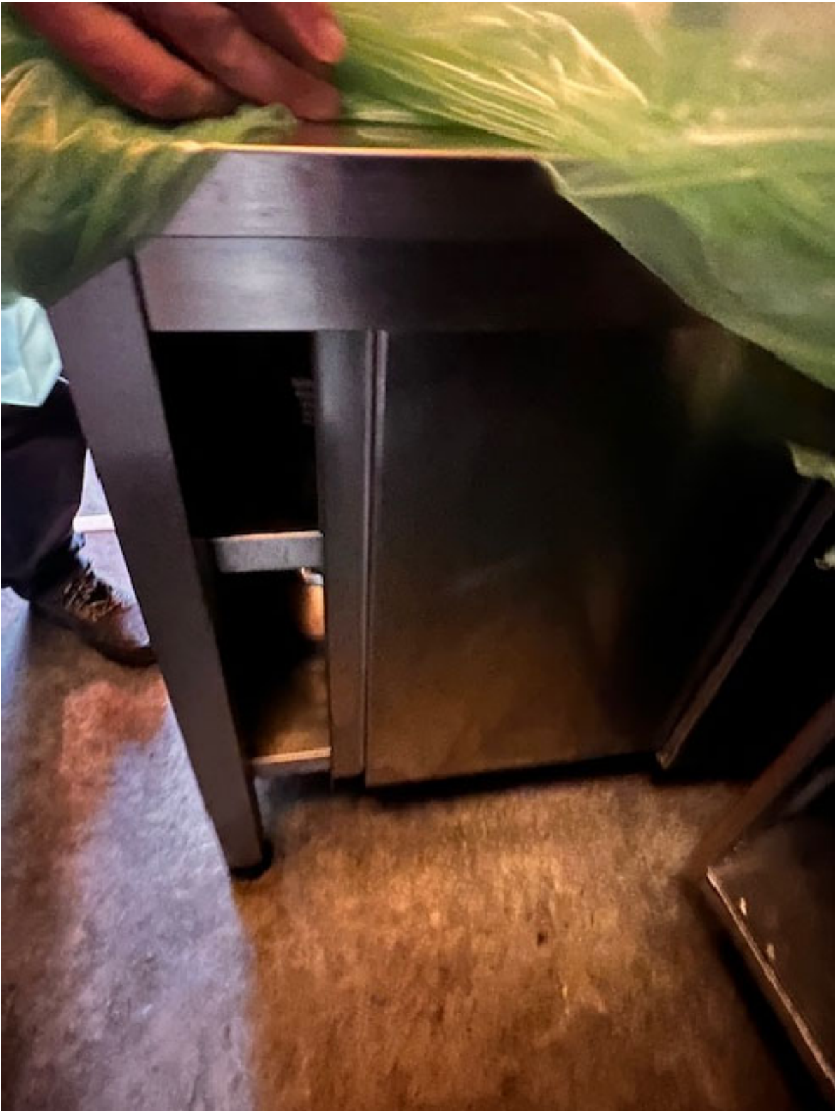
Figura 9 MOBILE ATTREZZATURA 2