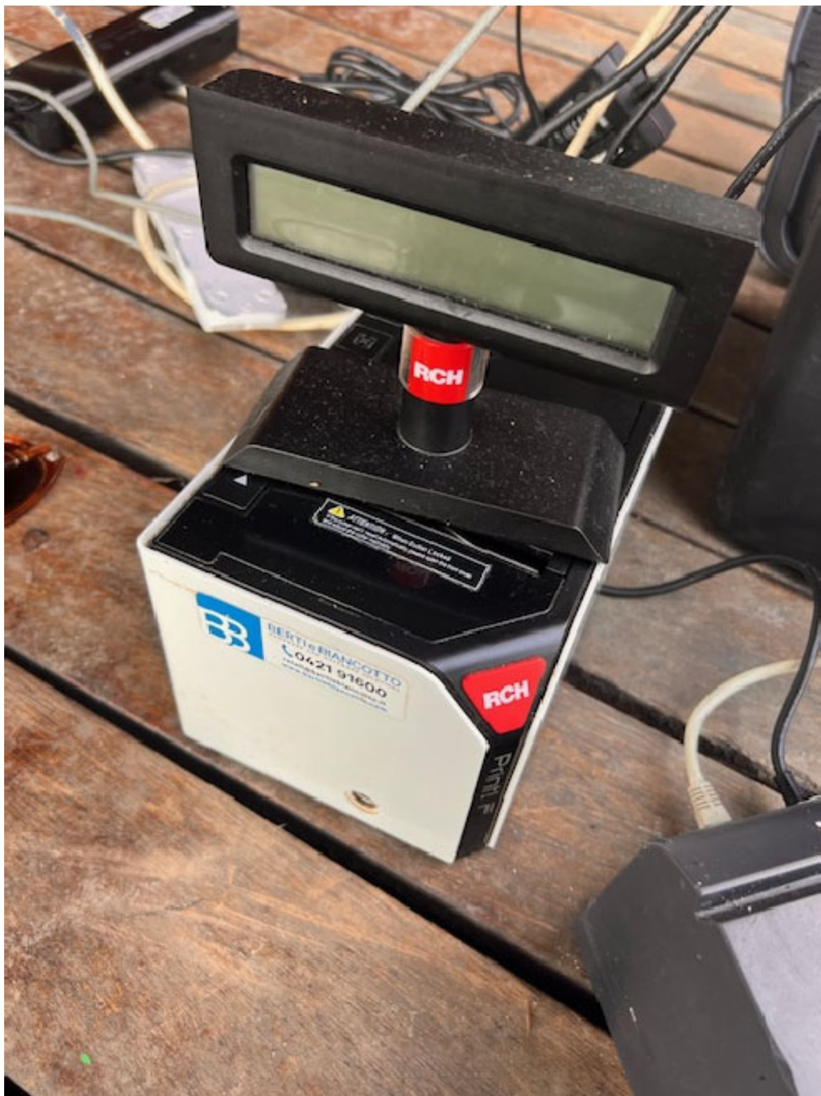
Figura 24 STAMPANTE FISCALE RICOH