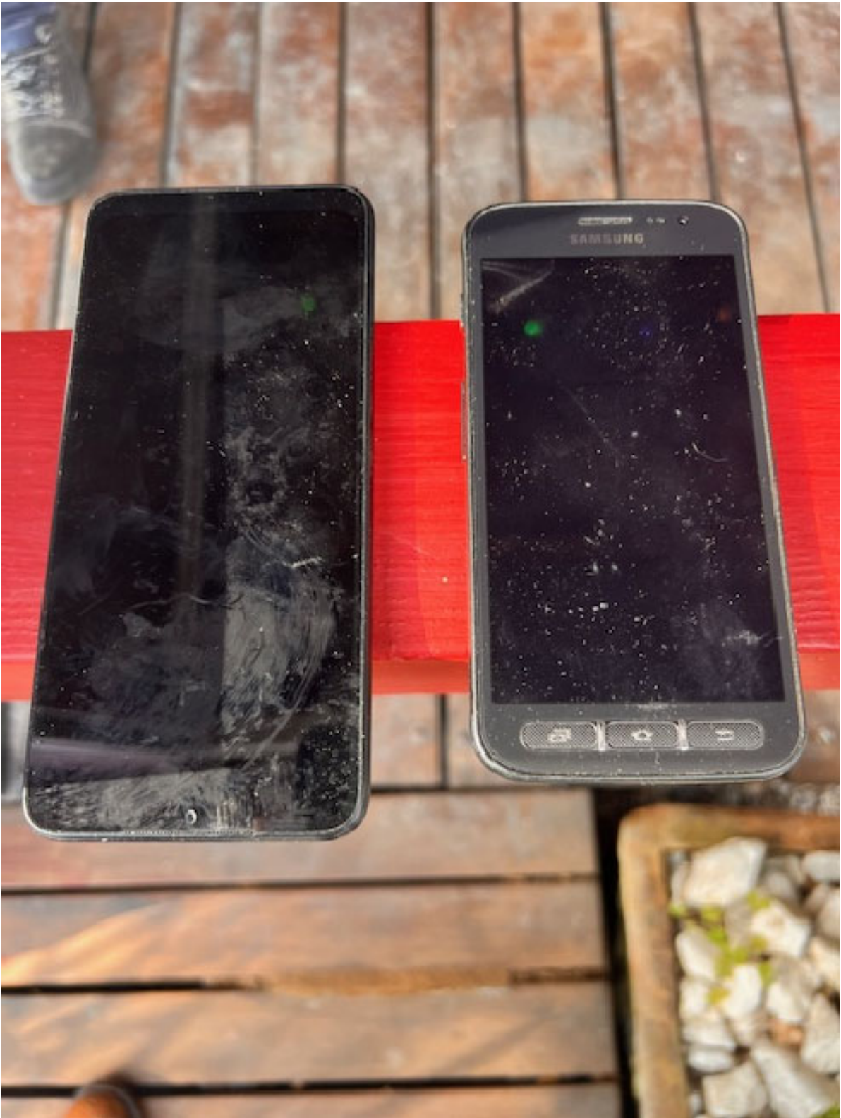
Figura 20 PALMARI