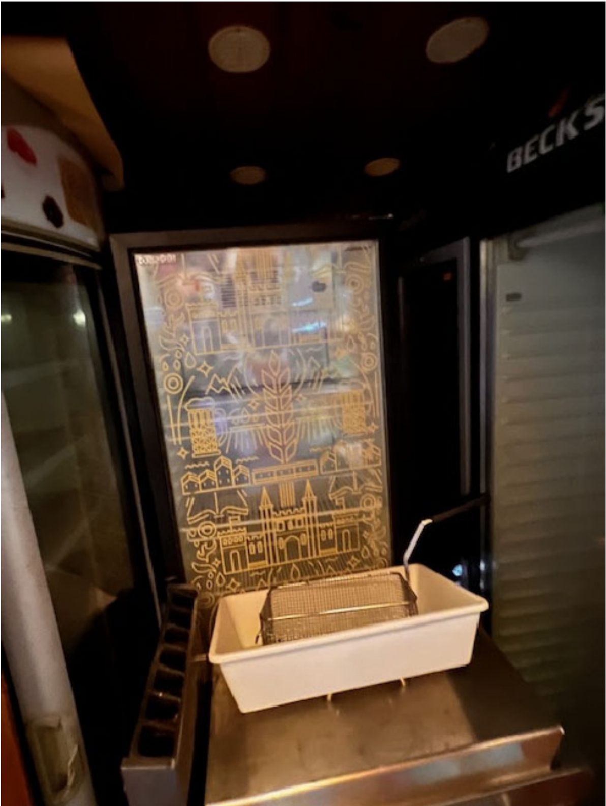
Figura 18 n. 4 FRIGO COLONNA EURODRINK