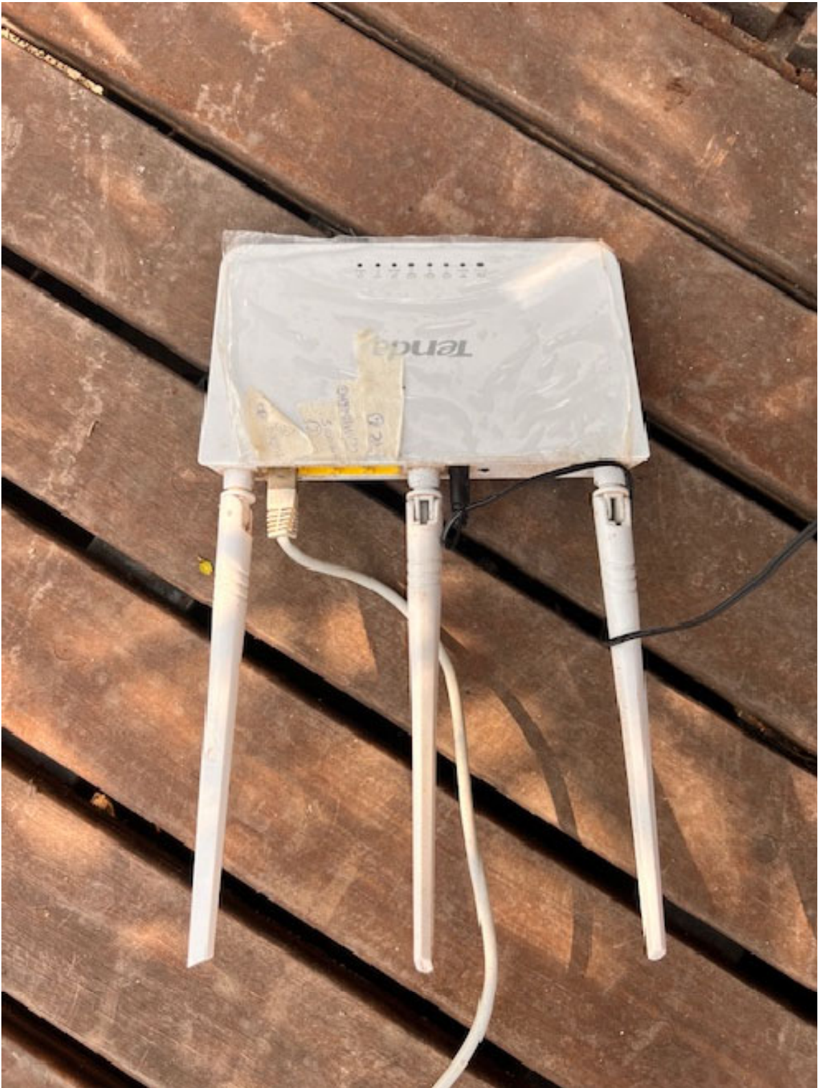
Figura 21 ACCESS POINT