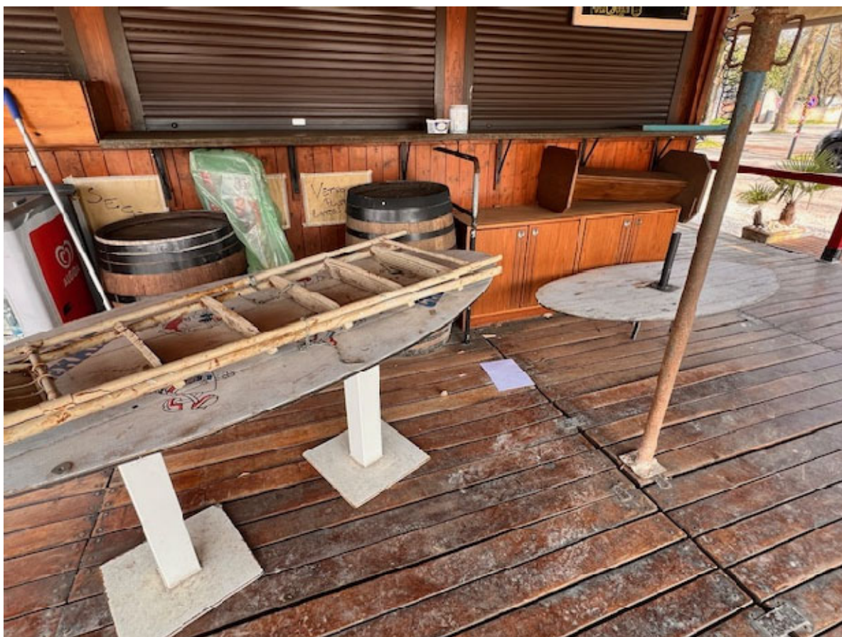
Figura 16 MOBILI ED ATTREZZATURE ESTERNE

All'interno e all'esterno della struttura sono presenti i seguenti beni in comodato d'uso alcuni dei quali oggetto di rivendica: