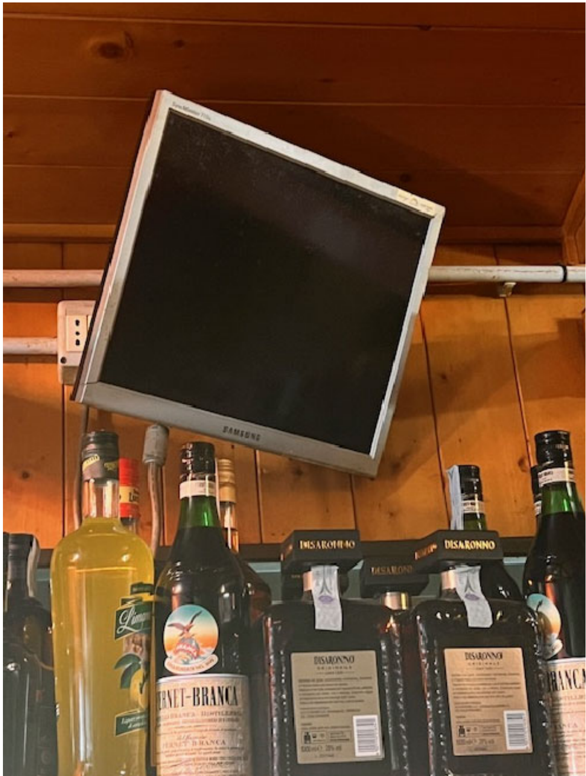
Figura 15 MONITO IMPIANTO SICUREZZA NON FUNZIONANTE