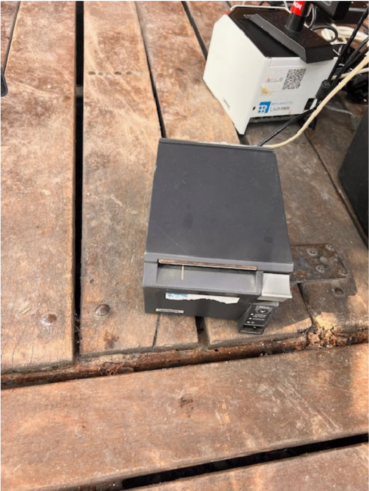
Figura 23 STAMPANTE EPSON