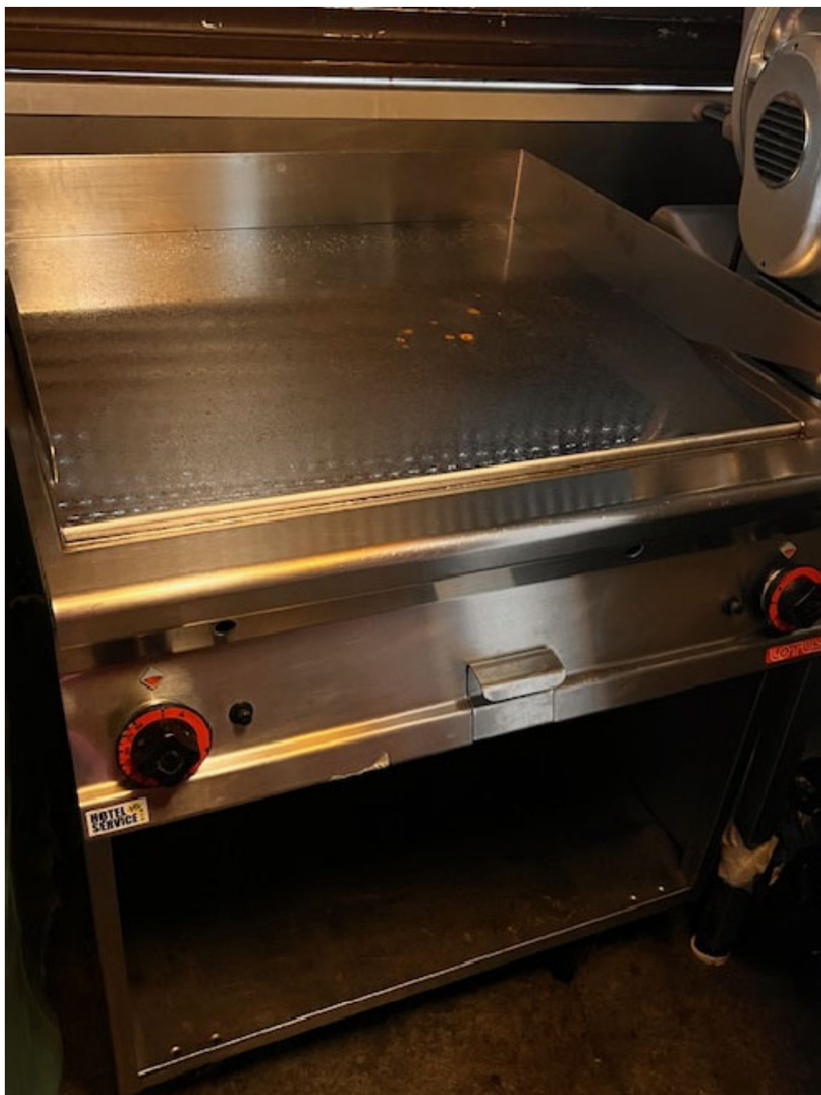
Figura 2 PIASTRA