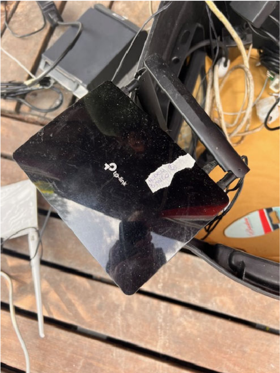
Figura 22 SWITCH