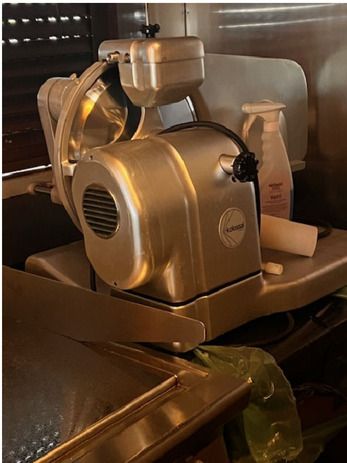
Figura 3 AFFETTATRICE