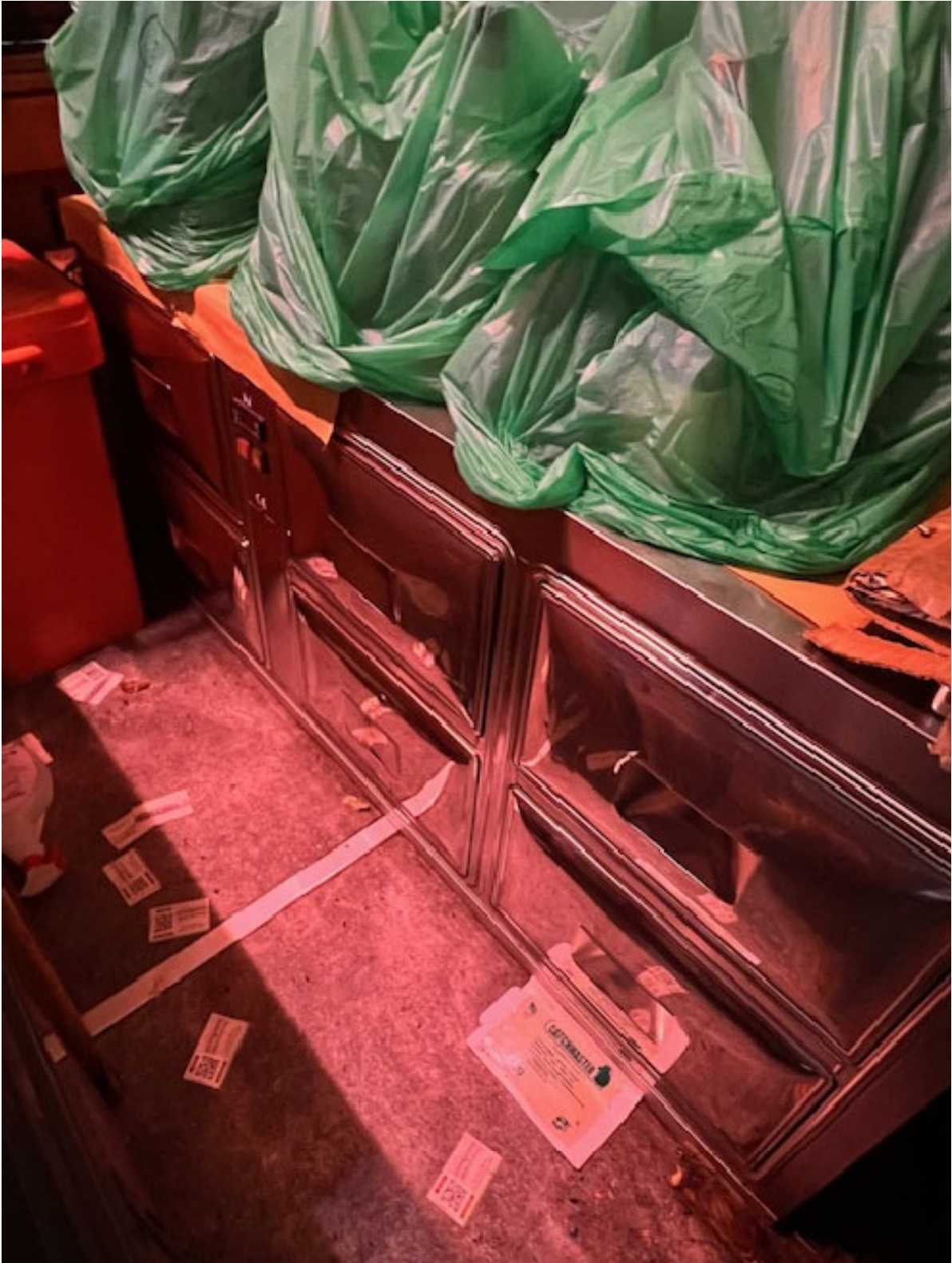
Figura 6 BANCO FRIGO 1