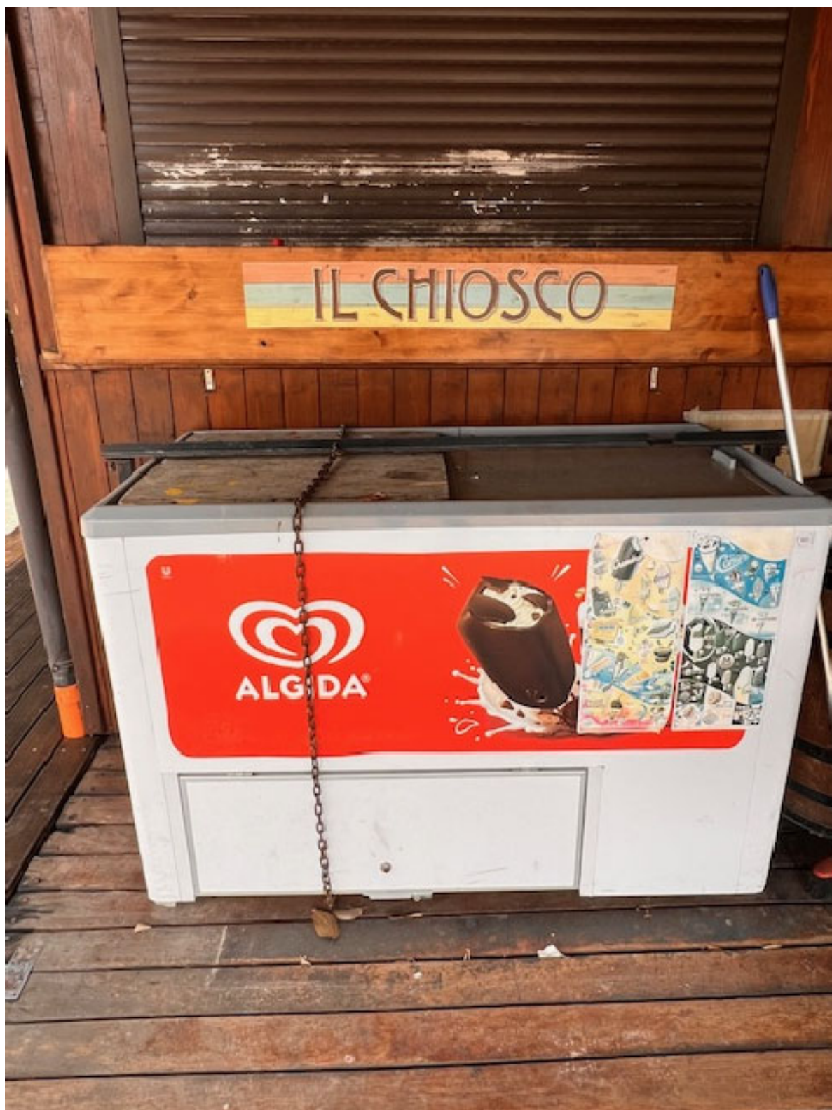
Figura 19 FRIGO ALGIDA