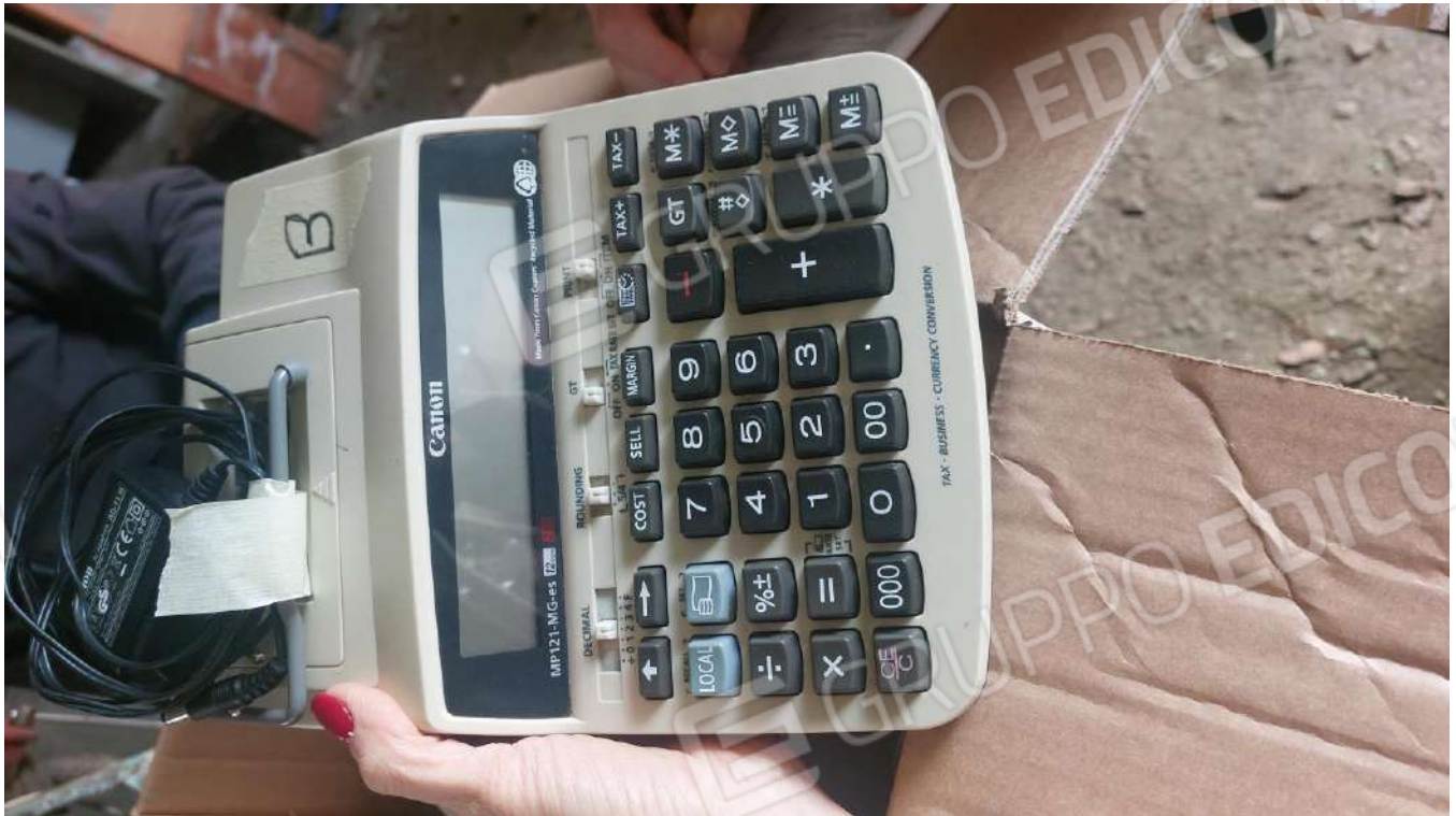
Figura 2, CALCOLATRICE CANON