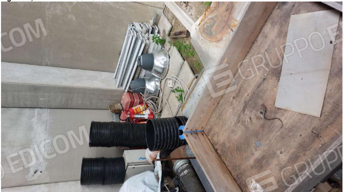
Figura 43, ESTINTORI