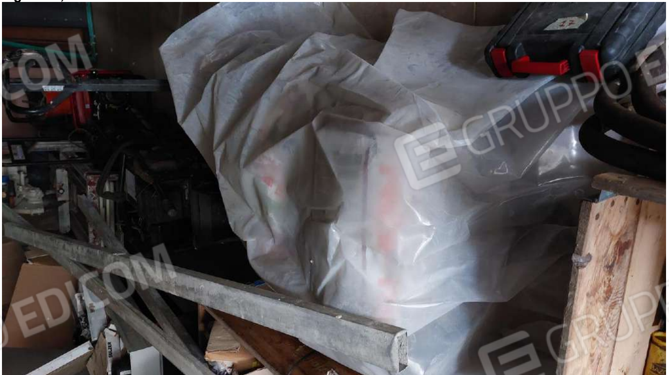
Figura 41, STADIA MURRATORE ALLUMINIO