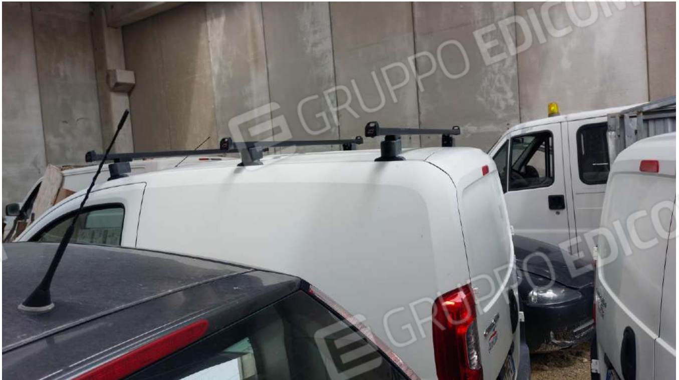
Figura 42, BARRE IN ACCIAIO PORTA OGGETTI