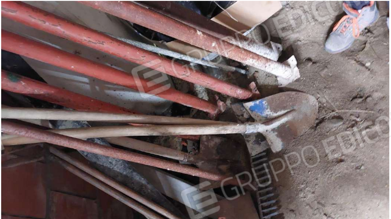
Figura 36, BADLR STEEL TEMPERATO CON MANICO