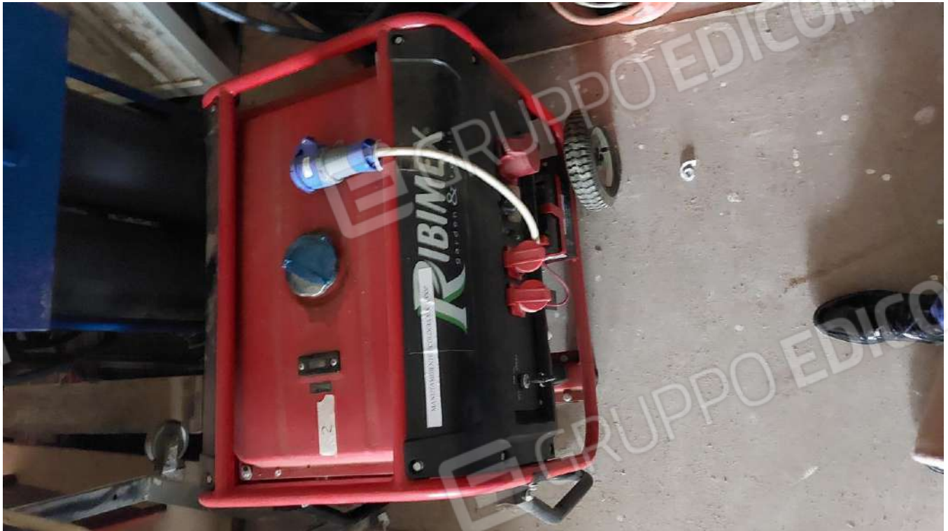
Figura 16, GENERATORE CORRENTE 4 TEMPI