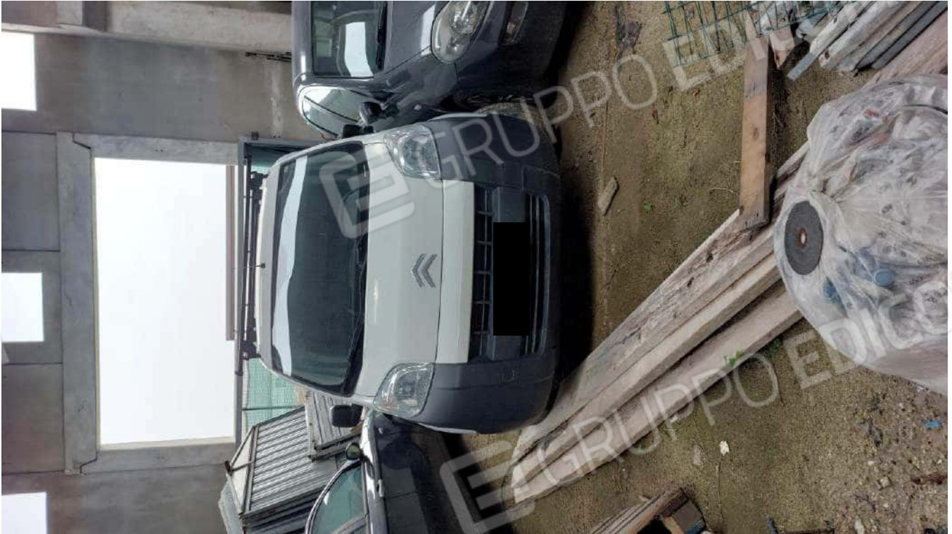
Figura 10 NEMO VAN [REDACTED]