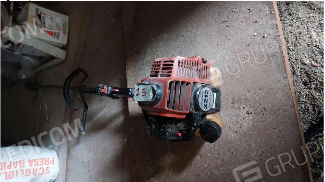
Figura 29, DECESPUGLIATORE