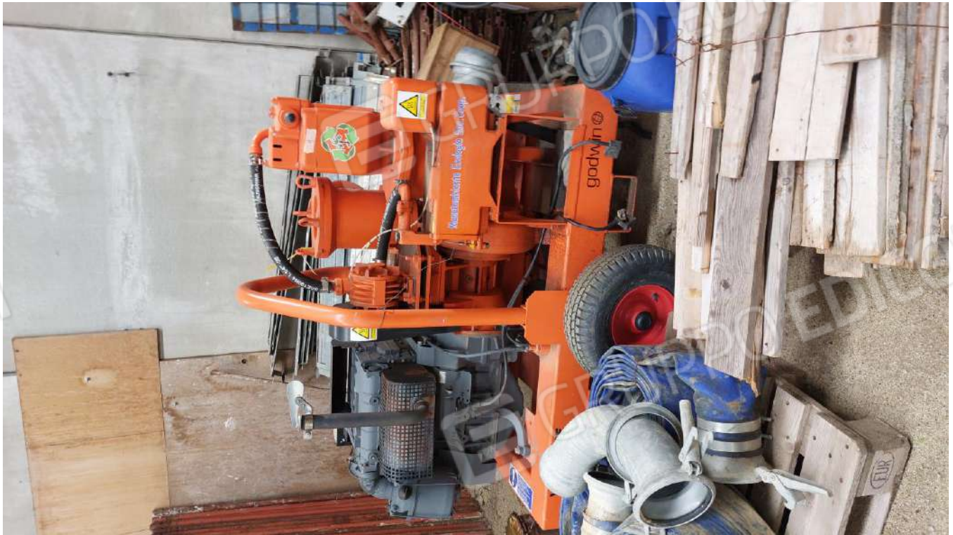
Figura 18, MOTOPOMPA GODWIN VAC PRIME