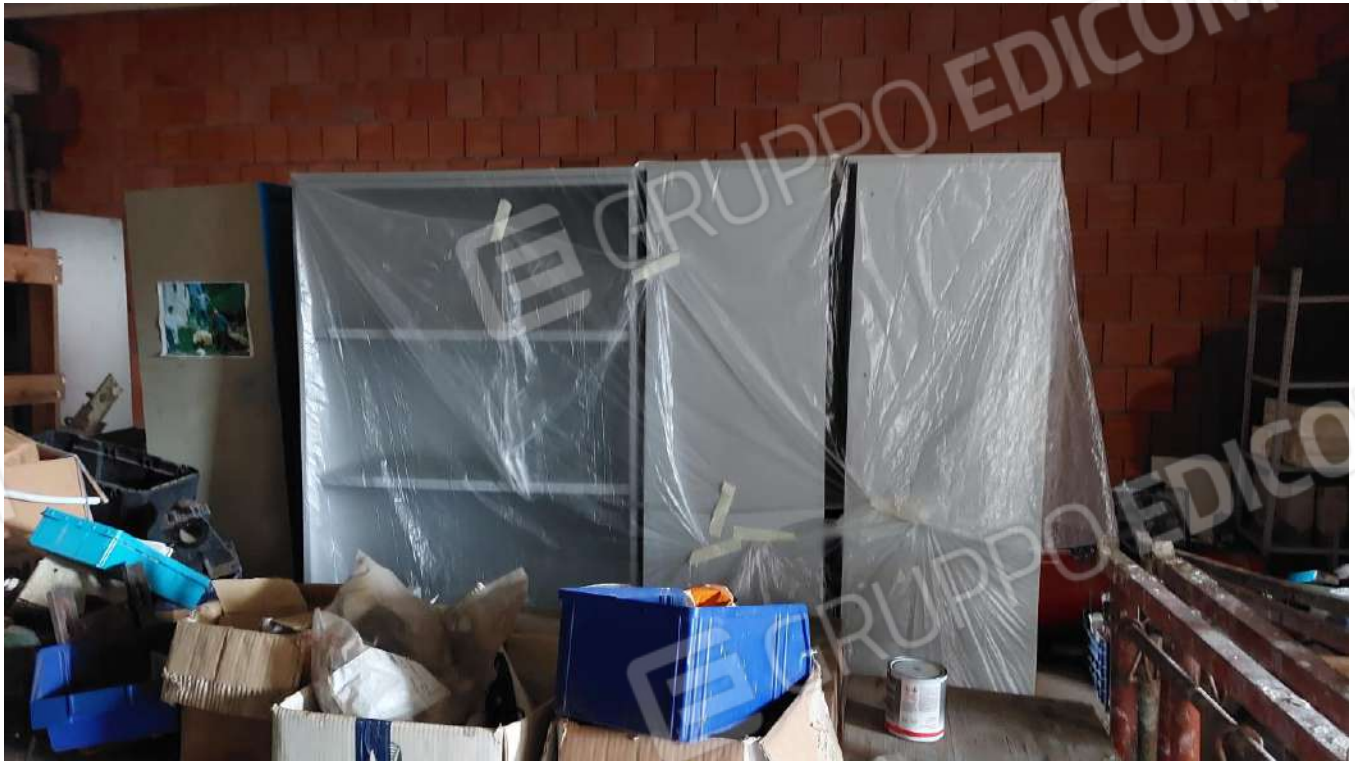
Figura 13, 7 SCAFFALI IN LEGNO COLOR GRIGIO