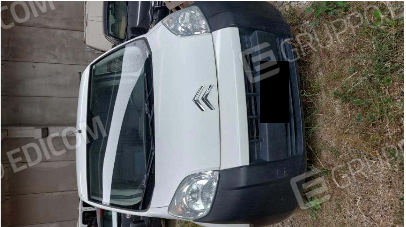
Figura 11 NEMO VAN [REDACTED]