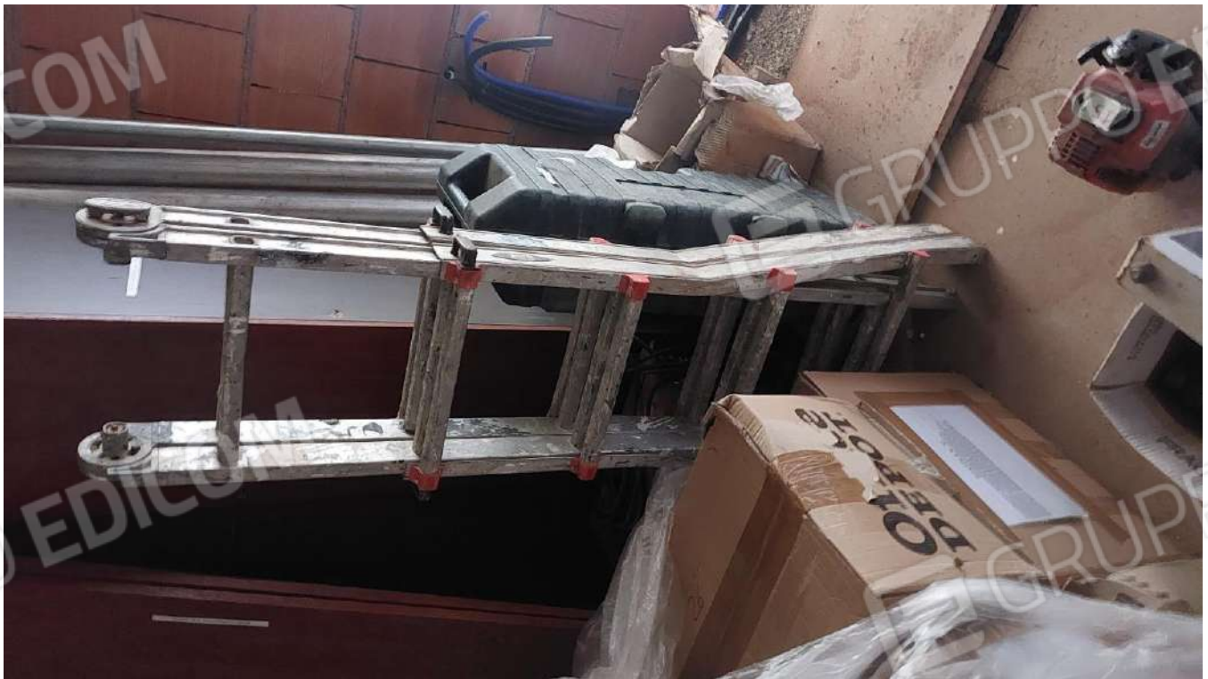
Figura 37, SCALA PIEGHEVOLE