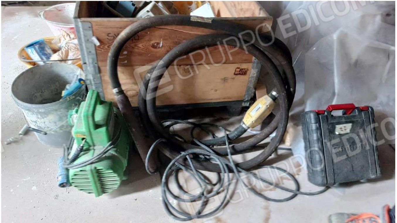
Figura 30 AGO VIBRANTE