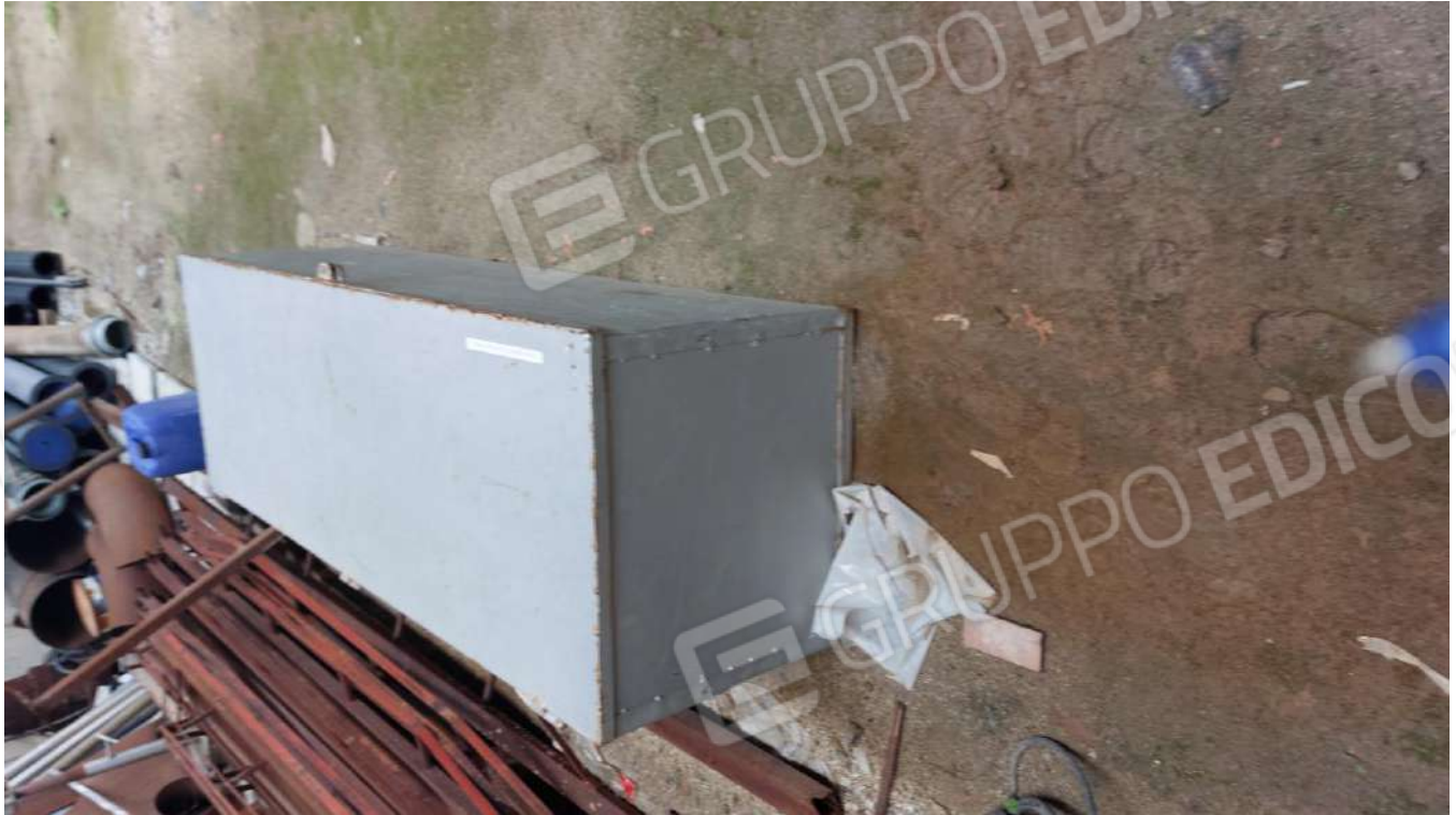
Figura 47, CASSONE PORTA ATTREZZATURE