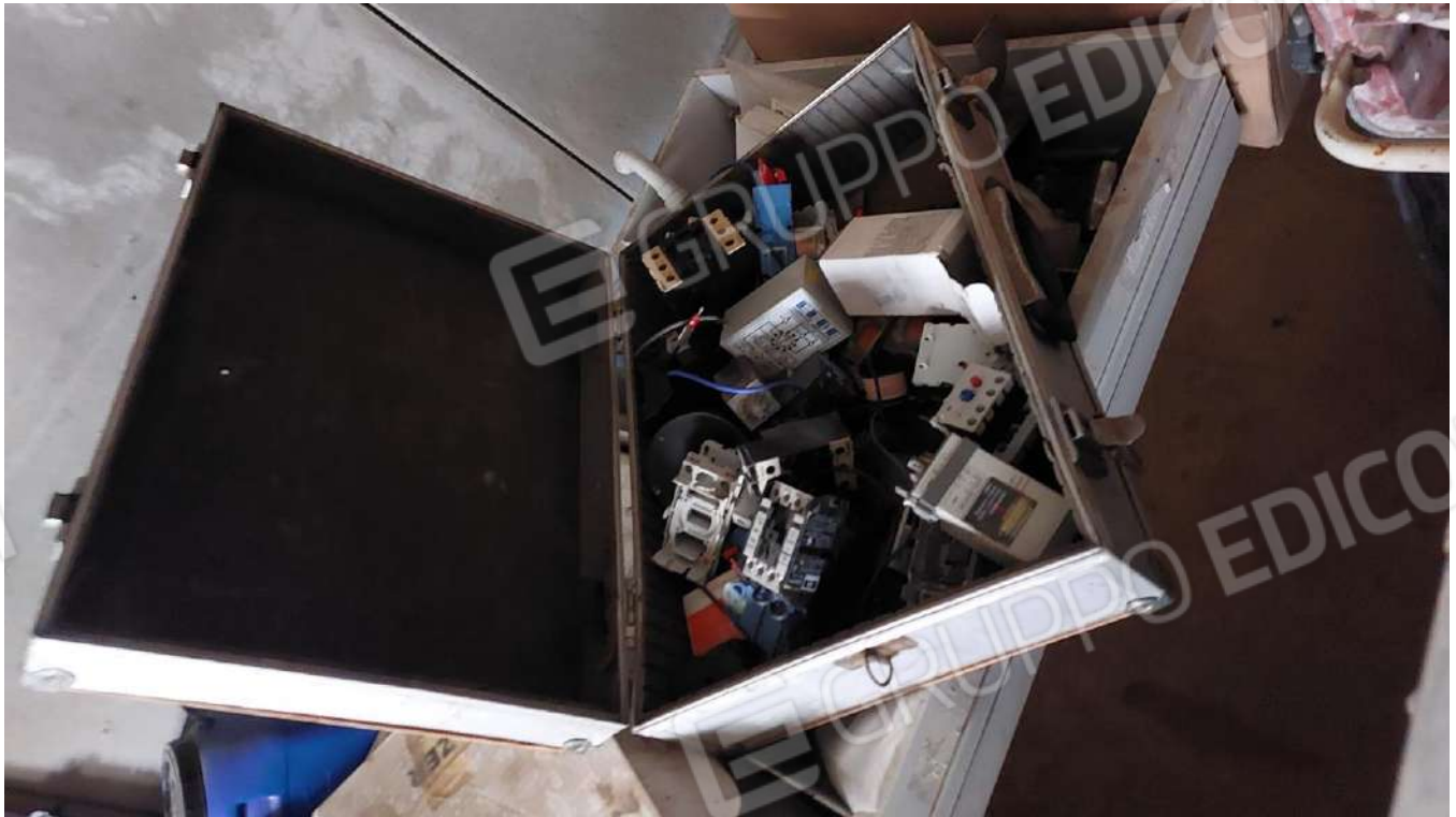
Figura 34, VALIGIA PORTA UTENSILI