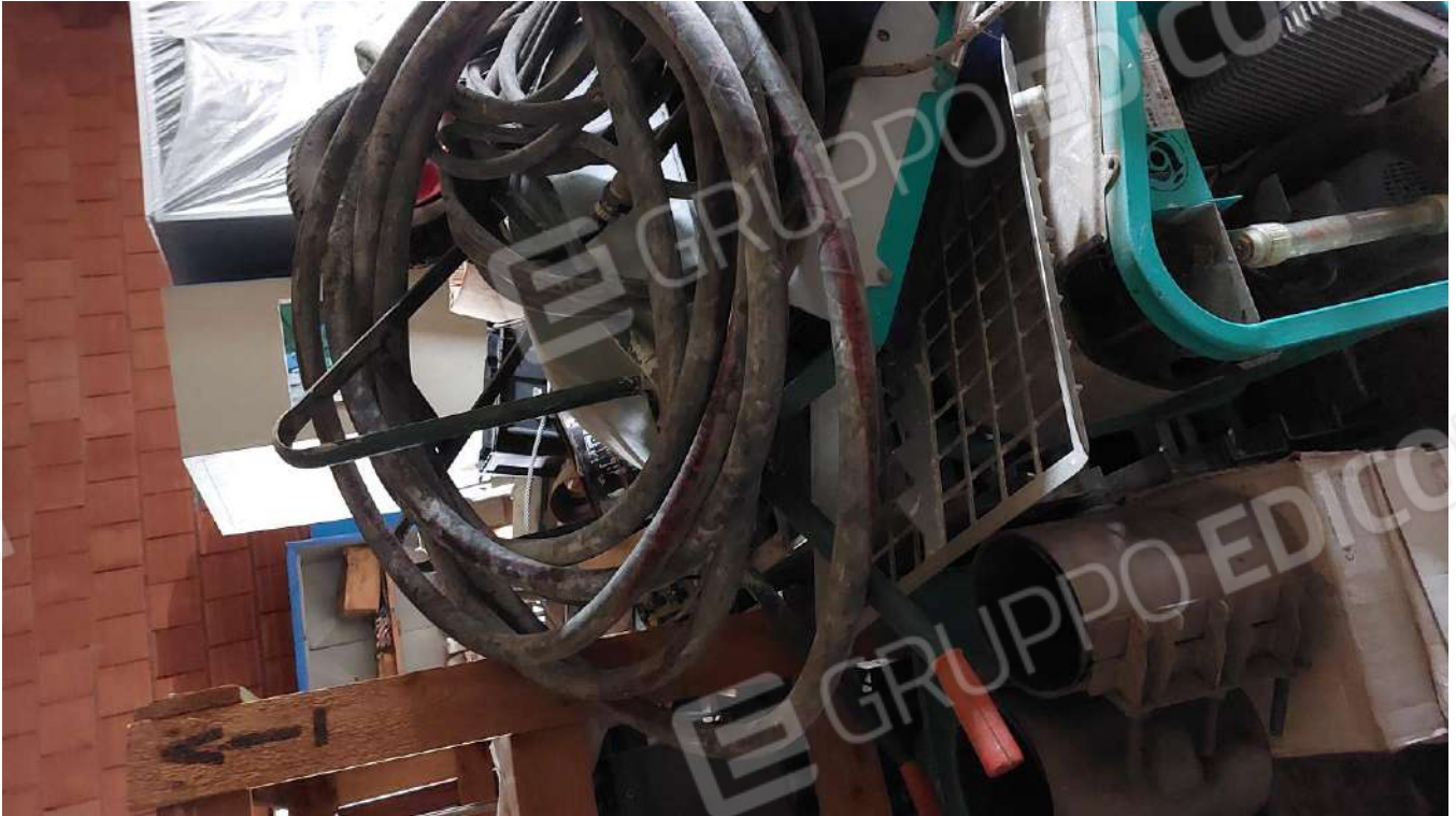
Figura 38, CARRIOLE