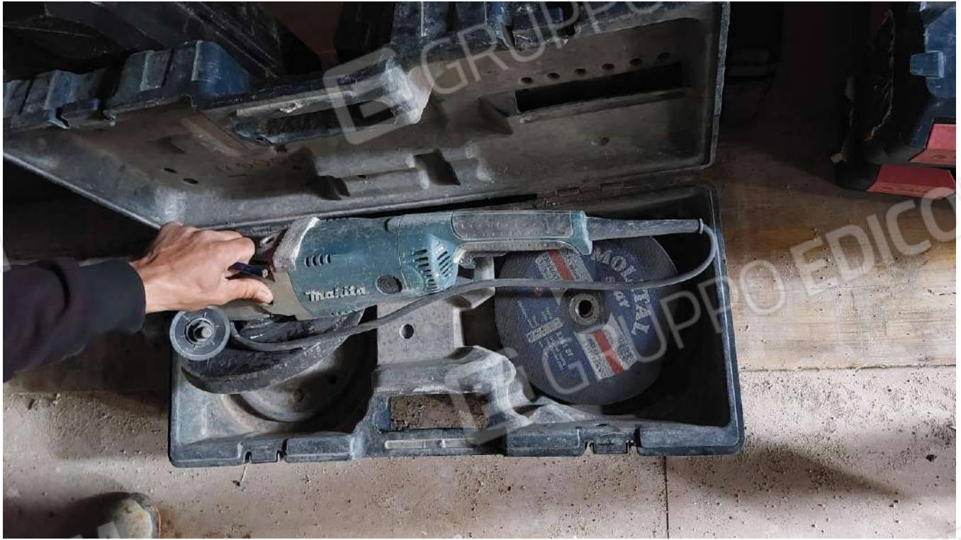
Figura 49, SMERIGLIATORE MACHITA