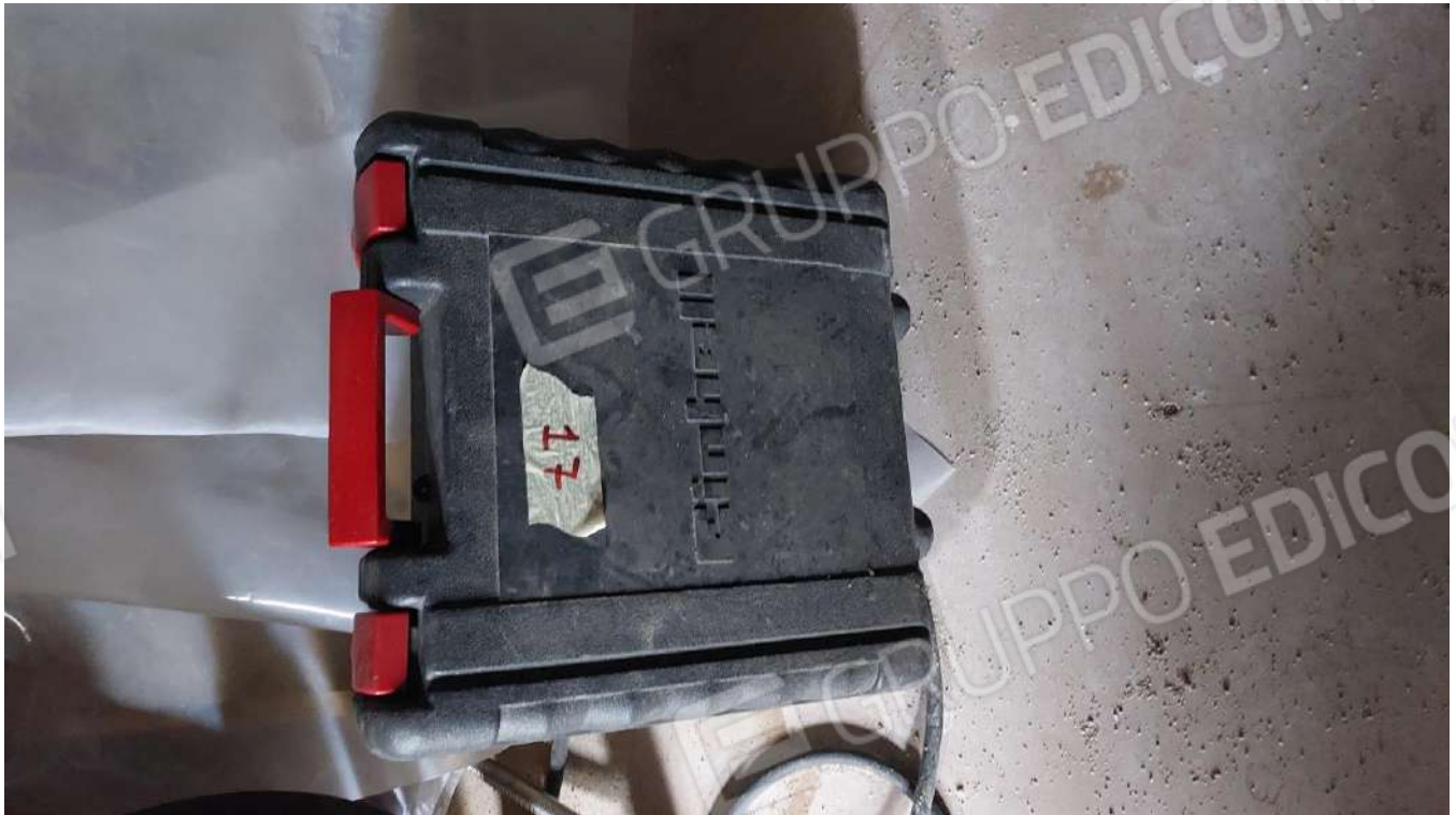
Figura 31 TRAPANO A BATTERIA