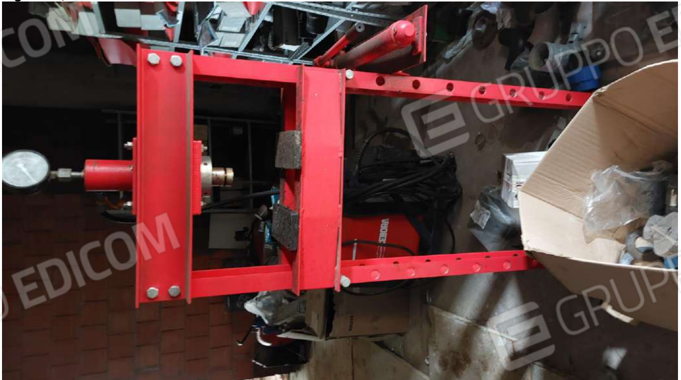
Figura 48, PRESSA IDRAULICA ROSSA