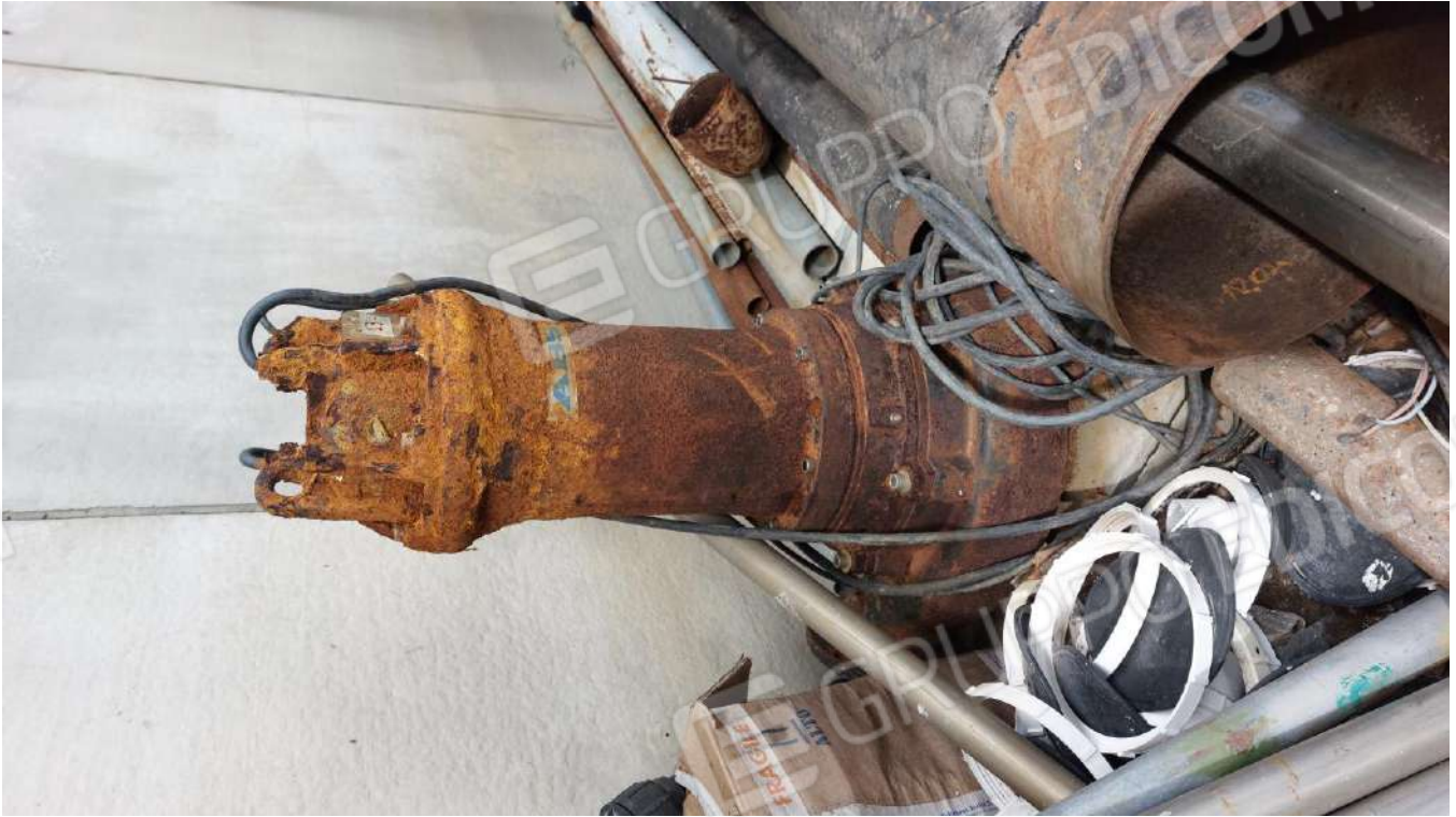
Figura 28, AREATORE SOMMERSO ABS30 KW