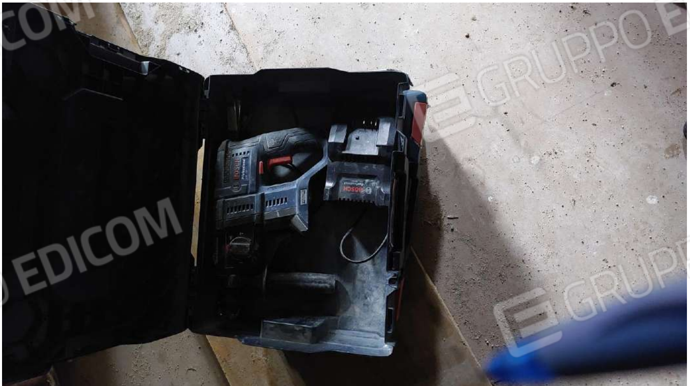
Figura 32 AVVITATORE BOSH