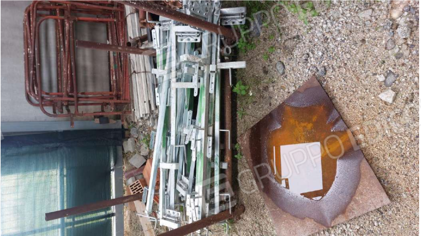
Figura 22 PARAPETTI UNIVERSALI