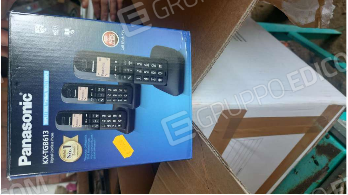
Figura 4 CORDLESS PANASONIC KX T6B13