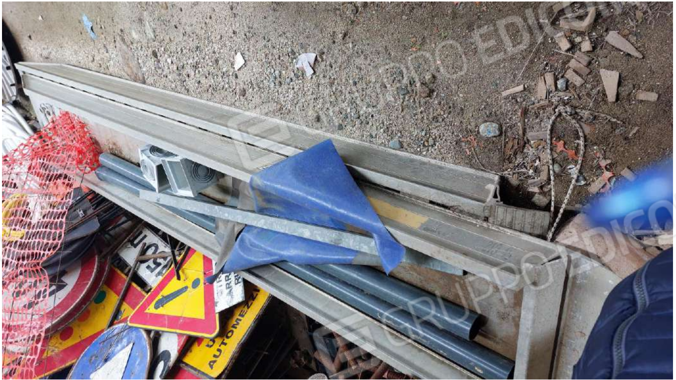
Figura 45, RAMPE IN ALLUMINIO 4,50 MT + 63 CM