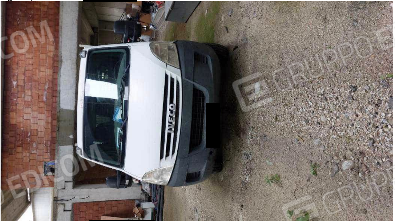
Figura 9 IVECO 35C18D