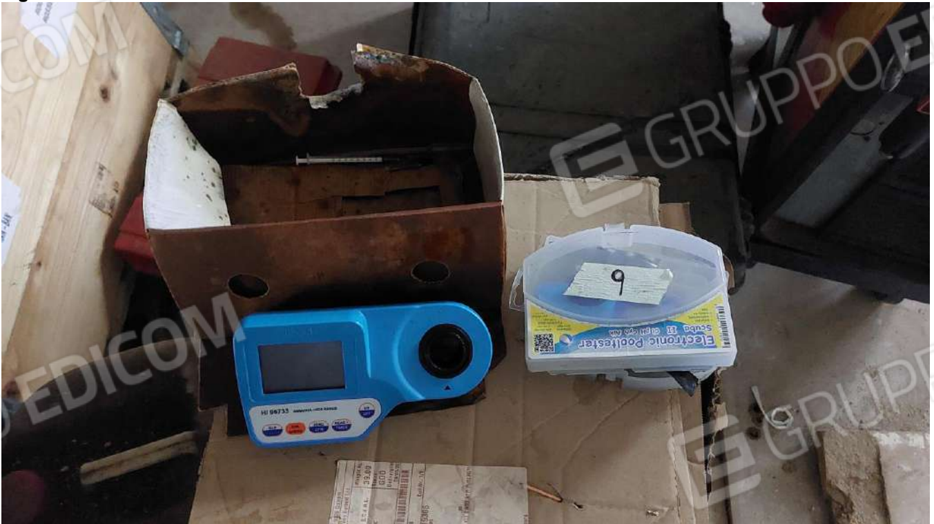
Figura 23 FOTOMETRO PORTATILE PER AMMONIACA