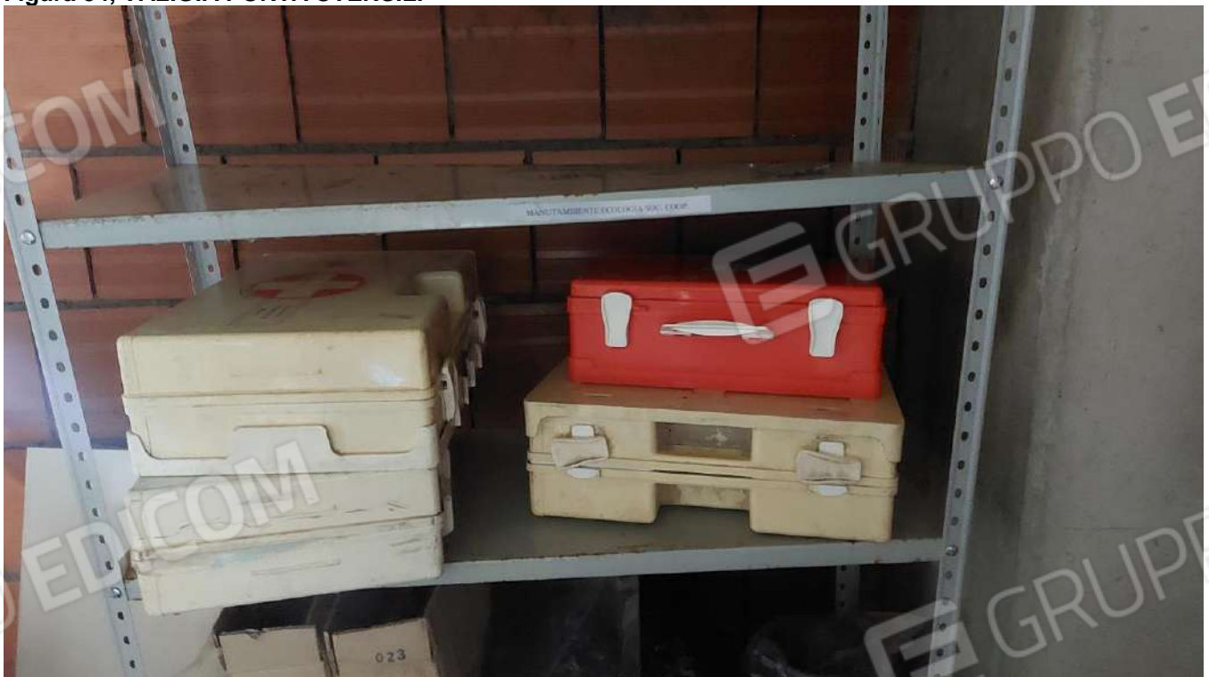
Figura 35, CASSETTE PORTA MEDICINALI