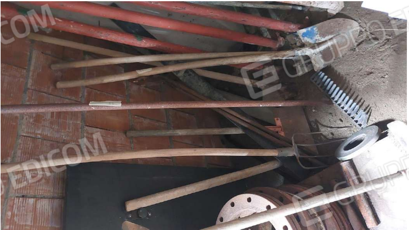
Figura 39, RASTRELLO PESANTE