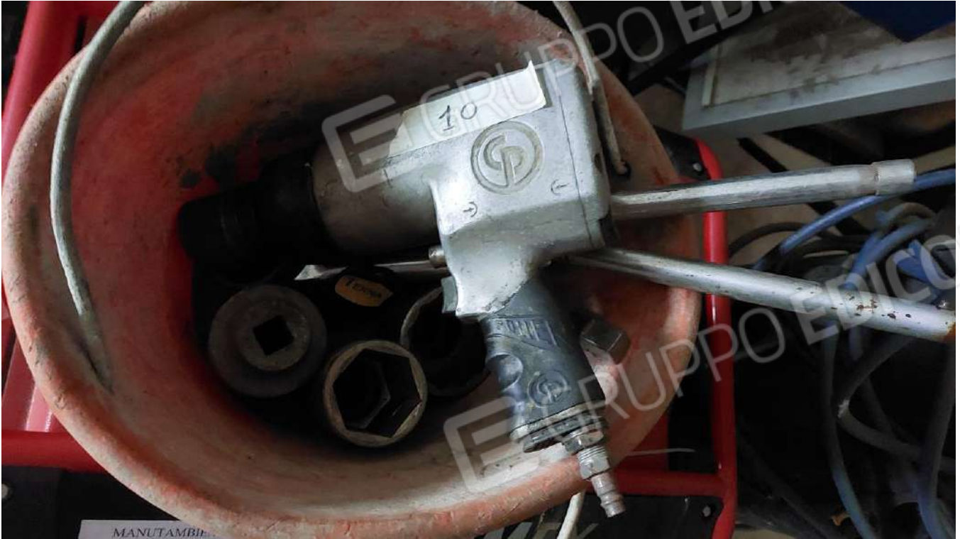
Figura 24 AVVITATORE AD ARIA