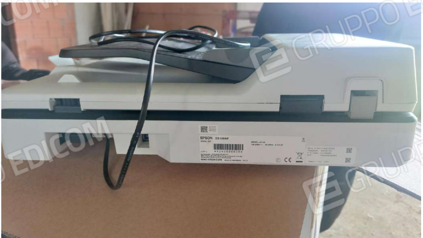
Figura 3 SCANNER EPSON DS 166 W