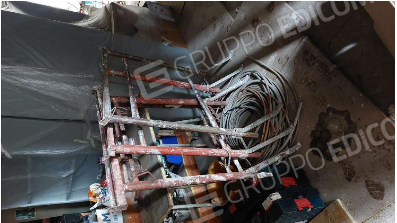
Figura 20, CAVALLETTO DOPPIO 100 + 190