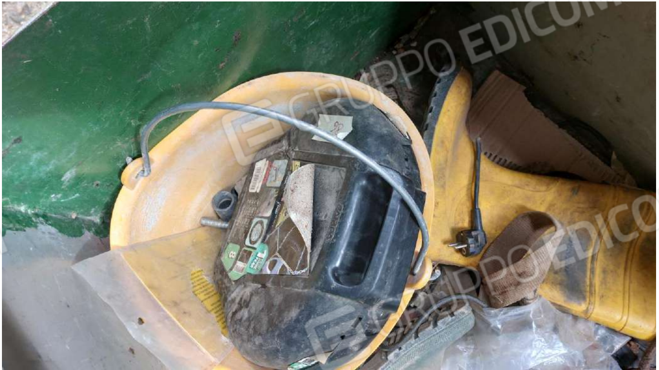
Figura 40, CATENE DA NECE GRUPPO 7 PER NEMO