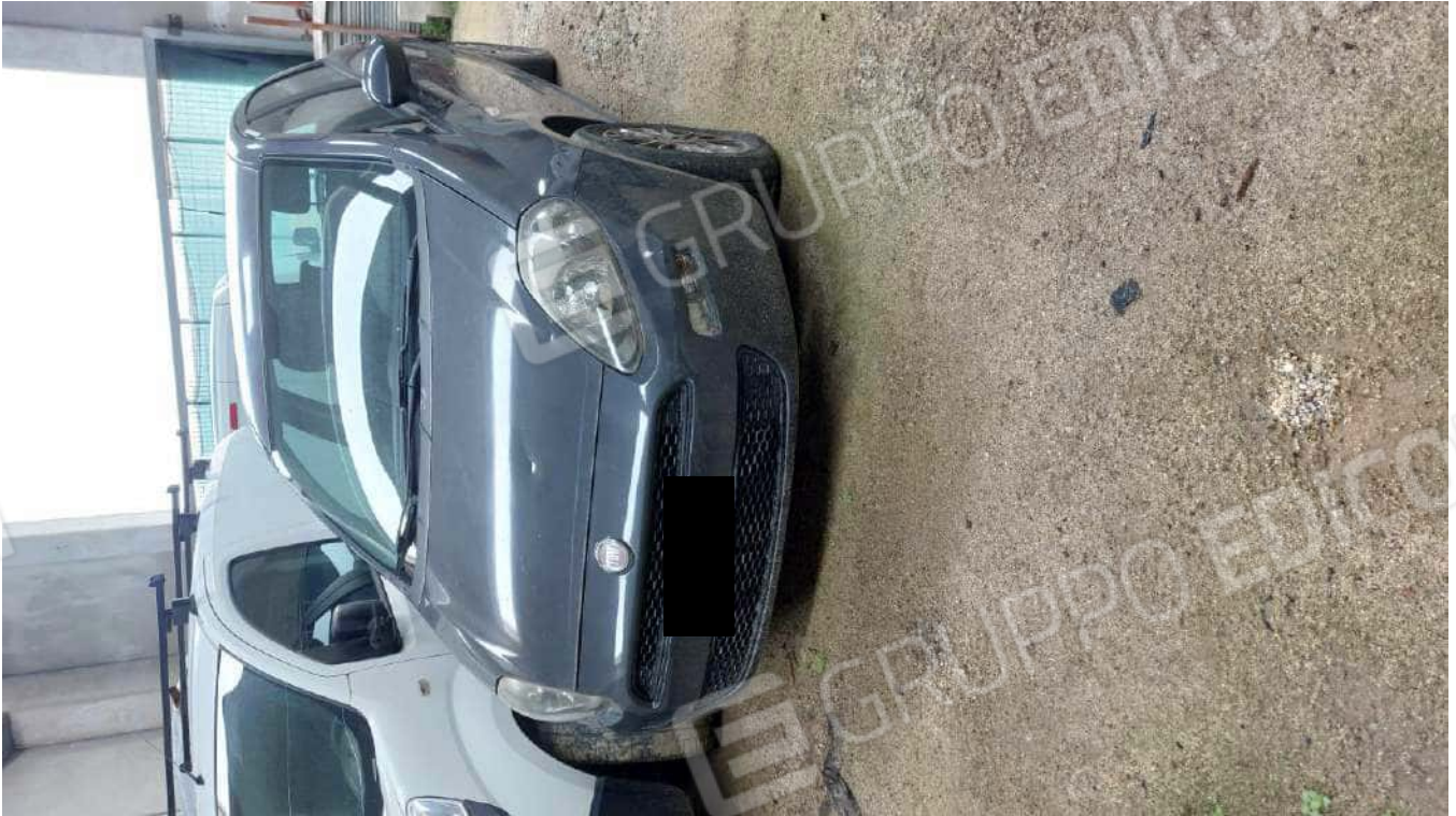
Figura 8, FIAT PUNTO