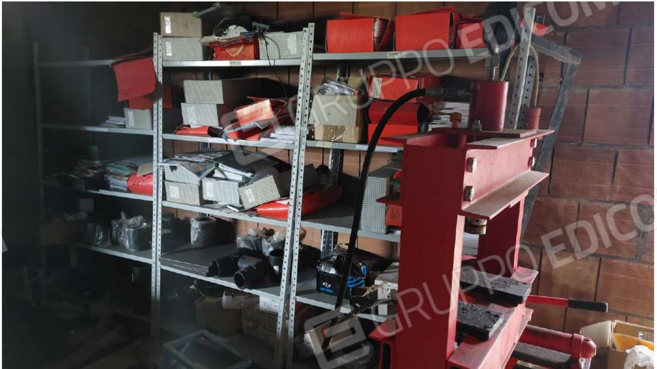
Figura 14, 4 SCAFFALI METALLICI