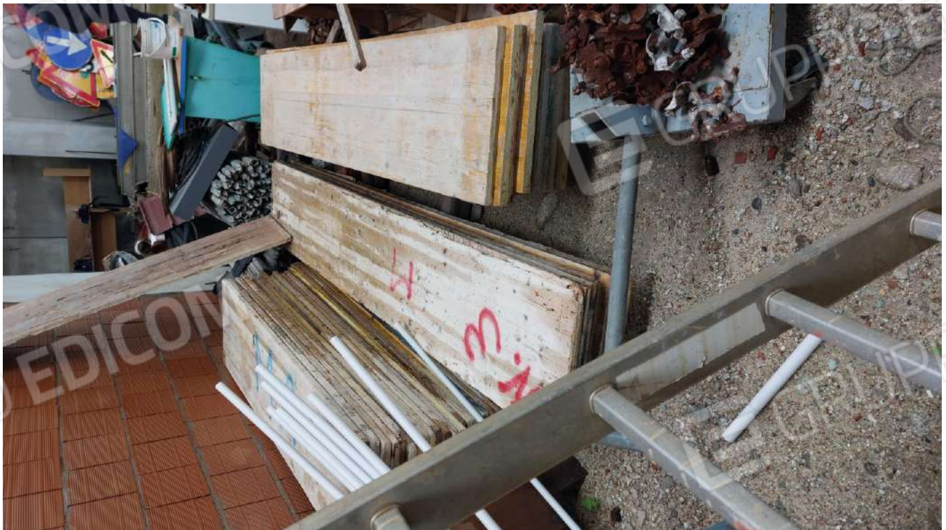
Figura 17, PANNELLI GIALLI