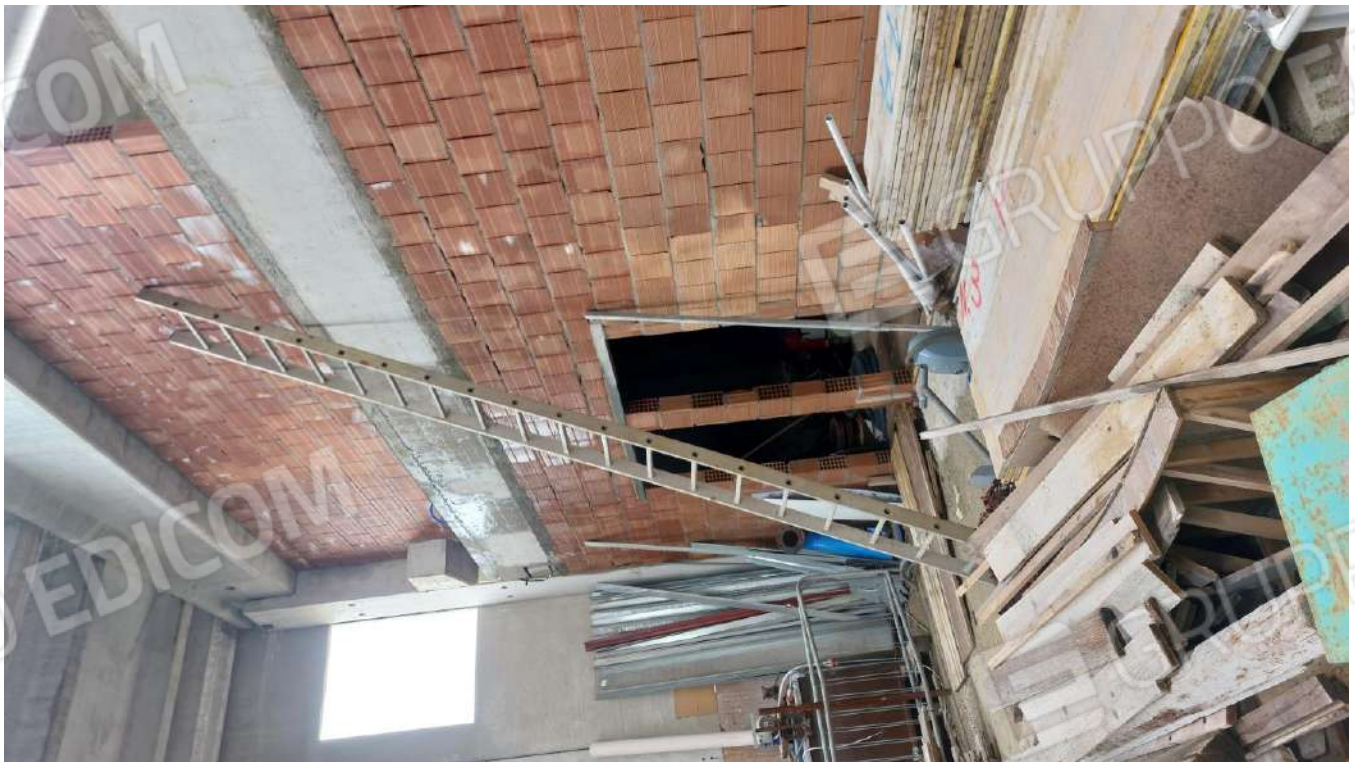
Figura 46, SCALA 5 MT CIRCA