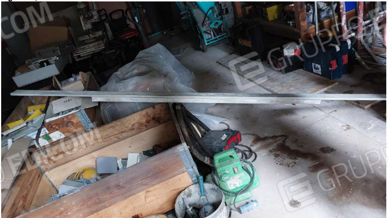
Figura 19, REGOLE PER PARETE