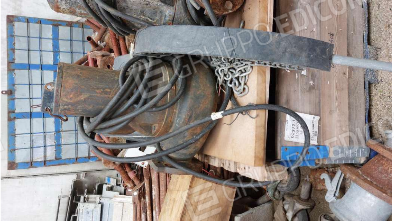
Figura 26 POMPA CAPRARI