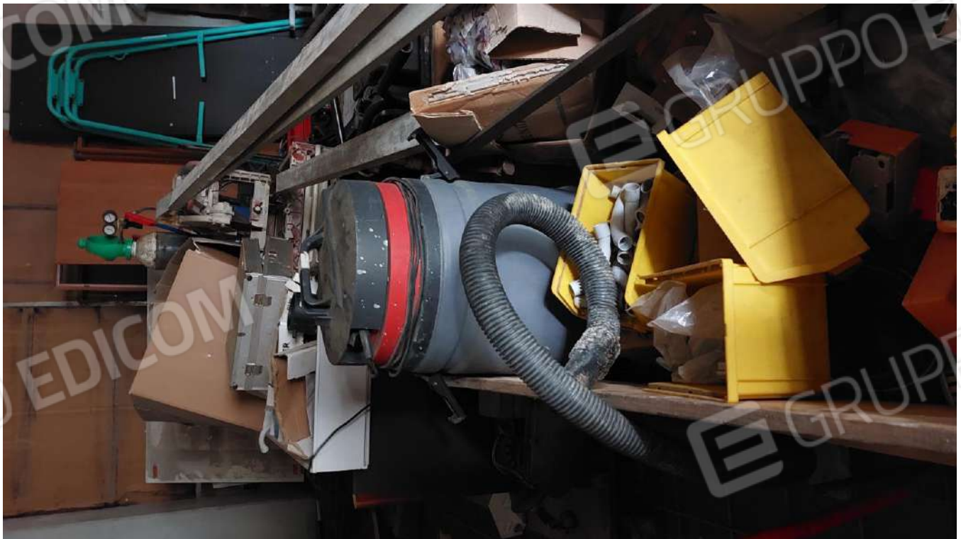
Figura 21, ASPIRAPOLVERE SOLIDI/LIQUIDI