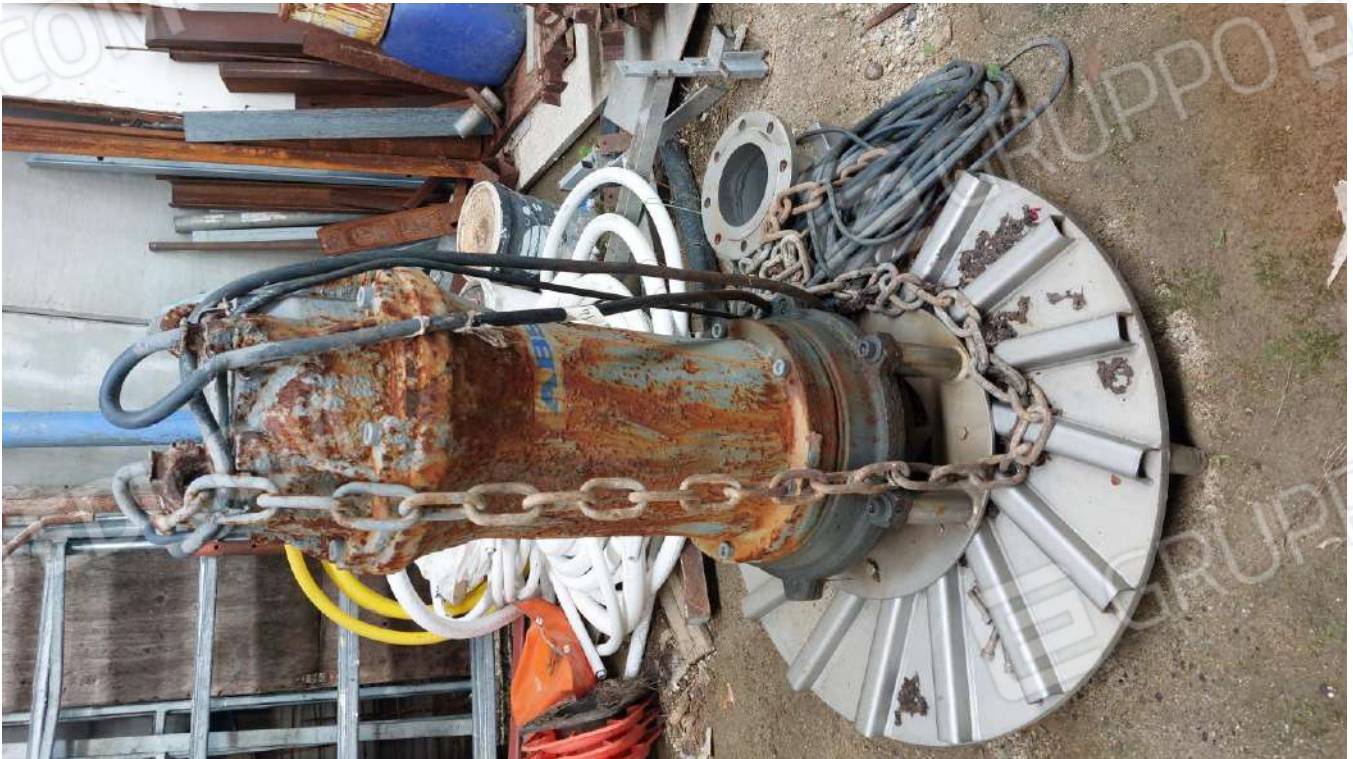
Figura 27 POMPA ABS 30 KW