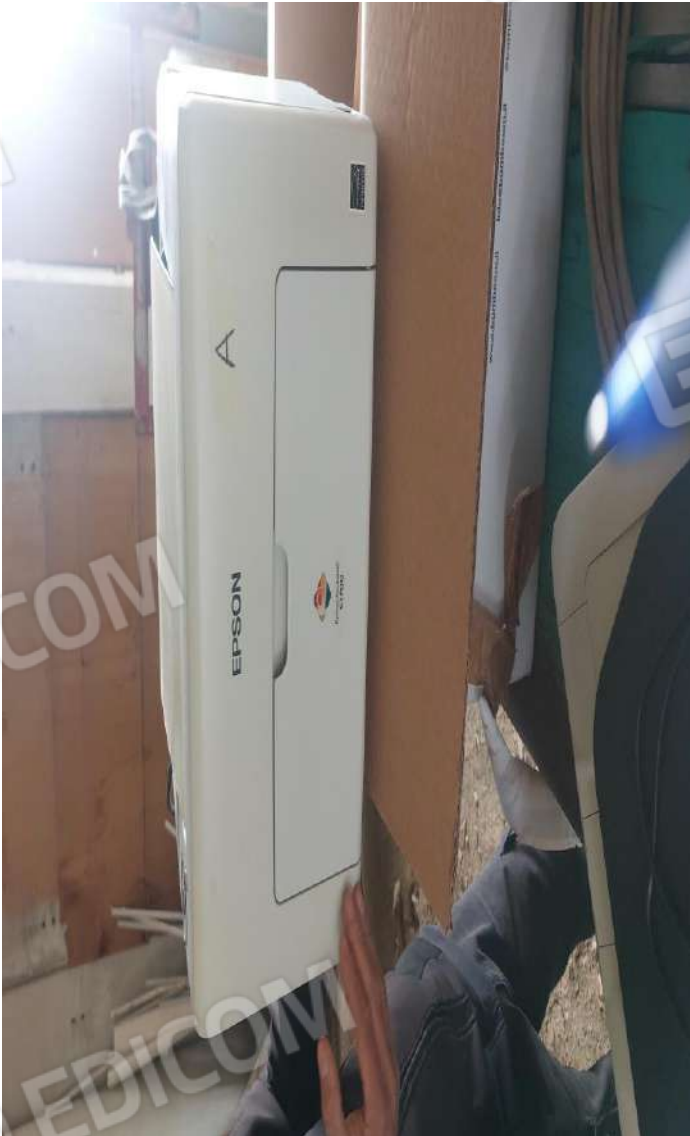
Figura 1 STAMPANTE EPSON C1700