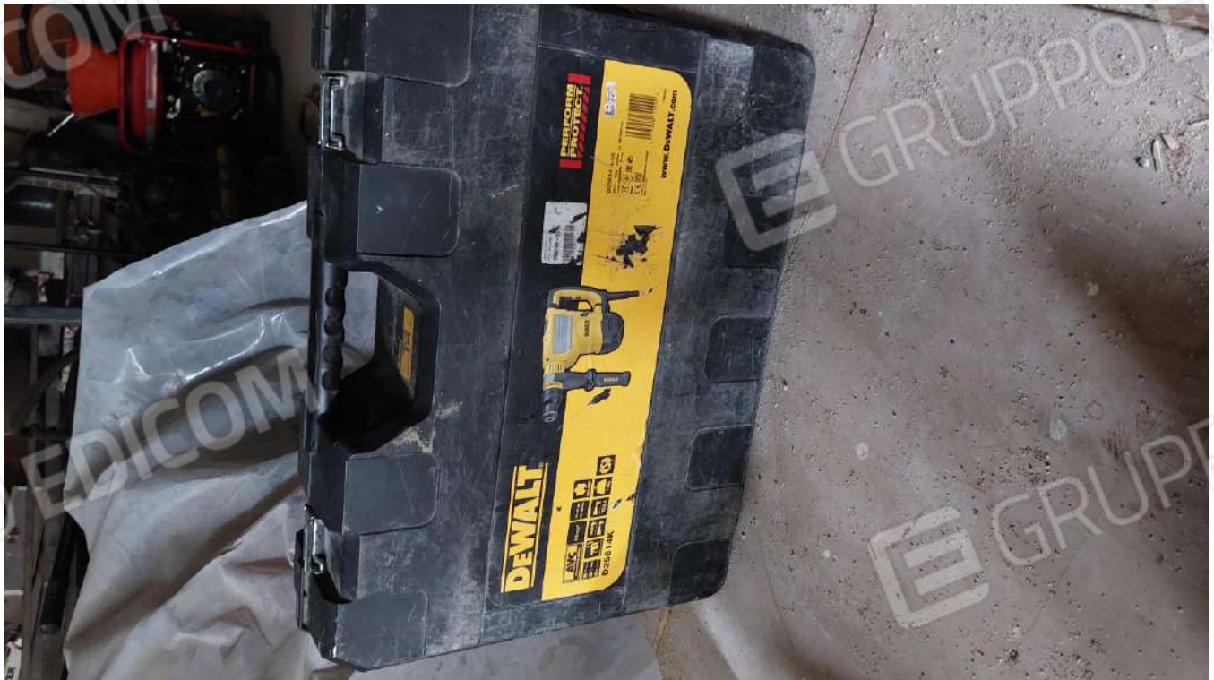
Figura 15, MARTELLO DEMO