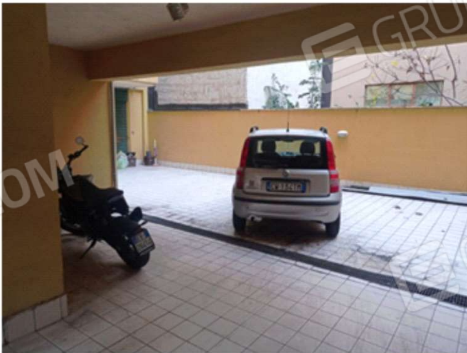
Foto 7. Vista d'insieme del bene pignorato, dove, sul lato sinistro, è presente il parcheggio riservato al motociclo, identificato catastalmente alla part. n°880, sub 6, all'interno della corte del fabbricato