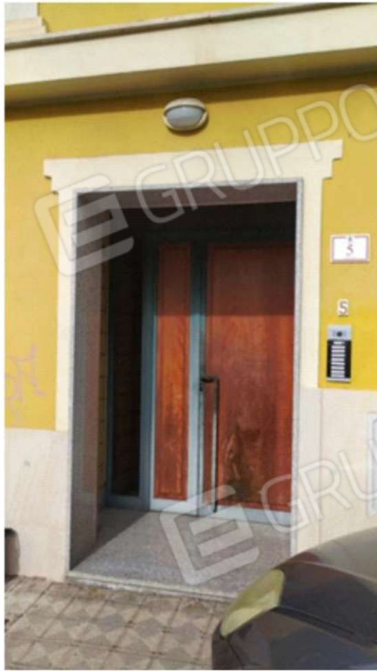
Foto 6. Vista del portone d'ingresso alla scala, che consente l'accesso pedonale ai parcheggi, posti, rispettivamente, al piano terra ed al seminterrato