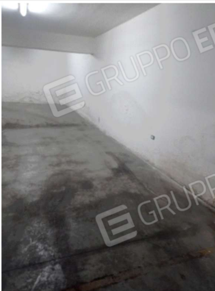
Foto 10. Vista dei parcheggi riservati allo stazionamento di motocicli (part. n°880, sub 25 e 26), posti sul lato destro del piano seminterrato, non delineati visivamente