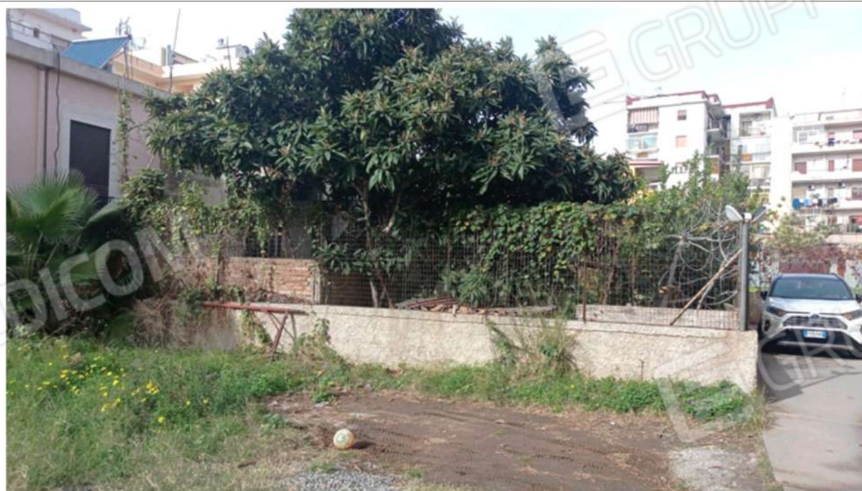
Foto 3. Vista del terreno, oggetto di pignoramento