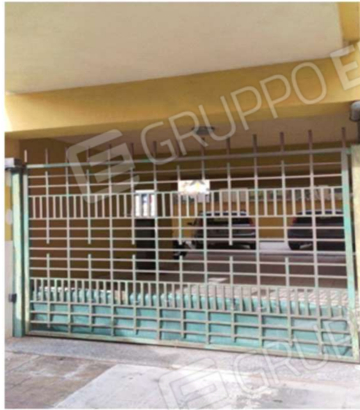
Foto 4. Vista del cancello che consente l'accesso al parcheggio sito all'interno della corte del fabbricato, al piano terra