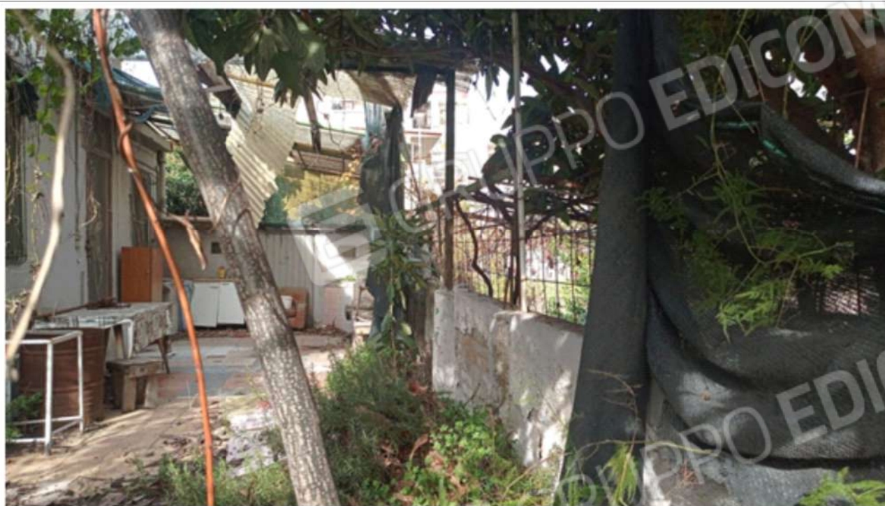
Foto 12. Vista d'insieme del terreno, oggetto di pignoramento, dove si osserva la muratura che ne delimita il perimetro e l'utilizzo come corte annessa al fabbricato adiacente, insistente su particella diversa dal bene in questione, oggetto di pignoramento