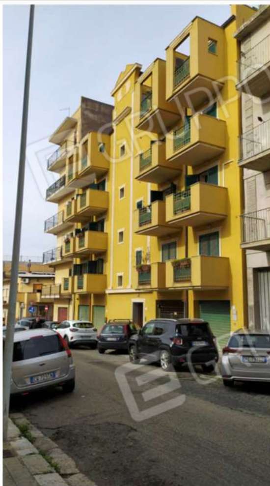
Foto 2. Vista del fabbricato dove, all'interno della corte, posta al piano terra, ed al piano seminterrato, sono presenti i parcheggi per motocicli, oggetto di pignoramento