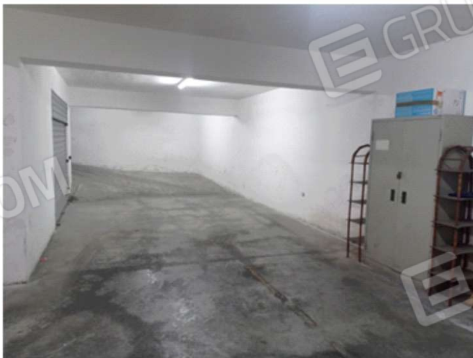
Foto 9. Vista d'insieme del bene pignorato, dove, sul lato destro, sono presenti i parcheggi riservati allo stazionamento di motocicli (part. n°880, sub 25 e 26), all'interno del seminterrato