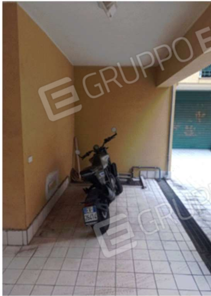
Foto 8. Particolare del parcheggio motociclo, oggetto di pignoramento, identificato catastalmente alla part. n°880, sub 6