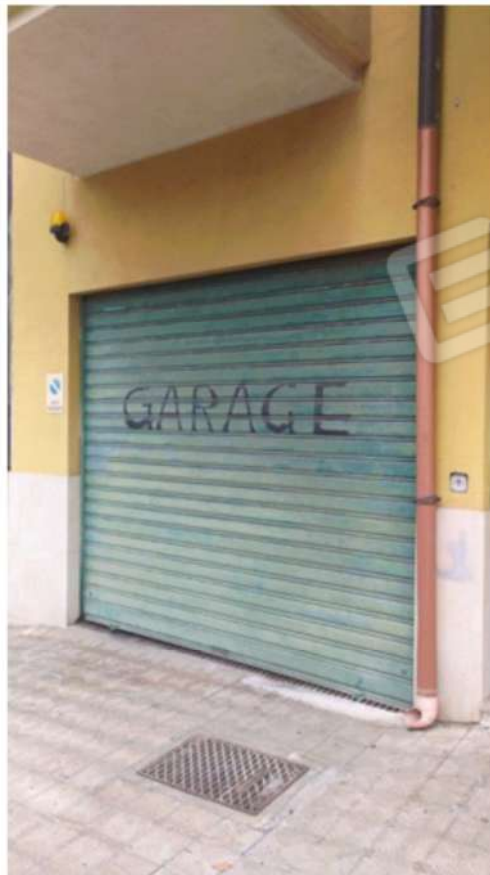
Foto 5. Vista della serranda, con comando a distanza, che consente l'accesso al parcheggio, sito al piano seminterrato del fabbricato