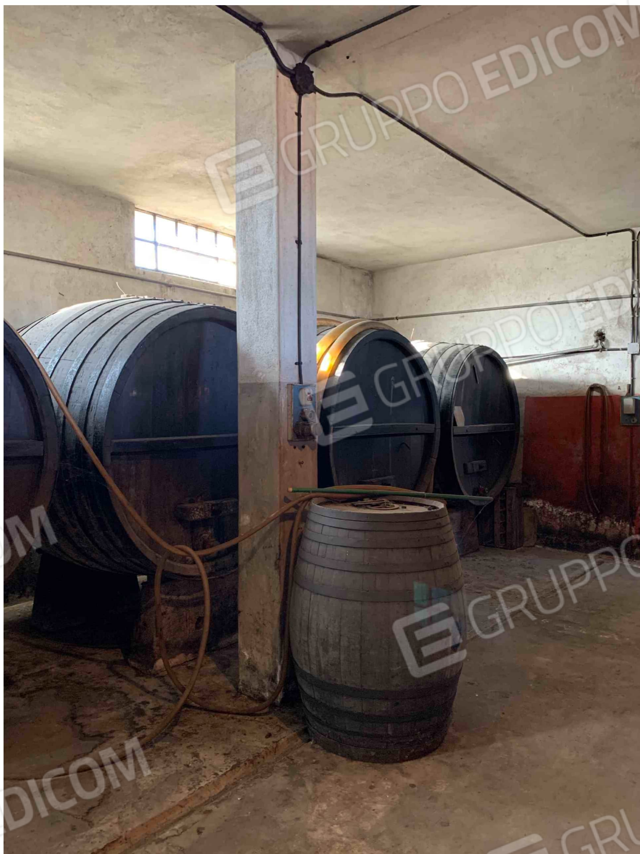
Vista del seminterrato (fotografia del 11.02.2020)