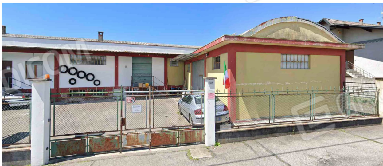
Corso Vercelli n. 332 -Gattinara