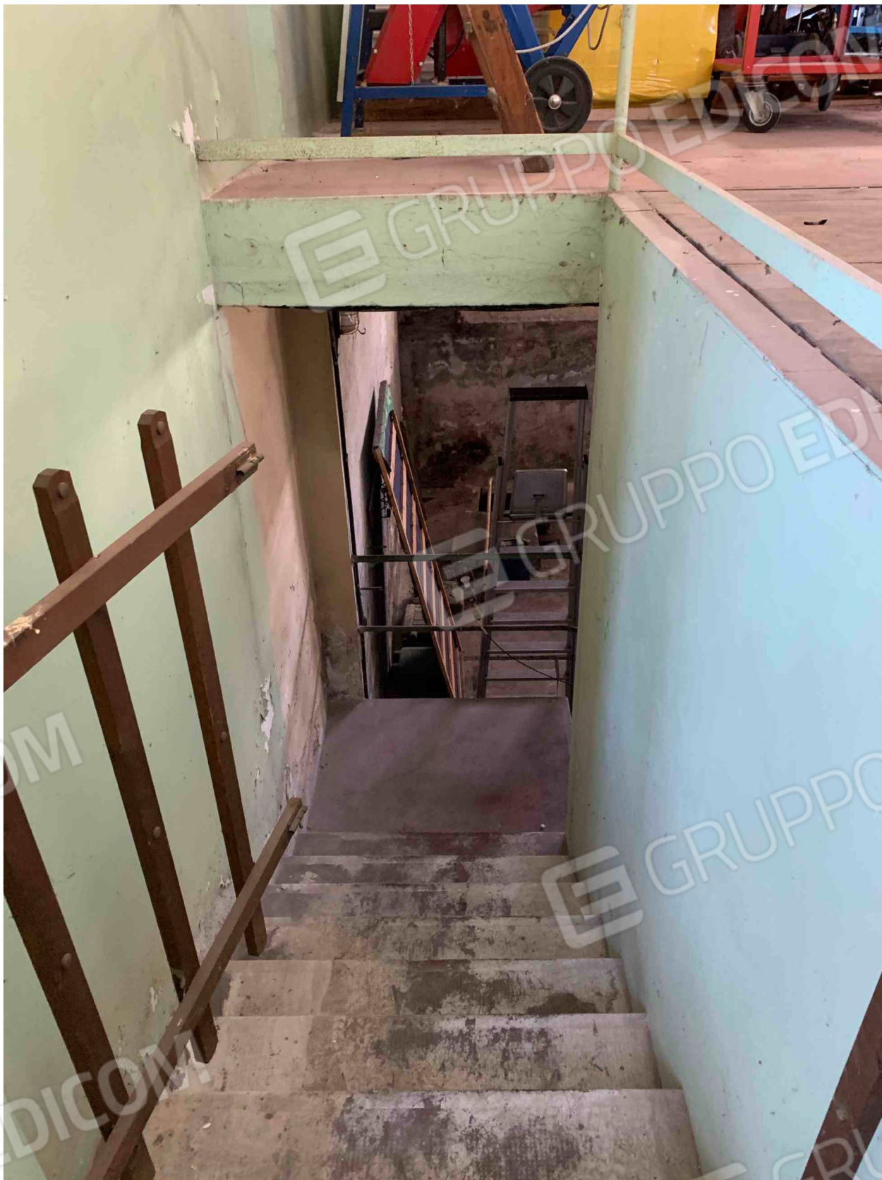
La scala di accesso al piano seminterrato (fotografia del 11.02.2020)