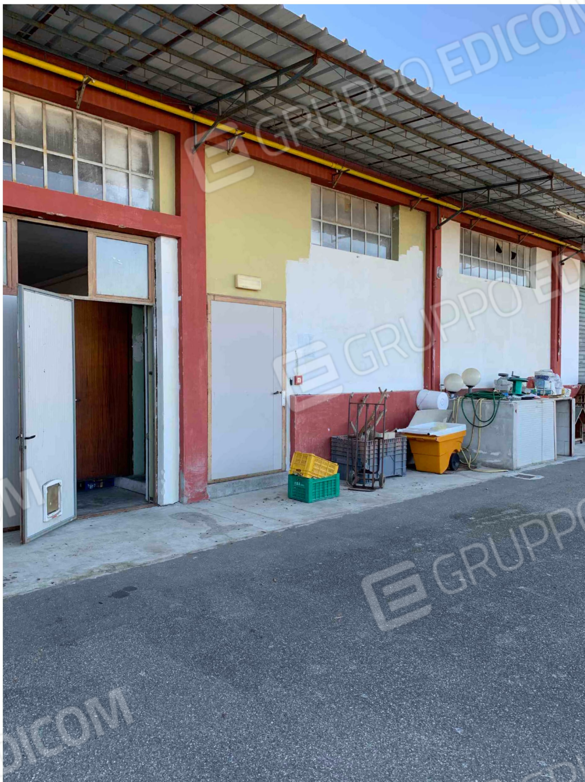
Ingresso alla scala di accesso da cortile comune ad altra proprietà (fotografia del 11.02.2020)