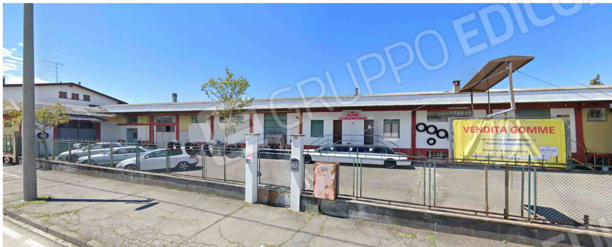
Corso Vercelli n. 334 -Gattinara

Rilievo Fotografico dei tre immobili (Aggiornamento 11.02.2020)