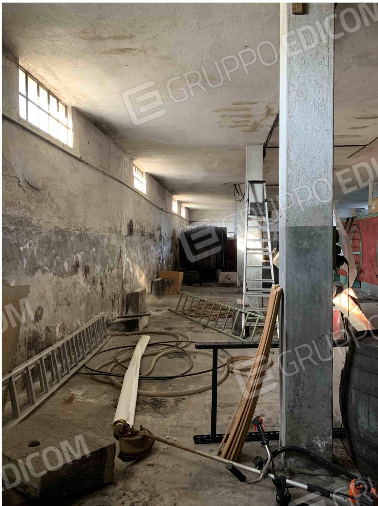
Vista del seminterrato (fotografia del 11.02.2020)