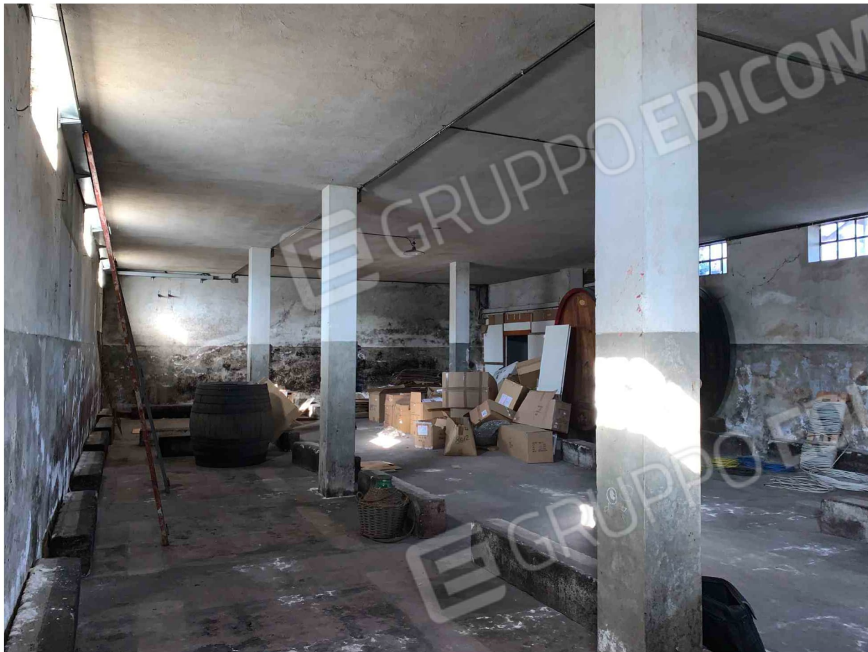
Vista del seminterrato (fotografia del 11.02.2020)