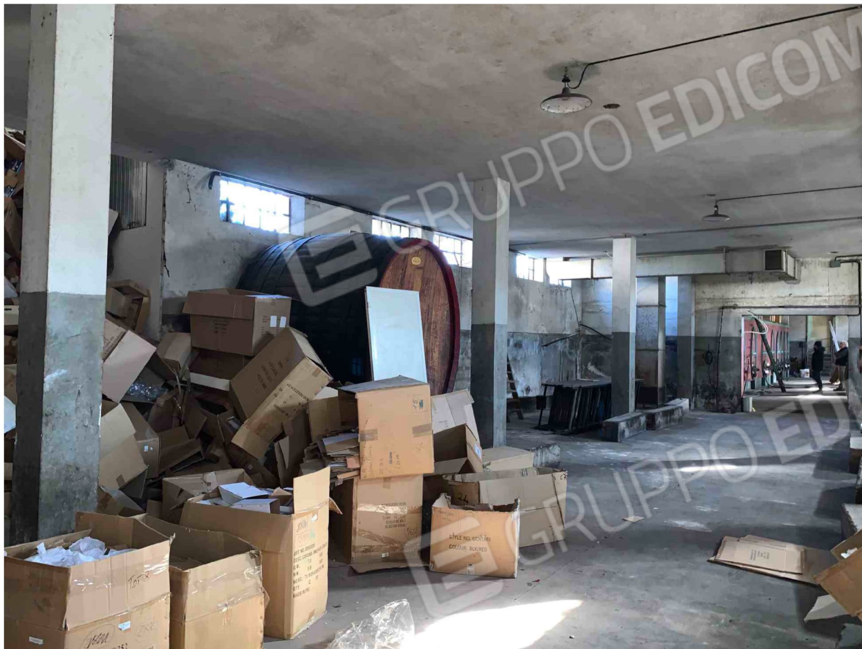
Vista del seminterrato (fotografia del 11.02.2020)