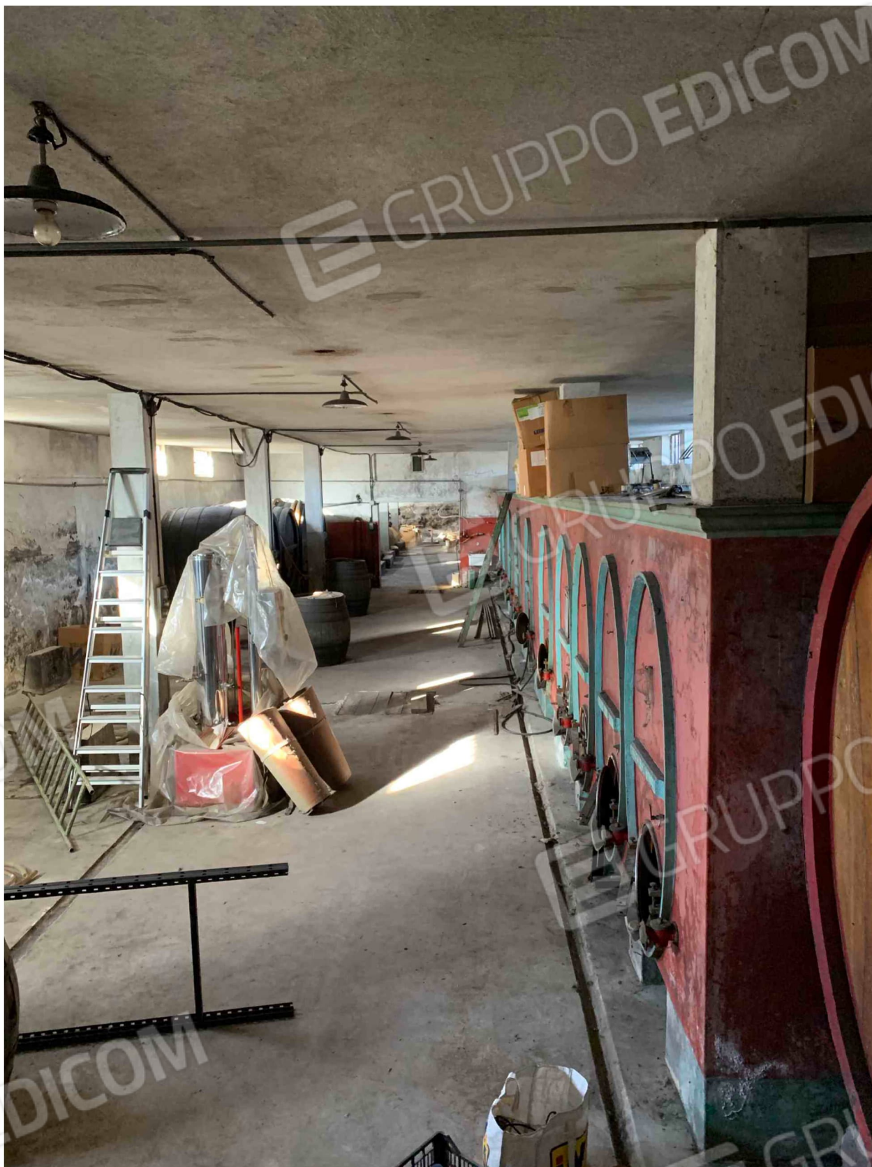
Vista del seminterrato - a destra le botti in muratura (fotografia del 11.02.2020)