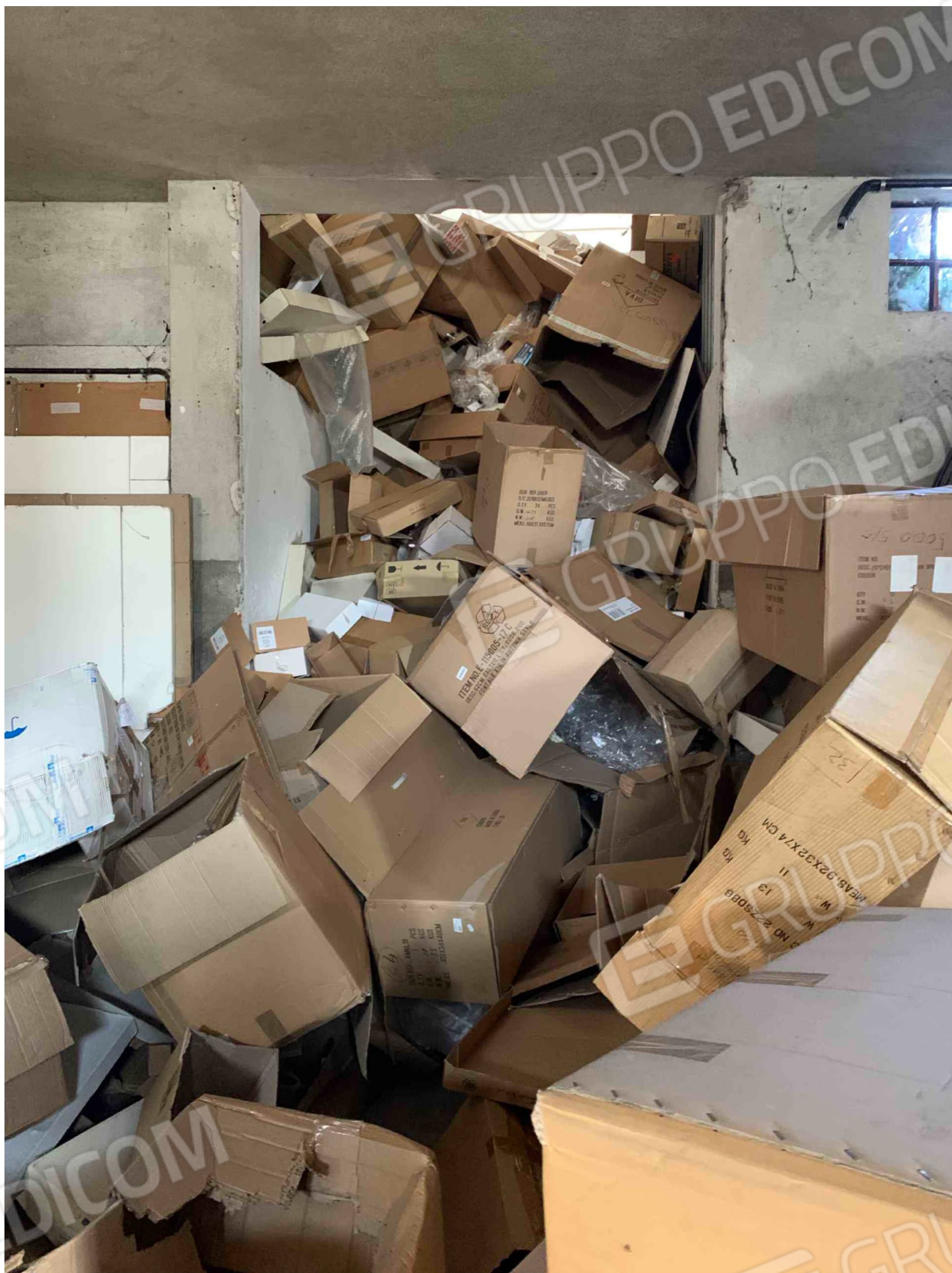
Altro accesso-uscita dal seminterrato inaccessibile, ma sfociante all'interno della proprietà del piano superiore (fotografia del 11.02.2020)