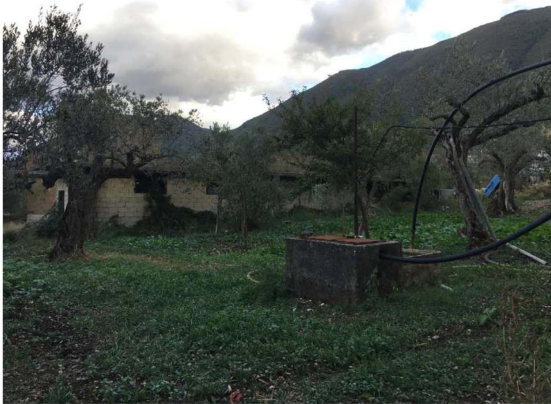
1_veduta generale fronte nord ovest 2_dettaglio fronte principale su via Bebiana e fronte ovest