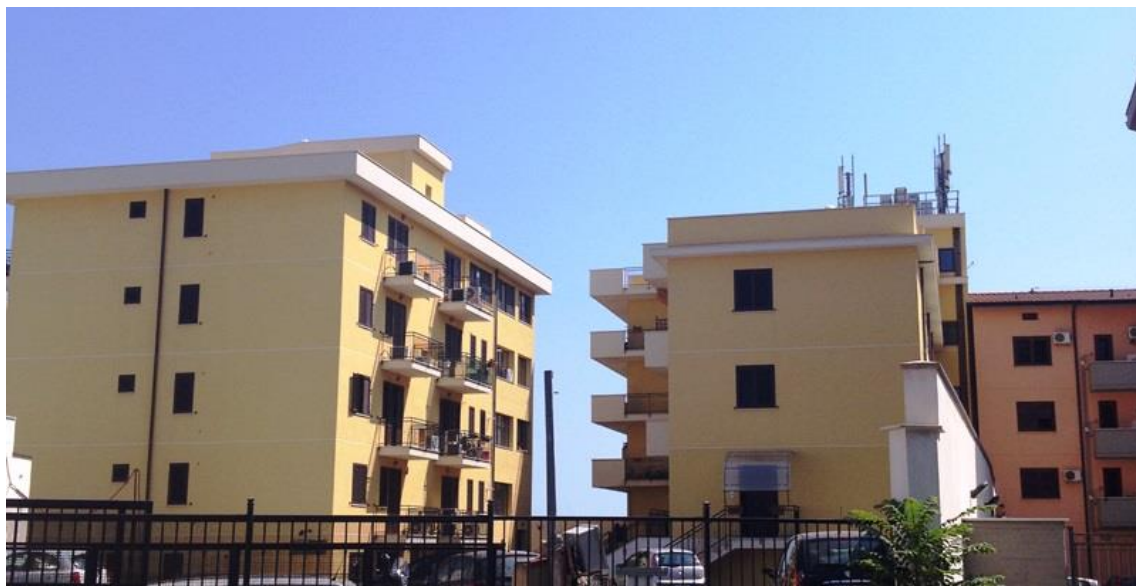
Foto n. 3 Il lotto in oggetto si trova sulla copertura dell'edificio di sinistra