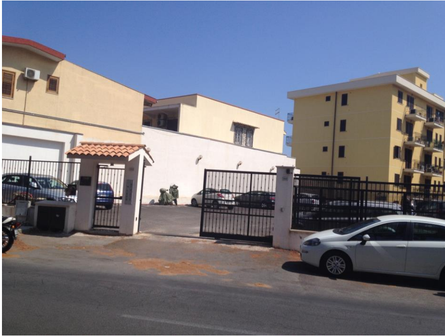
Foto n. 2 - Ingresso da Viale Della Regione Siciliana all'altezza del civico 2058-2060.