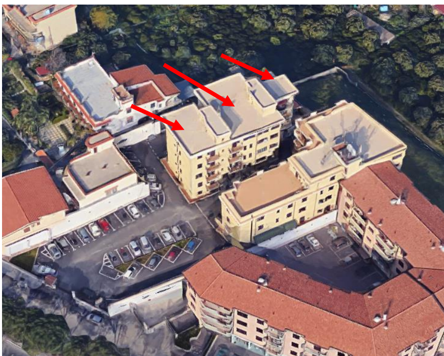
Foto n. 1 – Vista aerea - 3D del complesso residenziale di Viale Della Regione Siciliana civ. 2058-2060